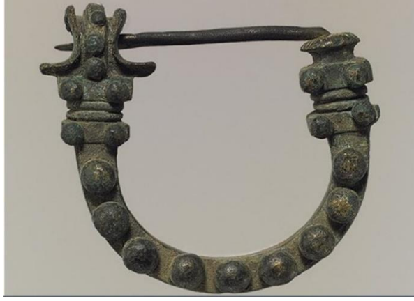
Resim 2. Fibula İğnesi 44

Bunun yanında, peplum ise vücudun en dışına sarılan örtülerden biridir. Bu kostümü kadınlar da erkekler de kullanmışlardır. Çoğunlukla dinsel seremonilerde veya toplumsal olaylarda kullanılmıştır. Uzun ve geniş olanlar vücuda iki defa dolanır ve diplaks adını almışlardır. Yağmurlu ve soğuk havalarda başın üzerine çekilmektedir. Diğer zamanlarda başın üzerine çekilmesi mütevazilik veya keder göstergesidir. Yas tutarken veya dini törenlerde bu şekilde kullanılmaktadır. 45