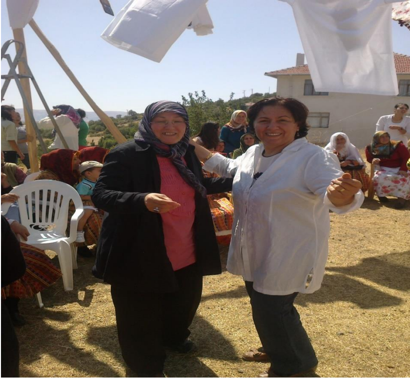
Fotoğraf 22: geri dönüş göçü yapan iki kadının bu etkinliğe katılımları.