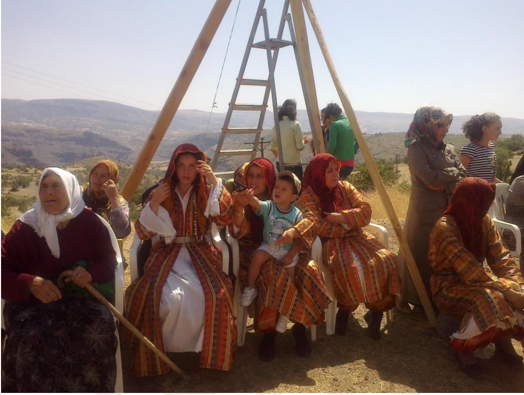
Fotoğraf 21: Köyden evlenen bir kadının çeyiz sergisini izlemeye gelmiş ve köyün geleneksel kıyafetlerini giymiş köy kadınları.