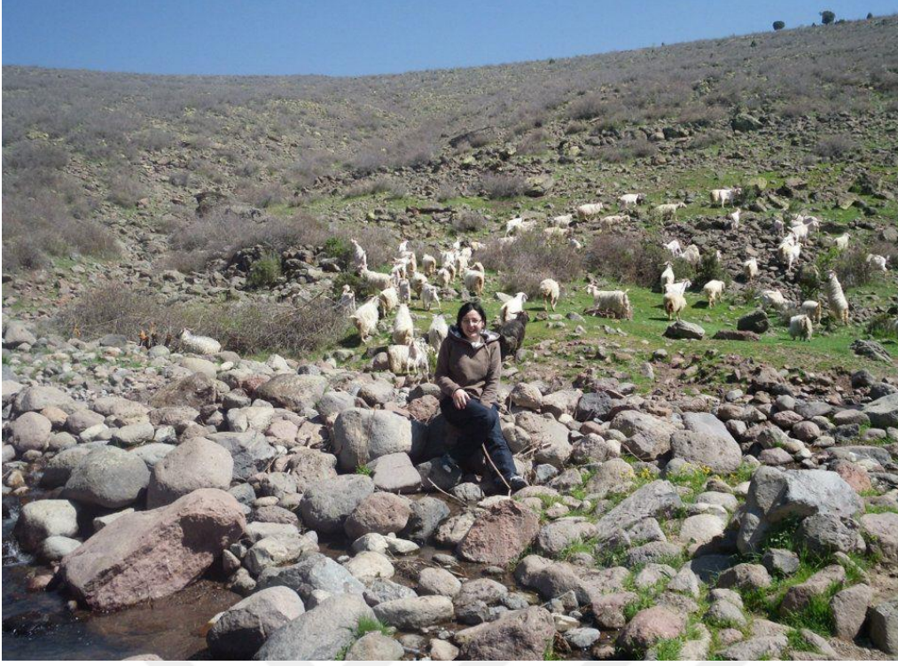
Fotoğraf 9: Köyün kara çalı dedikleri bölgede yayılan küçükbaş hayvanlar.