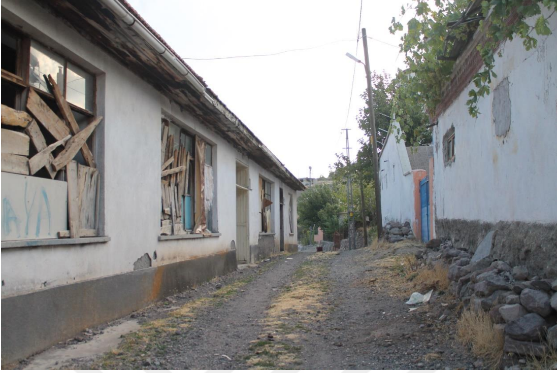
Fotoğraf 5: Yine Hüseyin Avni Girgin tarafından yaptırılmış olan köy okulu ile dikiş nakış kursunun son görünümü.