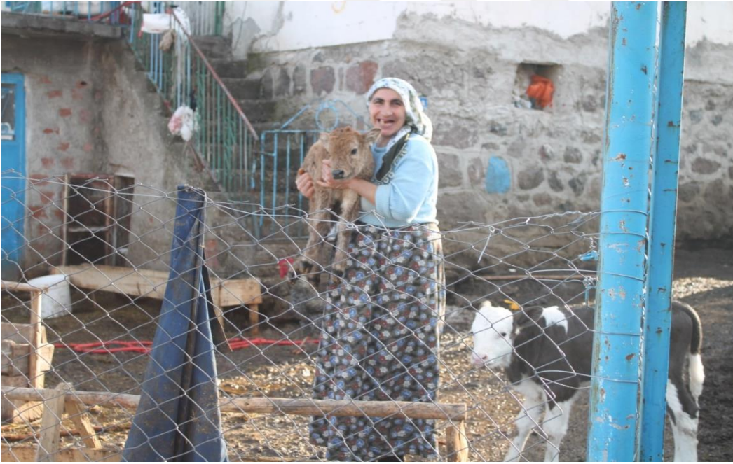
Fotoğraf 12: Yeni doğan buzağının sevincini paylaşan bir köy kadını.