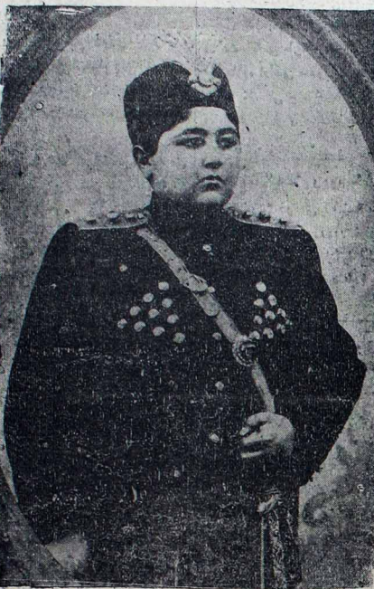
مراسم توجیهیہ اجرا قتلان ایران شاهی