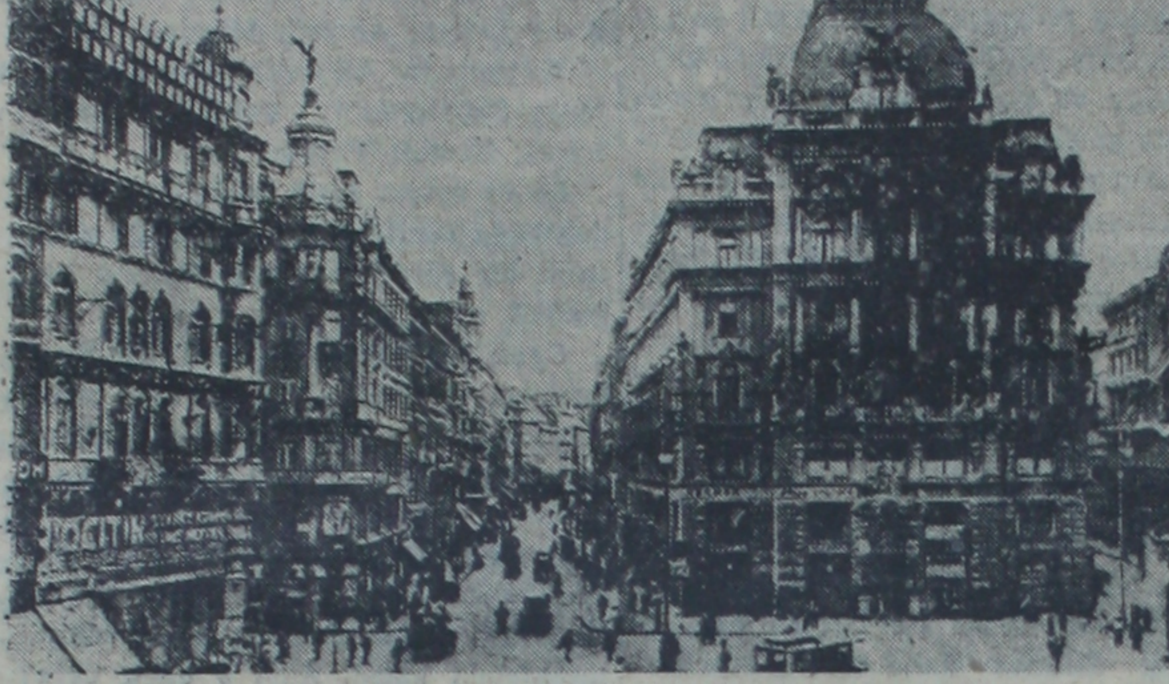
Rusların giriş ve çıkışı kontrole başladıkları Viyana şehrinde bir manzara

Bu karar bilhassa İngilizleri müşkül mevkie sokmuştur; zira Amerika-