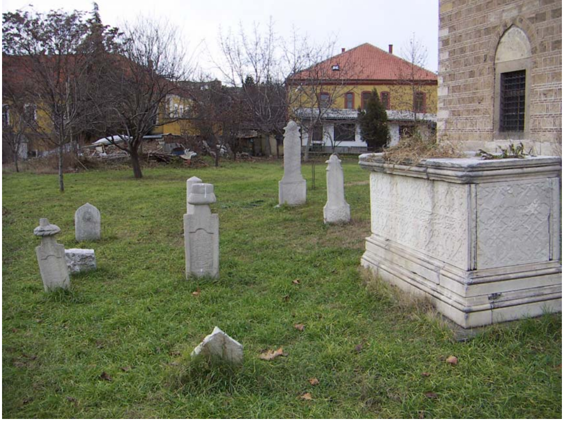
Osmanlı mezarlıkları, Mustafa Paşa Camii-Üsküp