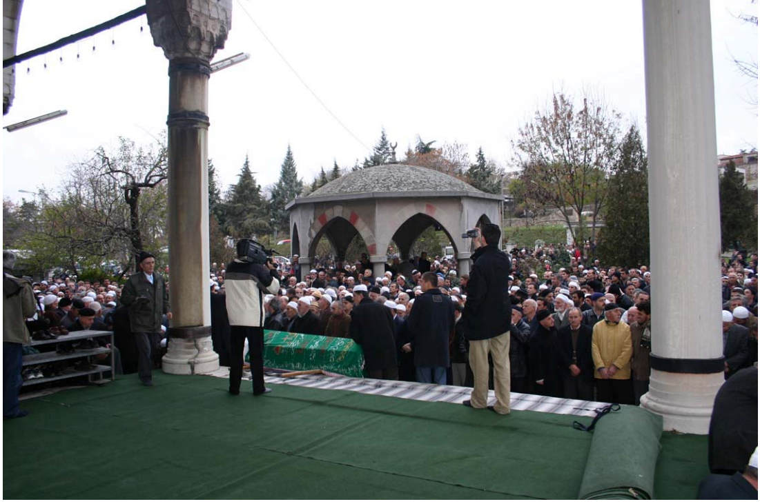
Cenaze namazının kılınışı