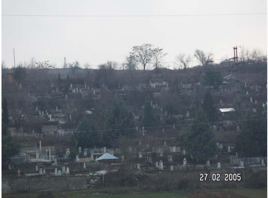
Üsküp-Draçevo köyü Hristiyan Mezarlıkları