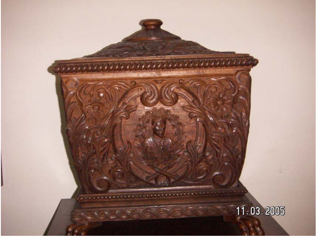
Makedon Milli kahramanın naşının Bulgaristan'dan Üsküp'e getirildiği sanduka.