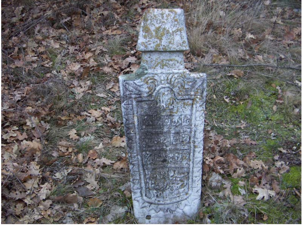
Mezar taşı örnekleri, Luboten-Üsküp.