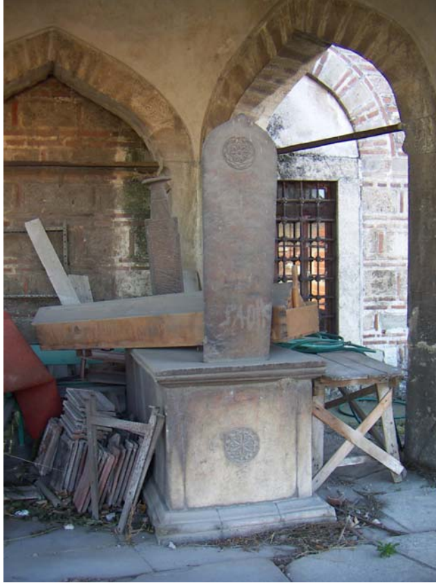
Selefî taraftarlarınca tahrip edilen Türbe, Sultan Murat Camii-Üsküp.