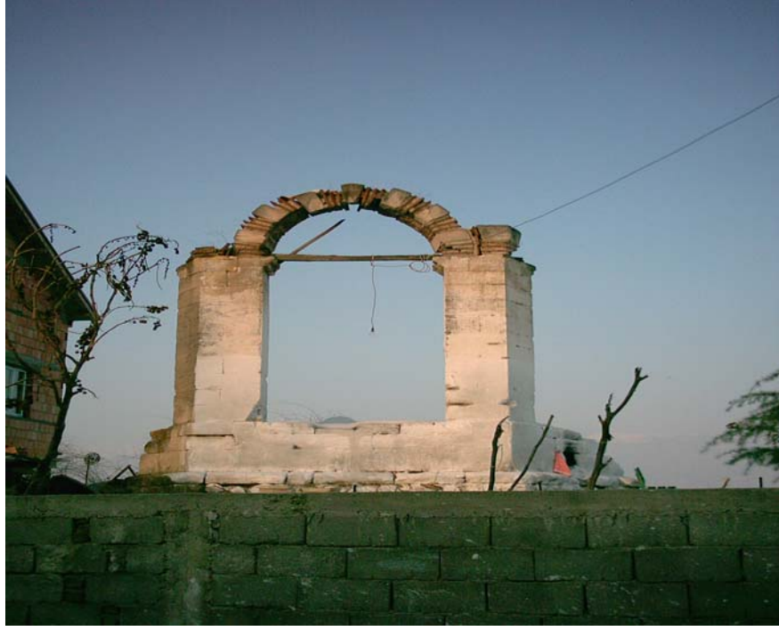
Müslüman ve Hıristiyanlarca ziyaret edilen Altı Ayak Baba Türbesi, Üsküp.