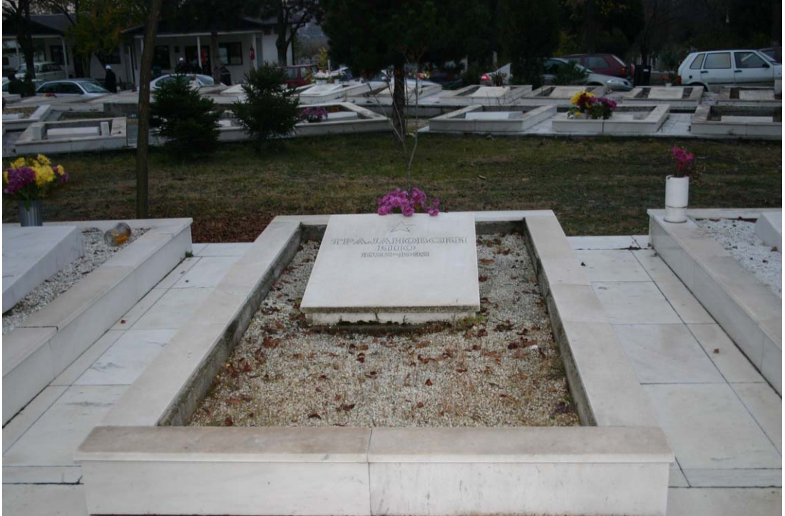
Mezar taşı örnekleri, Butel-Üsküp.