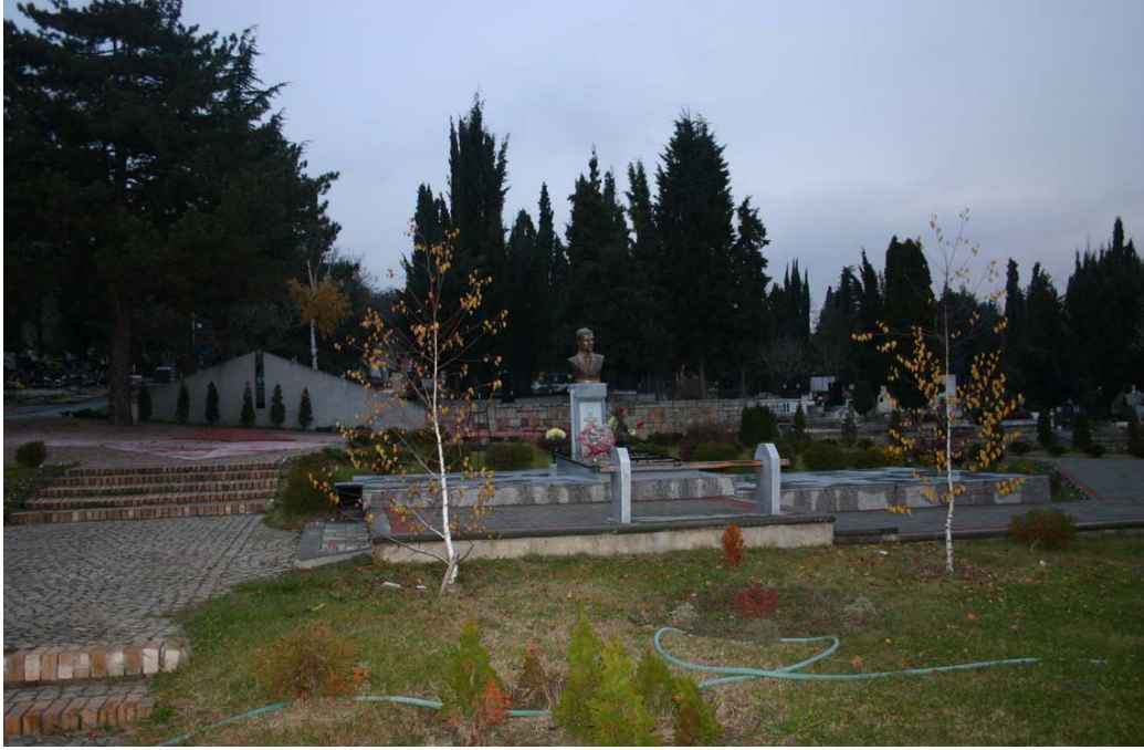
Protestan olan Cumhurbaşkanın Mezarı, Üsküp Şehir Mezarlığı "Butel"