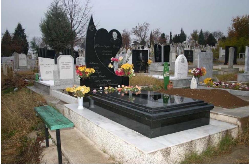
Üsküp Şehir Mezarlığı "Butel"-Müslüman Bölümü