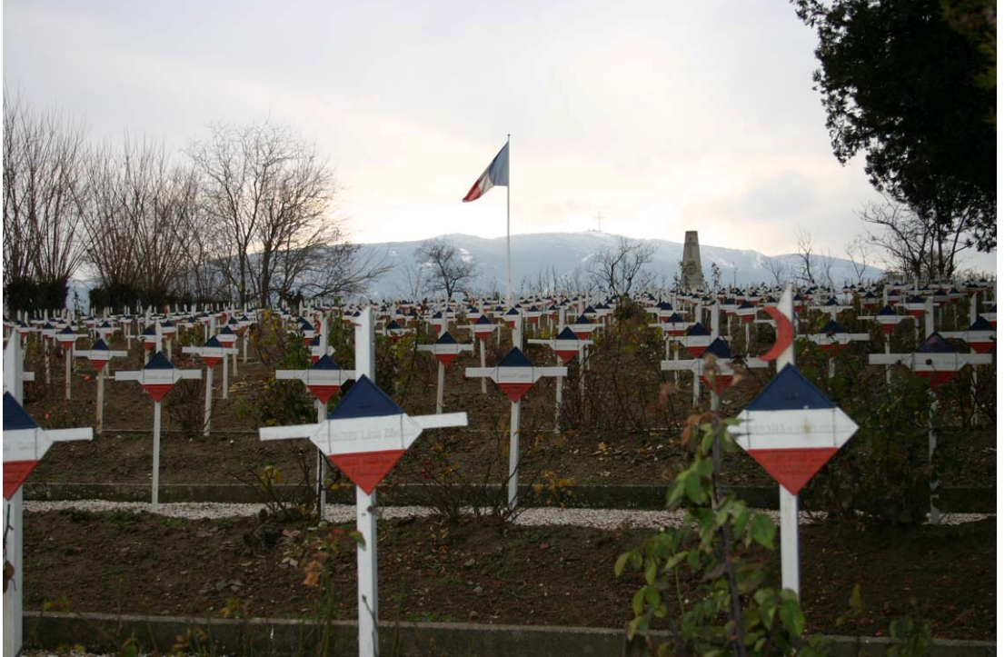
Fransız Askeri Mezarlıklar - Üsküp