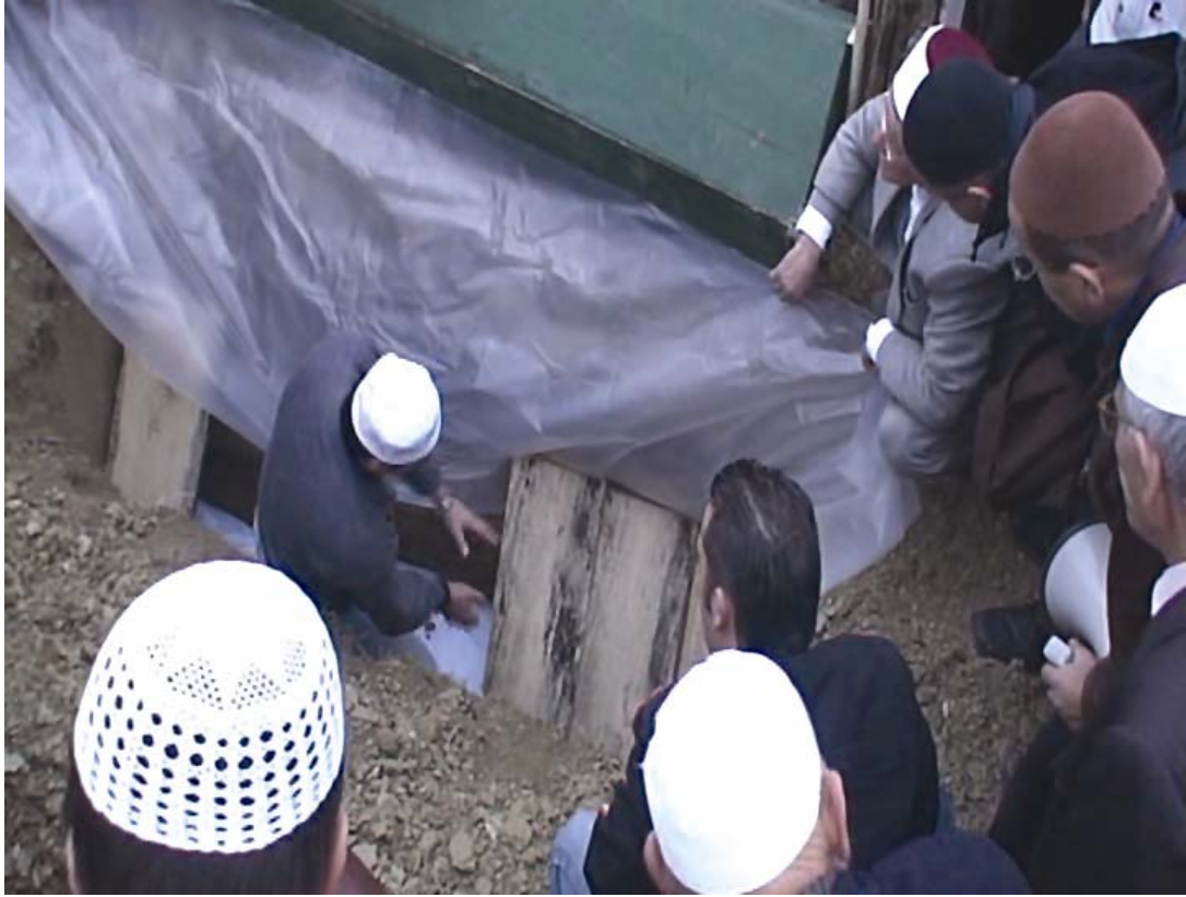
Müslümanlarda mezar şekli