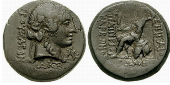
Sikke: BITHYNIA, Prusa ad Olympum. C. Papirius Carbo, Proconsul. M.Ö. 59-58. 694

Prusa'da Pompeius'un düzenlemelerinden sonraki yapısal değişiklikler sonucunda boule (şehir meclisi) kalıcı hale gelmiştir. 695 Daha sonra imparator Traianus kentin boule 'sine 100'ün üzerinde yeni üye alınmasını sağlayan bir kararname yayınlamıştır. 696 Roma döneminde kent sikke basma hakkına sahip olmuştur. Bu dönemde basılan sikkeler bronzdandır ve Bithynia proconsul 'u Carbo tarafından M.Ö. 61-59 yılında basılmaya başlanmıştır.(Bkz. üstteki sikke). Bir dönem ara verilen sikke basımına imparator Nero döneminde (M.S. 54-68) yeniden başlanmıştır. 697 Caracalla (M.S. 211-217) ve Gallienus (253-268) döneminde de Prusa kenti sikke basmaya devam etmiştir. 698