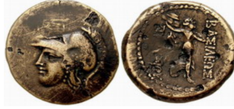
Prusa kentinin kurucusu Bithynia kralı Prusias I'a ait sikke. Sağda miğferli Athena başı, solda zafer tanrıçası Nike. 689

Prusa'nın ilk halkı Strabon'a göre Thrakia kökenli kavimlerdir: “ Olympos dağının kuzey dolayları Bithynler, Mygdonlar ve Dolionlar tarafından iskan edilmiştir. ” 690 Strabon'un belirttiği bu yer yaklaşık olarak bugünkü Prusa'nın kurulduğu yerdir. Öte yandan Bithynia'nın diğer Grek kökenli kentlerinde olduğu gibi daha sonra Bithynia kralları tarafından kurulan Prusa'nın politik hayatına da “ polis ” sistemi hakim olmuştur. 691