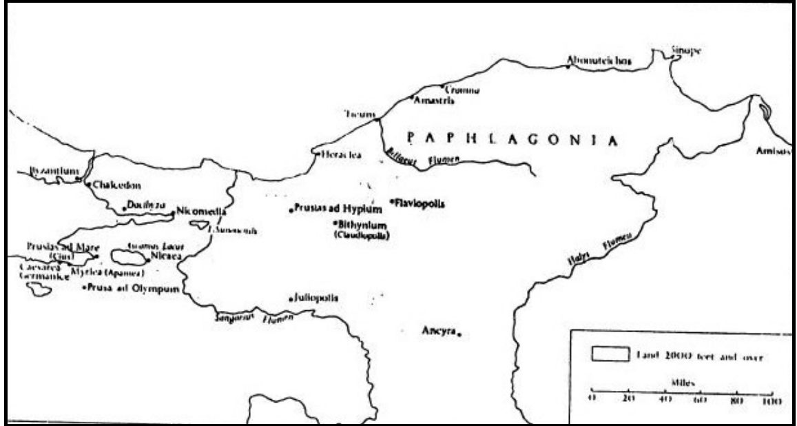
Harita 1: Civitates Provinciae Bithyniae

farklı statüye sahipti. 527 Gerek politik gerekse vatandaşlarına sunduğu haklar bakımından eyalet geri kalanıyla tamamıyla farklı bir niteliğe sahipti. 528