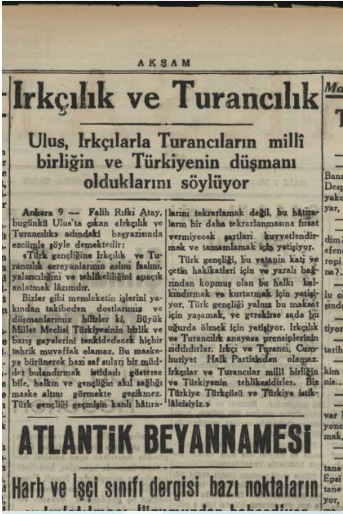
Irkcılık ve Turancılık: Akşam Gazetesi 9 Mayıs 1944