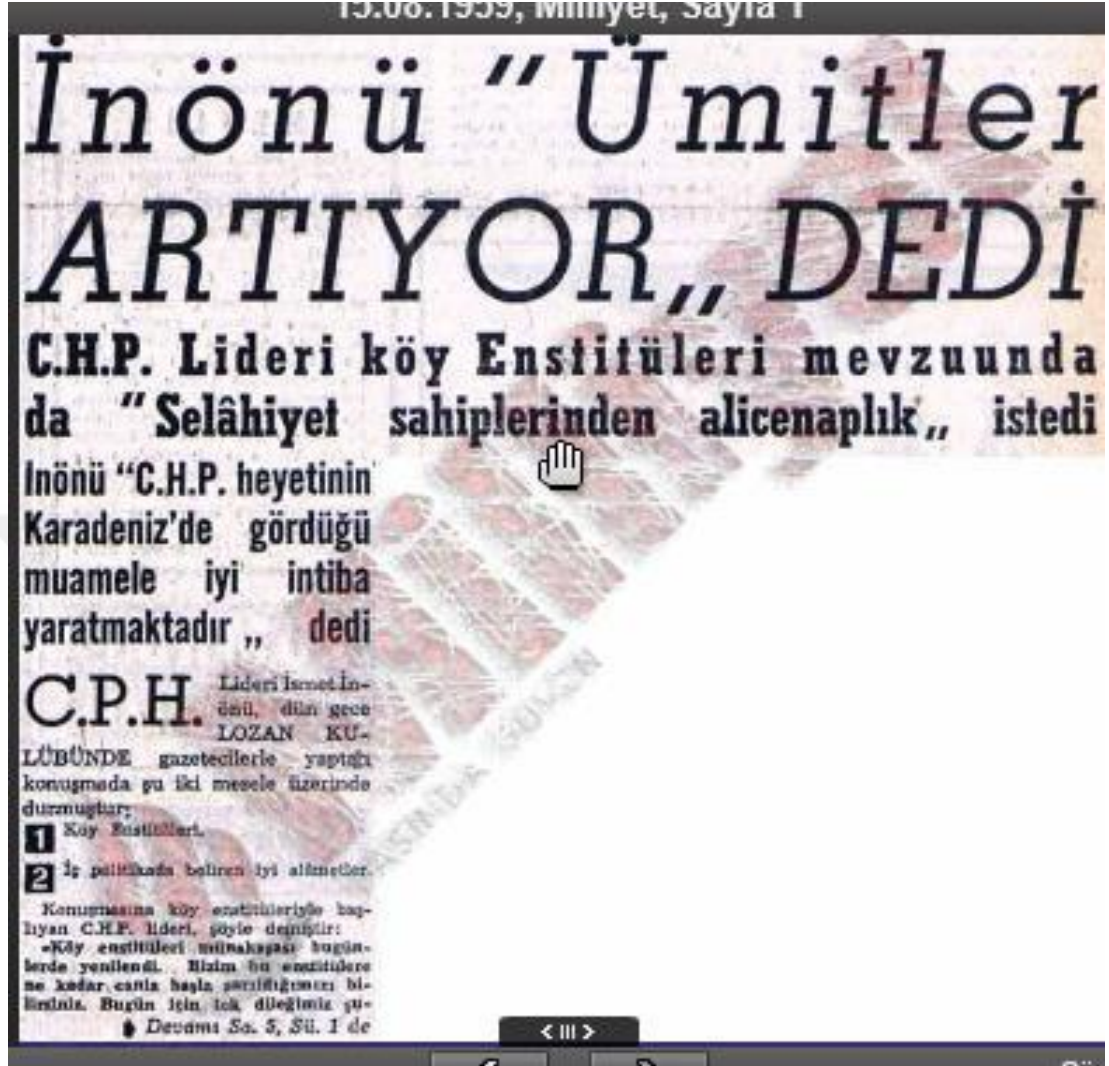
İnönü, "Ümitler Artıyor, Dedi" Milliyet, 15.08.1959