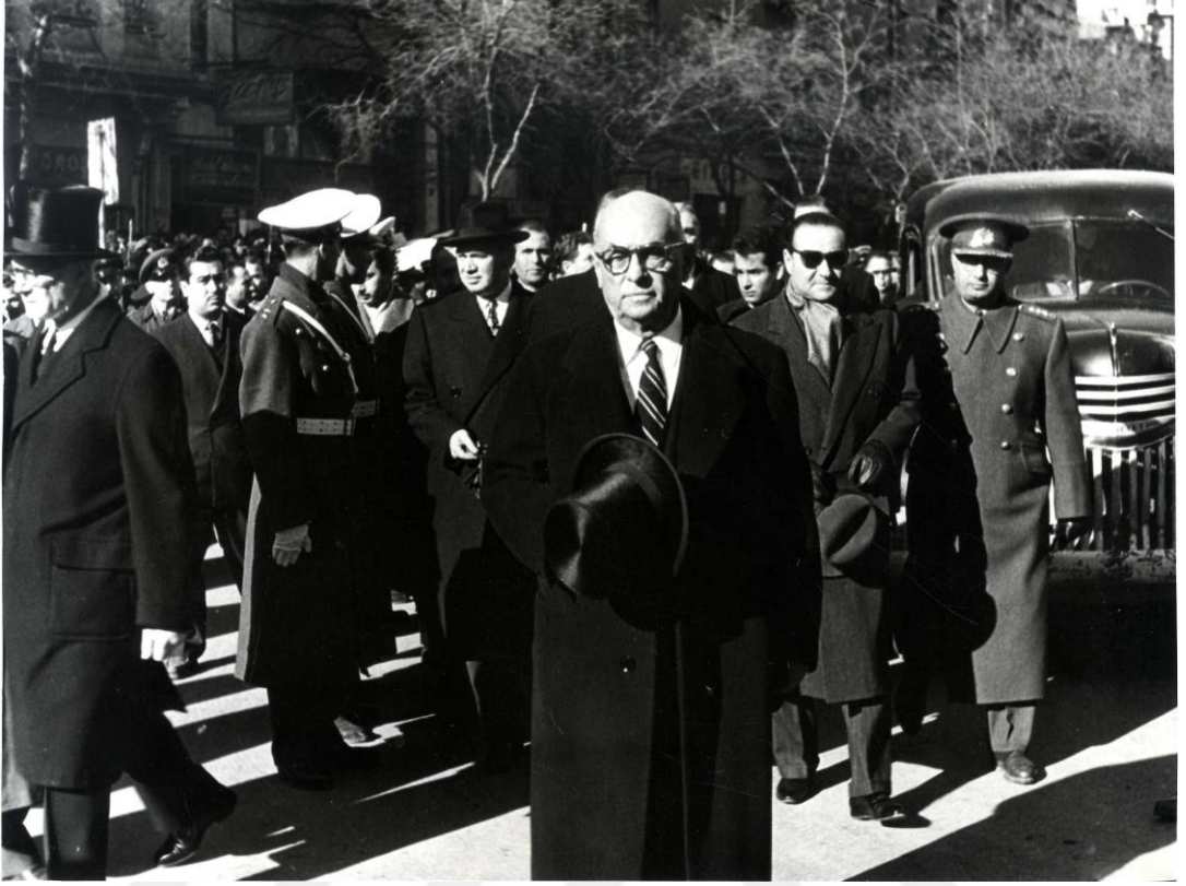
Cumhurbaşkanı Celal Bayar ile Başbakan Adnan Menderes bir devlet töreninde. Ankara Üniversitesi Türk İnkılap Tarihi Enstitüsü Arşivi; Kutu: 36, Gömlek: 88, Belge No: 88001