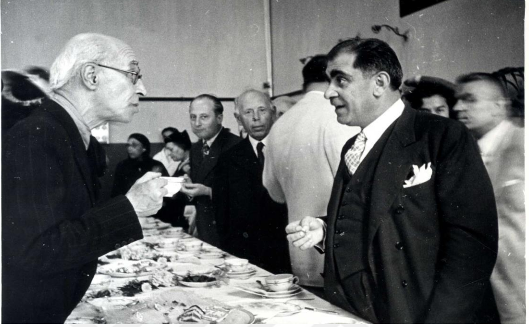
Maarif Vekili Hasan Ali Yücel emekliye ayrılan öğretmenlerin çayında. Ankara Üniversitesi Türk İnkılap Tarihi Enstitüsü Arşivi; Kutu: 23, Gömlek: 43, Belge No: 43001