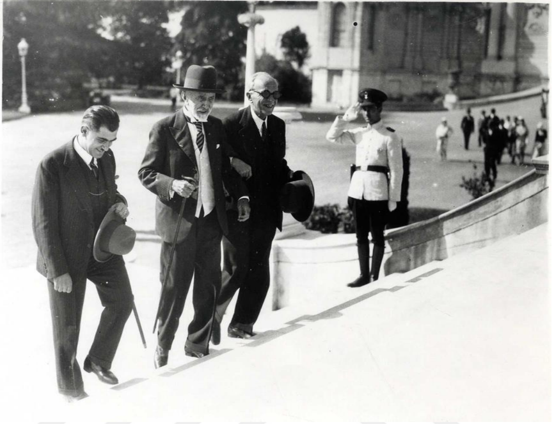
Hasan Ali Yücel ve Abdülhak Hamid Dolmabahçe Sarayı'ndaki Dil kurultayına gelirken. Ankara Üniversitesi Türk İnkılap Tarihi Enstitüsü Arşivi; Kutu: 1, Gömlek: 37, Belge No: 3701