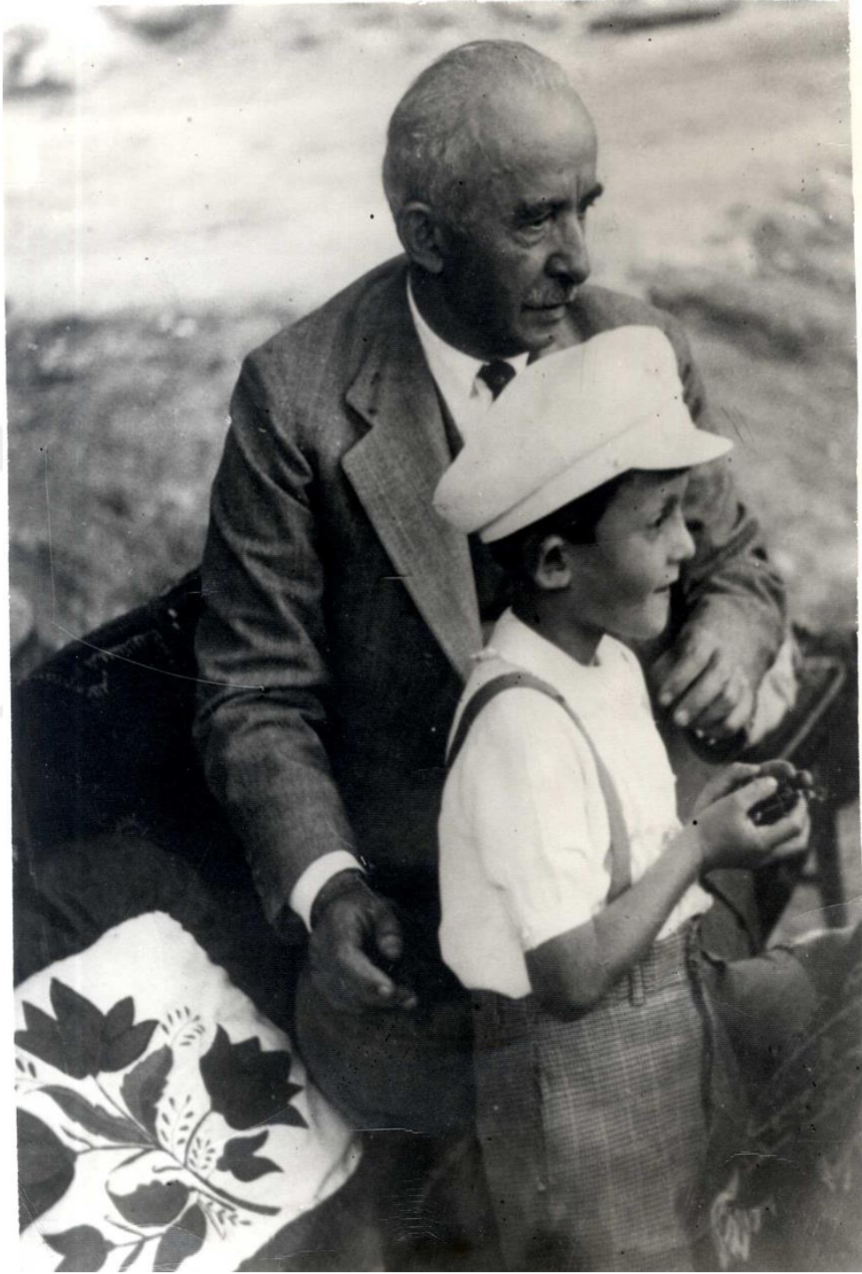
Cumhurbaşkanı İsmet İnönü'nün Konya Ereğlisi "İvris Köy Enstitüsü"nü ziyareti Ankara Üniversitesi Türk İnkılap Tarihi Enstitüsü Arşivi; Kutu: 51, Gömlek: 106, Belge No: 106001