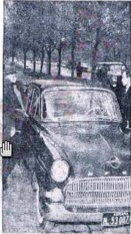
İsmet İnönü, Köy Enstitüleri Kurulması İçin Kurulan Komisyonun raporunu dinledi.

Köy Enstitüsü Kurulması İçin Kurulan Komisyonun raporunu dinledi. İnönü, Köy Enstitüleri Kurulması İçin Kurulan Komisyonun raporunu dinledi.