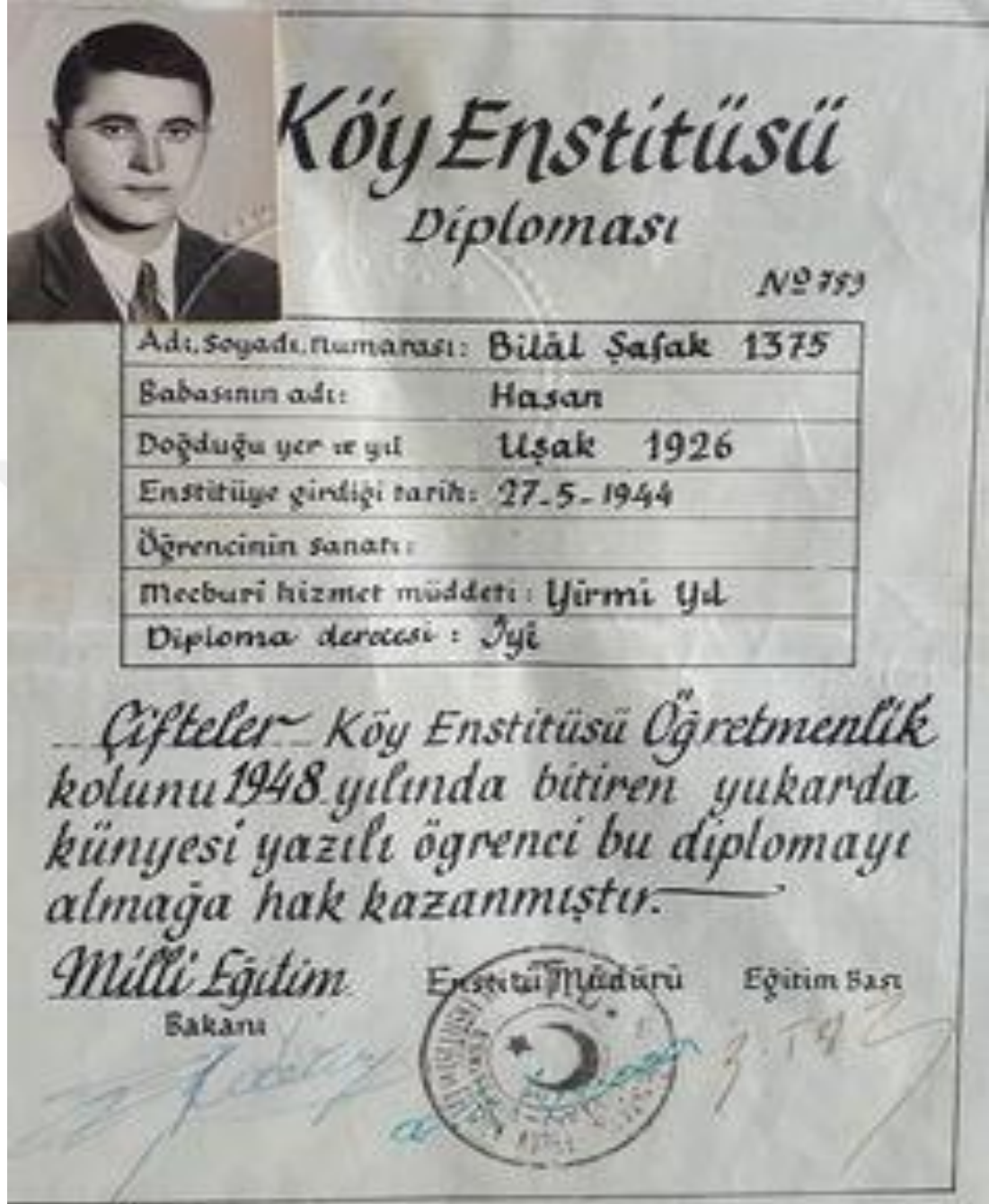
Köy Enstitüleri Diploma Örneği