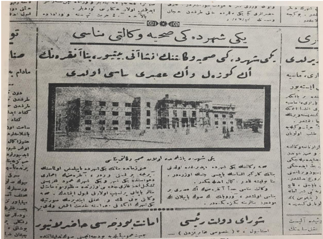
Yenişehir'deki Sıhhiye ve Muaveneti İctimaiye Vekâleti Binası; Hâkimiyeti Millîye, 4 Temmuz 1922.