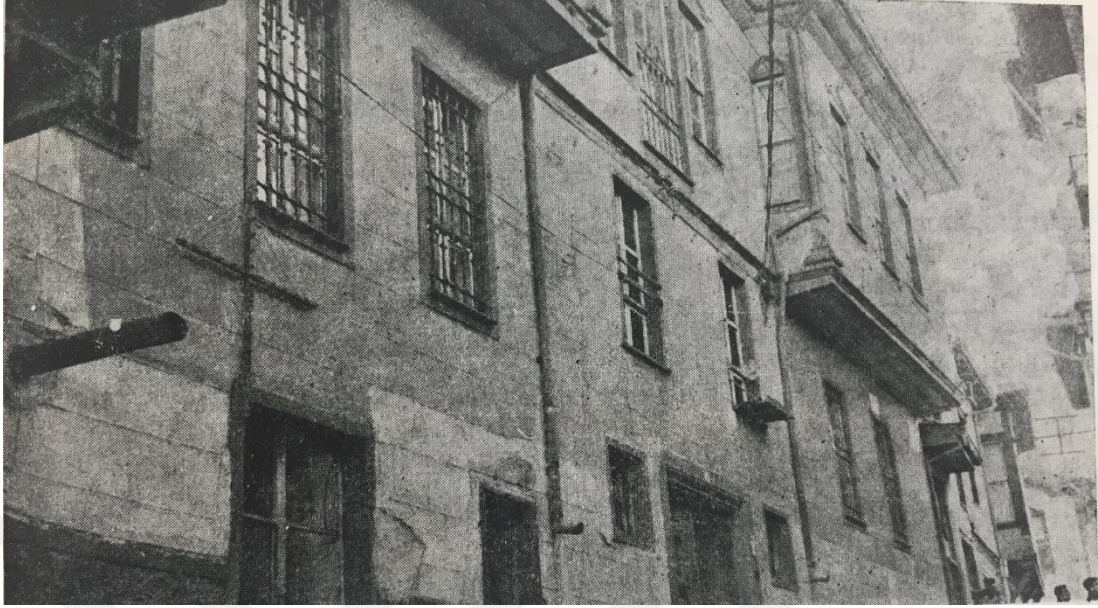
Hacıbayram'daki Sıhhiye ve Muaveneti İctimaiye Vekâleti Binası; Sağlık Hizmetlerinde 50 Yılı, Sağlık ve Sosyal Yardım Bakanlığı Sağlık Propagandası ve Tıbbi İstatistik Genel Müdürlüğü, Sağlık ve Sosyal Yardım Bakanlığı Yayınları, Ankara, 1972, s. 39.