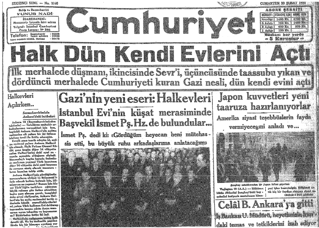
Halkevleri'nin Açılışına İlişkin Gazete Haberi; Cumhuriyet, 20 Şubat 1932.