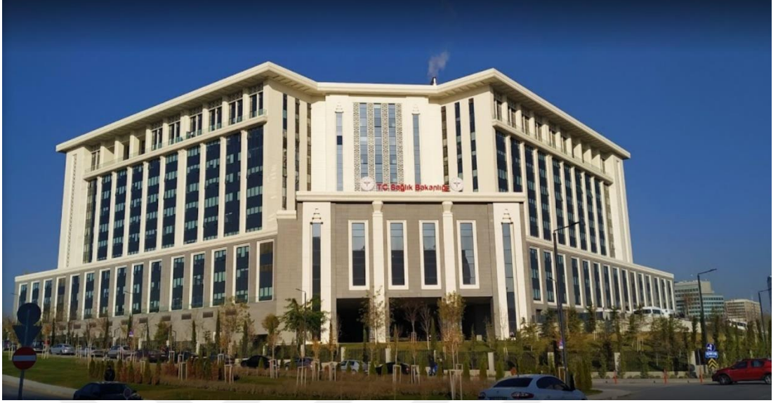
Günümüz SaĐlık BakanlıĐı Merkez Binası (15 AĐustos 2017 yılı itibari ile)