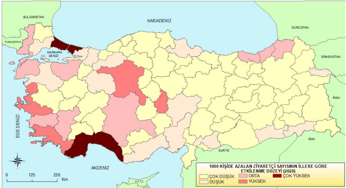
Şekil 3. Türkiye’de 1000 kişide azalan ziyaretçi sayısının illere göre etkilenme düzeyi

Seyahat kısıtlamaları ve karantina önlemlerinin devam etmesi ve farklı mekânsal alanlarda yeni dalgaların meydana gelmesi karantinaların kademeli olarak kaldırılmasına veya yeniden uygulanmasına neden olmaktadır. Turizm tedarik zincirleri sağlık, hijyen ve güvenlik protokollerinin sağlandığı mekanlarda yeniden çalışmaya başlamasına rağmen, yeni sağlık protokolleri işletmelerin sınırlı