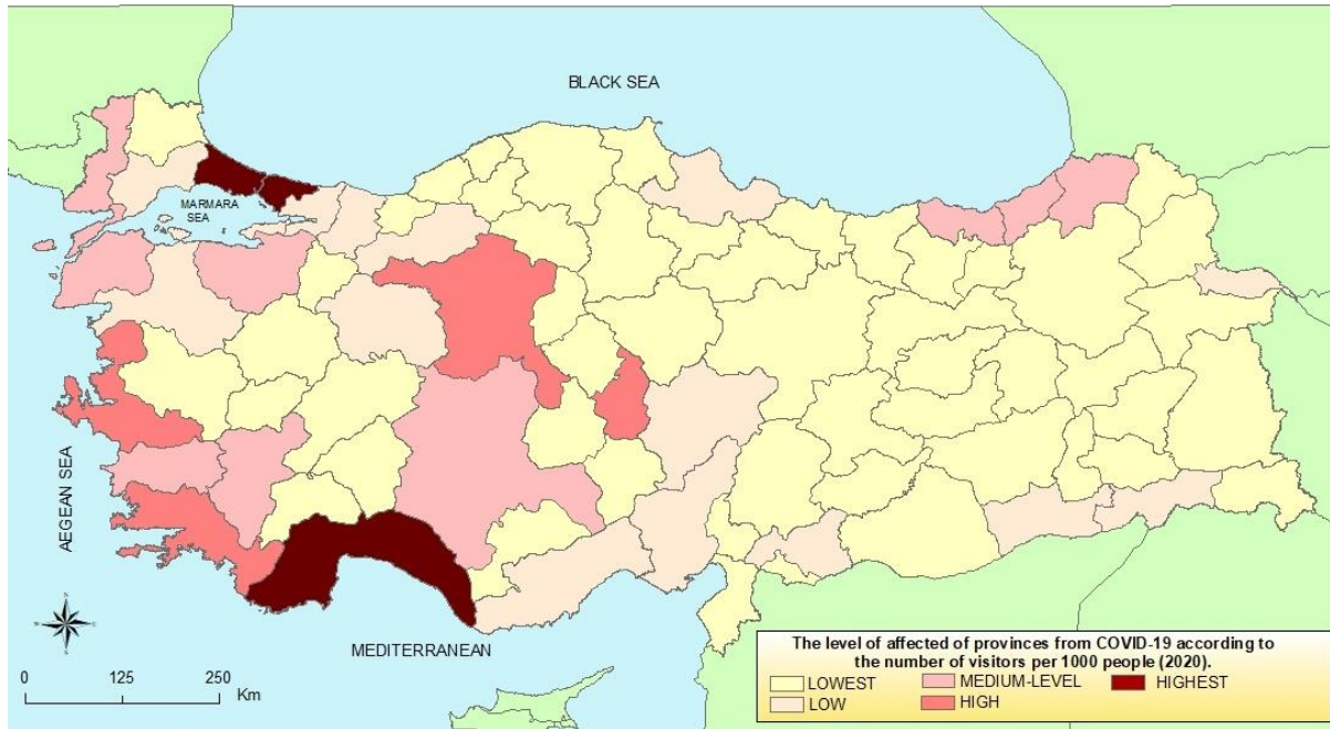
Figure 3. The level of affected of provinces from COVID-19 according to the number of visitors per 1000 people (2020)