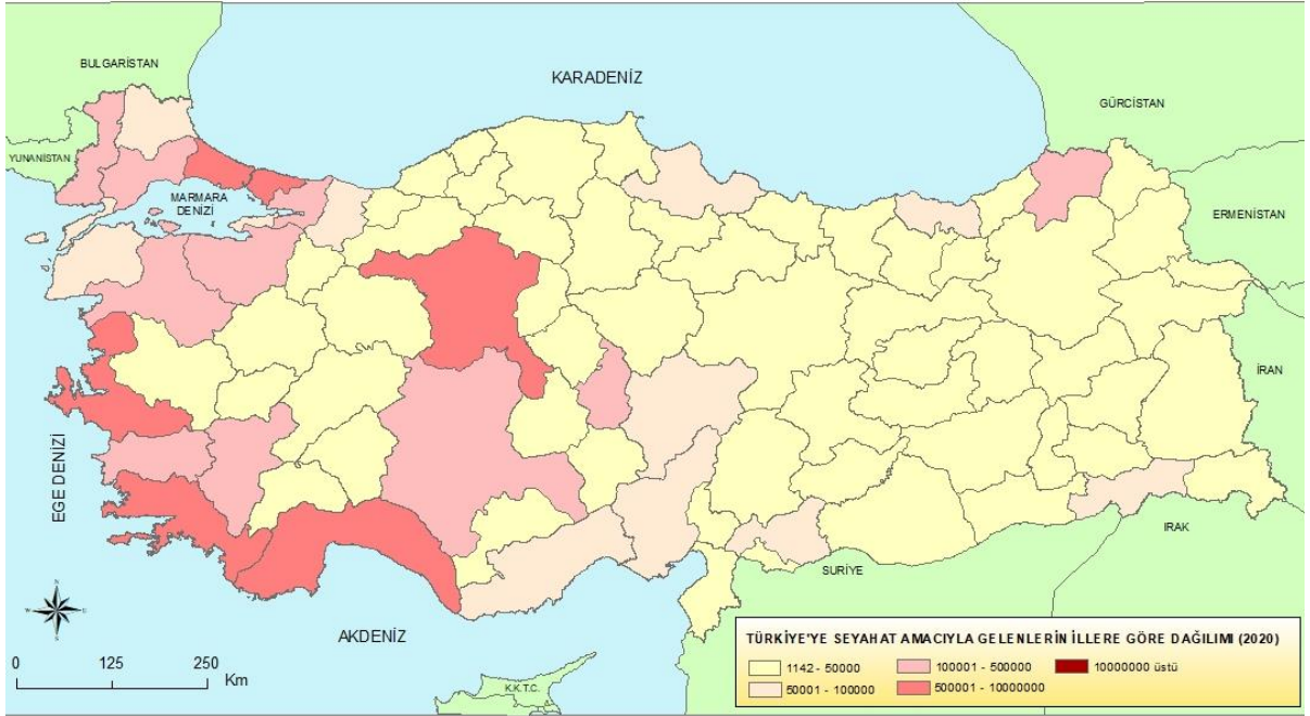
Şekil 2. 2020 yılında Türkiye'ye seyahat amacıyla gelen ziyaretçi sayılarının illere göre dağılımı

COVID-19 sürecinin mekânsal etkisini değerlendirmede, illerin bir önceki yıla göre ziyaretçi sayıları ve azalma oranları verisi, illerin farklılaşan görünümünü anlama adına önemli göstergelerdir ama yeterli değildir. Çünkü Türkiye'de bazı illerin ziyaretçi sayıları yüksek, bazı illerin orta düzeyde bazı illerin ise düşük seviyededir. Ziyaretçi sayısının yüksek olduğu bir ile düşük olan bir ilin azalma oranının aynı olması, her ne kadar illerin değişiminde önemli bir gösterge olsa da, bu iki ilin aynı derecede etkilendiğini göstermeyebilir. Bundan dolayı çalışmada, COVID-19'un iller arasındaki farklılığını daha doğru yorumlamak için ziyaretçi sayıları ve yıllık değişim oranları verisi yanında, illerin