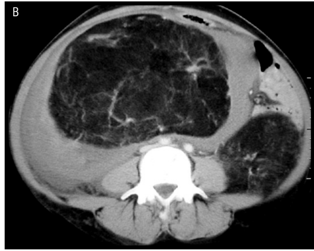
Şekil 2. Karın BT. Sol böbrekte anjiyomyolipom dışında kistik lezyonlar (A) ve sağda anjiyomyolipomun kanamasına bağlı pararenal hematoma (B) görülüyor.

olasılığı nedeniyle öncelikle abdominal US inceleme yapıldı. US'de karında geniş boyutlu ekojen kitle lezyonları, sağda kitle içinde ve çevresinde yoğun içerikli sıvı değerleri izlendi. İntravenöz (İV) kontrast madde verilerek kranyal BT; oral ve iv kontrast madde verilerek tüm karın BT incelemeleri yapıldı. Kranyal BT'de ventriküler sistemde subependimal bölgede ve subkortikal beyaz cevherde milimetrik boyutlu kalsifiye nodüller, bilateral serebral hemisferlerde parankimal tüberler ve verteks düzeyinde pariyetal kemikte sklerotik lezyon şeklinde tüberoskleroz için tipik bulgular saptandı. Tüm karın BT'de, en büyüğü sağda 33-x25 cm boyutlarında ve hemorajik vasıfta olmak üzere, her iki böbrekte masif, viseral organları iterek karını hemen tümüyle dolduran, içerisinde vasküler yapılara ait lineer dansitelerin ve yumuşak dokuların seçildiği, yağ içerikli, anjiyomyolipom ile uyumlu geniş boyutlarda kitle lezyonları izlendi (Şekil 1). Ayrıca her iki böbrekte kortikal kistler