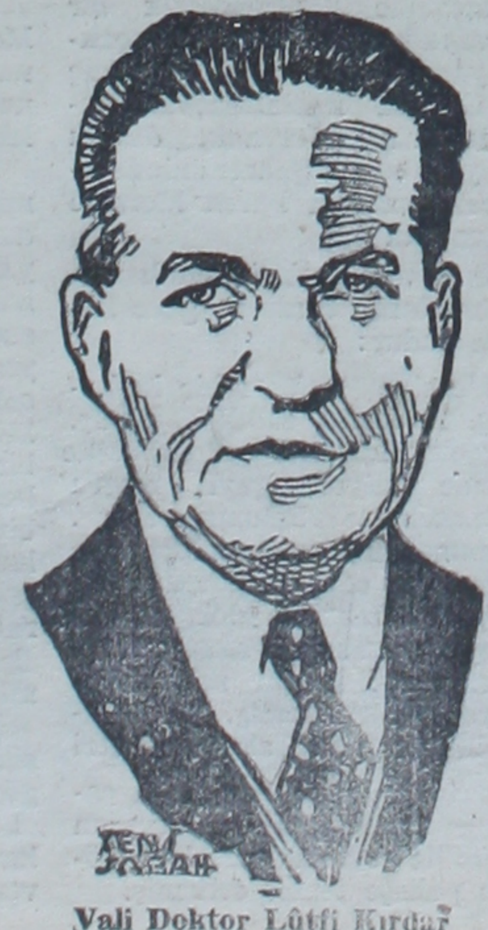
Vali Doktor Lütfi Kırdar

Diğer taraftan İstanbul maskelenmesinin bir defa da bavadan tayyareler vastasıyla tetkik olunması kararlaştırılmıştır. Tayyareler tarafından teftişlerin bu akşam yapılması muhtemeldir. Bu teftişler neticesinde bavadan tesbit olunacak hatalar ve ziyadar noktalar vilâyete bildirilecek ve bunların önüne geçilmesi için ayrıca tedbirler alınacaktır.