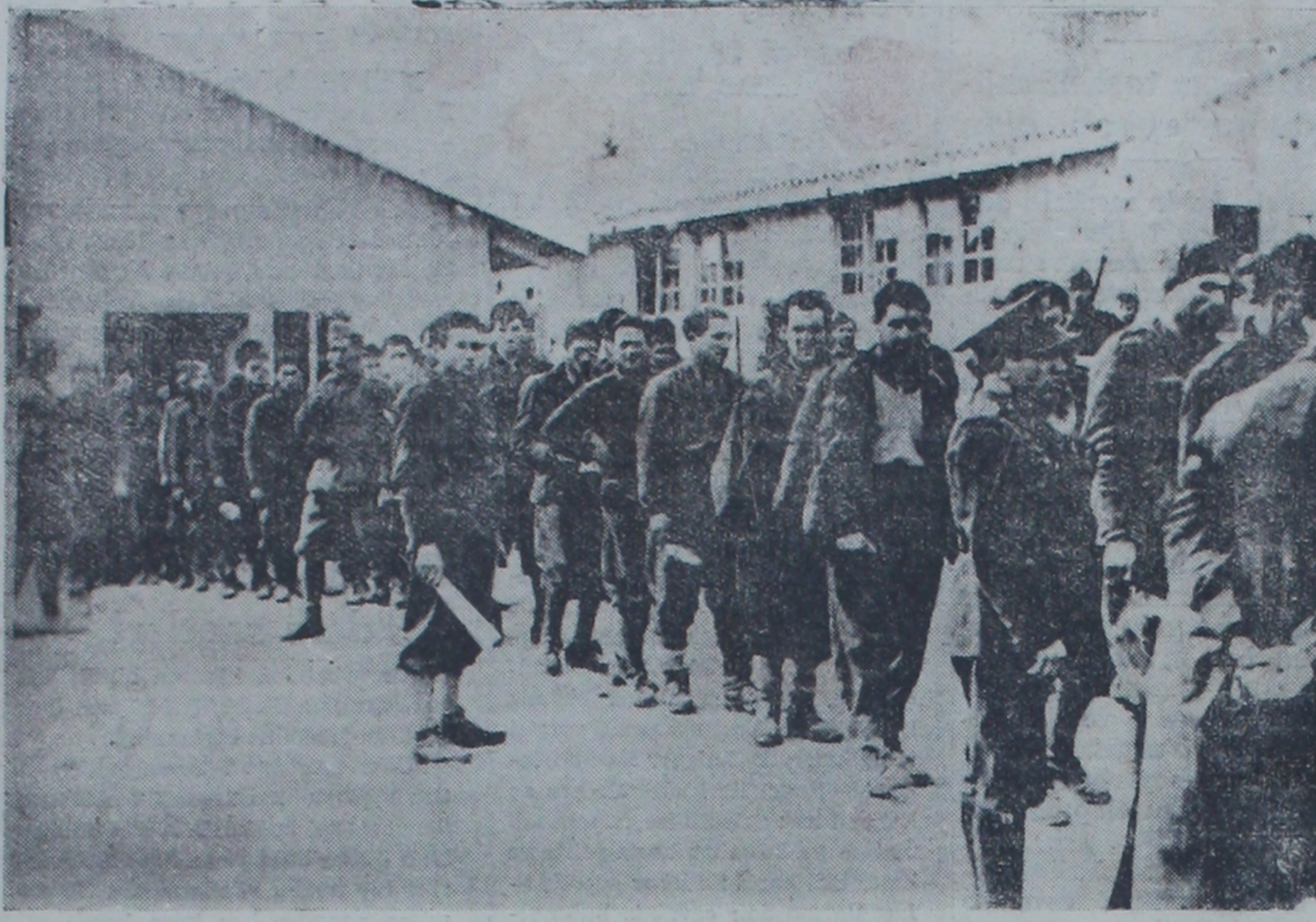
Atınaya getirilen İtalyan esirlerinden bir grup.

Hüseyin Cahid YALÇIN (Sonu sayfa 3 sütun 3 de)