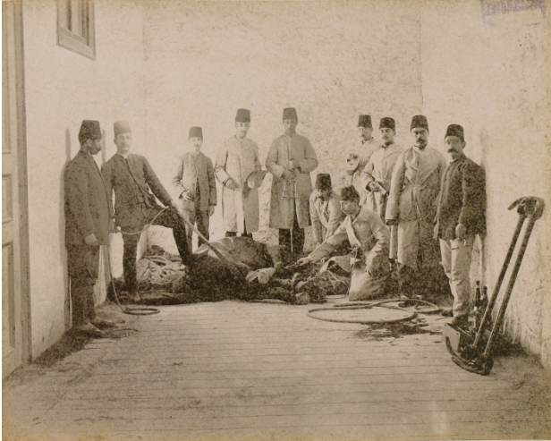
Şekil 2: Sivil Veteriner Okulunda klinik uygulama dersi (8). Figure 2: An applied clinics lesson given at the Civil Veterinary School (8).