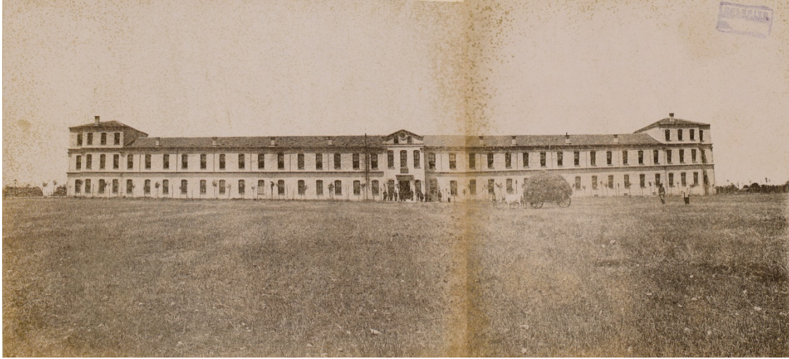
Şekil 1: Sivil veteriner hekimliği öğretiminin son iki yılında kullanılan Halkalı Ziraat ve Baytar Okulu (8). Figure 1: The Halkalı Agriculture and Veterinary School, the premises of which were used during the last two years of civil veterinary medical education (8).