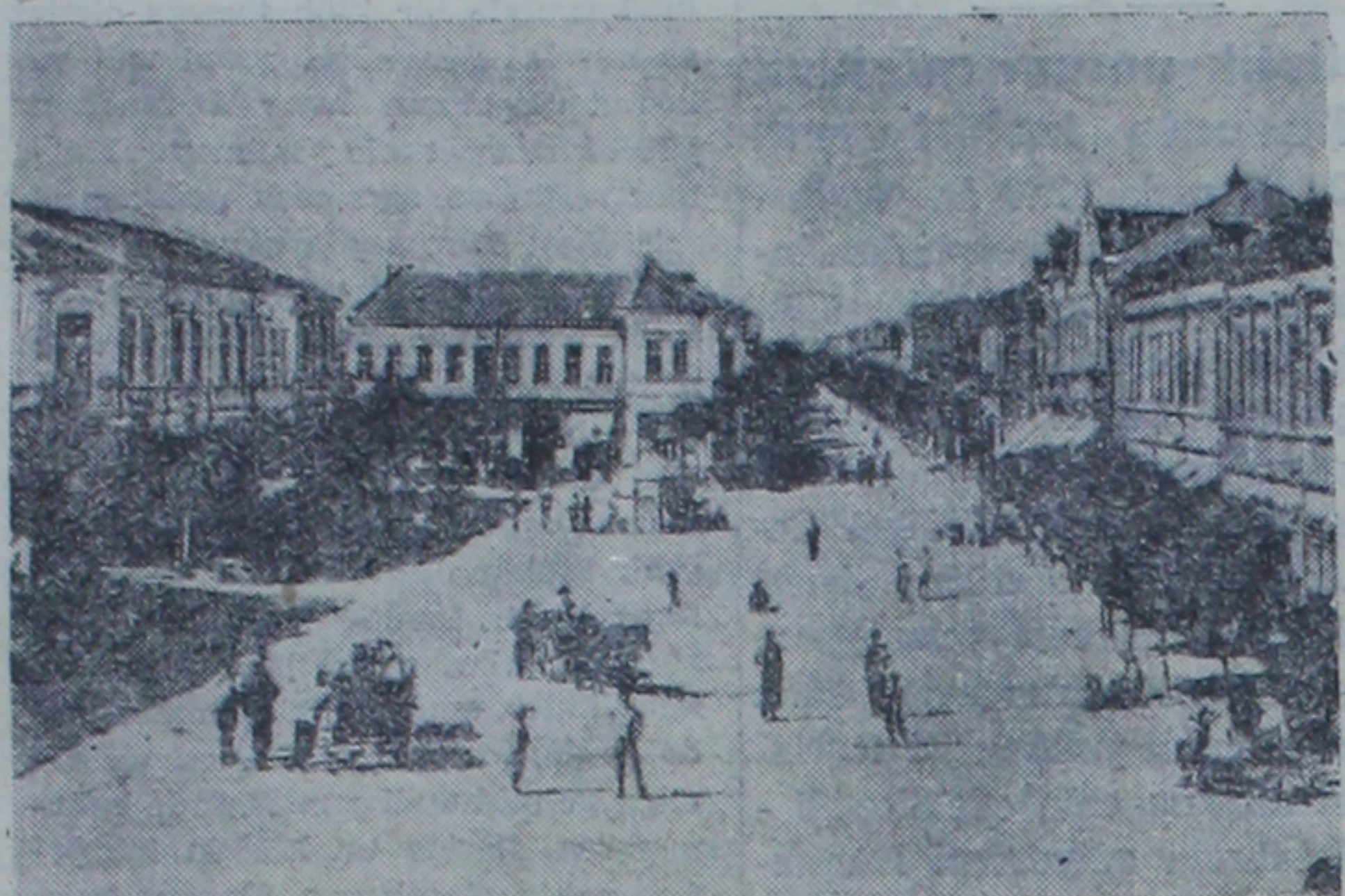
Dobriçenin Dobriçe şehrinden bir manzara