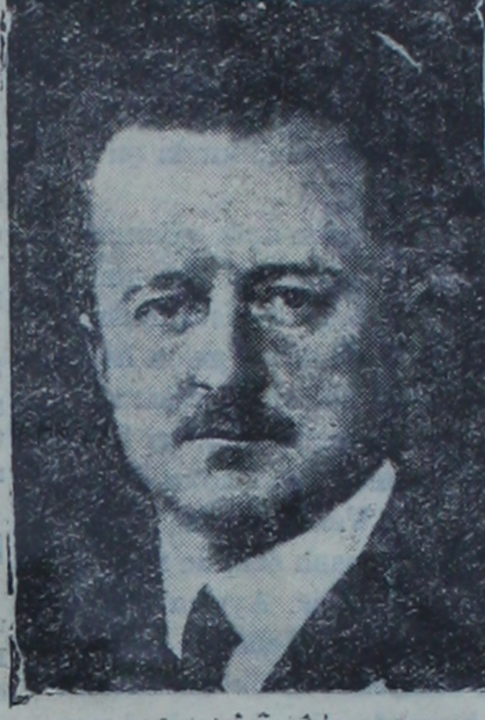
İngiliz istihbarat naziri Duff Cooper

Yakında Avrupada müdhîş bir açlık başlayacakmış Almanya'da intihar, cinnet ve verem vakaları çok fazlası