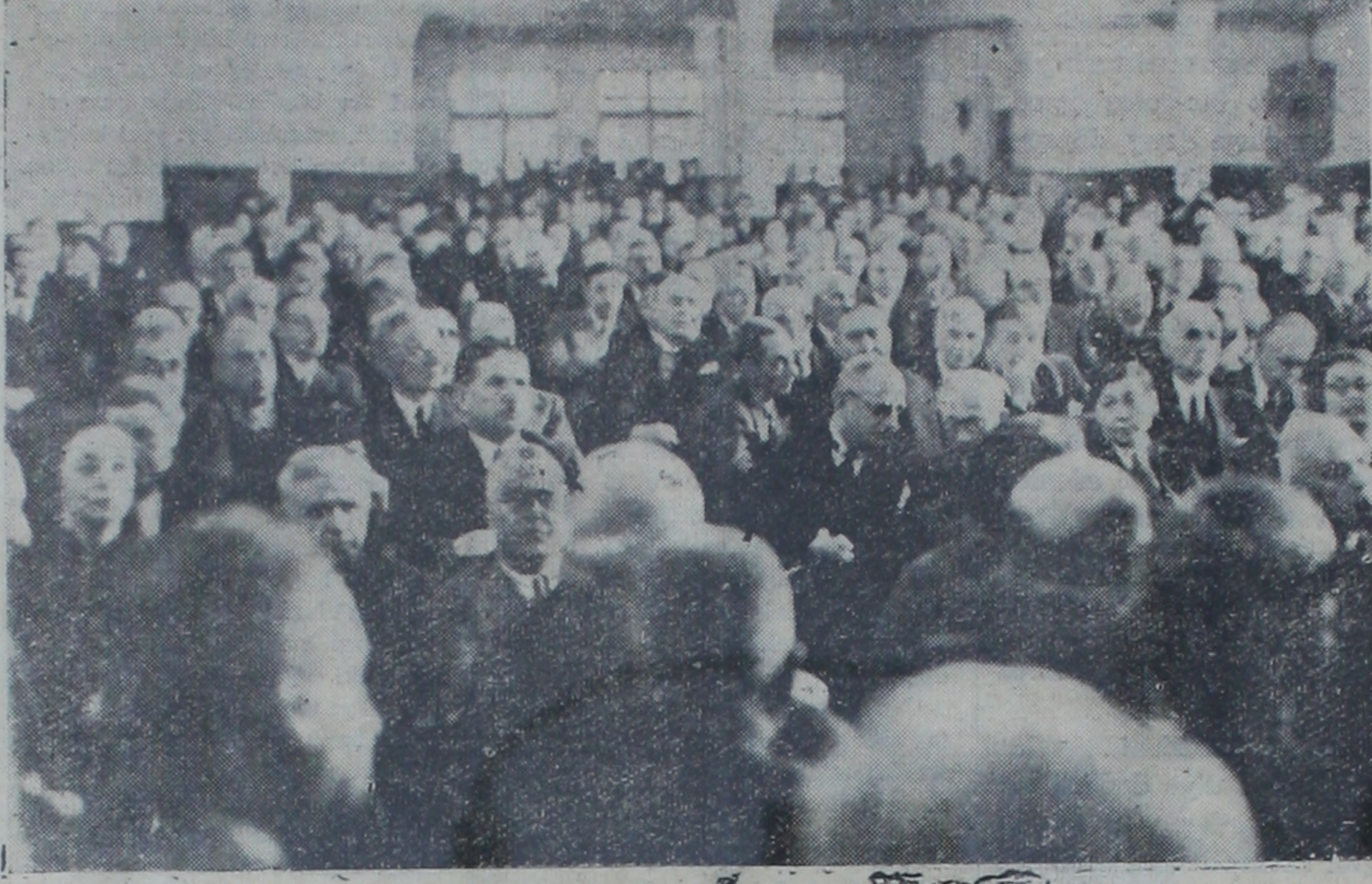
Büyük Millet Meclisi son toplantılarından birinde