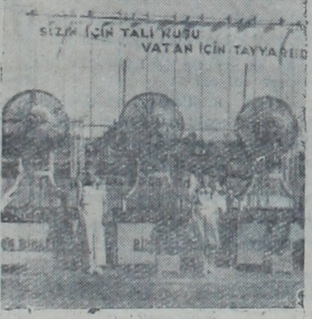
İlk kez kazanmışlardır. Bundan sonra çekilen şu çekim numaraya biler lira isabet etmiştir: (Sonu 3 üncü sayfada)

Bundan sonra, Said Çelebinin spikerliğle keşideye başlanmış, ilk çekilen rakam olan (0) sıfırla neticelenen biletlere karşın, 4 le nihayetle neticelenenler üçer, 13 le nihayetle neticelenenler sekiz, 524 ile biten biletlere yüzler