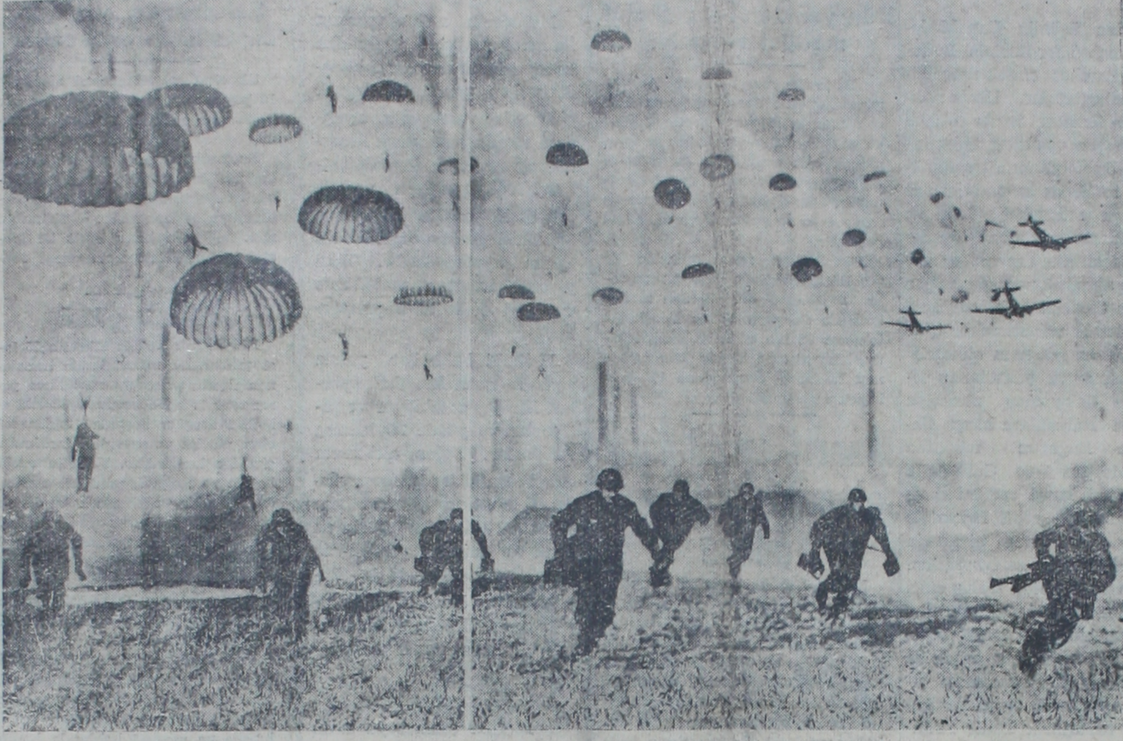
Bon Avrupa harbinde Almanyanın kazanmasına önül olan kuvvetlerden biri: Paraşütçüler ..

Onun için doktor Koch'un ölümü yenmek azmiyle sarfettiği harikulade mesaiyi seyreden bir Türk münevveri ancak göyle düşünebilir: "Doktor Koch'un Almanyasını tekrar geri getiriniz. Ona hayran ve dost olalım, onu bütün kalbimizle alkışlayalım! Biz Alman milletini sevmek ve takdir etmek için böyle filmleri görmeye muhtaç değiliz. Alman milletinin büyüklüğünü, değerini, insaniyete hizmetini, fikir, felsefe ve ilim sahasında ihraz ettiği mevki bilir ve bundan dolayı kendisine hürmet ederiz. Zaten Nasyonal Sosyalizm ile derginliğimizin bütün sırrı ve sebebi de bu noktadadır. Çünkü naziler bu büyük ve muhterem Almanyayı yıkmışlardır. Nazileri bu san'at, felsefe ve ilim Almanyasının düşmanı gördüğü müzden dolaydır ki kendilerine muğber bulunuyoruz. Onlar Al Hüseyin Cahid YALÇIN [Sonu 3 üncü sahifede]