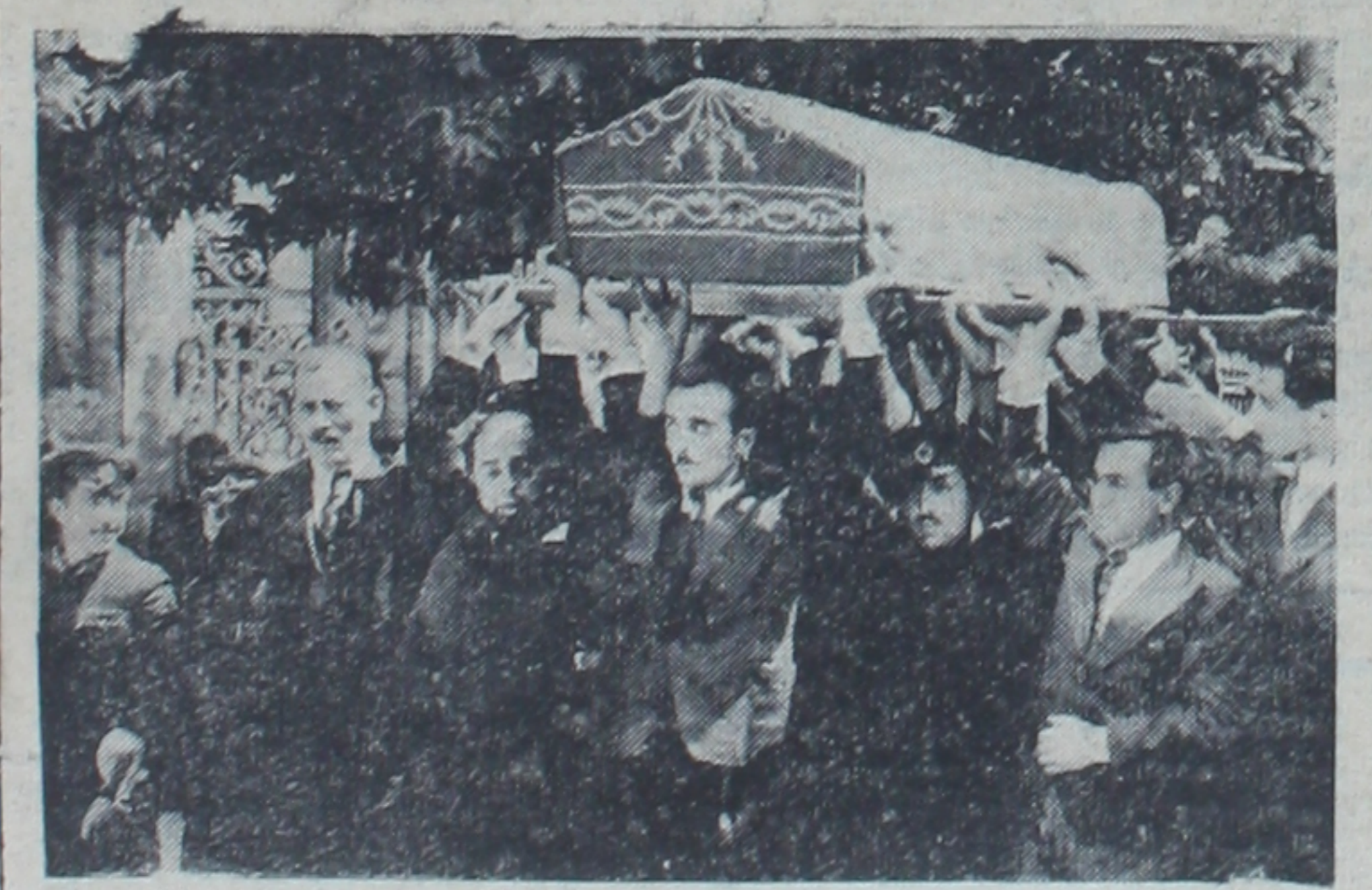
Merhum Hakkı Saydamın cenaze merasiminden bir görünüşü

Başvekil Refik Saydam dün akşam Ankara'ya döndü