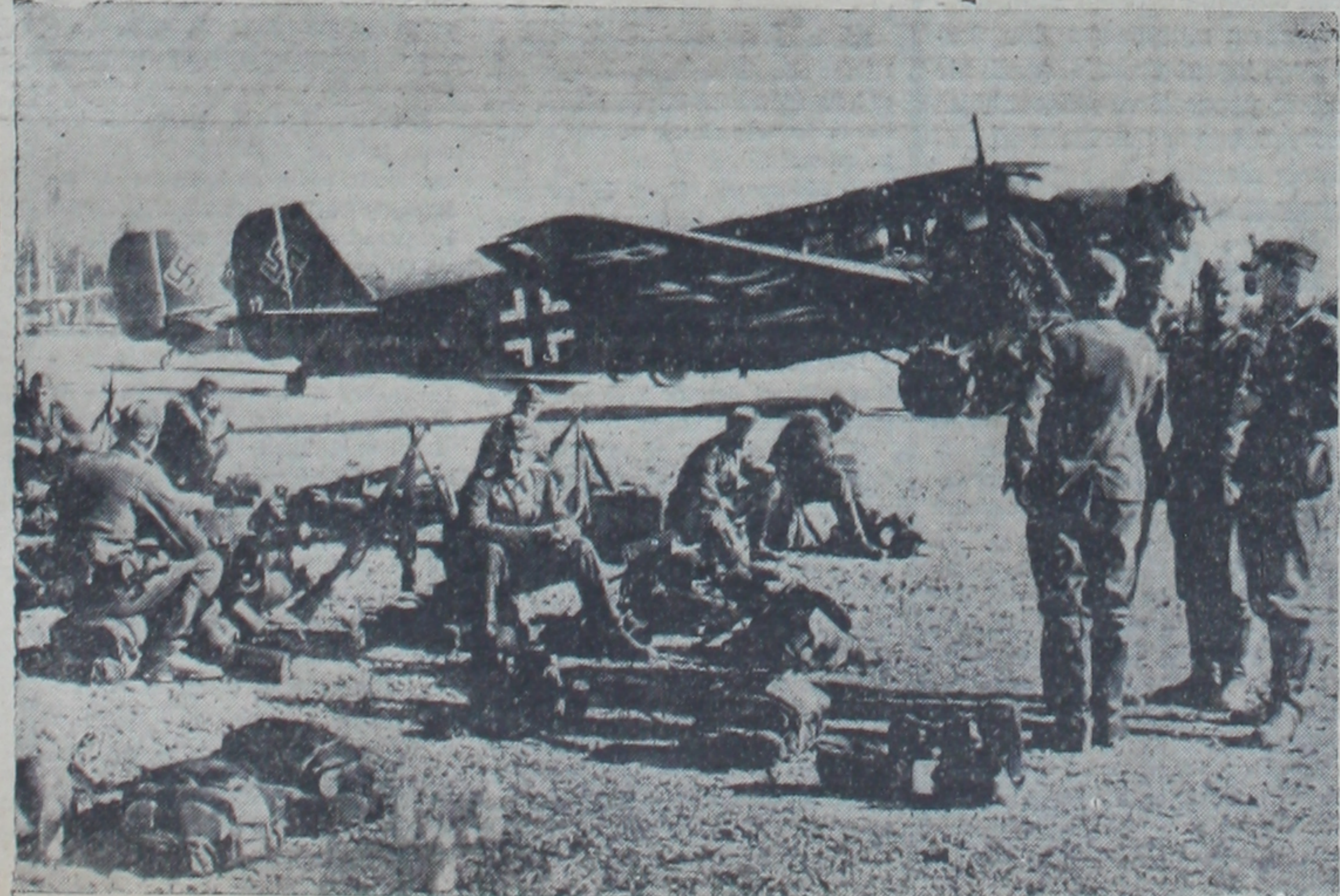
Son günlerde faaliyeti sekteye uğrayan büyük Alman tayyarelerinden biri