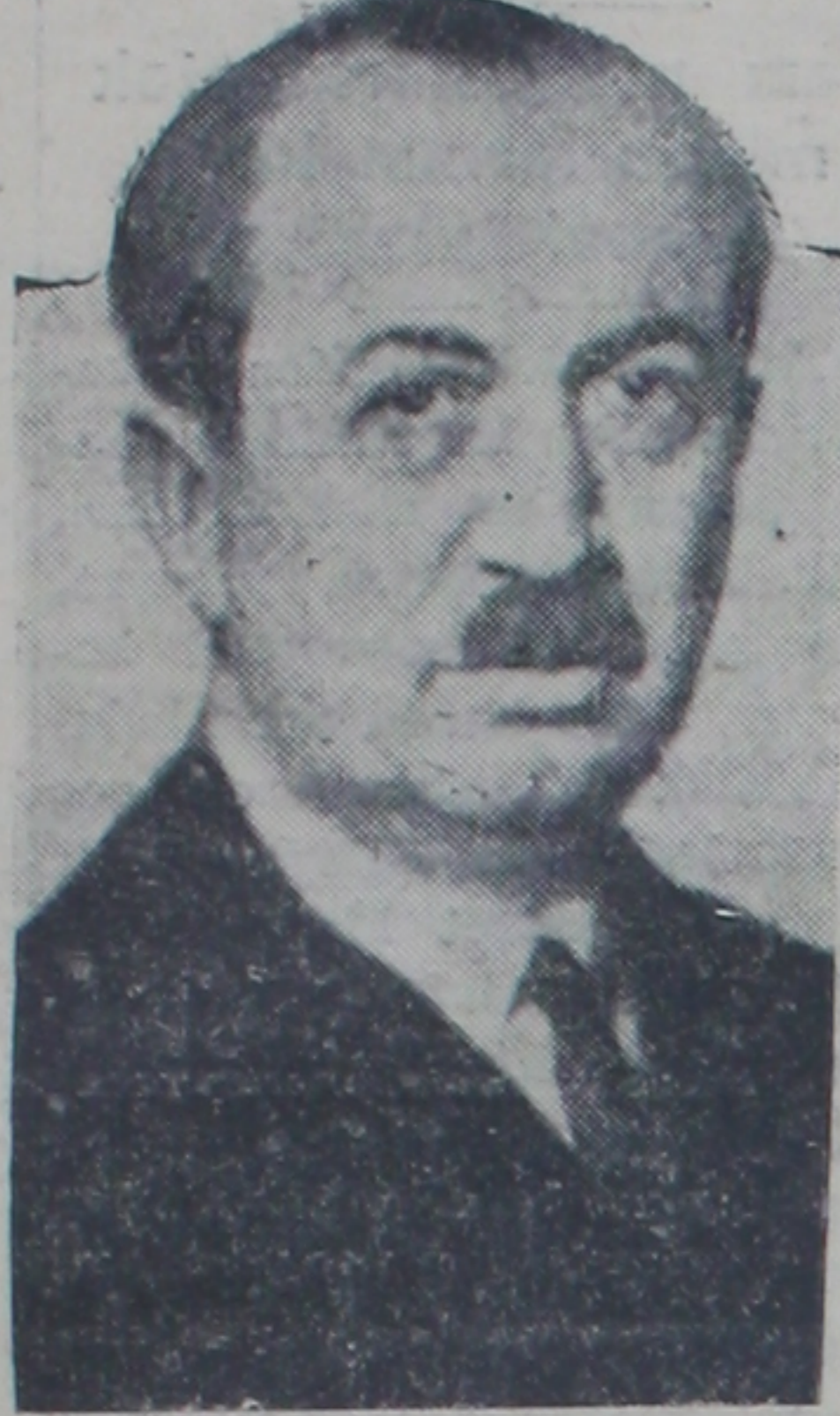
Millî Müdafaa Vekili Saffet Arıkan