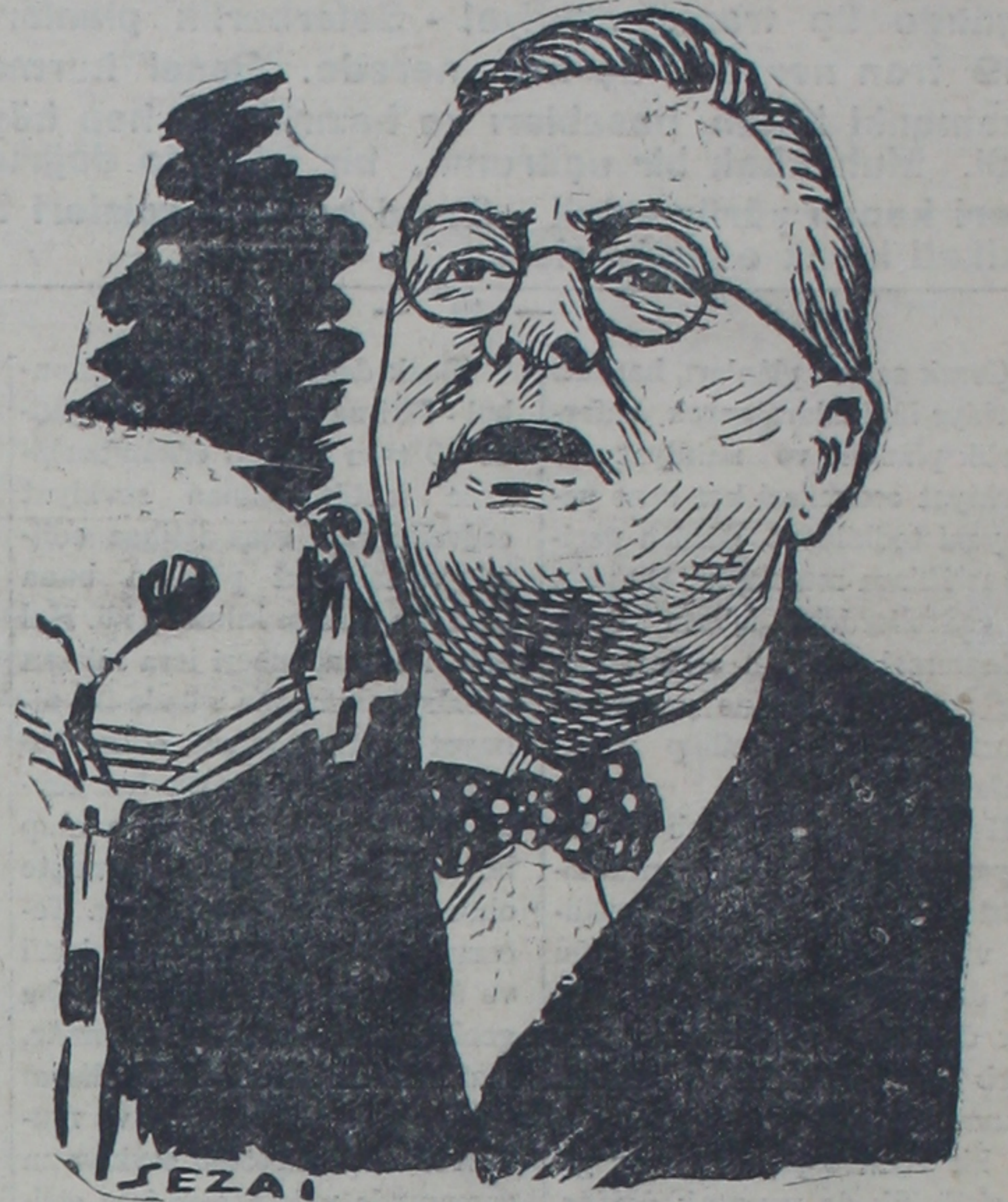
İngiliz Başvekilinin Churchill söz söylerken ..

Celsenin açılmasını müteakib kürsüye gelen Hariçye vekili Şükrü Saraçoğlu, hariç siyasetimiz bakımından bizi alâkadâr eden son dünya hadiselerinin ve bu hadiseler hakkındaki hükümetimizin noktalı nazarını izah etmiş ve söz alan müteddid hatıblere cevaplar vermiştir. Hariçye Vekilinin be [Sonu 3 üncü sahifede]