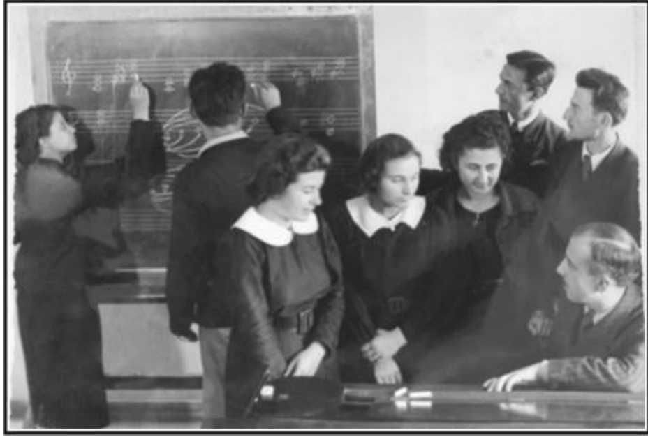
Musiki Muallim Mektebi 15