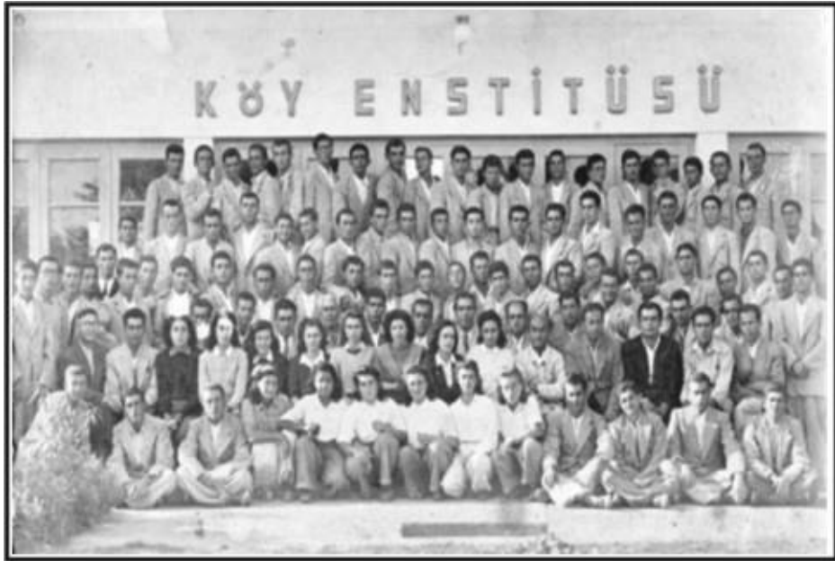
Köy Enstitülerinden bir görüntü 16