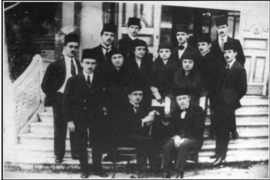
İnas Darülfünûnu'ndan gelen kızlarla birlikte Edebiyat Fakültesi öğrencileri (8 Ağustos 1920)