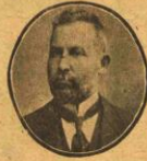
دوکتور عبدالله جودت بک

علم تحصیل ایتک « طلب العلم فریضه علی کل مسلم و مسلمة » حدیث شریفله قادیان وارکک هر مسلم اوزده بیته « اسلام » کله دیگر فرضلری کی فرض اولمدر . عبادت نه درجه فرض ایسه تحصیل علم و عرفان دخی اودرجه ده فرضدر . عبادت عینی سلف آئینده قادیان وارکک اجتماعیه ایفا اولونه بیلور . عبادت کی فرض اولان تملکده عینی سلف آئینده قادیان وارکک هب برابر اجراسی نه دن شعار اسلامه مغایر کورولسون ؟ اسلامک سقوطی سبیلری بیاننده اکه و ختم اولاق عادتلرک احکام دینه ایله قاریندر برلایسی و عادت حکمدر « دینه لره ک بعضی مضراطاته اکلک ، بوکلک بیلر سرت برلایقی ماهیتی کسب ایتدیر برلایسی اولمدر . وقت سعادتده مسلملرک لشکر اسلام ایله برابر جهاده کینتکلری و بونلر میانده ماهر جراح لار بولوناراق مجروح غازیلر اوزمده ، اوزمانه کوره ، عملیات و مداوات یایدیلری اسلام تاریخلرنده مسطوردر مرحوم ذهنی ائقندنک ( مشاهیر النساء ) سی فاضل و متبحر برچوق مدرس ، خطاط ، خطیب لوزان اسلامک حیات و مناسباتی قید ایدر . بن مسلمانلی طرز تلخیصیه مسلمانلی اساسنده خر و حریت پرور بیرون در و ایمنده یاشادنی هر عصرک مقتضیات و ترقیاتی قبول واستیجاسه مهیادر اسلامی سون اسلامی یوله بیلیملی و یوله یاشمال . « الهین هو القبل لادین ان لا عقله بهی » دین عقلدر . عقل اولمایانک دینه بوقدر ، دینیه بیرواضع دینک امنه یالقیان « تقیر ازمانک تفریح کمانی » مستلزم اولدنی طای و محیط بر نظر انصاف و ادراک ایله کورمکدر .