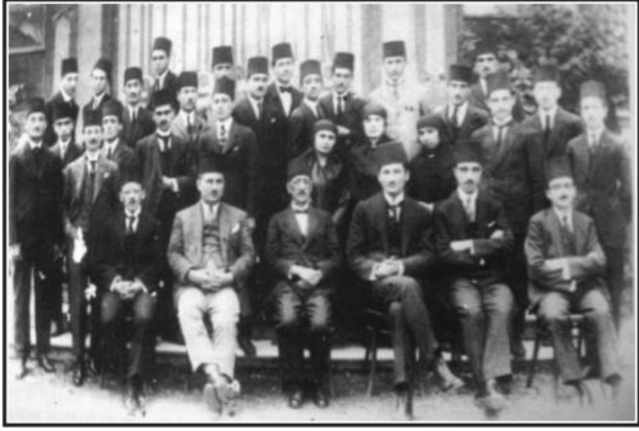
Karma eğitime geçildiği 1920-21 ders yılında Edebiyat Fakültesi Felsefe Şubesi'nin müderris ve öğrencileri.