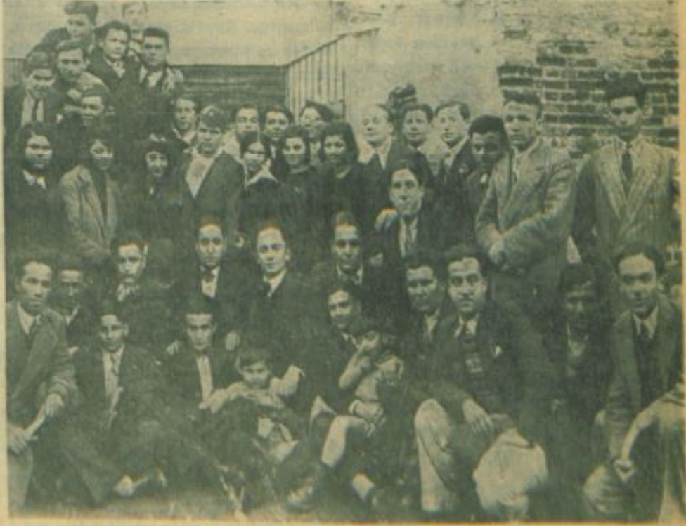
Hususî Hsclerimiztn birtnde ktz ve erkek talebe bir arada.