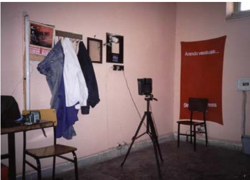
Niğde Tarımsal Açık Cezaevi, Fotoğraf Stüdyosu.