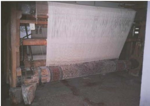
Sivas Açık Cezaevi, Halı Dokuma Atölyesi.