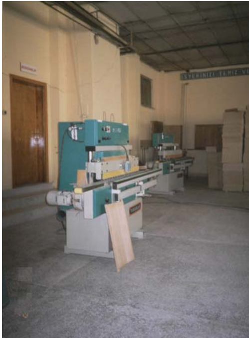
Eskişehir Açık Cezaevi, Marangoz Atölyesi.