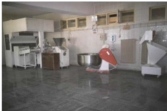
Sivas Açık Cezaevi, Ekmek Fırını.