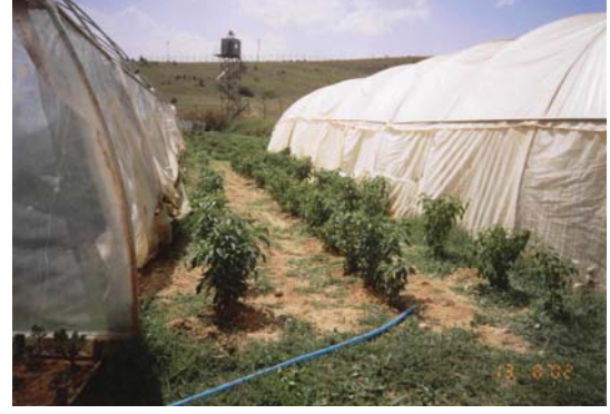
Kastamonu Açık Cezaevi, Seralar.