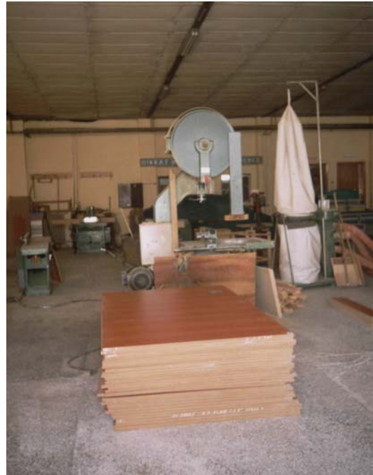
Eskişehir Açık Cezaevi, Marangoz Atölyesi.