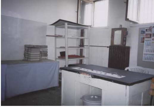
Kastamonu Açık Cezaevi, Cilt Atölyesi.