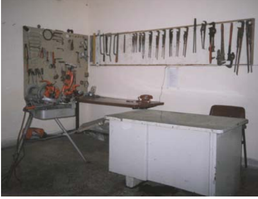
Niğde Tarımsal Açık Cezaevi, Demir İşleme Atölyesi.