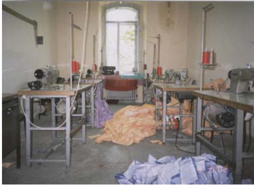
Kayseri Zincidere Açık Cezaevi, Dikiş Atölyesi.