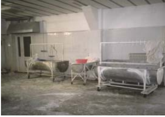
Eskişehir Açık Cezaevi, Ekmek Fırını.