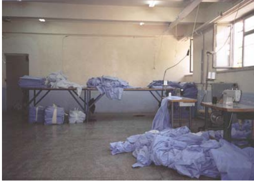
Niğde Tarımsal Açık Cezaevi, Nevresim Dikim Atölyesi.