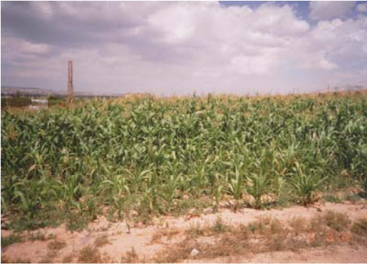
Niğde Tarımsal Açık Cezaevi, Niğde Tarım Uygulama Alanları.