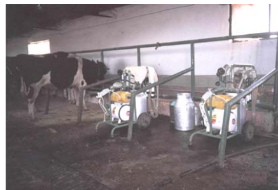
Niğde Tarımsal Açık Cezaevi.