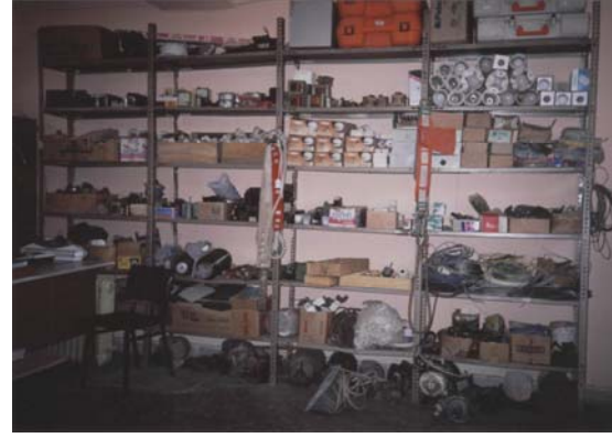
Niğde Tarımsal Açık Cezaevi, Elektrik Atölyesi.