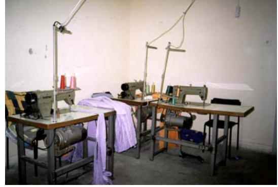
Kayseri Zincidere Açık Cezaevi, Dikiş Atölyesi.