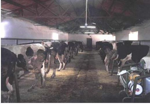
Niğde Tarımsal Açık Cezaevi.