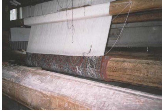
Sivas Açık Cezaevi, Halı Dokuma Atölyesi.