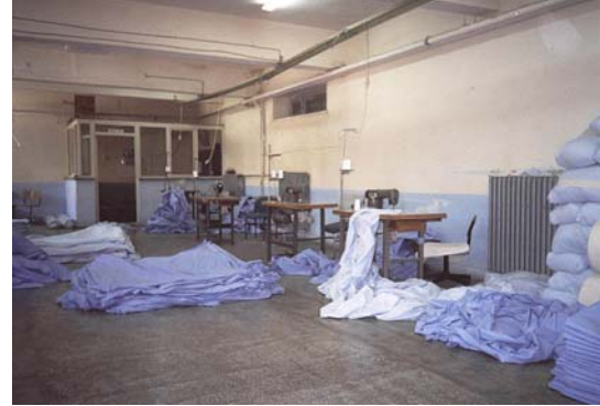
Niğde Tarımsal Açık Cezaevi, Nevresim Dikim Atölyesi.