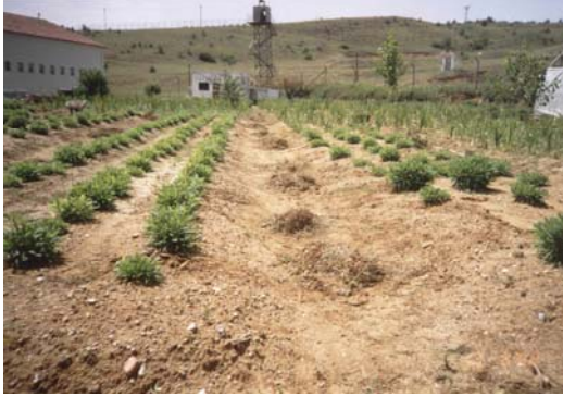
Kastamonu Açık Cezaevi, Tarım Alanları.