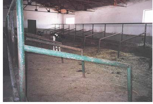
Niğde Tarımsal Açık Cezaevi.