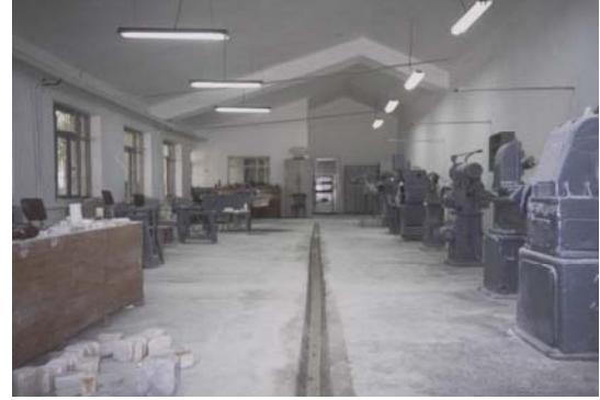
Kırşehir Açık Cezaevi, Mermer İşleme Atölyesi.