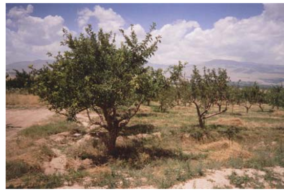
Niğde Tarımsal Açık Cezaevi, Niğde Tarım Uygulama Alanları.