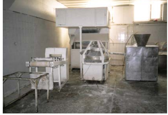
Eskişehir Açık Cezaevi, Ekmek Fırını.