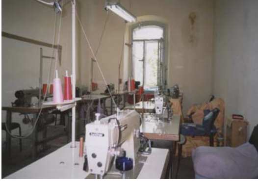
Kayseri Zincidere Açık Cezaevi, Dikiş Atölyesi.