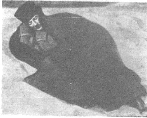
Türkü kurtaran Ulu Babamız Sakarya meydan muharebesinde karlar içinde uyurken...

Türk çocuğu bilir ki, onun biricik Ulu Babası gibi dünyaya kimse gelmemiştir. Ulu Babamız, bizim candan ve kalpten sevdiğimiz, ayrılık kabul etmez bir et kemik gibi bizimle kaynaşan, bizi anlayan ve bizi bizim gibi düşünen ve gören ilâhi bir Babadır.