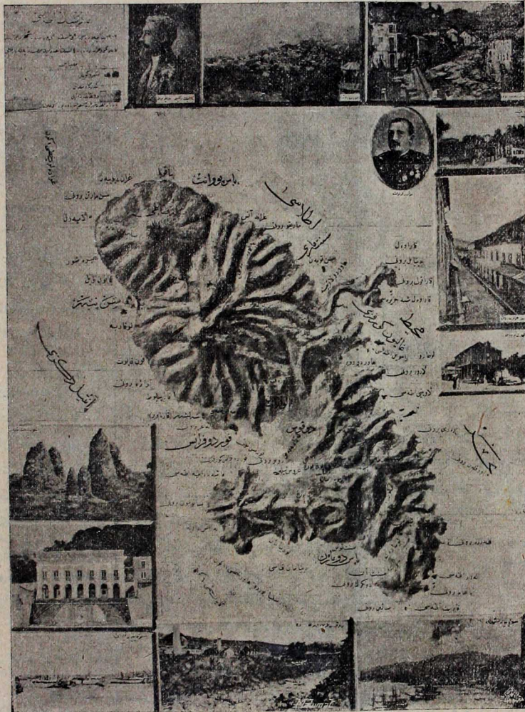
مارتینک اطه سنک جلال اسعد بک طرفندن بایش اولان قبارته خرطه سندن استساخایدلشدن

نسخه سی ۱۰ پاره در هر کون وقت ظهرده نشر اولنور مصور عثمانی غزته سیدر ۱۰ پاره در