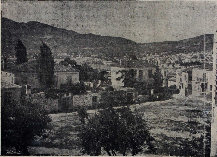
مدالی جزیره سی مناظرندن

آفریقای جنوبی دن صالح مذا کرانه داتر آنتان خبر لر غایت مهم ویکدیگری ناقص اولدقبری جهت هنوز نه نتیجه کسب ایده چکنه داتر بر فکر حاصل ایله میور . مع مافیه سینه هر طرفه نیکنیک دوام ایتمکده در . صوگ آلتان بر تلغرافنامه بوئر لک (قلر قسدروپ) ده مذا کرانده بولندقن سکره پره توریایه عودت ایستکاری و شرائط صلحیه به داتر پینلر نده تقرر آیدن موادی قریباً انکتره حکومته تبلیغ ایده جکاری بیلدیریلور . بوئر لک انکتره حکومتی طرفندن تکلیف ایدیلمن شرائط میابنده اک مهمی اولان مختاریت اداره نی قبول آیتش اولدقبری روایت ایدیلبور سده بو خبر هنوز رسماً تأیید ایتمه مشدر . کچن کون عوام قاره سنده ایراد ایدیلمن برسؤاله جواباً موسو چیرلایین بوئر لک مسرور ایچون ویربان مساعده نامه لک نه قدر مدت ایچون اولدقنی بیلمدیکنی بیان ایتمشدر . هر حالده مذا کرات صلحیه دوام ایدیلمدیکنه مساعده لک تمید ایده یه چکی شهبه سزدر . فقط مذا کرات ختام بولدینی تقدیرده بوئر مرخصلری کندنی حدودلری داخله کیردکن سکره کچن ایلولک اون بشنده نشر ایدیلمن امر نامه لک بولر حقنده سینه جاری دخی اولوب اولمه جتی جای سؤالدر . هر حالده لورد کچین طرفندن نشر ایدیلمن مذکور امرنامه موقع تطبیقه قالدقجه بوئر مرخصلری کندی حدودلری داخله کیردکن سکره اسیر ایدیلمن لر سه نفی وتبعید جزاسنه دوچار اوله چقلدر .