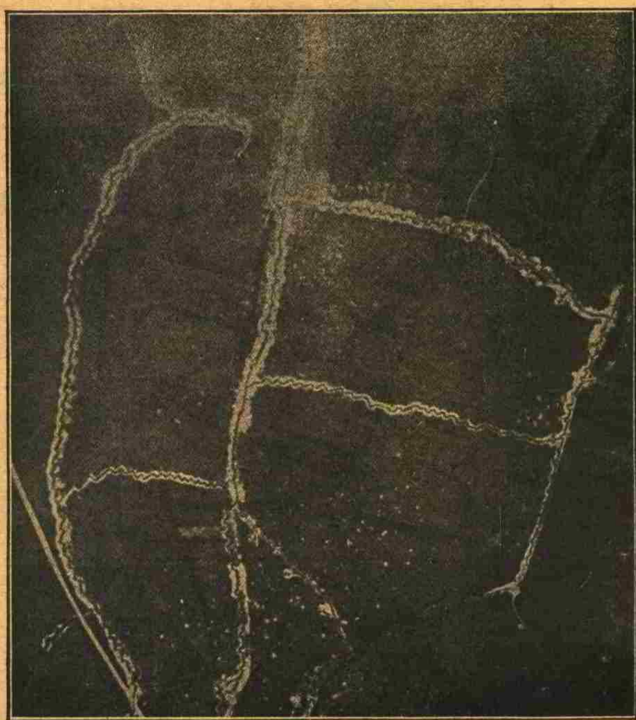
صوم حوالیسنده محاربات برمنطقه ده کی سیرلرک طویچی آتشدن اول طیاره ایله آتمش رسمی

یازدینی بر مقاله ده دیورکه : «آتی موفقیته ک تأثیر ایله کندیسی بولفه قایدیر میانلرک (ور-دون) ک شالنده فرانسزلر طرفندن اجرا اولنان تعرض نه مقصده معطوف اولدینی سؤالی ایراد ایلری برامه طبیعیدر . بوجوملر بیوک غایه لره معطوف بیوک برترشمیدر ، بوقسه آزرزمان سوکره کندیکنندن نهایت بولعه جق براصقیق حرکتلریدر ؟ فرانسز- لرک حرکتی کوچک مقیاسده بر حرکت عسکریه اولدینی هجوم جبهه سنک بک جزق برطولده اولسندن آکلاشیلر . آتی کیلو مترقدر قیسه برجه دن واسع مقیاسده یارمه حرکتی اجرا ایدله - میه جکی محتاج ایضاح دکلدرد . «بم فکر و تخمیننه نظراً فرانسز باش قوماندانلی (ور-دون) ده کی وضعیتی بدقیق و معاینه ایلدیکی صرعه (وردون) جوارنده جمع و تحشید ایدیلن کلیتل فرانسز طویچی فوترلی سایه سنده بورادن هجوم اجراسنک قابل بولندیفی طن ایلشدر .