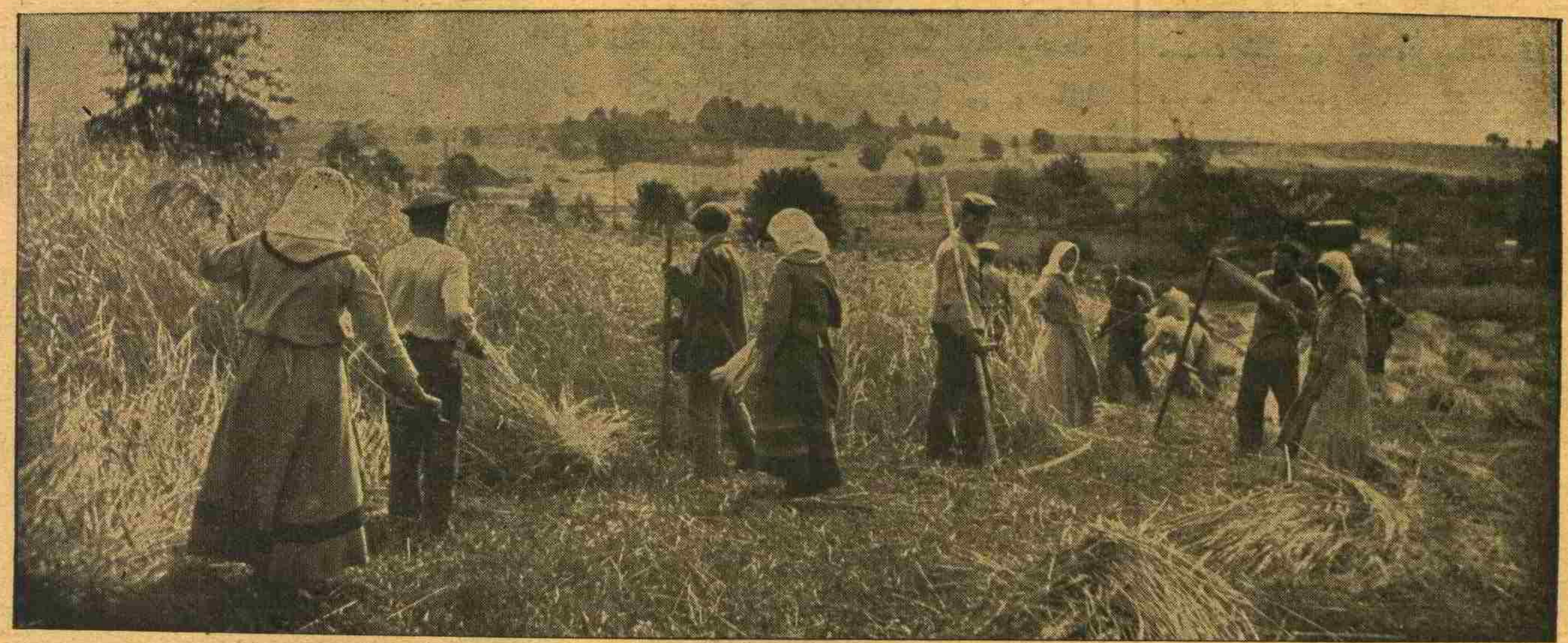
آلمانیاده فعالانه زراعت حیاتی . — دشمنلرک دوت طرفندن آبلوقه آلتنه آلهرق آچ براقق ایسته دکلری آلمانیاده قادین ارکک هرکس کمال فعالیتله زرعیاتده بولمقده در . LA VIE AGRICOLE EN ALLEMAGNE — Hommes et femmes s'occupant aux travaux des champs.

انکلیز مطبوعاتی نه سوبله یور ؟ لوندرده مطبوعات اجنبیه ارکانی عهفنده ، انکلتره خارجییه ناظری سیر ادوار غره یک بالخاصه بی طرف مملکتلره خطاباً ، بولر اوزرنده بر تأثیر و نفوذ اجراسی مقصدیه ، واقع اولان بیاناتی بر قاچ کون اول تلفرافلر ، خلاصه بیلمه برمش ،