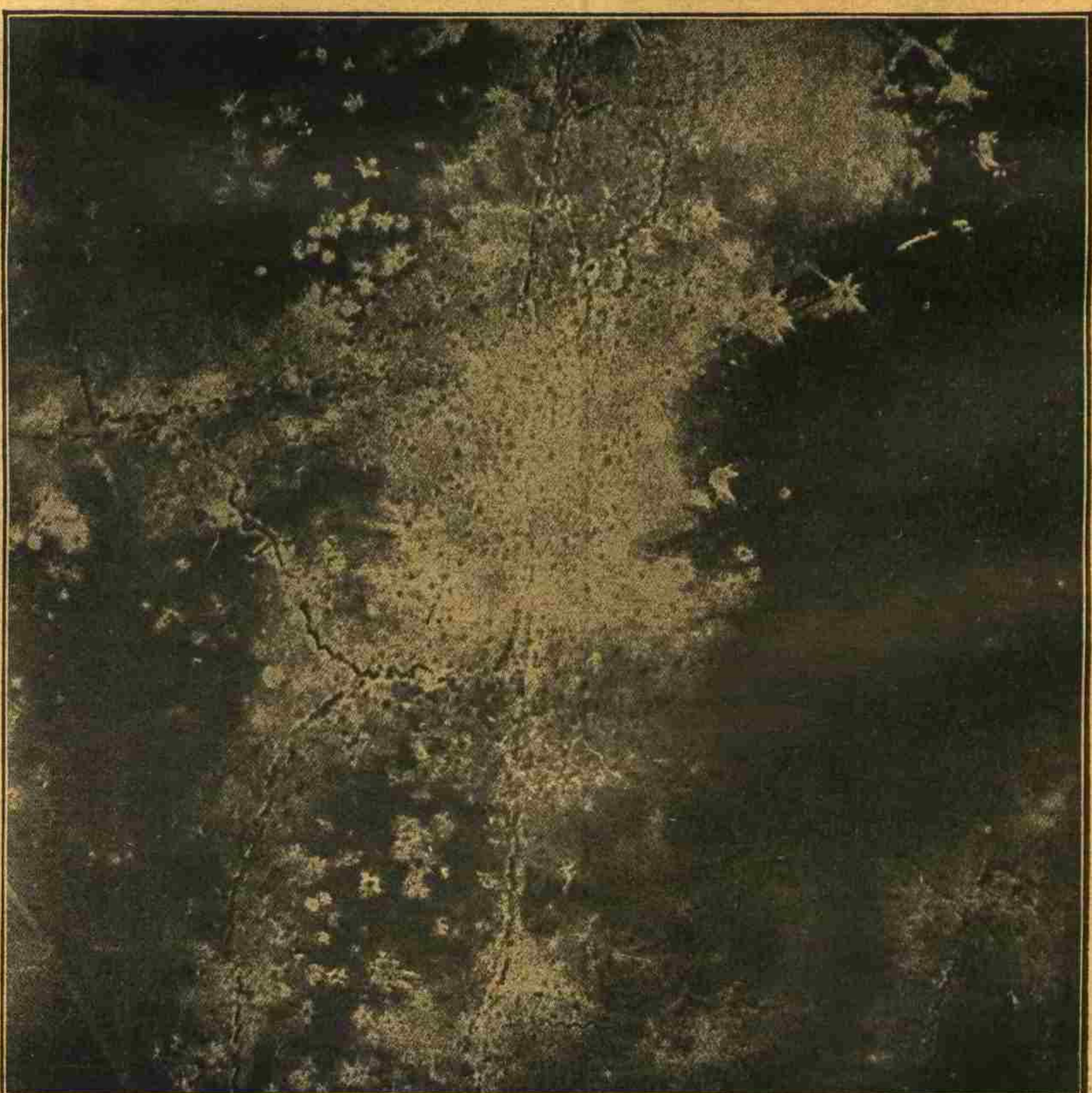
«صوم» حوالیسنده محاربات سیرلرک طویچی آتشدن سوکره طیاره ایله آتمش رسمی

اسوچره متخصصین عسکریه سندن میرآلی (نهغال) «بازلر ناخرینجن» غزته سنده فرانسزلرک (وردون) جوارنده اجرا ایلمکلی تعرض حقنده