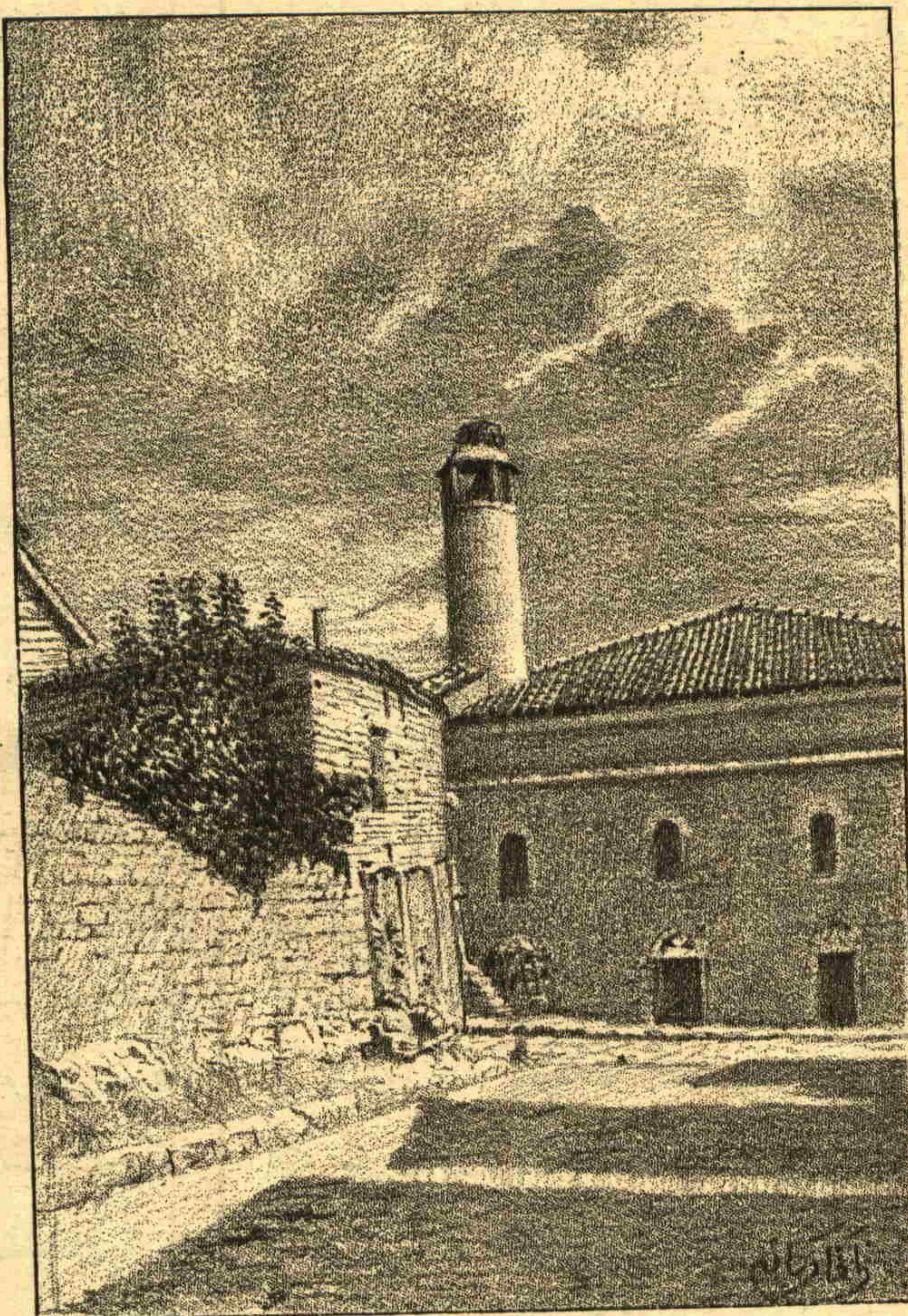
نه‌نستانتانه فوطوغرافيمز : باليکسره چاک قوله‌سی Nos instantanées : La tour de Balikesra

کوله‌یان افندیگ ایپیک فابریقه سنیدن بر قسمنک درونیله عملنک صورت اشتغالی کوسترکه فوطوغرافدن اوتویپی اصولیه ویا نه‌یایدیر- لمشدر، بروسه‌نک ایپیک تجارتنک اهمیتی حقیقه سوزسونیک فضله اولدینی کبی بروسه‌نی زیارت ایدنارجه اشبو تجارتک مهدظهوری اولان فابریقه- یقه‌لری کز مک ده اک خوشه کیدن تماشادن اولغله بو خصوصه دخی علاوه مقال نابجادر . غزته‌لر ستوننده شهر مذ- کور ایپیک تجارتک امر توسیعی ایچون سایه صنایعویه حضرت پادشاهیده تاسیس اولنان دارالحربک هر کون تفصیلاتی کوریلور، کذلک ایپیک تجارتکنک خداوندکار ولایتی محصو- لات محلیه سننده اک مهم عد اولندیقی بیلنور . بز بوراده یالکز ایپیک فابریقه لرندن برینک دروتی قارینه ارانه ایله رسملی غزته‌چیلک وظیفه سنی ایفا ایدر بو وظیفه‌نی ایضا خصوصنده بزه فوطوغراف المق وکوندر- مکله معاونت ایدن سعید بک افندی به‌تشرک ایدر . و بوکبی همتلرینک دایما توالیسنی رجایلرز .