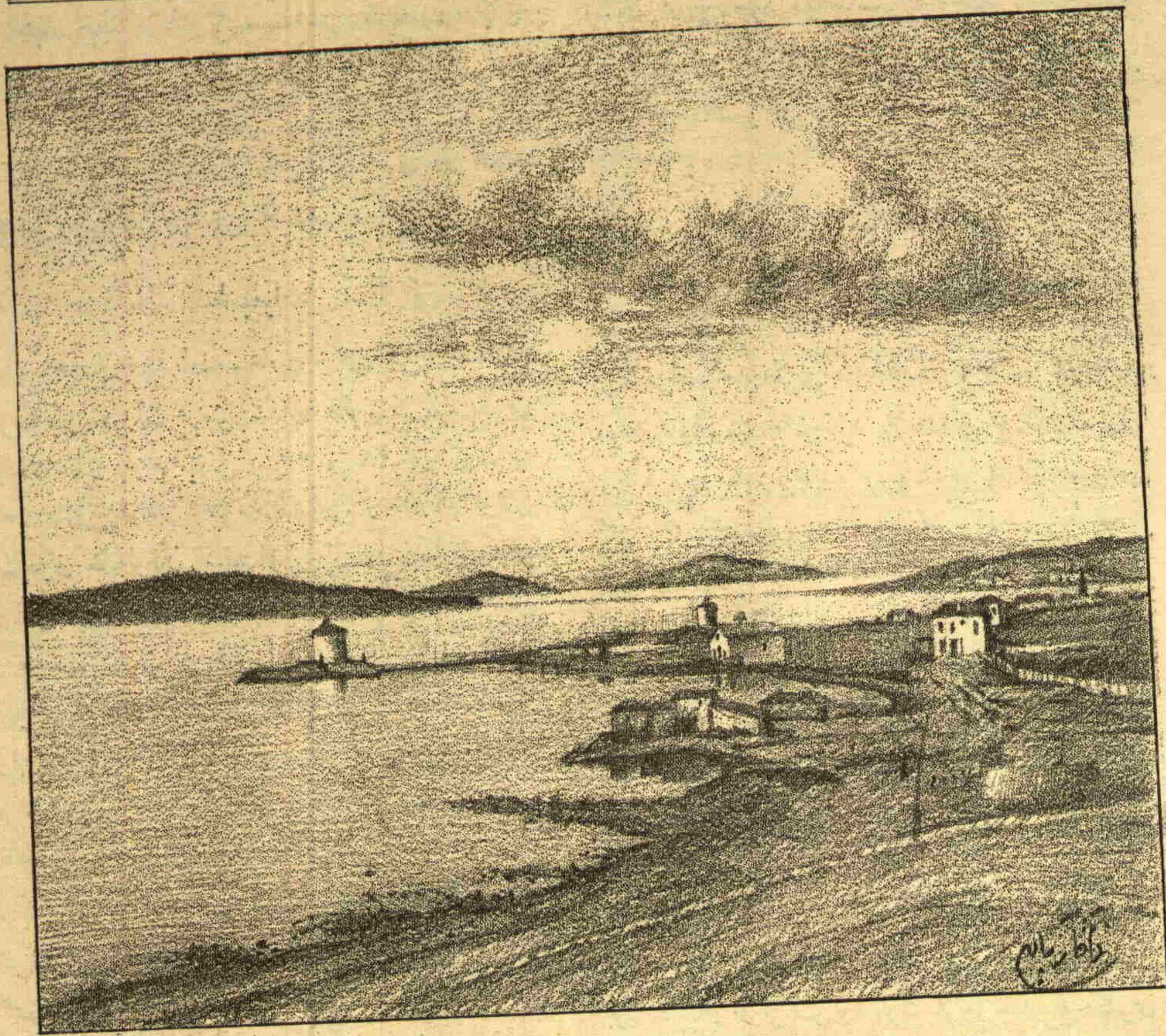
نه‌نستانتانه فوطوغرافيمز : آیوالقک شمال جهتمدن منظره‌سی Nos instantanées : Une vue près d'Avvalik

و شرقاً ، بالیکسری ویغادیچ قضااری جنوباً آیدین ولایتی وغرباً آطهلر دکزبله محدوددر . قضای مذکوره مربوط ناحیه اولدینی کبی یالکز ( ککوچک ) قریه‌سنی شامل اولوب بوندن بشقه قراسی دخی یوقدر . نفوس عمومیه‌سی ( ۲۰۶۳۰ ) راده- سنده اولوب ( ۵۳۲۰ ) خانه‌سی واردر . آیوالق قصبه‌سی مرکز قضاار . قصبه مذکوره آطهلر دکزی ساحلنده نامنه منسوب برکورفرزده وغایت نظربا بر موقعه‌ده کآن وع قریه ملحقه ( ۲۰۶۳۰ ) نفوسی حاویدر .