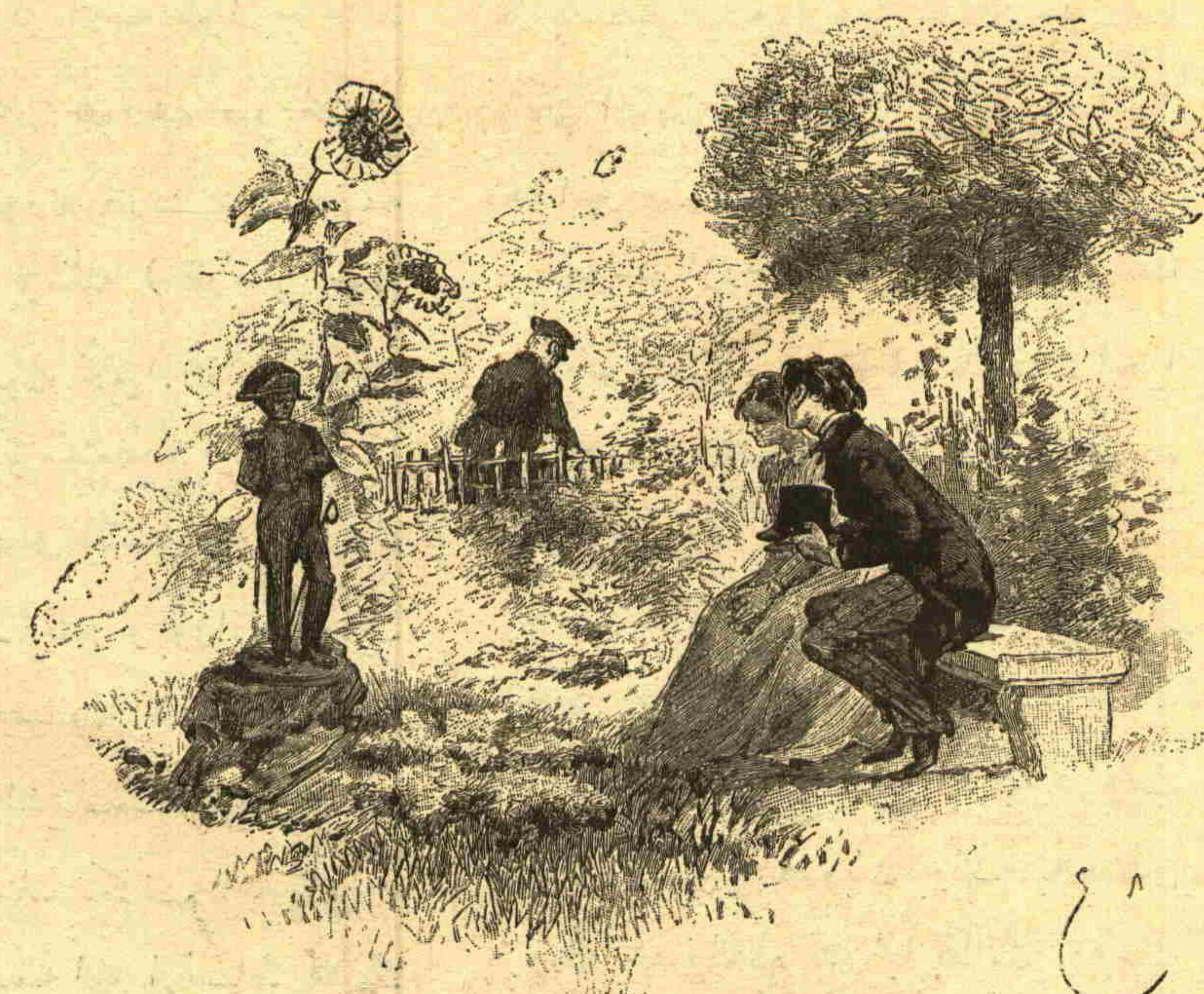
رومانگ رسمندن قارشیدنی هیلك انظارى تحتنده اعلان محبت ایتدی [صحیفه ۳۳۶]

کلی اداره ایلیور، اونگ سایه‌سند ارزو ایلدیکی شیلر- ی دوشنیور . — غارسون برآبست دها ؛ آبست سایه- سند موسیو ویولهت کندینی حال نوجوانی ده ، سویکی لوسینک انظار محبتی آلتنده بولیور .