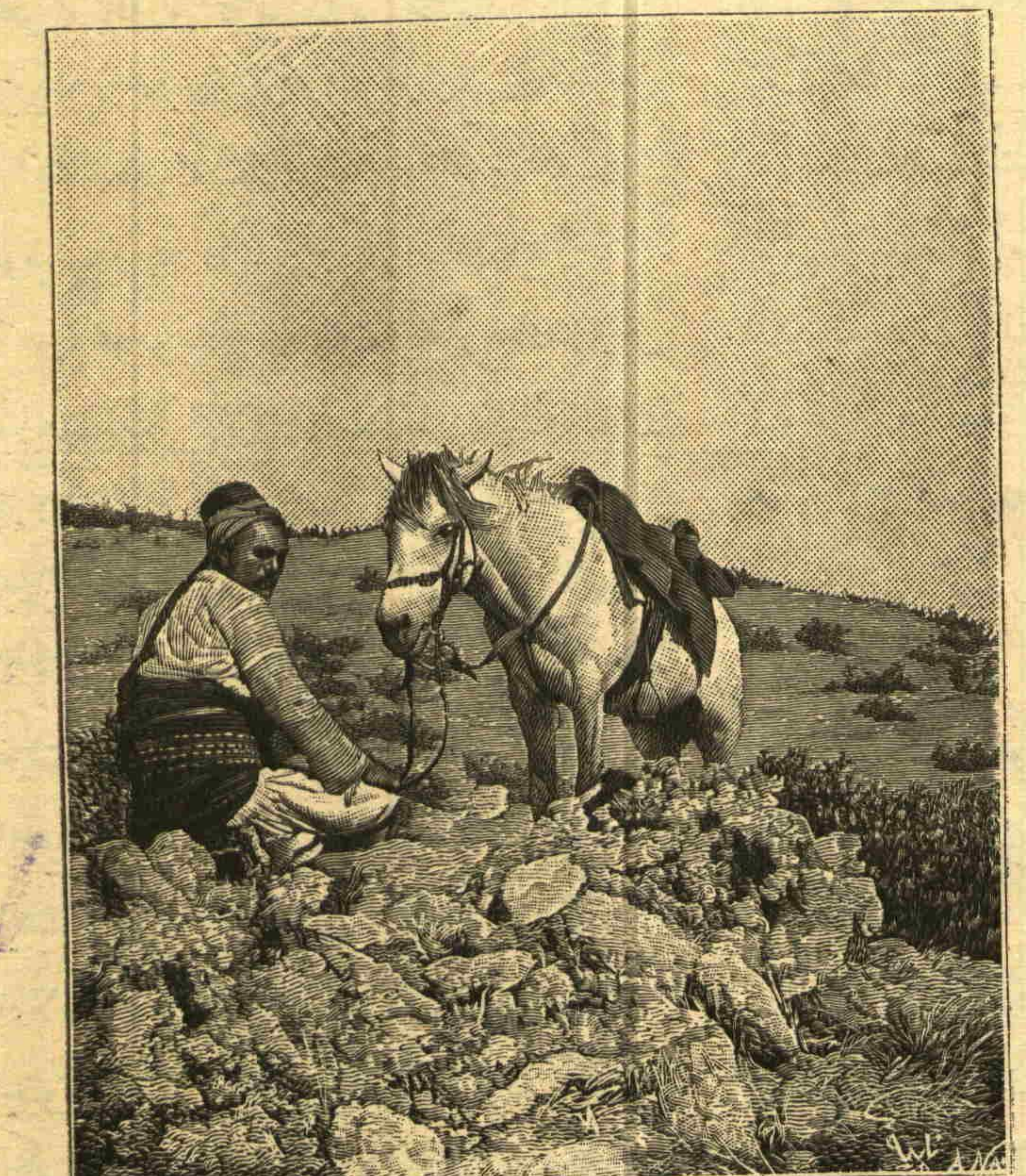
نه‌نستانتانه فوطوغرافيمز : ادرمید بولنده بر آنلی Nos instantanées : Un cavalier sur la route d'Adramith

بروسه معارف مدیری عزت‌لو سعید بک برادرمن طرفندن آلتش برطاقم لطیف فوطوغرافلرک غزته‌منه اهدا ایلدیکنی ، ۹۹ نومرولی نسخهمزه مومی‌الیهک بر فوطوغرافدن اعمال ایتدیریلن رسم درج اولنورکن سونلشمیدی . بو کونده سعید بک افندیگ بالخاصه غزته‌من ایچون آلدینی بر دیگر کوزل رسمی ایپیک صحیفهمزه درج ایلورز ، رسم بروسه‌ده مشاهیر تجارانندن