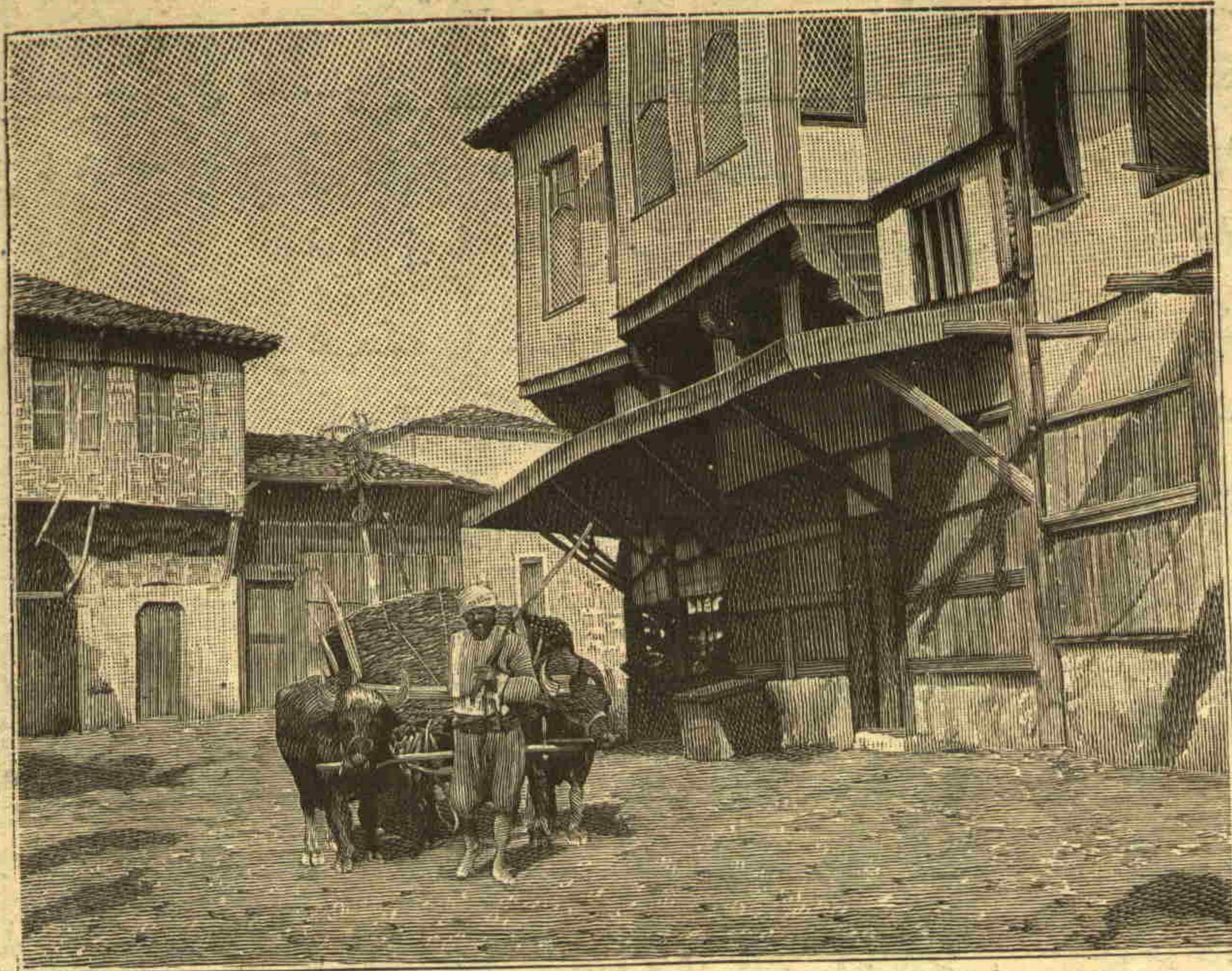
نسناتانه فوطرغرا بلریمز : بالیکسره برسوقاق Nos instantanées : Une rue à Balikesra

مکتوب یازمق . . . دوساثر خصو صانده الی ایلق تحصیل ایله انکلیز محررک چو جقلری تعجب اوله جق درجه ملکه ورسوخ کوسترمشلردر . بونلرک تحصیلنه تعجب ایتمک احتمالی شمدی به قدر مرعی اولان اصولک فالغنه الشقندن ایرو کلور . انکلیزک هیچ فرانسزجه نیلیان ایکی چوجنی طرز تکلم ایله ، صورت افاده ایله الی آئی ده فرانسزجه دوشونمکه آ لشدقلری نی اثبات ایده جک قدر مهارت کوسترمشلر .