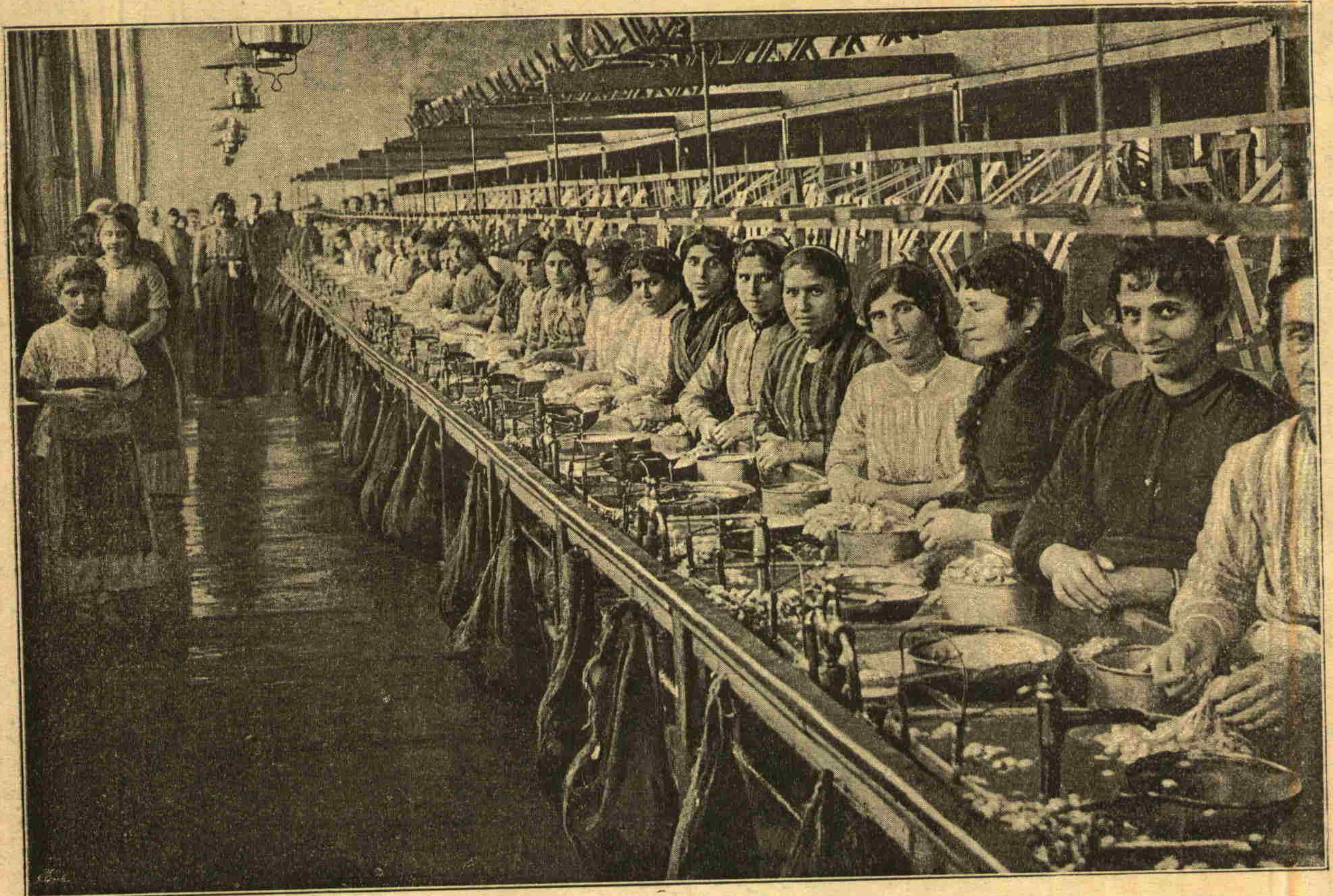
بروسده بر اییک فابریقه سنک درونی