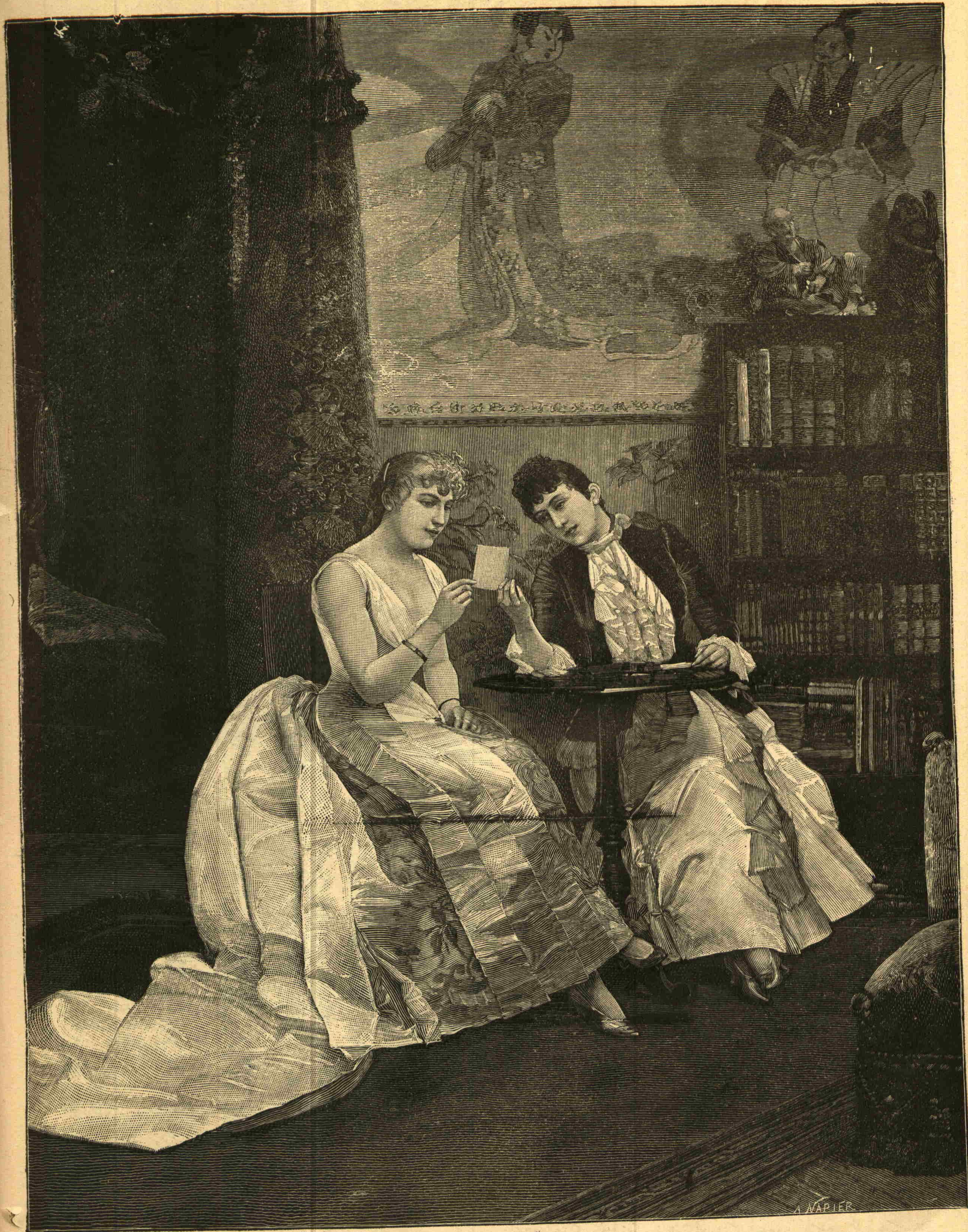
صنایع نفیسه دره تابلو : ایکی رفیق

یازین منطقه معتدله تک حرارت حیات بخشاسیله نشو ونما بولان محصولاندن دانه چین اولورلر ، یاورولری بسلرلر . صفوقلر