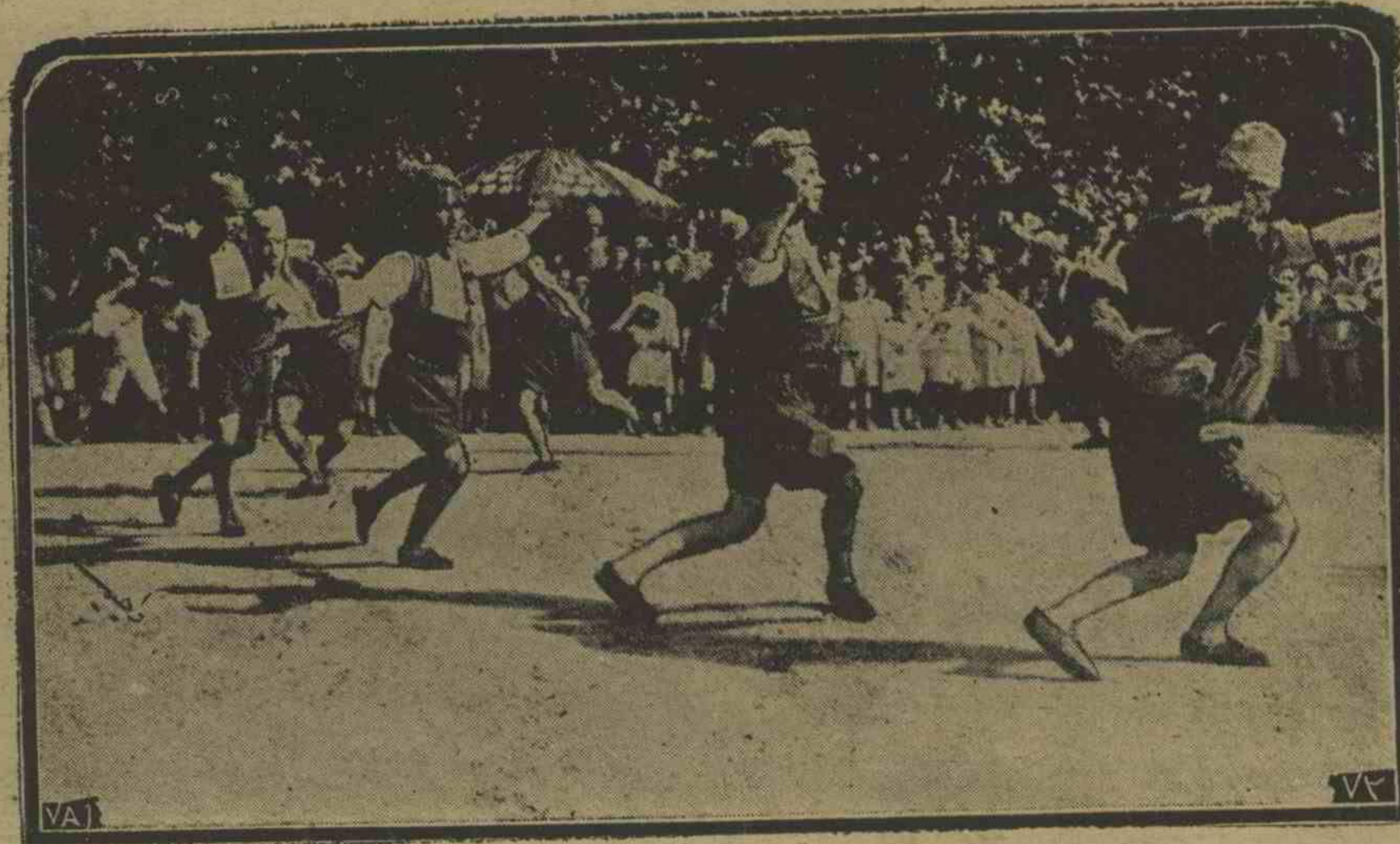
ازميرده دوچار فلاكت اولئر منفعته كچن جمه كاخانه بارقنده وبريلن اكنجهده ازمير زيبيك اويونى La danse des Zeibeks.