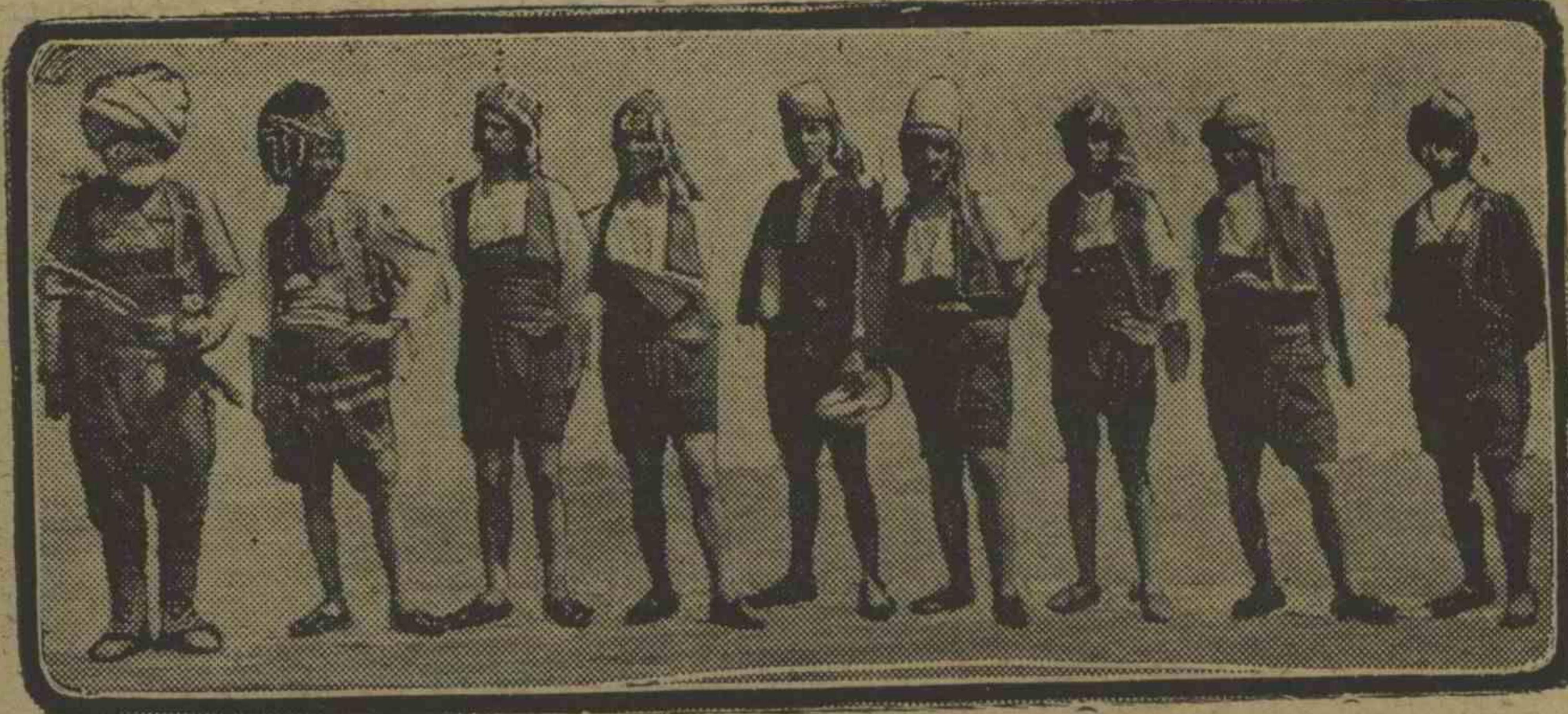
ازميرده دوچار فلاكت اولئر منفعته كاخانه بارقنده كى مسامره به اشتراك ايدن مهترخانه موسيقى طاقى.

La troupe musicale de Mehter-hané. Les vues de la Kermesse donnée le 8 août 1919 dans le parc de Gulhané aux profits des éprouvés de Smyrne.