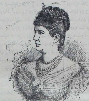
المیایا ایمبراطوریهی حشماتلو آوغوستا ویستوریا حضرتاری