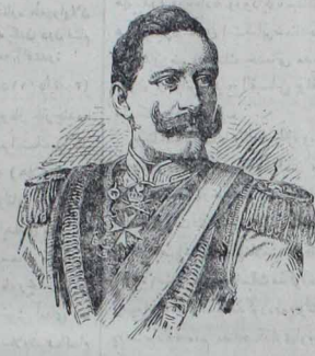
المیایا ایمبراطوری حشماتلو ایکنجی ویلهلم حضرتاری