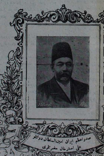
صدر اعظم ایران امین السلطان دولتو علی اسرارخان حضرت لری

جداً بک بیوک موقیاقہ نائل اولشار و بوخسن خدمت و صد اقلرنہ مکافاۃ شاہہ مقفور حضرت لرنیک مظہر اعجاب شہریاری اولوب ہوز اعراضہ عنوانیہ ریاست وزاری ایرانیہ بہ نصب اولشار ایدی . برمدت سکرہ شاہ مرحوم طرفندن لوازم صدارندن بولانہ قلمدان مرصع و و صدر اعظم و عنوان عالیسی و برلشدر . صدر مشار الہ حضرت لری اولن ایکن سنہ دن بری ایران مقام صدارندہ بولنقدہ درلر . صدر مشار الہ حضرت لری بٹون دول معلمتہ نک اک بیوک اشان لری حامل بولنقدہ در . ولی نعمت فی امتنان بادشاہ مکرمہ عنوان افندس حضرت لری امتیاز نشان فروغ افشانک برقلمہ مرصع سنی بدویدہ جناب خلافتناہ اعظملر لہ صدر مشار الہک سنہ صد اقدت و رونقہ تعلق و مشار الہی بصورتہ غریق فض و مہابت بی بیان بیور مشلدر .