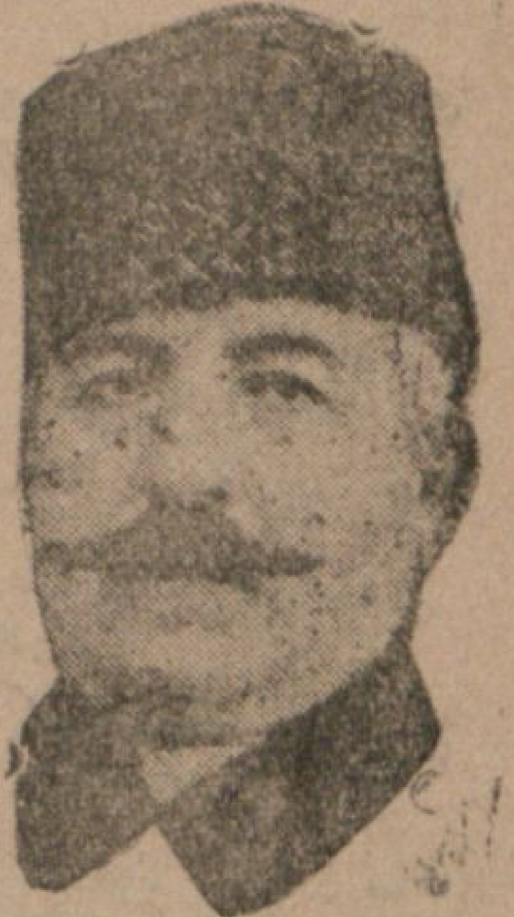
و صفت حاضره من حقتده شانان وقت یانانده بولنان صدر اسبق احمد عزت پاشا

بواجتماعلر حقتده لطفاً بر آرز معلومات و بره یلمیریمکیز ؟