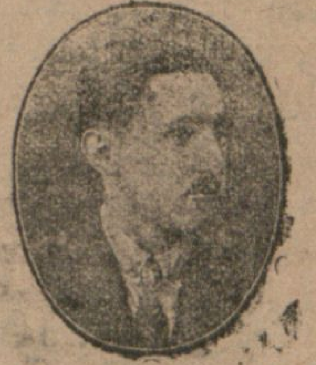
غالب غلظت سرای واقندن

برنجی غلظت سرای قازانی (غلظت سرای) تربیه بدنیه فلوری طرفندن ترتیب ایدلش اولان و برمدن بزی