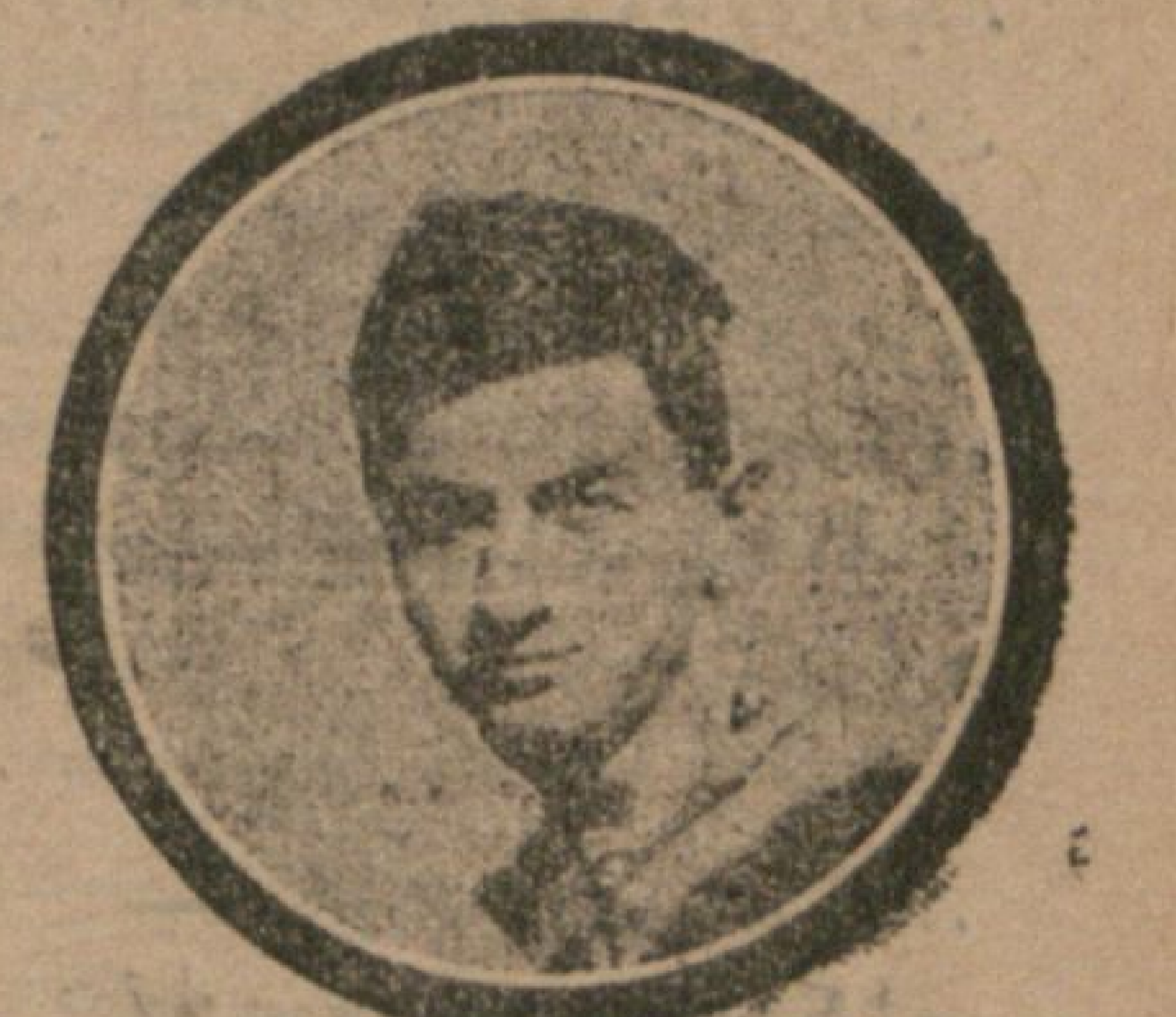
مغلوب فناز باغچه طاقندن

استانبولک اک اسکی، حتی ابک تورک فلوری اولان (غلظت سرای) بوسا بته ده، فوق الما مول بر وقت کوشه ش واستانبول شامیونی اولان فناز باغچه طاقلی بره قارش