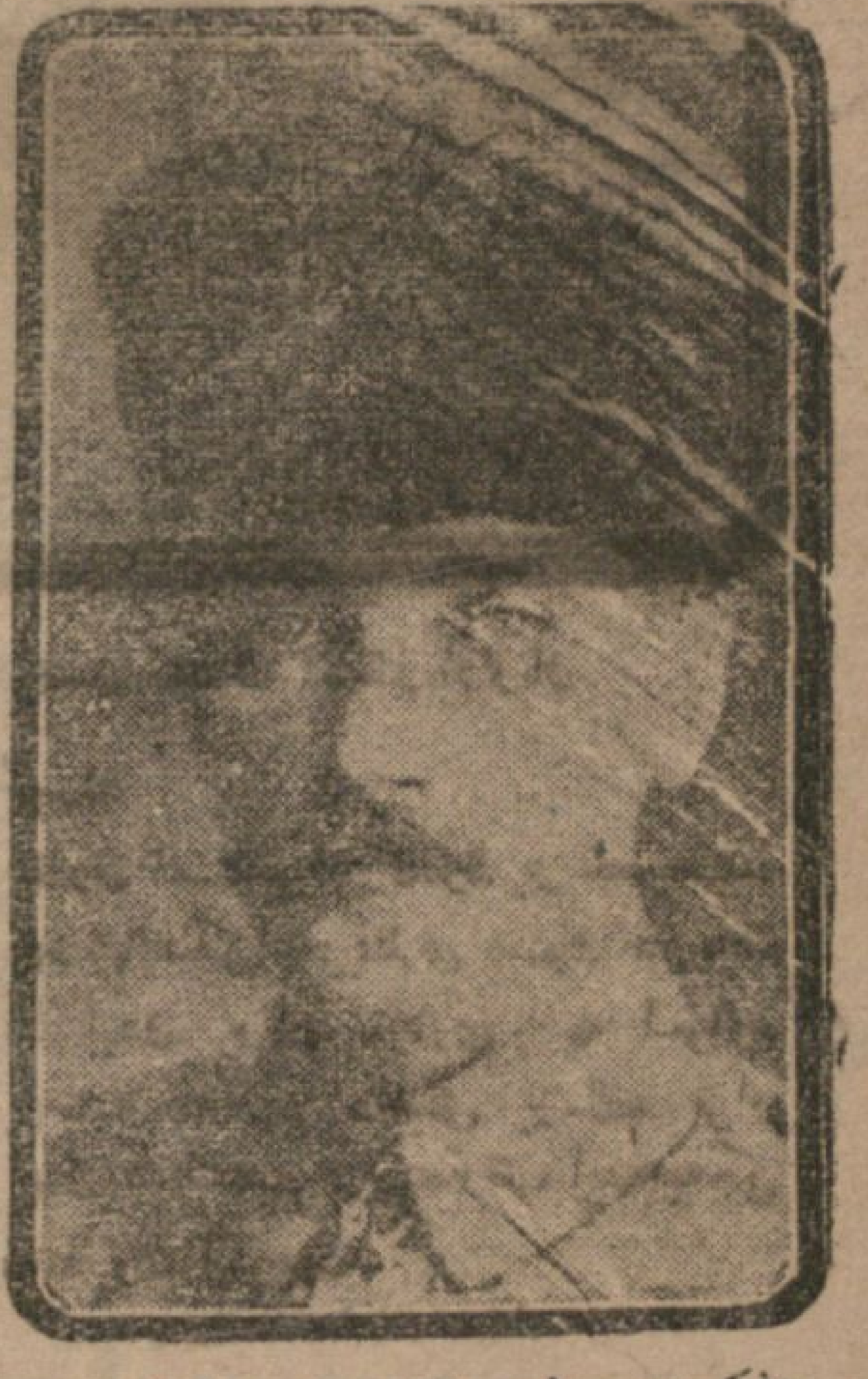
مفکرده در دوزخ چاپکده برضام وثبات ایله یازین ملی قهرمان