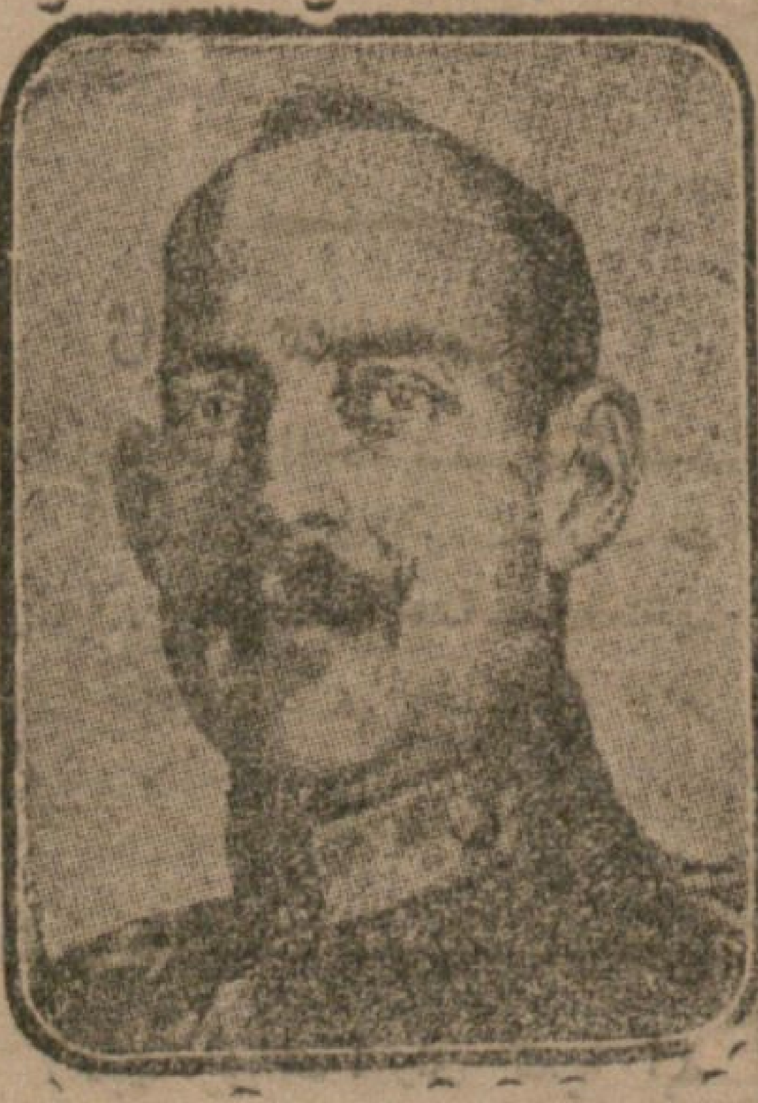
بویوک ولولرله ججه - یا آتیه قانقدن عی حالده شمدی سوکوم بولکوم دربرنه دالان

روما ، ۲۰ ( ز. د. ) - ( استهانی آژانس ) نسر ایدیور : موسیو ( بریان ) ایله لورد ( کوزون ) آرمسته ، قوت ( اسفوریا ) نیک مثلی موسیو ( بون لوفناره ) دخی حاضر اولدی حالده وقوع بولان تمامی امکار ائتلافنه یونان - تورک ائتلافنک تسویه سی تأمین ضمننده بیلدیرمسی مشترک تشبث حقنه ائتلاف حصوله کتیشمشدر . ایالتیانک بوندوبه اشتراکی شبهه دن عاری ایدی . چونکه بوتیمت مساعد برزمینه آسادی ایچمی شریله ایدار برصلح وشرق قریب مسئله سی ایچون عادلانه بر صورت تسویه تأمیننه صالح اولونق اوزره هر زمان و یونانستان متفق نامته اوله رق ایالتیانک دریش ایدی پی بر طریق ایدی . مجلس عالی ، پارسده ایچون ایدیلن قرارلره دعا مثبت بر شکل ویرمک ایچون قریباً اجتاج ایدیله جکدر .