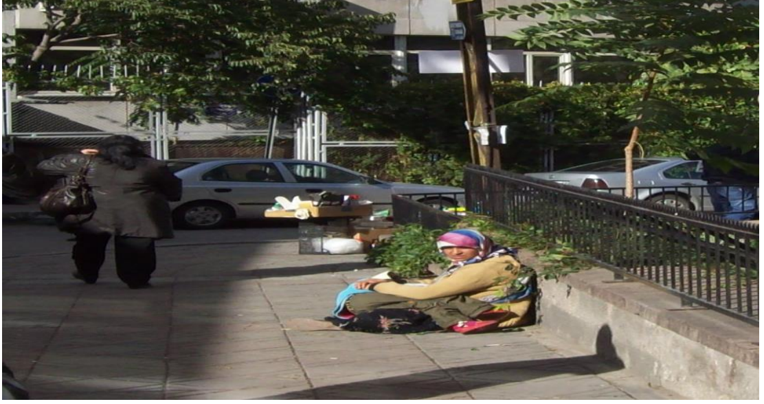
Resim 48: Kızılay Bayındır-1 Sokak'ta kucağında çocuk tutan bir dilenci.