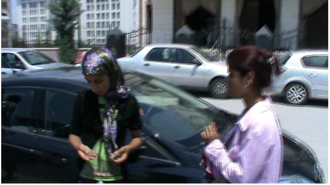
Resim 78: Caminin arkasında yakalanan dilenciler.

Bir anda, aniden yanında beliren zabıtayı gören dilencinin ilk söylediği sözler genelde “şimdi geldim, daha avcumu bile açmadım”, “ben geldim, arkamdan sen geldin” olur. Bu, üzerlerinden çıkacak paraya zabıta el koymasın diye yapılan bir taktiktir. Çünkü zabitanın “dilencilikten kazanılan paraya el koyma” yetkisi yasal olarak vardır. Fakat hangi paranın dilencilikten kazanıldığı hangisinin kazanılmadığı ayrımı da epey muğlâktır. Bu nedenle dilenciler para kazanmadıklarını söyleyerek baştan “üzerimden çıkan para kendi param, dilencilikten kazanmadım” deme yoluna giderler. Dilencilerin yakalandıkları an başvurdukları bir diğer taktik ise “ben dilenci değilim” demektir. Dilenciler dilenmedikleri anlarda toplum içinde görünmez olurlar. Lakin daha önce de ifade edildiği gibi zabıta -tanıdıkları dilencilerin haricinde de- birinin dilenci olup olmadığını anlayabilmelerine rağmen dilendiğini görmediği dilencileri almaktan imtina ederler. Dilenmediği anlarda kişi dilenci olduğunu rahatlıkla inkâr edebilir. Bunun farkında olan dilenciler de zaman zaman