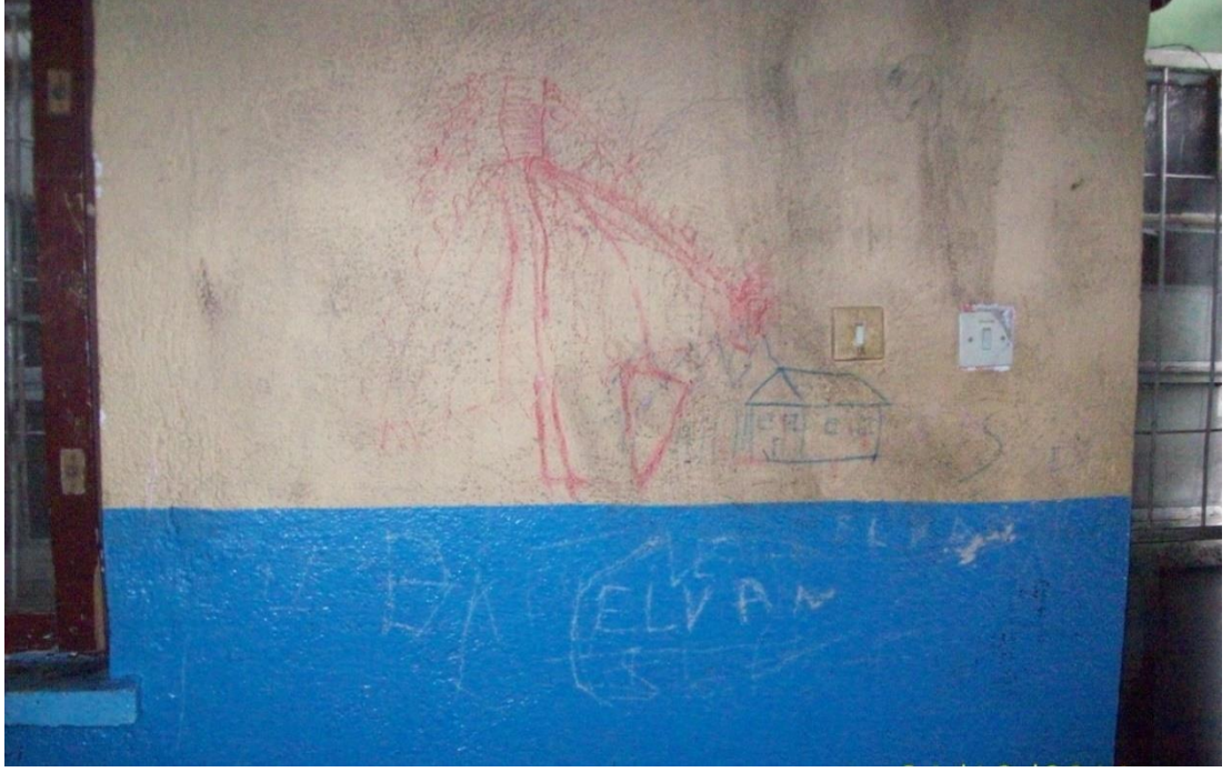
Resim 19: Barınağın içi- duvarlar.