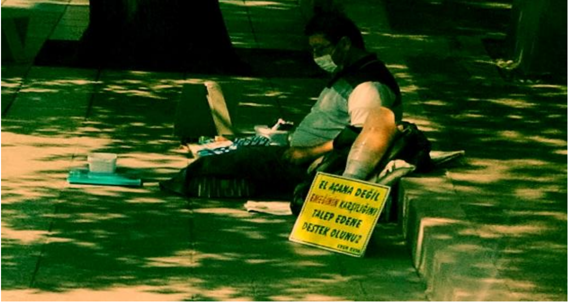
Resim 61: Yanında “el açana değil emeğinin karşılığını talep edene destek olunuz” yazısı varken önünde de mendiller, kalemler ve tartı bulunan bir dilenci. Bu yazının hemen arkasında da protez bacağı dik olarak durmakta ve ağızındaki maske ile de hasta imajı oluşturmaktadır.