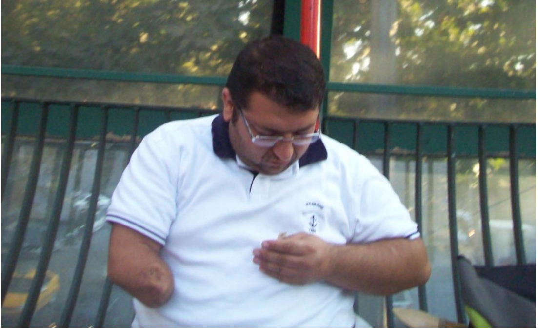
Resim 62: Kızılay üst geçitlerinden birinde dilenci tek eliyle paralarını sayarken