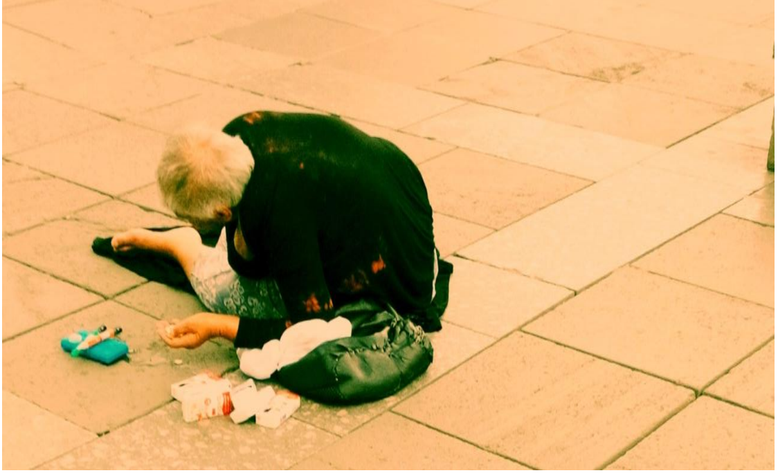
Resim 40: Yine önünde insülin iğneleri duran kadın. Bu kez ayakları çıplak ve önünde yere gelişi güzelce atılmış birkaç mendil mevcut.