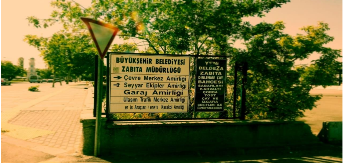
Resim 7: Hipodrom Caddesi'nden “Dilenci Barınağı”nın da içinde bulunduğu Zabıta Müdürlüğü'ne dönüşü gösteren tabela.

Bu barınak Ankara Garı'ndan Konya Yolu istikametinde Hipodrom Caddesi üzerinden girilen bir saptan yaklaşık yüz metre kadar içeridedir.