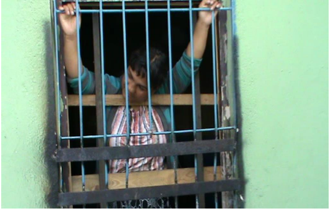
Resim 32: Barınak penceresinde bir dilenci poz verirken.