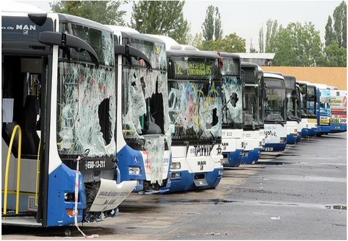
Resim 8: Tabelanın hemen arkasındaki boşlukta kurulmuş olan ve Gezi Parkı olayları sırasında hasar gören otobüs ve Belso arabalarının sergilendiği “Vandalizm Müzesi” 137

Belediyenin tesislerine giden bu yol ayrımının cadde üzerinde bir tarafında Gezi Parkı eylemleri sırasında hasar gören belediye otobüsleri ve Belso araçlarının sergilendiği “Vandalizm Müzesi” bulunmaktadır. Diğer tarafında ise belediyenin fen işleri tesisi bulunur. Fen işleri tesisinin sapağa denk gelen köşesinde ise çöp ve tıbbî atık kamyonları vardır.