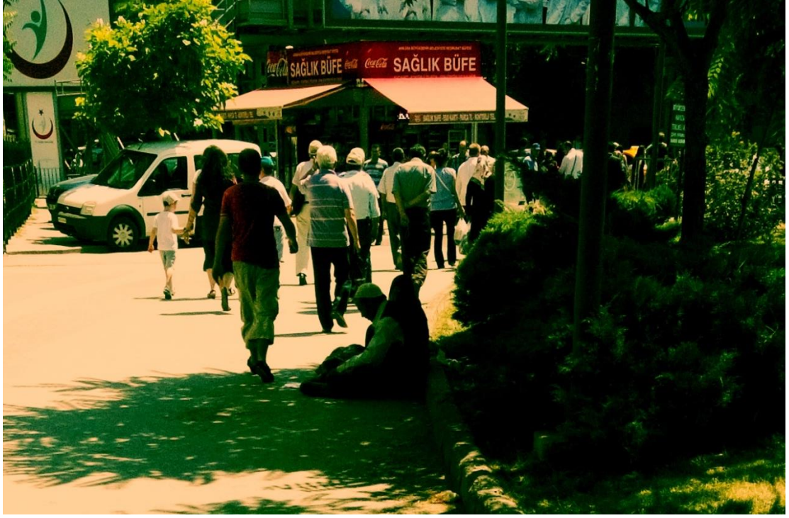
Resim 38: Sıhhiye Abdi İpekçi Parkı'nda Suriyeli pasaportlu dilenci bir aile yerde oturarak dilenirken.

Fakat dilencilik işi daha çok gayri resmî belgeler üzerinden yürümektedir. Burada gayri resmî belgelerden kastımız; sunulan sahneye güvenilmesini bekleyen, rapor, pasaport...vs gibi resmî belgeler göstermeyen onun yerine fakirliğin bir belgesi olarak çıplak ayakla dolaşma ya da hasta olduğunu belgelemek için önüne bir insülin iğnesi koyma gibi performanslarla, izlenimlerle yaratılan belgelerdir. Bu şekilde vesikasını yaratan dilenciler sundukları performansın karşılığında kendilerine inanılmasını ve bunun sonucu olarak da para verilmesini isterler. Bu bağlamda çalışma kapsamında karşılaşılan bebekle/çocukla dilenenler, pis/yırtık/mevsime uygun olmayan kıyafetler giyerek dilenenler, çıplak ayakla dolaşarak dilenenler, hasta olan yakını ile dolaşarak dilenenler, kendisi solunum maskesi takarak ya da bedenini sararak hasta performansı sergileyerek dilenenler vesikalı dilenciler olarak