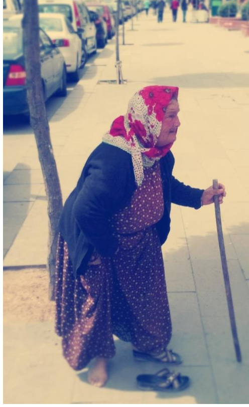
Resim 63: Turan Güneş Buvarı'nda çıplak ayakla dilenen yaşlı bir kadın zabitanın onu arabaya götürmek istemesi üzerine eteğinin altından çıkardığı terliklerini giyerken.