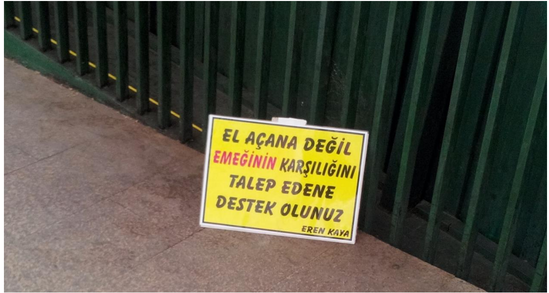
Resim 44: Yine aynı yerde bulunan “emekçiliğin” vurgulandığı yazılardan bir diğeri.