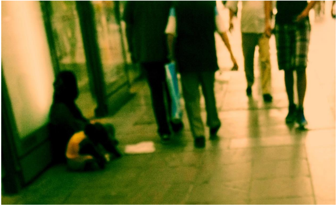
Resim 37: Kızılay Atatürk Bulvarı'nda önlerine pasaport açarak ve yerde oturarak dilenen Suriyeli kadın ve çocukları.