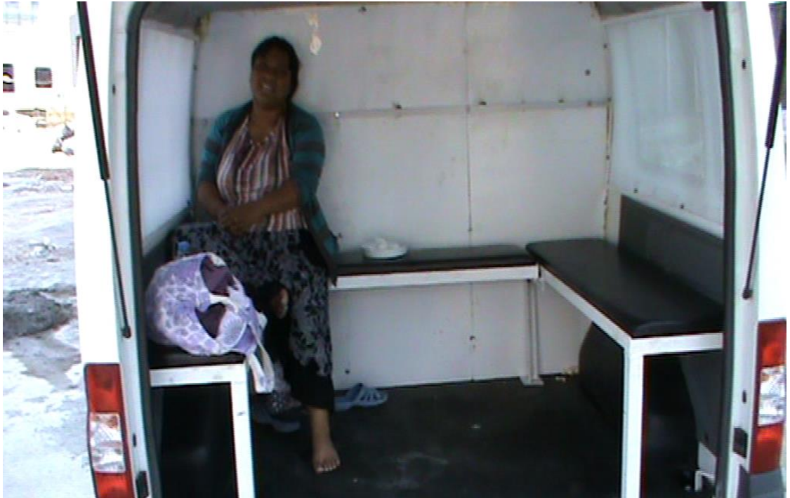
Resim 3: Zabıta arabasında bir dilenci.