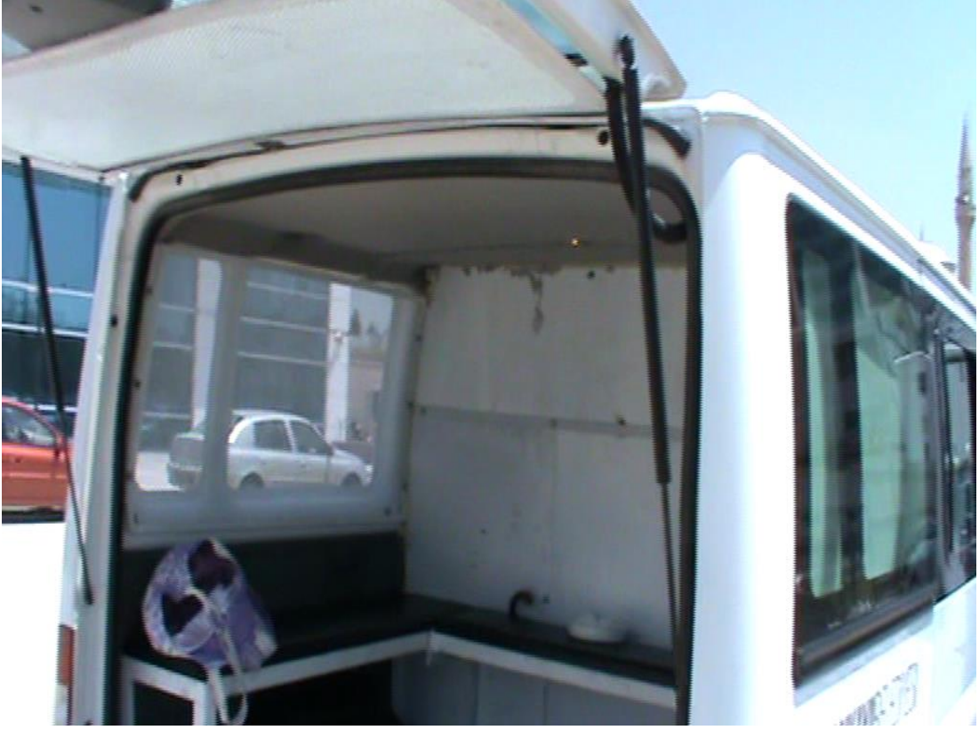
Resim 1: Dilenci toplama arabasının dilencilere ayrılan bölümü.

Alan çalışması sırasında benim de sıklıkla dilenci peşinde zabıta ile şehri kat ettiğim arabalardan bir tanesi dışında hepsi bu şekilde dilenci ve zabıta arasında fizikî erişimi engelleyen biçimde düzenlemişti. Araba Çankaya Belediyesi'nin eski bir arabasında zabıtalara dilencileri demir kafesli bir cam birbirinden ayırıyor, her iki taraf bu pencereden birbirini görebiliyordu. Belediyenin çalışmam esnasında yenilenen aracında ise bu bölüm yoktu. Arabanın dilencilerin konulduğu tarafında ise sağ ve sol tarafta iki tane sadece havalandırma biçiminde kısmen açılabilen kafesli ve dışarıdan görülmemesi için film çekilmiş pencereler, üç tarafı kaplayan oturaklar ve içeriden açılmasına müsaade etmeyecek şekilde ayarlanmış bir kapı vardır.