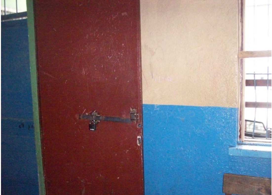
Resim 16: Barınađın içinden iç kapının görünüşü.

Dilencilerin konulduđu odaya açılan ikinci kapıdan geçtiğimizde karşınıza duvarlarında yazılar olan yıkık dökük bir oda gelir. Bu odanın dört tarafında dilencilerin oturması için tahta banklar bulunur. Duvarları alt tarafı mavi ve üst tarafı somon rengi olmak üzere yatay olarak iki renge boyanmıştır. Kirli duvarların üzeri dilencilerin karaladığı yazılarla doludur: “kaderin kör bağları, ölüm dolu yılları, Çinçin’in duvarlarına seni seviyorum yazacağım”. Oda içinde bir kapıyla ayrılan bir tuvalet ve sobanın bağlı olmadığı bir soba borusu deliđi mevcuttur. Dilenci barınađının ön kısmına bakan pencerenin camı zaman zaman kırıktır zaman zaman da hiç yoktur. Zabitanın anlatımına göre dilenciler genellikle bu pencereyi kırarlar.