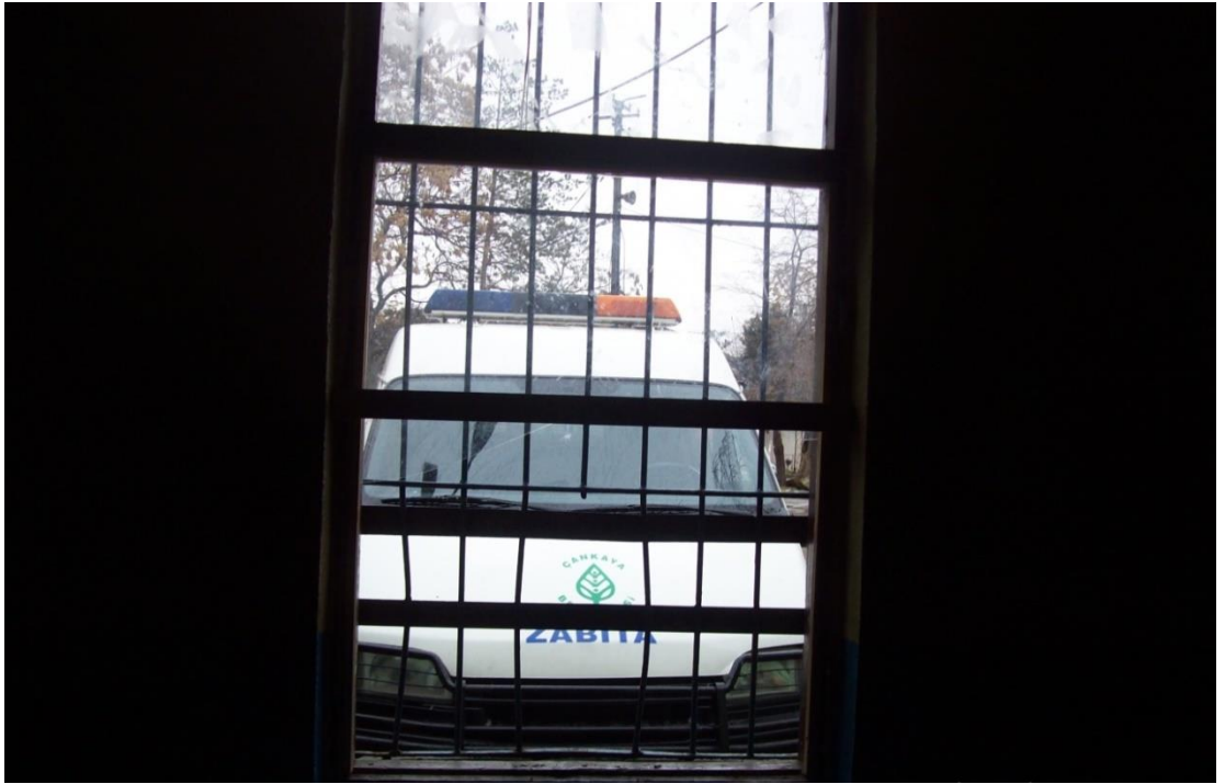
Resim 20: Barınağın içinden dışarı.