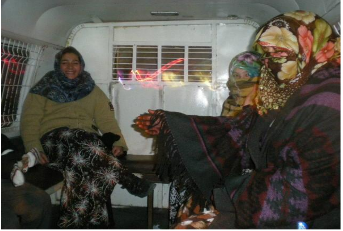
Resim 69: Belediye arabasında dilenciler.