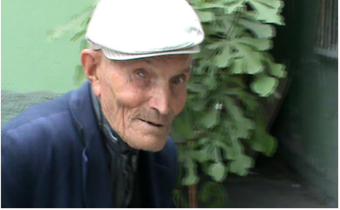
Resim 34: Barınakta bir dilenci.