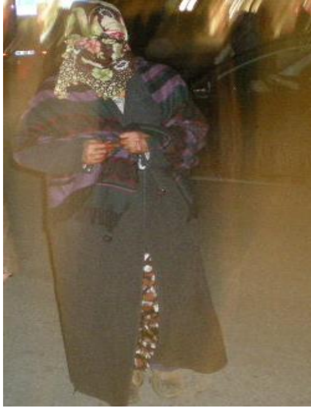
Resim 74: Zabıta tarafından yakalanan bir dilenci arabaya götürülürken.