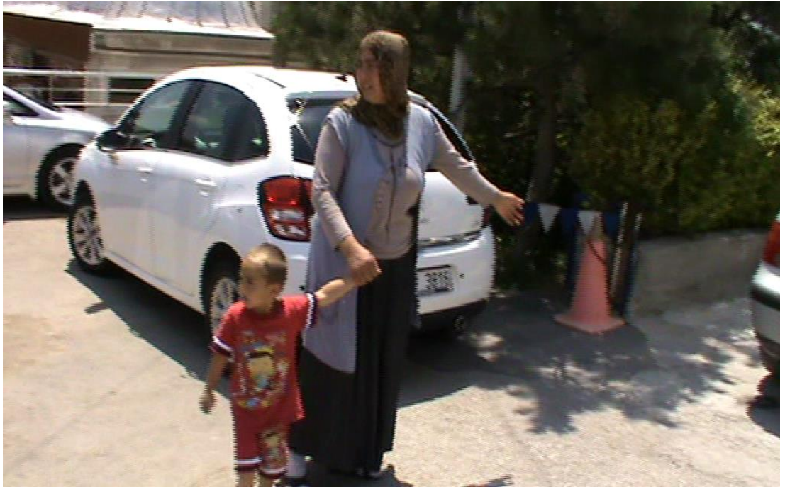
Resim 81: Dilenci kaçırmaya çalışırken.