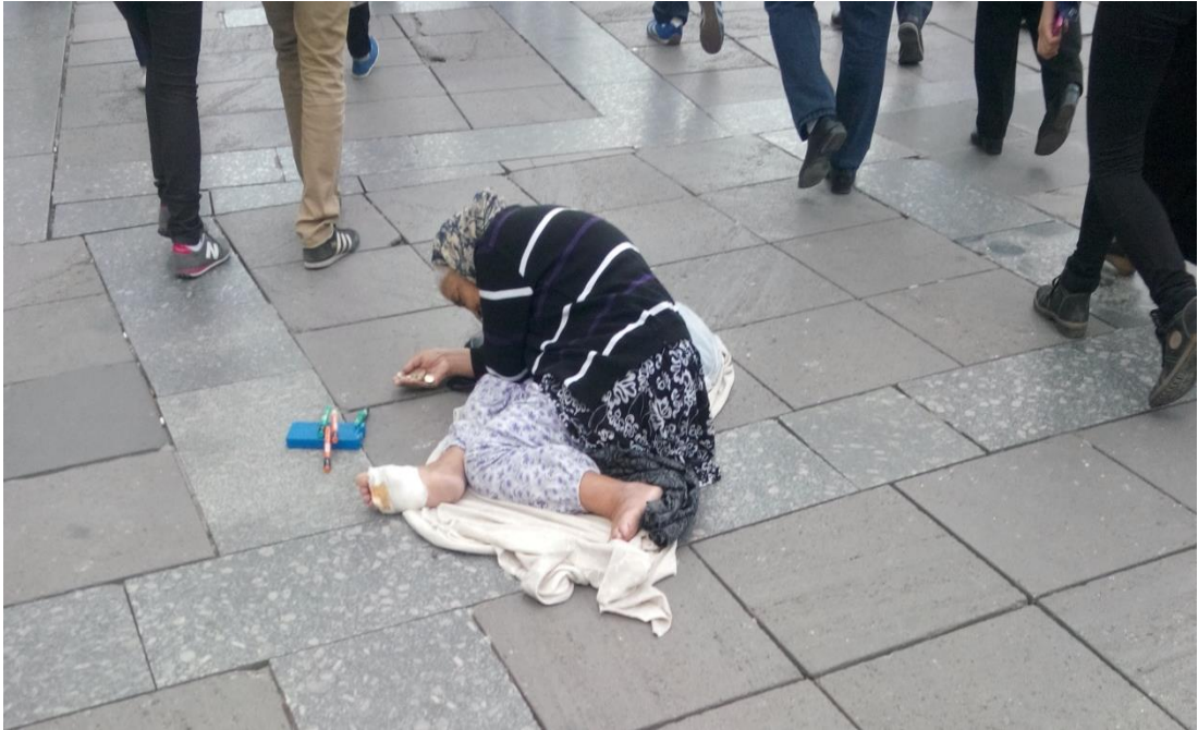
Resim 41: Aynı dilencinin insülin iğnelerine ek olarak bu sefer ayağı bandajlı ve başında örtü var.