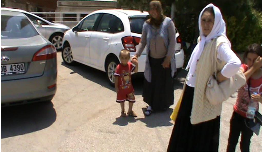
Resim 80: Zabıtaların arabaya götürmeye çalıştıkları dilencilerden elinde çocuk tutan “çocuğumun kazağı şurada kalmış hemen alayım” derken.