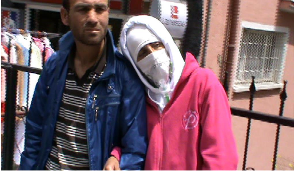
Resim 50: Aynı dilenci başka bir gün Bahçelievler’de.