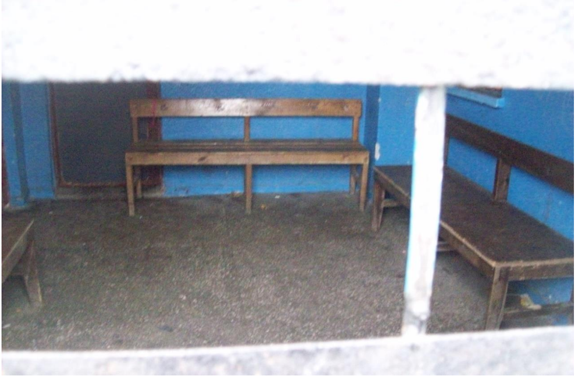
Resim 21: Barınağın dışından içerisi.