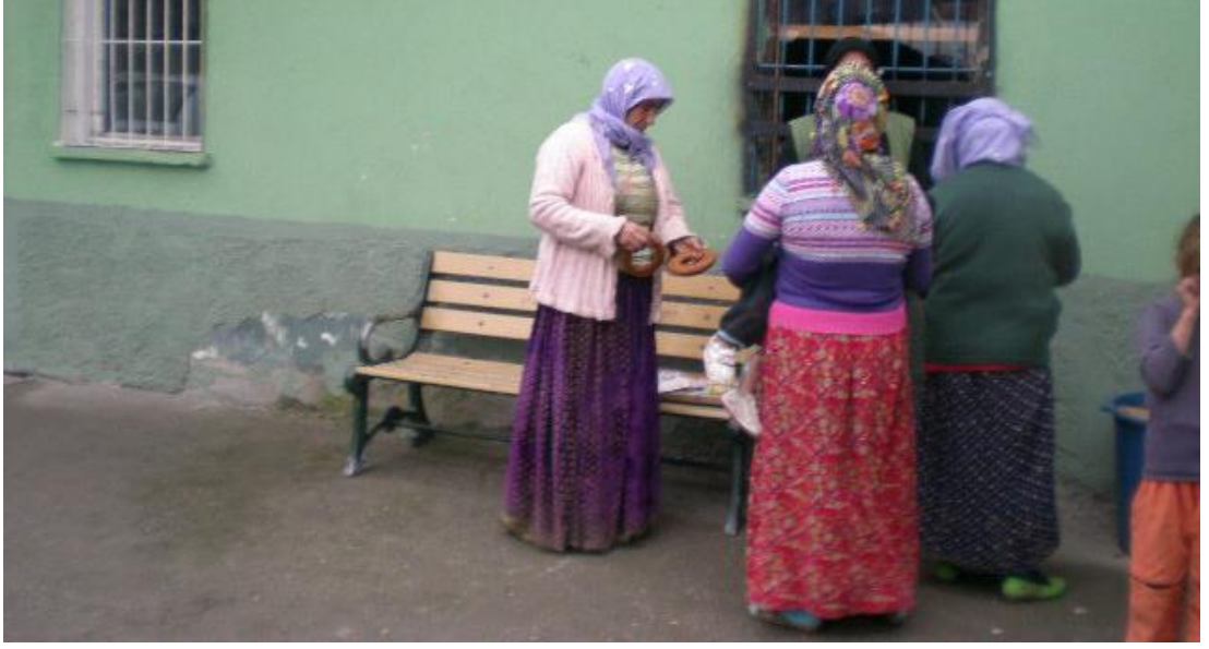
Resim 73: Barınağın önünde dilenciler zabitanın el koyduğu simit tezgâhının simitlerini paylaşırlarken.