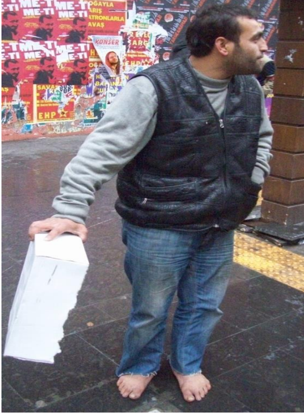
Resim 54: Kızılay Konur Sokak'ta çıplak ayakla dilenen bir dilenci yakalandığında.