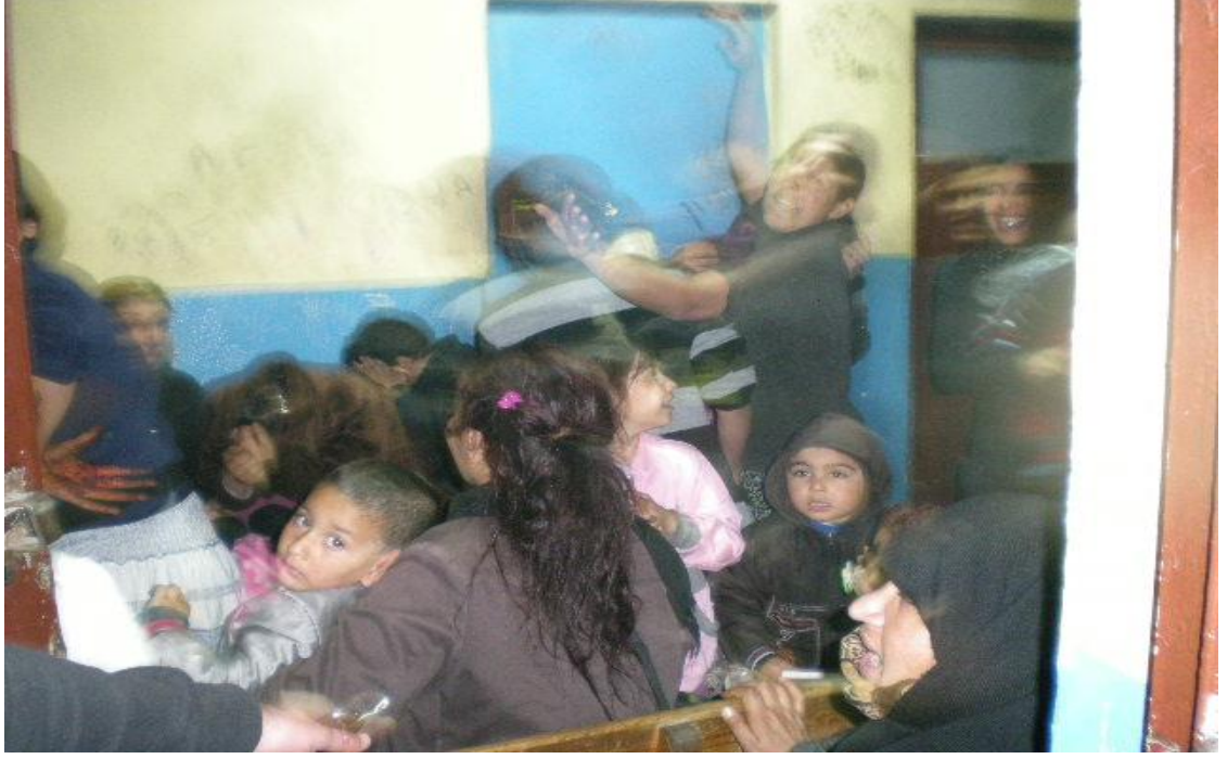
Resim 27: Barnakta dilenciler oynarken.