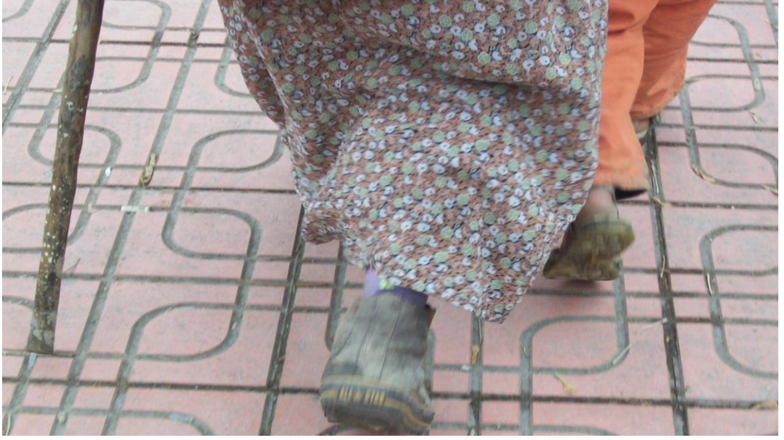
Resim 67: TED hırkalı yaşlı dilencinin Converse ayakkabıları.