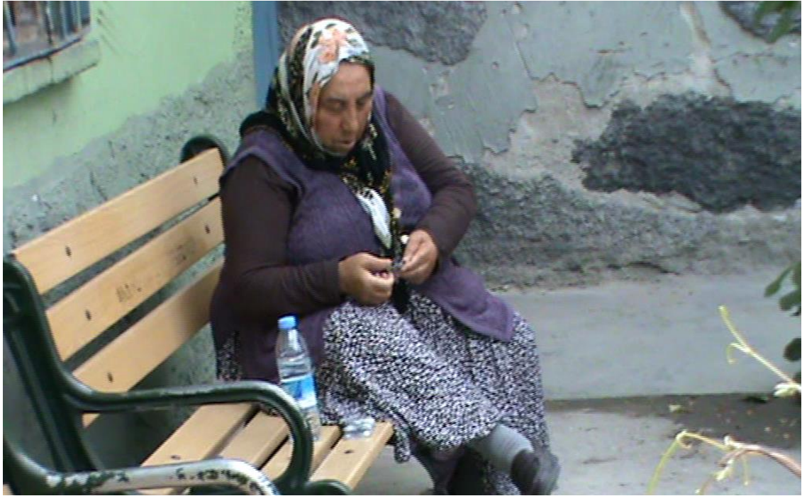
Resim 33: Barınakta bir dilenci ilaçlarını içerken.