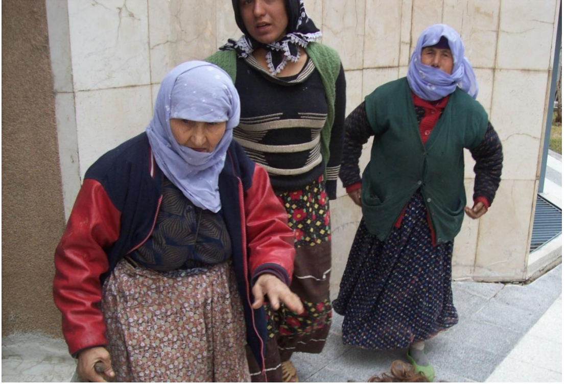
Resim 68: Aynı dilenciler zabıtayı ilk gördüklerinde.