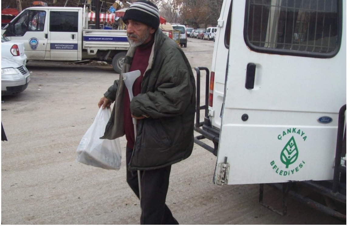
Resim 56: Sadece zabıtarlar ve dilencilerin olduđu bir ortamda koltuk deęneđine ihtiya kalmadıđını gsteren bir fotoęraf.