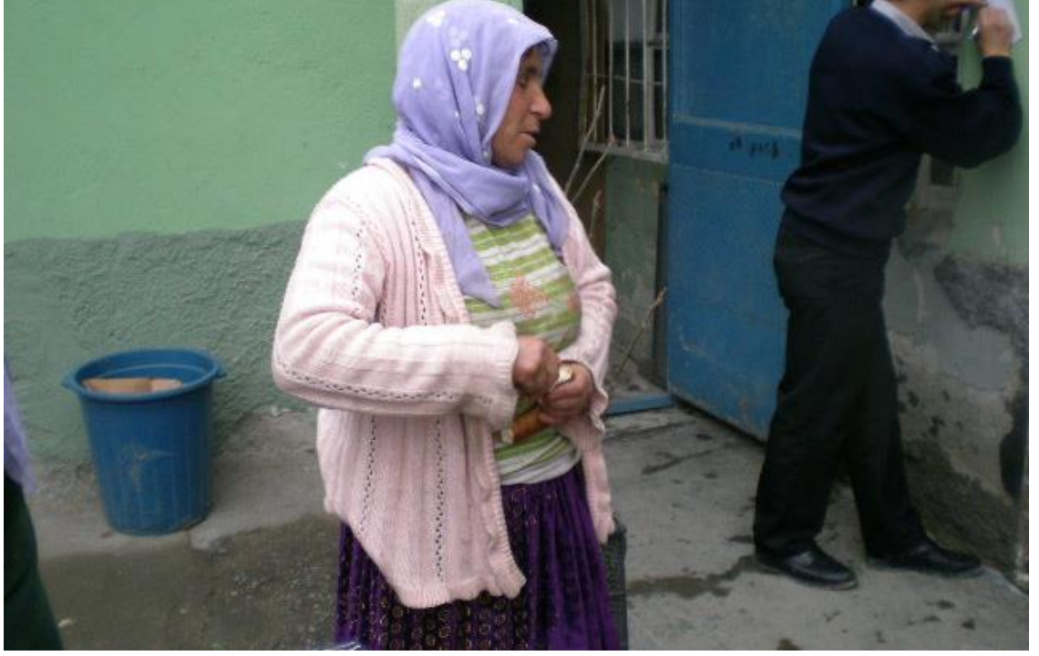
Resim 71: Barnakta bir dilenci.