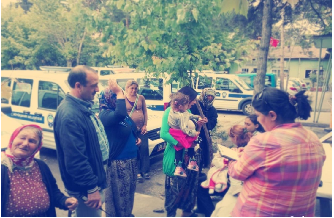
Resim 25: Zabıta tarafından dilenciler kayıt edilirken.

Barınağa geldiklerinde dilenciler zabıtaya hiç sorun çıkartmazlar. Barınak “bir an önce kurtulunması gereken yer”dir ve buranın hâkimi olanlarla arayı bozmak işlerine gelmez. Nihayetinde zabitanın onları akşama kadar alıkoyma yetkisi vardır. Zabıtayla yaşanacak en ufak bir ters düşme muhtemelen akşama kadar barınakta kalmak demektir ve bu durum da dilencilerin en son isteyeceği şeydir. İçlerinden bir ya da ikisi tepki göstermeye kalksa diğerleri hemen “Onların işi bu. Onlara da telefon ediyorlar al diyorlar zabıtaya” gibi bir cümle ile zabıtaları dilenciye karşı savunarak aslında zabıtalar da onlardan yanaymış gibi bir izlenim oluşturmaya çalışırlar. Öte yandan genelde arabadan iner inmez zabıtaya övgüler başlar. Örneğin dilencilerin ismini kaydeden zabıta gelenleri önceden tanıdığı için “komiserim herkesin ismini biliyorsun, çok iyi komisersin valla bak!” ya da durup durduk yere “garibanların hâlini anlıyorsun, işin gücün rast gitsin, vicdanlı adamsın” denmesi ya da öğrenci