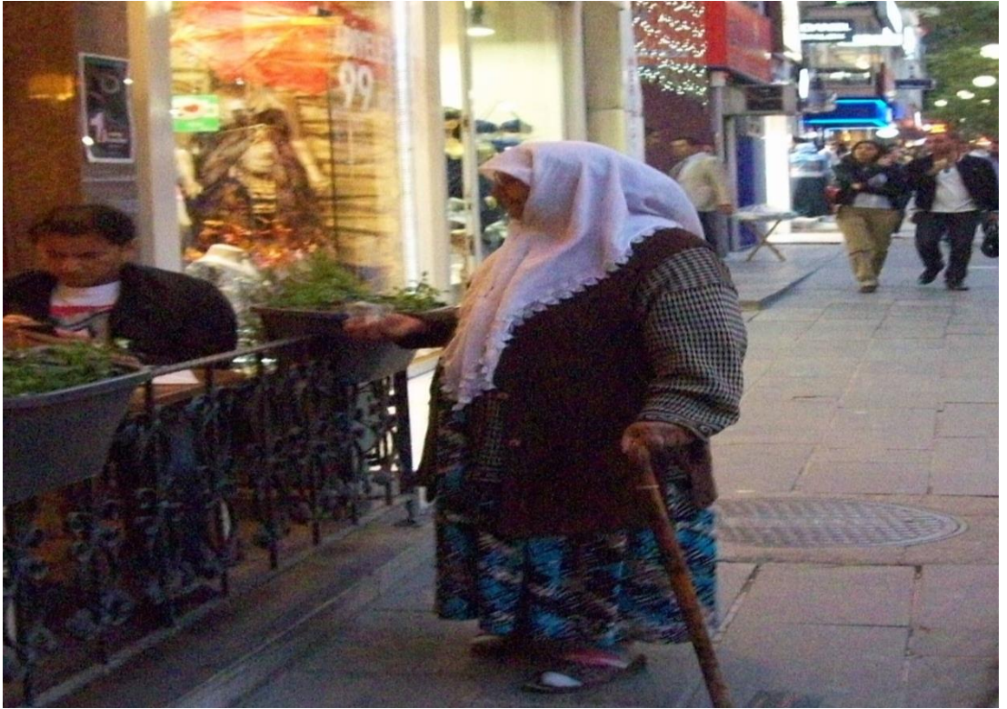
Resim 47: Elinde tuttuğu plastik bardağın içinde astım spreyi olan kadın Tunalı Hilmi Caddesi'nde barda oturan birinden para isterken.