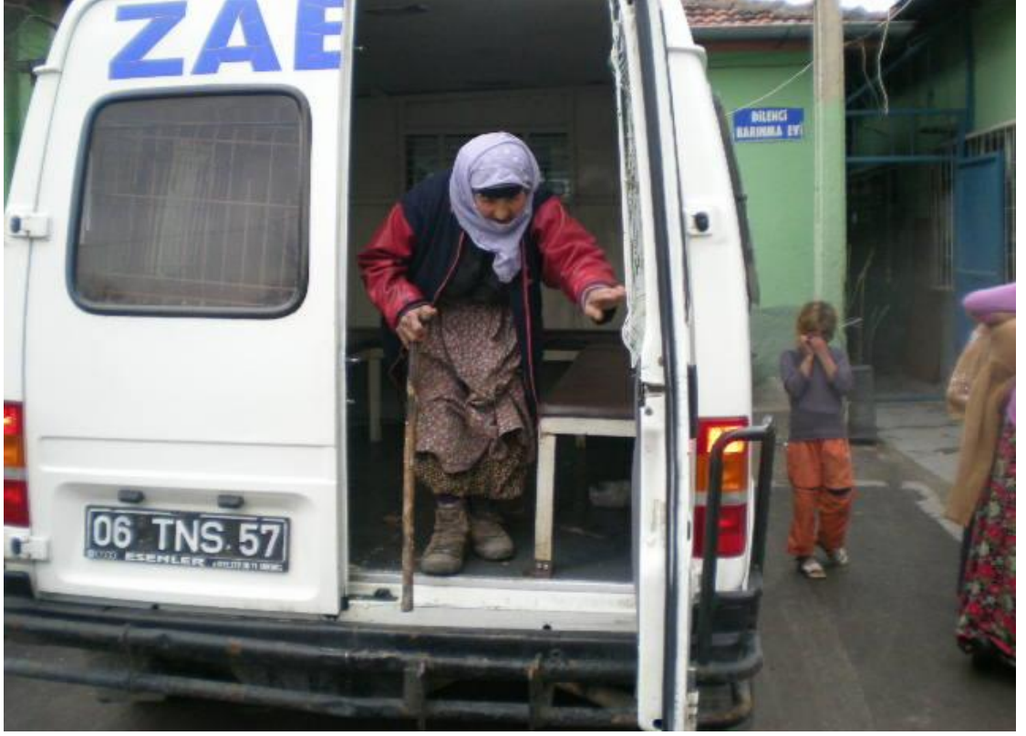
Resim 13: Barınağa getirilmiş dilenci arabadan inerken.

Dilenci barınağının, üzerinde “içeri ilaçlı” yazan mavi demir bir kapısı vardır. Bu kapı bir asma kilitle kilitlidir. Bu kapı açıldığında ise karşınıza koridor çıkar. Bu koridorun sağında korsan eşyaların bekletildiği deponun demir parmaklı camları bulunur. Koridorun solunda da barınak denen dilencilerin konulduğu bir odanın kahverengi demir, asma kilitli kapısı, biraz ilerisinde de yine o odaya ait bir pencerenin demirli penceresi mevcuttur. Yaklaşık beş metre uzunluğunda olan bu koridorda tahta oturaklar, kovalar gibi bir takım atılmış nesnelere durur. Bu koridorun sonunda başka atılmış nesnelere bulunduğu bir yere açılan demir parmaklı bir kapı bulunur.