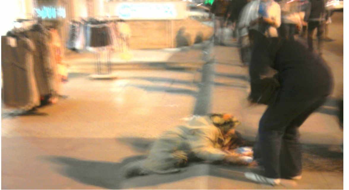
Resim 53: Meşrutiyet Caddesi'nde yaşlılıktan ve fakirlikten yere uzanmış bir dilenciye para verilirken.