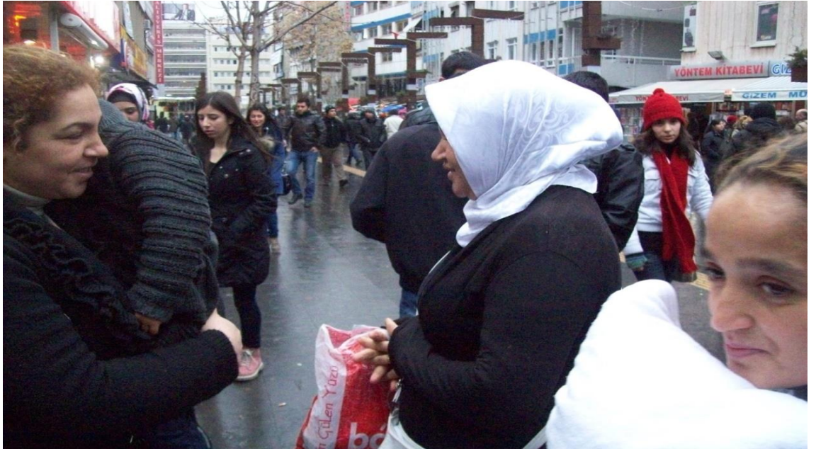
Resim 57: Karanfil Sokak'ta kucaklarında bebeklerle dilenen dilenciler yakalandıklarında gülerken.