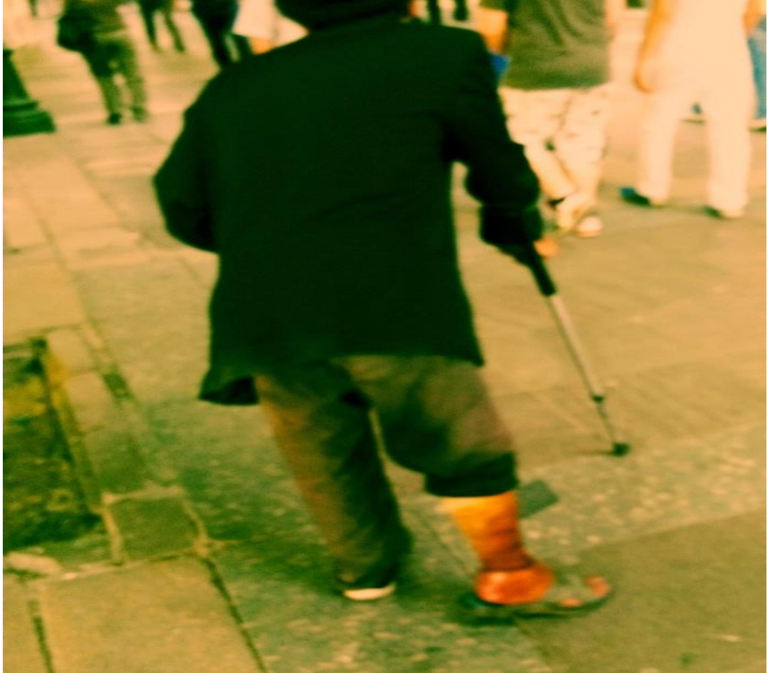
Resim 58: Kızılay Atatürk Bulvarı'nda dilenen ve iltihaplı bacağı hiç iyileşmeyen dilenci.

Vesikası bir uzununda, bedeninde, kendisiyle birlikte mücessem olan dilenciler, bu belge aracılığıyla dilenirler. Bunun anlamı kolsuz, bacaksız, down sendromlu, yaralı, yaşlı ya da çocuk olmak gibi kesinliği şüphe götürmez belgelere sahip olmaktır. Fakat dilenme biçimleri bu bağlamda da kolayca sınıflandırılmaz. Belgesi kendisiyle tecessüm edenler de insanları düşkünlüğüne inandırma yolunda bir performans sergiler ve bunun için resmî ve gayri resmî belgelemelere de başvururlar.