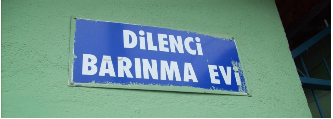
Resim 6: Dilenci Barınağı'nın tabelası.

Dilencilerin götürüldüğü “Dilenci Barınma Evi” zabıtalara ve dilenciler tarafından “barınak” olarak adlandırılır.