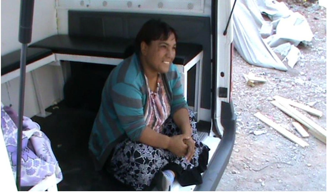
Resim 76: Cuma namazının bitimi beklenirken camiden uzağa saklanmış arabada daha önce alınan dilenci ile sohbet ederken.