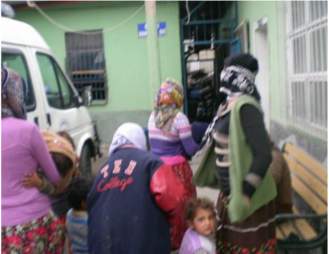
Resim 23: Barınağa yeni getirilmiş dilenciler.

Peki dilenciler barınağı nasıl görürler ve nasıl kullanırlar? Barınakta dilencilerin sayısı az olduğu zaman içeride hâkim olan hava sıkıntılıdır. Hatta yakalandıkları zaman arabada az kişi varsa ya da kimse yoksa barınakta sıkılacaklarını bildikleri için dilenen arkadaşlarının/akrabalarının yerlerini zabıtaya söylerler. Sayıca fazla olmak barınakta geçecek mecburi zamanı onlar için kolay hale getirecektir. Saha çalışması sırasında barınakta kimse yokken getirilen bazı dilencilerin yapılan işi “vicdansızlık” olarak nitelediklerine ve özellikle bu nedenle, yalnız oldukları ve sıkılacakları için bırakılmak istediklerine tanık oldum.