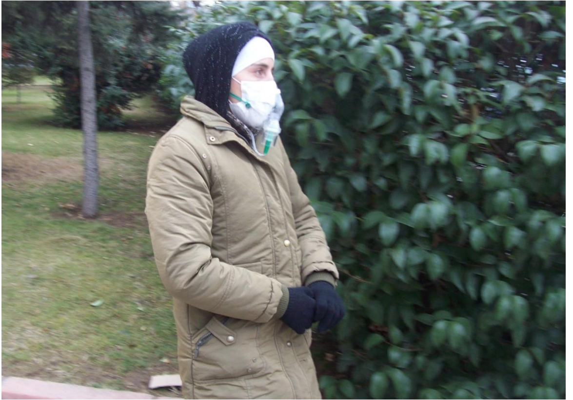
Resim 49: Tunalı Hilmi Caddesi'nde astım hastası görünümlü bir dilenci.