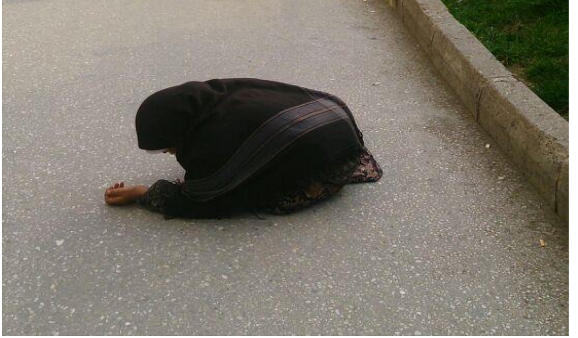
Resim 52: Sıhhiye Saęlık Bakanlıęı'nın önü. "Düşkünüük"ten iki büklüm olan dilenci.