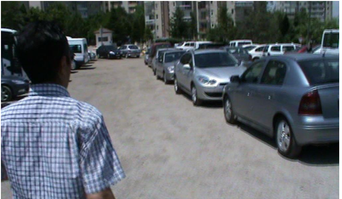
Resim 77: Caminin arkasından koşar adım dolaşan zabıta.