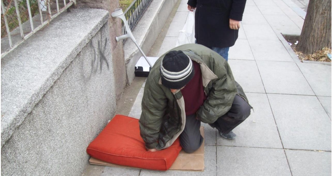
Resim 55: Mithatpaşa Caddesi'nde otururken yanında koltuk değneği bulunduran dilenci.