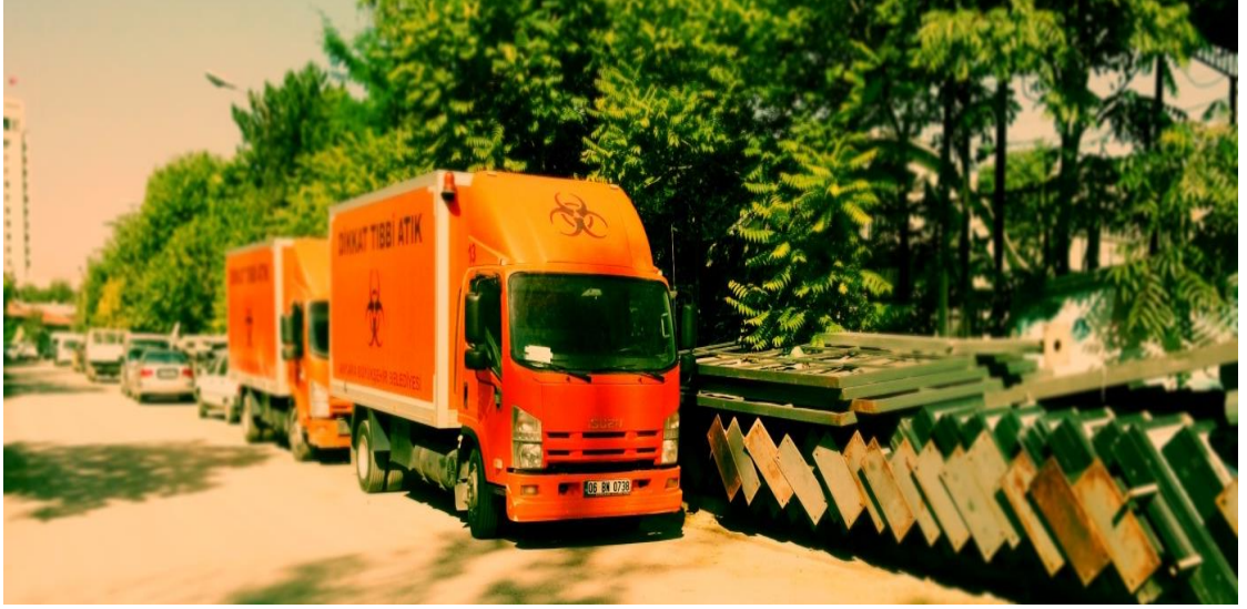
Resim 9: Tıbbi atık kamyonları ve reklam panoları.

Sapakta “Büyükşehir Belediyesi Zabıta Müdürlüğü” tabelası bulunur. Bu sapaktan dilenci barınağına gidene kadar yaklaşık yüz metre kadar mesafede sağ tarafın yerlerinde kullanılmayan hasarlı reklam panoları metrelerce uzanmaktadır.