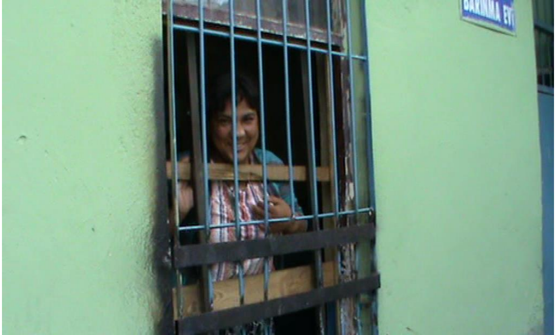
Resim 31: Barınakta bir dilenci.

Bazı dilencilerin barınağa dair bir tavrı da sahiplenmedir. 2011’de alan çalışmasının başlarında Ulus’tan Ankara Büyükşehir Belediyesi ekipleri tarafından alınmış yaşlı bir dilenci kadın kendisini barınaktan çıkarabileceğim umuduyla bana “Daha yeni gelmişim, avucumu bile açmamışım” dedi. Dilenmiyorduyorsa zabıta ekibinin onun dilenci olduğunu nereden anladığını, onu nasıl tanıdığını sordum. Gurur duyar bir tavırdaki “E tanırılar. Biz buranın insanıyız!” dedi. Benzer bir tavırla Haziran 2014’te de karşılaştım. Beni barınakta ilk defa gören genç bir kadın dilenci “yenisin galiba, daha önce görseydim bilirdim, ben burada doğdum burada büyüdüm” dedi. Buradaki gibi bir sahiplenme tavrı aslında iktidarın kimde olduğuna ve barınağın esas sahiplerine işaret eden bir söylem yaratır. Hatta ceza mekânının bu kadar sahiplenilmesi, mekânın varlık amacı olan alıkoyarak “cezalandırma” işlevini bertaraf eden de bir etkiye sahiptir.