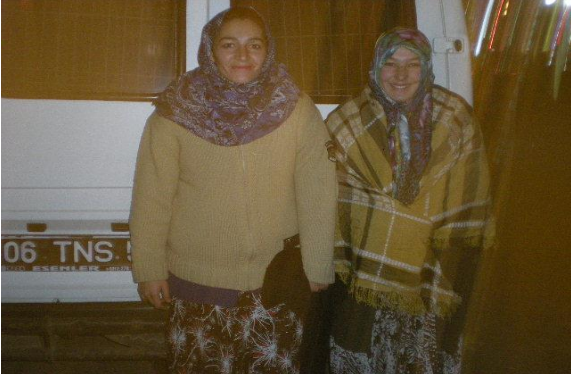
Resim 4: Tunalı Hilmi Caddesi'nde yakalanan dilenciler arabanın önünde poz verirken.