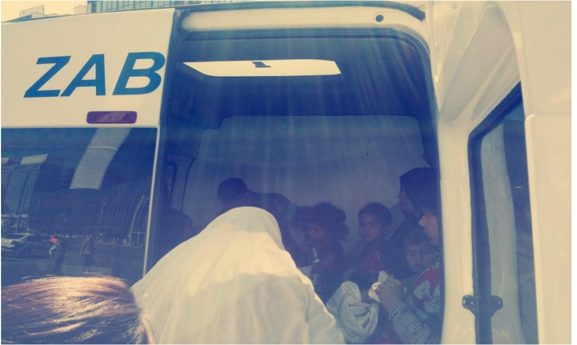
Resim 5: Yeni yakalanan dilenciler arabaya bindirilirken.