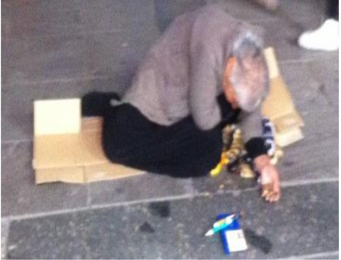
Resim 39: Önünde insülin iğneleri duran dilenci. 144

kabul edilmiştir. Bu şekilde vesikasını bize sunan dilenciler hakkında asla kesin yargılarda bulunamayız. Güvenebileceğimiz tek şey onların bize sunduğu sahnedir. Fakat bu sahneler; ayakkabısız ve hareketli bir biçimde dilenen erkeklerin ayakkabılarını dilendikleri yerin yakınlarında bir yere saklaması ya da bir kadınsa ve oturuyorsa ayakkabısını/terliğini eteğinin altına koyması, yanlarında gezdirdikleri bebeklerin/çocukların kiralanmış olması, sadece hastaymış gibi görünmek için saçların kazıtılması, maske takılması ya da bandajlarla vücudun çeşitli yerlerinin sarılması gibi çoğu zaman tertibat ürünleridir.