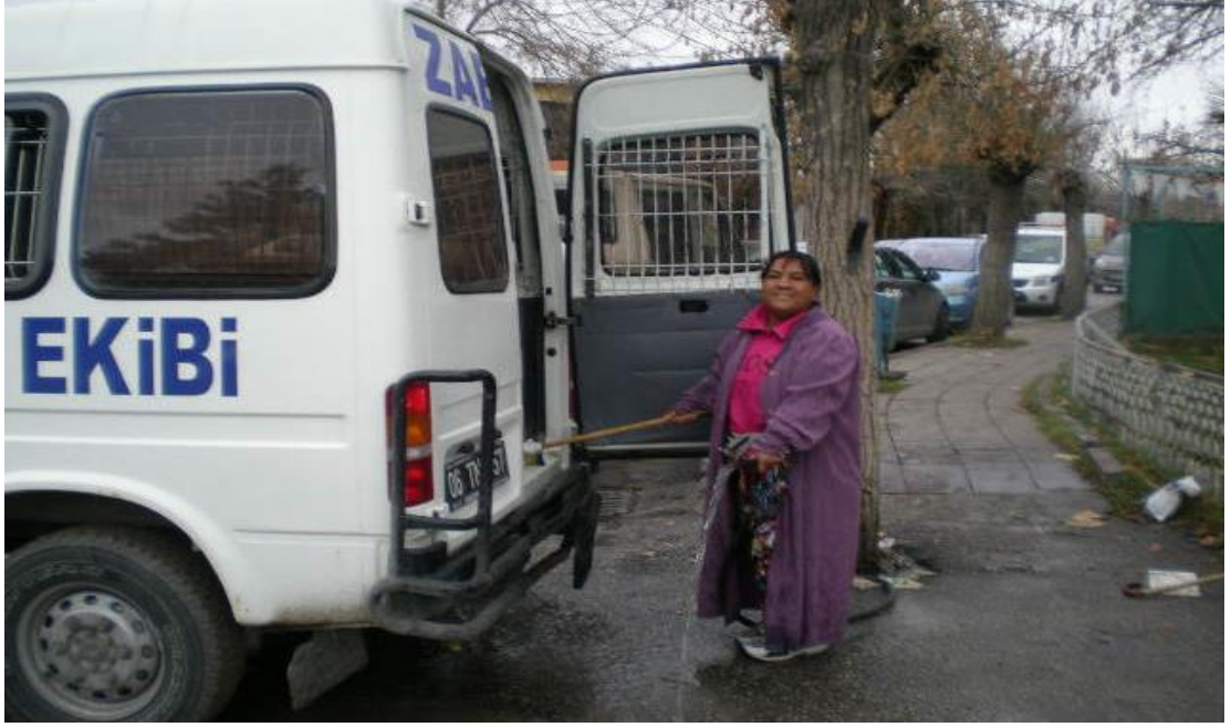
Resim 26: Yolda istifra ettiği için barınakta arabayı temizleyen dilenci.

olduğumu söylediğimde ağızlarından hayır duaları dökülmesi gibi. Bu övgülerin arkasından hemen talepler gelmeye başlar. En klasiği bir mağduriyet göstererek “beni bırak” diye yalvarmaktır.