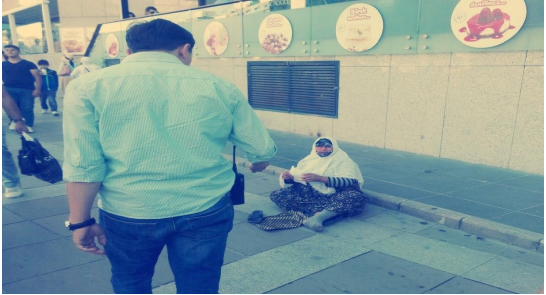
Resim 64: Kızılay Avm'nin önünde yaşlı bir dilenciye zabıta yakaladığında.