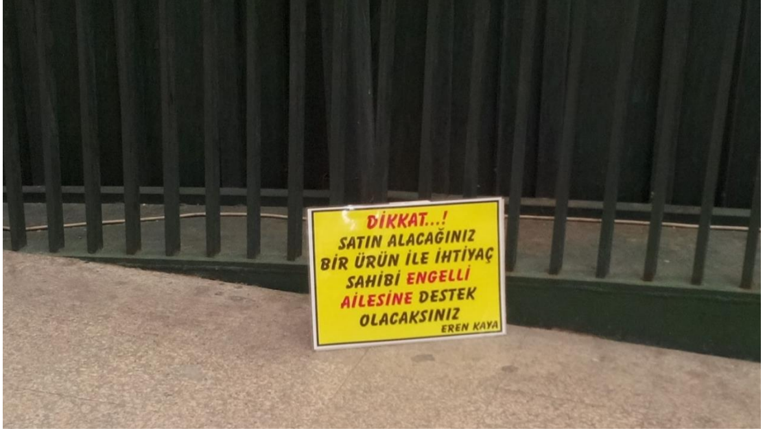
Resim 43: Aynı kişinin üst geçite sağlı sollu koyduğu yazılardan biri. Kartonda “Dikkat...!” ve “Engelli ailesi” kısmı kırmızı ile renklendirilerek “meşru” bir talep olduğuna dikkat çekilmiş.