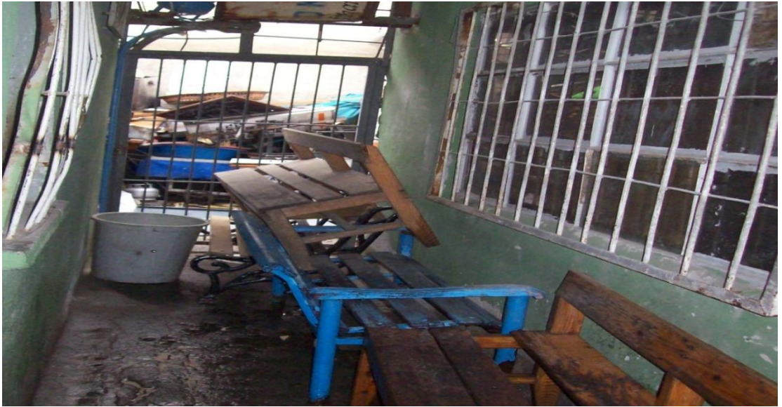
Resim 15: Barınağın kapısı açıldığında karşılaşılan manzara. Dilencilerin koyulduğu odanın kapısı ise sol tarafta kalıyor.