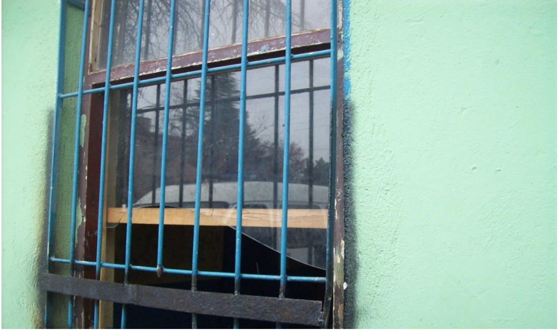
Resim 22: Barınağın dışarıya bakan tek penceresi.