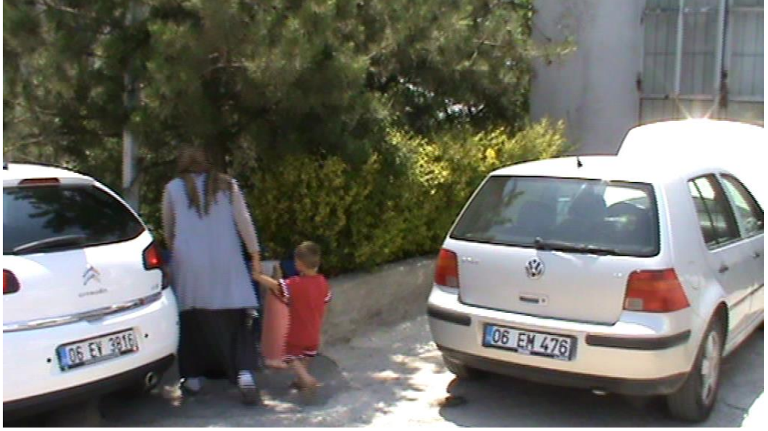
Resim 82: Dilenci “Nerede bu kazak bulamadım” diye kaçıma çalışırken.

Barınağa gitmemek için uygulanan en yaygın taktik ise zabıtayı gerçekten fakru zaruret içinde olduğuna inandırmaya çalışmaktır. Bunun için yapılan genelde reçete ya da ilaç göstermek, hastam var, bebeğim var diye yalvarmak olur. Zabıta en çok başvurulan bu yola aşınadır ve söylenenleri çoğunlukla önemsemez. Öte yandan zabıta korktukları takdirde hemen kaçacaklarını bildiği için dilencileri yakalarken sakın tavır takınır. Diz rahatsızlıklarını, çeşitli hastalıkları bahane ederek zabıta arabasına çok yavaş gitmek de dilencilerin başka bir zaman kazanma taktiğidir. Dilenci bu süre içerisinde kendini bırakması için zabıtayı ikna etmeye çalışır.