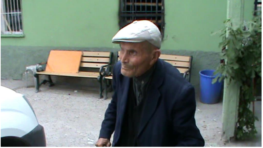
Resim 65: Yaşlı bir dilenci barınakta.