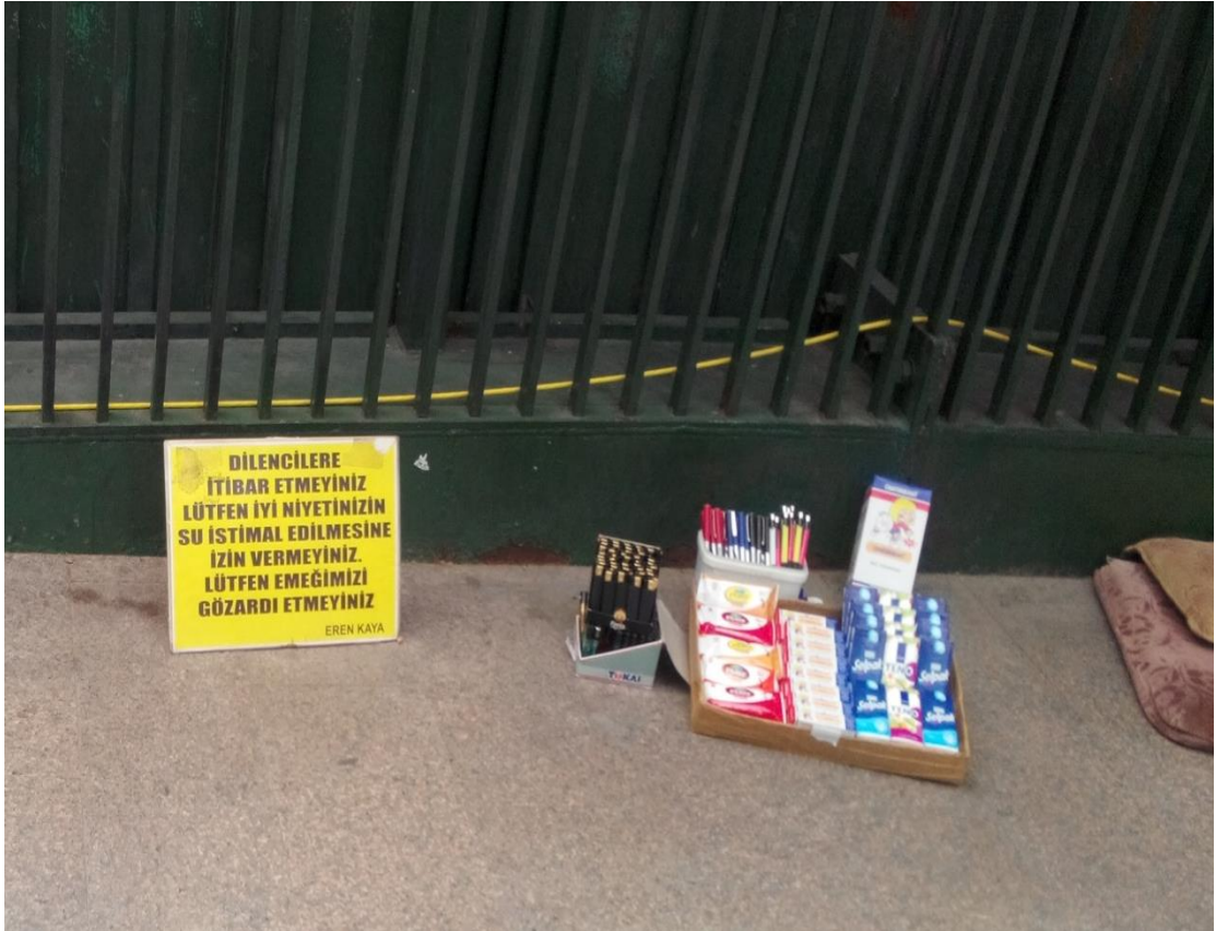
Resim 42: Kızılay Meşrutiyet üst geçiti. Çakmak, yara bandı, kalem, mendil satan ve kendisinin dilenci olmadığını vurgulayan engellinin yeri.

Bir de bir şey satarak hem dilenmediğine hem de fakirliğine dair belge sunanlar vardır. Alan araştırmam sırasında bir dilenci, zabitanın bir şeyler satarak dilenenleri almamasına tepki göstererek “Bizi alıyorsun da çorapçıyı niye almıyorsun... Kibar dilenci o!” demişti. Bu “kibar dilenciler” bir takım şeyler sattıkları için dilenmediklerini iddia ettiklerinden dolayı kendilerini diğer dilencilerden ahlâken farklı bir noktada konumlandırmaktadırlar. Fakat ben bu konuda bir şey satarken bir mağduriyet göstererek alış-verişe vicdanen zorlamanın da dilencilik olduğunu düşünüyorum. Kolu olmadığı için Kızılay üst geçitlerinde mendil kalem satan bir adamın oturduğu yerin etrafına koyduğu yazılar bu bağlamda dikkate değer.