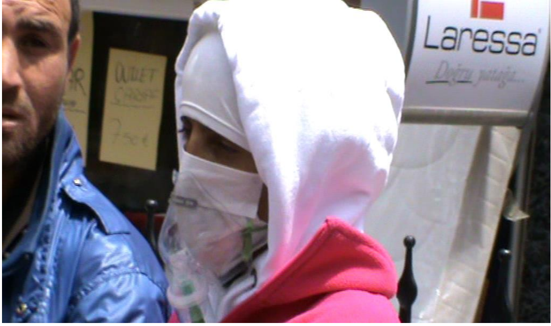
Resim 36: Hem resmî hem de gayri resmî belgeleri kullanan fakat ellerindeki belgeler kadraja girmemiş dilenciler.