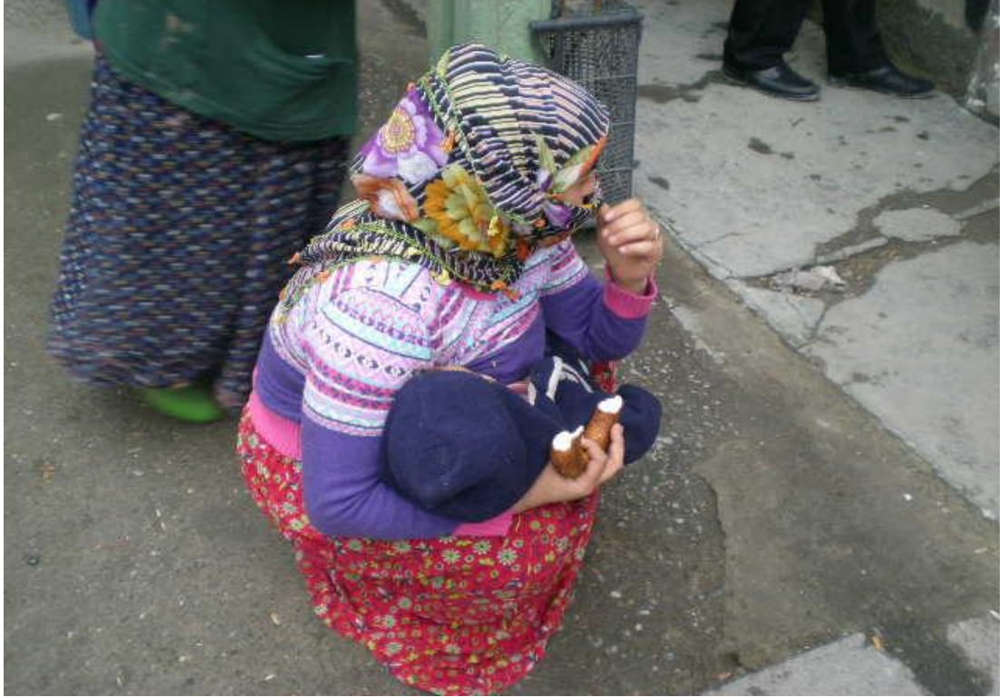
Resim 72: Barnakta bir başka dilenci.