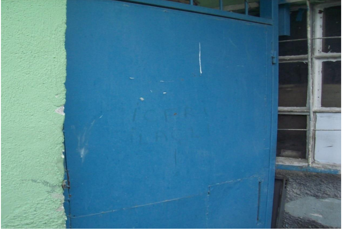
Resim 14: Barınağın kapısı.