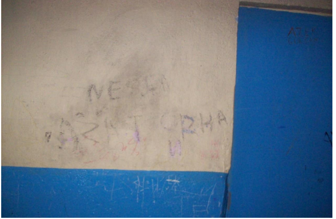
Resim 17: Barınağın içi- duvarlar.