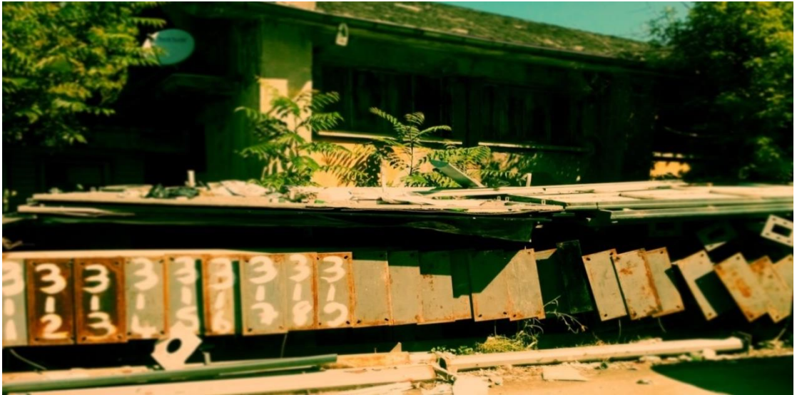
Resim 10: Atılmış reklam panoları.

Sapakta “Büyükşehir Belediyesi Zabıta Müdürlüğü” tabelası bulunur. Bu sapaktan dilenci barınağına gidene kadar yaklaşık yüz metre kadar mesafede sağ tarafın yerlerinde kullanılmayan hasarlı reklam panoları metrelerce uzanmaktadır.