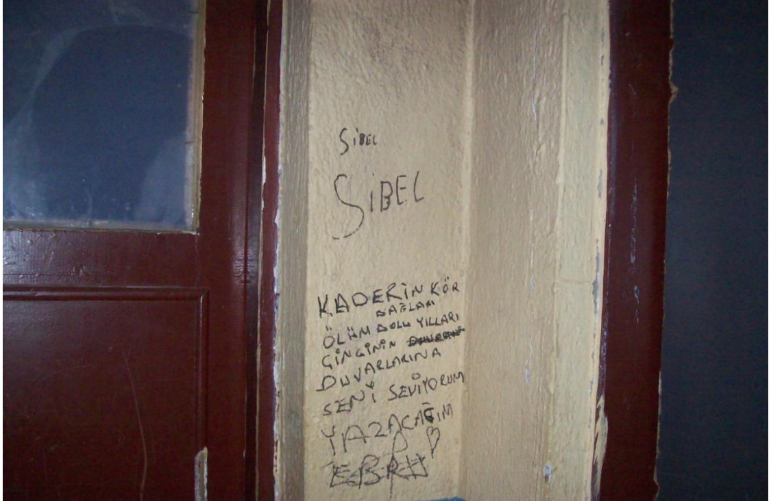
Resim 18: Barınağı içi- duvarlar.