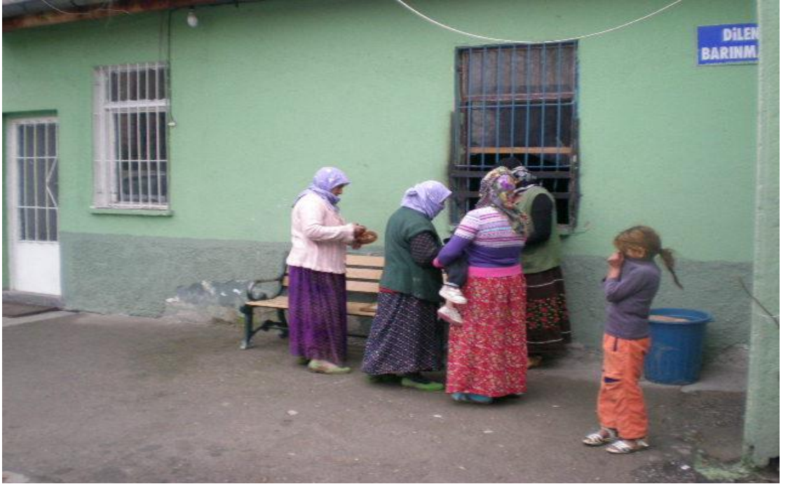
Resim 30: Barınağın önünde dilenciler.