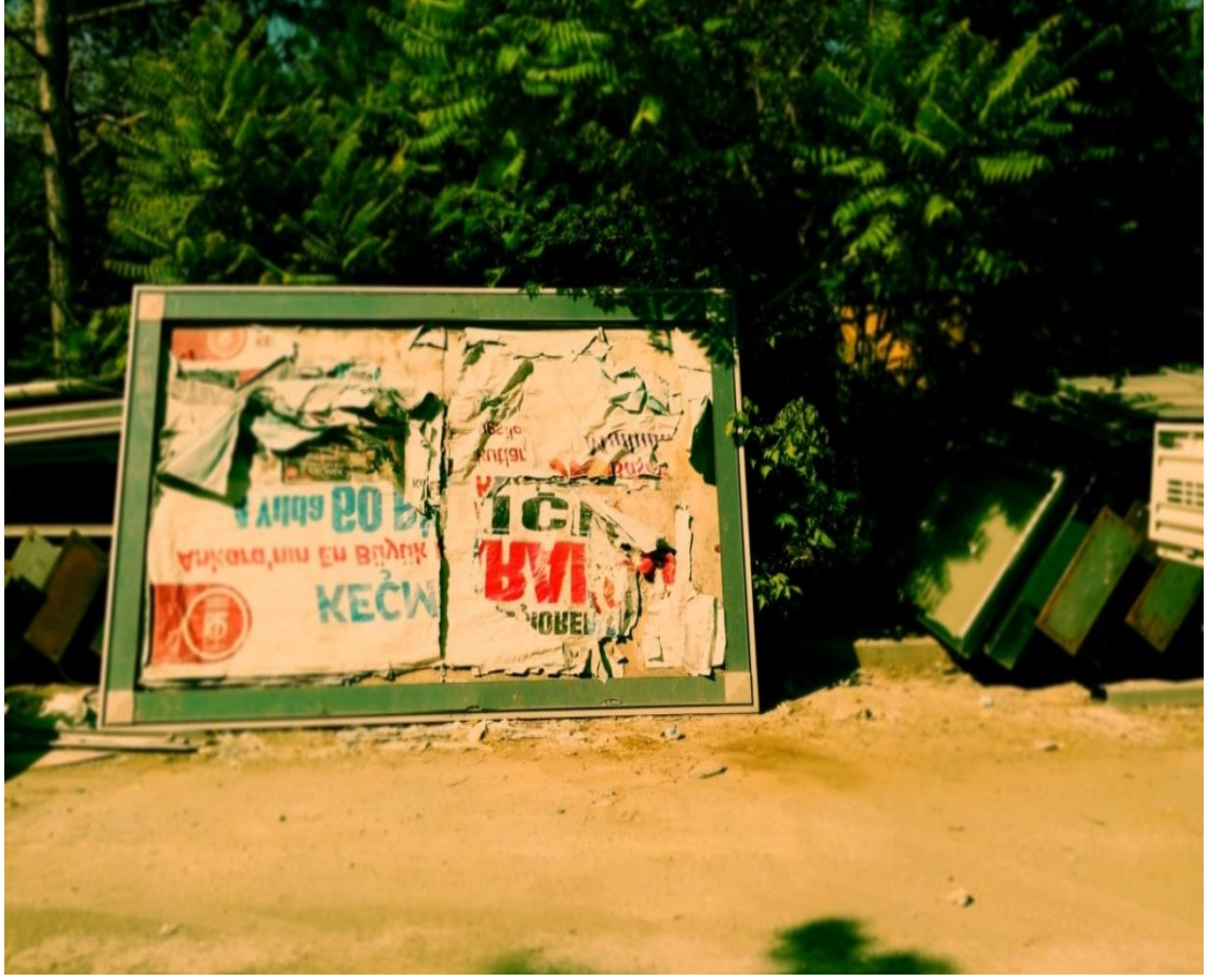
Resim 11: Yola atılmış bir billboard.

Bu panolardan sonra boş bir hurdalık alan bulunmaktadır. Burada her türlü eski araba, metallar, simitçi arabaları gibi nesnelere bulunur. Buranın tam karşısında korsan kitapların, CD'lerin toplandığı bir depo, hemen onun bitişiğinde ise dilenci barınağı vardır. Dilenci barınağının hemen yanında dilencilerle ilgili kayıtların tutulduğu en fazla altı metre kare büyüklüğünde bir zabıta odası, onun da hemen bitişiğinde Seyyar Ekipler Amirliği -zabıta karakolu- bulunur. Seyyar karakolunun bitişiğinde ise Garaj Amirliği, onun da yanında yeşillikler içinde piknik masaları bulunan zabıta çay bahçesi vardır.