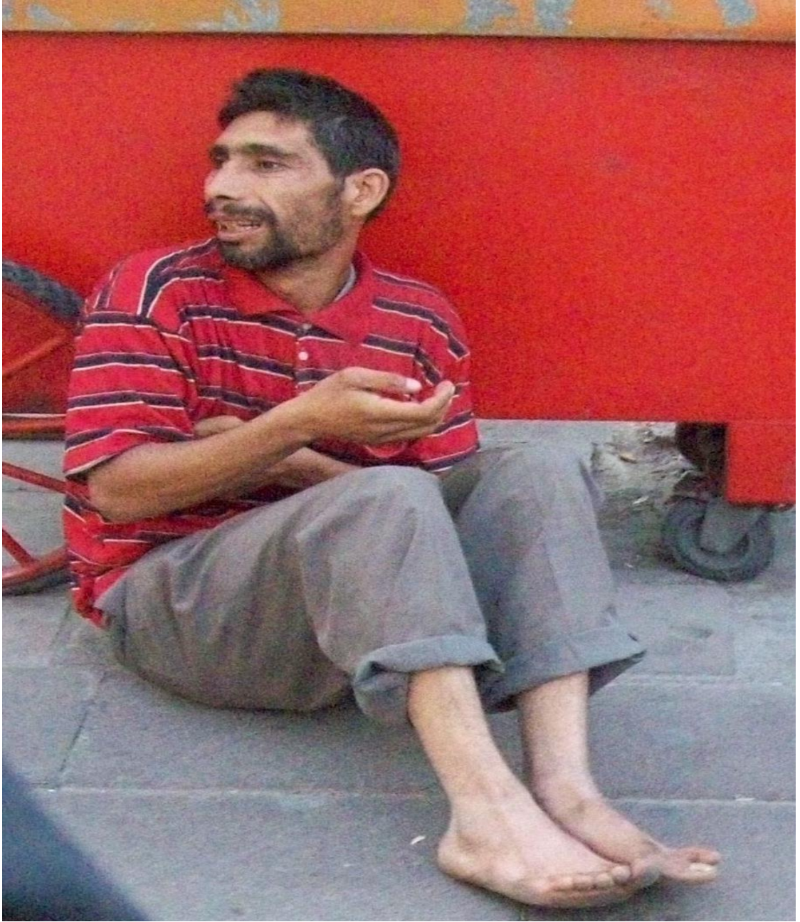
Resim 45: Tunalı Hilmi Caddesi'nde çıplak ayakla dilenen bir dilenci.

Bu yazılarda dilenciler “su istimal edenler” olarak görülüp “emek” vermedikleri ve el açtıkları için merhamete nail olamayacak kişiler olarak sunulmuştur. Kişi kendisini de hem engelli hem emekçi biri olarak takdim etmiştir. Fakat yukarıda da bahsettiğim ayrıma göre engelli olduğu için destek isteyerek aslında dilencilik yapmaktadır.