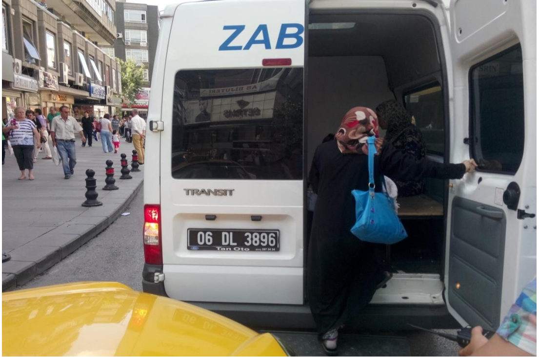
Resim 75: Dilenciler toplanırken caddeye getirilen araba.

Zabıta belediyeye ait bir birim olarak belediyenin “şehri dilencilerden temizleme” amacının uygulayıcısıdır. Bu amaç için uygulanan strateji dilencileri hem şehrin içinde olup hem de görünmez olan bir yere götürüp akşama kadar burada tutmaktır. Bunu gerçekleştirebilmek için de zabıta kimi zaman yayan kimi zaman da aracıyla bütün gün dilencileri kovalar. Barınağın bulunduğu karakoldan araçlarıyla ayrılan zabıta merkezde dilencilerin yoğun olduğu bölgelere girerken arabalarını bir yere saklarlar ki dilenciler arabayı görüp kaçmasın. Şöföre kaç dakika sonra nereye gelmesi gerektiğini söyleyerek dilenci yakalamak üzere arabadan ayrılan zabıta, yürürken kendilerini daha da görünmez yapabilmek için telsizlerini de saklarlar.