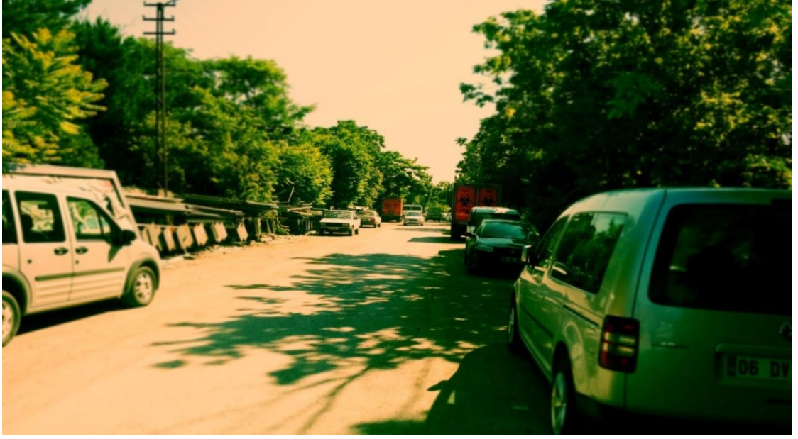
Resim 12: Zabıta Karakoluna giden yoldan bir görünüş -Barınaktan yola doğru-.

Belediyenin mekân düzenlemesi ve dilencilige bakışı birbirinin izdüşümü gibidir. Zabıta bölgesine girdiğimde kendimi Vandalizm müzesinin yanmış otobüsleri, çöp ve tıbbî atık kamyonları, ortalığa saçılmış kırık dökük reklam tabelaları ve hurda araçlardan oluşan bir çöplükte buldum. İmha edilmeyi bekleyen korsan ürünler de burada yer alan bir depoda bekliyordu. Tüm bu nesnelere yığılımla dilencilerin ve zabıtalara hikâyesinde ortak bir yan vardır. Bu atılmış nesnelere haricinde bir taraftan dilenciler de oraya getirilir. Toplum içinde görülmesi istenmeyen insanlar olarak tıpkı istenmeyen nesnelere gibi bu gözden uzak mekâna getirilirler. Aynı anlam çerçevesinde işin bir de zabıta boyutu bulunmaktadır. Dilenci yakalama işinde görevlendirilen zabıtalara birçoğu kimi siyasî durumlardan dolayı dilenci ekibinde sürgündedir. Dilencileri yakalayan zabıtalara da bir anlamda muktedirlerin istemedikleridir. Bu şekilde mekânın kendisi istenmeyen insanların/nesnelere gözden uzaklaştırıldığı bir bölge olarak belirmektedir.