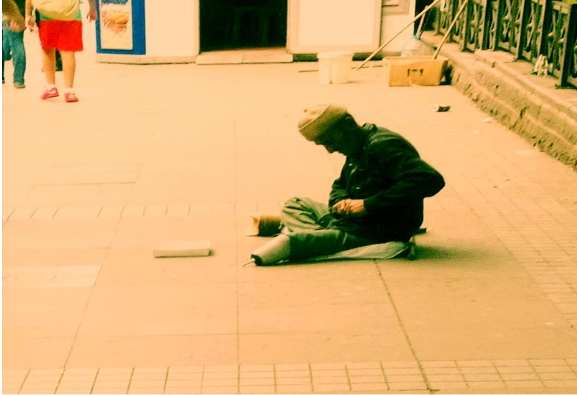
Resim 60: Güvenpark'ta protez ayağı yanında duran dilenci.