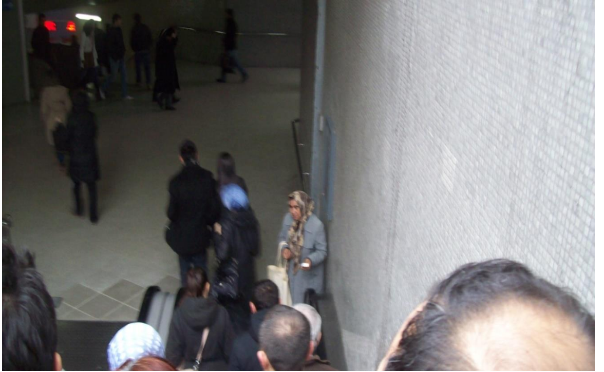
Resim 51: Kızılay metro girişinde mendil satan bir dilenci.