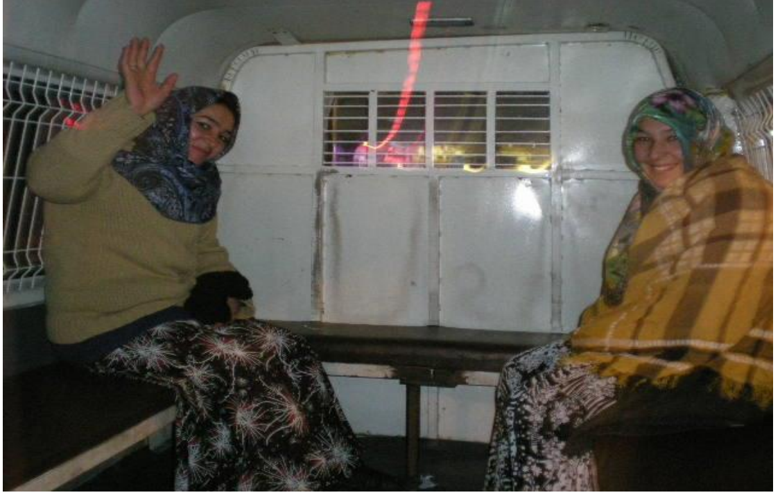
Resim 2: Çankaya Belediyesi'nin eski aracında dilenciler.