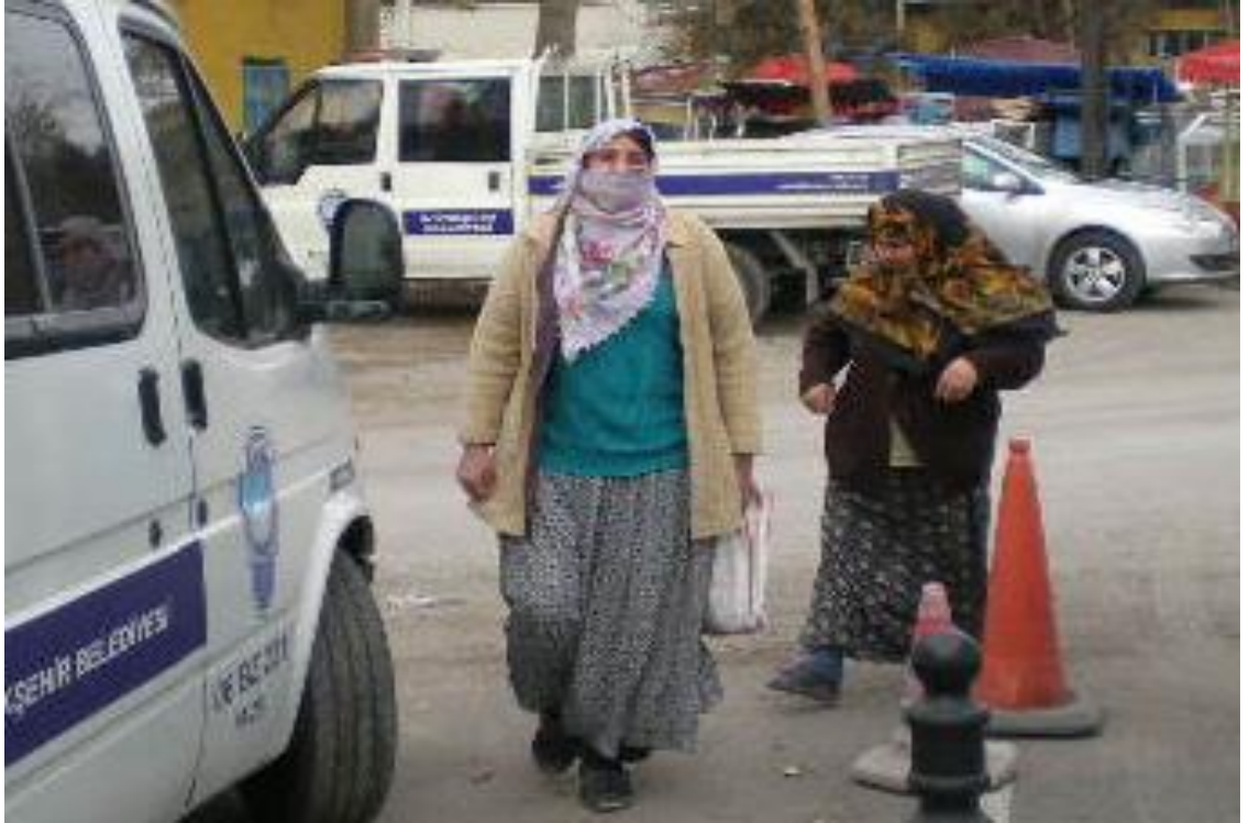
Resim 70: Barınağa yeni getirilmiş dilenciler.