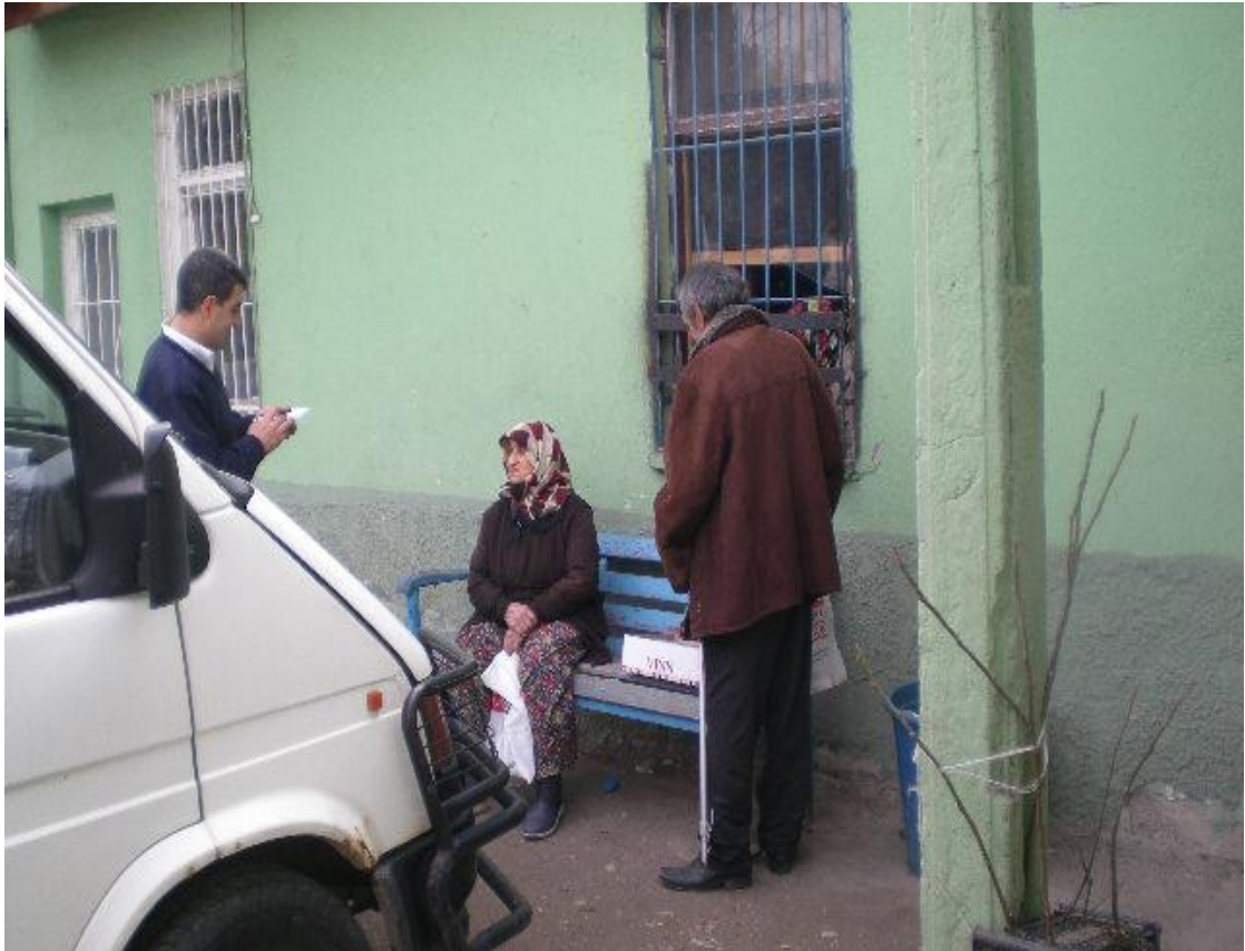
Resim 24: Zabıta tarafından dilenciler kayıt edilirken.

Dilenciler zabıtalara -hatta kim/ne olduğumu ayırt edemedikleri için bana da- “Komiserim” ve karşısındaki kişilerin yaşını hiç önemsemeksizin “abi/abla” şeklinde hitap ediyorlardı. Bazı dilenciler bu “abi/abla” hitaplarıyla kurmaya çalıştıkları ilişkiyi zabıtalara “memleketlerindeki evlerine” davet ederek güçlendirmeyi denerler. Yine aynı şekilde zabıtalara da güvendikleri, temiz buldukları dilencilerin “memleketlerinden” istedikleri şeyleri sipariş eder ve satın alırlar. Tüm bu kaçma kovalamanın içinde dilenci ve zabıta arasında bir yönü samimiyet ve bir yönü ticaret olan bir ilişki de gelişir.