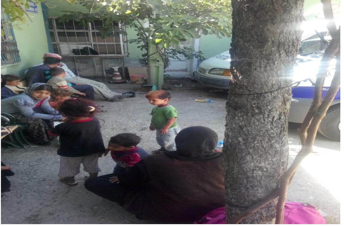
Resim 29: Dilenci barınağı -sol tarafta-, Suriyeli dilenciler ve zabıta arabaları.