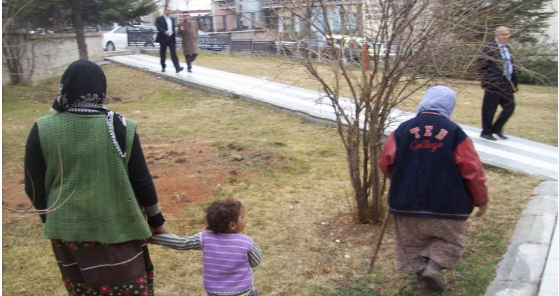
Resim 66: Cuma namazı çıkışı Balgat Barbaros Cami’sine dilenmeye gelmiş dilenciler. Sağ tarafta bastonlu yaşlı dilencinin TED Koleji hırkası dikkat çekici.

yatalaktı ona da ben baktım”. Anlattığı hikâye içinde ne çocuklarının yaşı, ne kendi yaşı, ne de evlenme yaşı birbirini tutuyordu. Torunları bir anda çocukları, çocukları ise torunlarına dönüşebiliyordu. O an aklıma takılan ayrıntıları kendisine sordum. Dilenci kadın bu çelişkilerin üzerinde durduğumu fark edince “Ben hastayım çocuğum, bakma sen benim dediklerime kalp hastasıyım, şeker hastasıyım, tansiyon hastasıyım, guatr hastasıyım kafam gidik benim” dedi. O anda kadını dinlerken kendisinin yaşamadığı, başkalarının hayat deneyimlerini parça parça alıp kendi hikâyesini kurguladığını düşündüm. Gözlerim kadının giyimine takıldı. Kıyafetleri de tıpkı hikâyesi gibi başkalarının hayatlarından gelip onun bedeninde birleşiyordu. Dilencilerin hepsinde görmeye alışık olduğumuz biçimde farklı zamanlarda farklı insanlardan toparlanmış giysileri vardı: Converse ayakkabı, şalvar, TED Koleji’nin adını taşıyan hırka, leopar desenli başörtüsü. “Dilenci olduğunu nasıl anladınız?” sorusunun cevabını o anda kavradım.