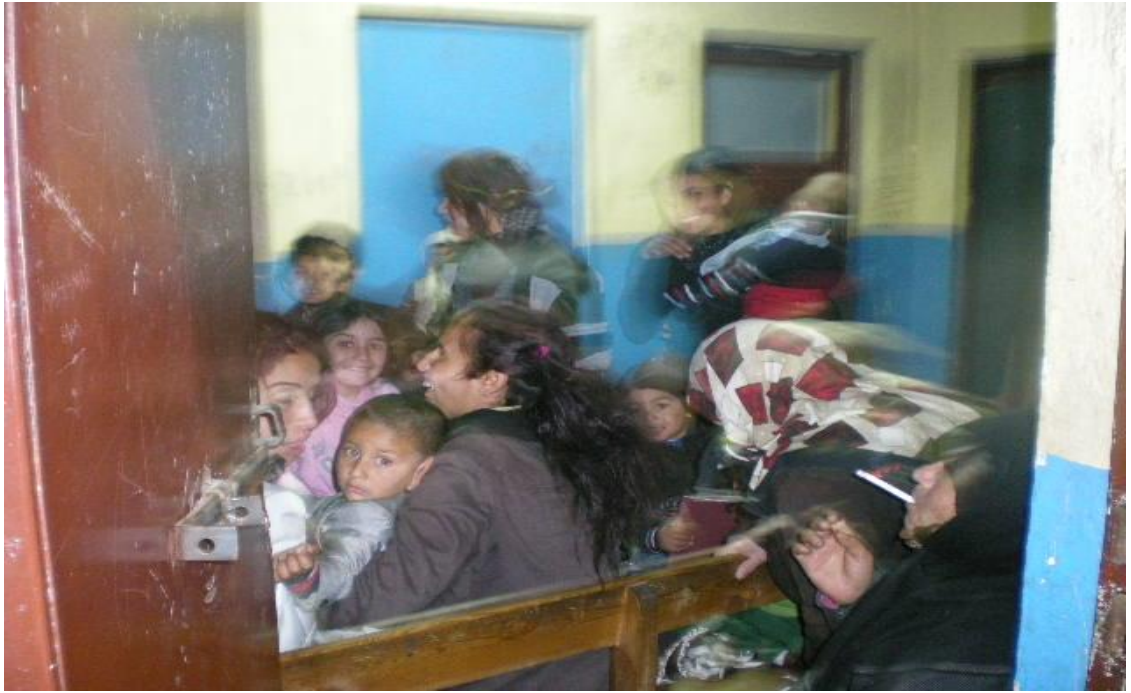
Resim 28: Barnakta dilenciler eğlenirken.