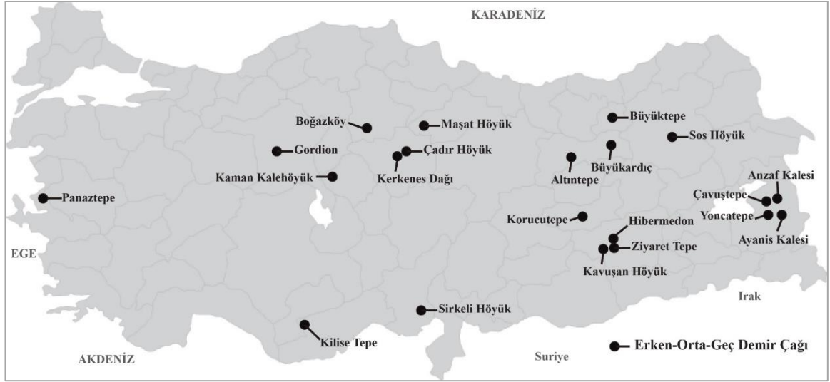
Şekil 5. Anadolu Demir Çağı Yerleşimleri

Kaleleri'nden elde edilen veriler Demir Çağı'ndaki insan yerleşimleri hakkındaki bilgilerimizi artırmaya yöneliktir.