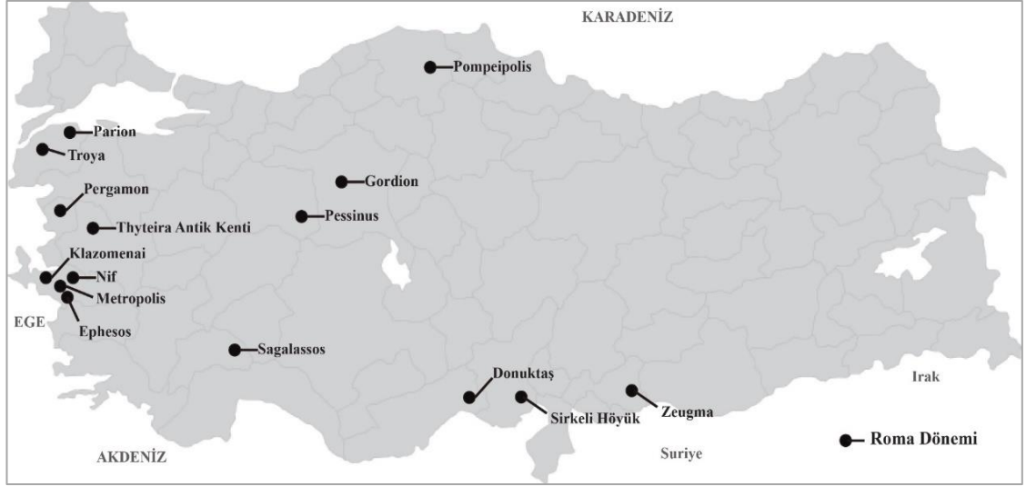
Şekil 9. Anadolu Roma Dönemi Yerleşmeleri

Anadolu Roma Dönemi kırsal ekonomisine yönelik çok fazla veri bulunmamaktadır, fakat Anadolu pastoral uygulamalarına ilişkin konuları ele alan paleobotanik çalışmalar sayesinde bugün sahip olduğumuz bilgiler artmaktadır (Hammer ve Arbuckle, 2016: 16). Roma Dönemi'nde yerleşmeler büyük oranda batıda yoğunlaşmıştır (Şekil 9). Anadolu'da bu dönemde farklı sınıfsal statü ve sosyal yapıda insanlar görülmüştür. Yönetici sınıfın yaptırdığı hamam, kütüphane, tapınak gibi yapılar Anadolu'nun görünümünü değiştirmiştir. Yine bu dönemde demografik farklılaşmalar görülmüş, kırsal nüfus büyük ölçüde azalmıştır.