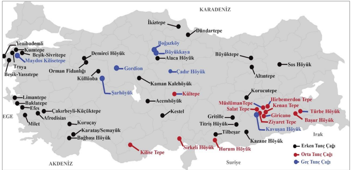
Şekil 4. Anadolu Tunç Çağı Yerleşimleri

Batı Anadolu Tunç Çağı hayvancılık ekonomisi incelendiğinde, deniz kıyıları, göl ya da ırmak kıyılarında yaşayan halkların hayvancılık ve balıkçılıktan geçimlerini sağladıkları görülmüştür. Örneğin Kumtepe A, Beşik-Sivritepe, Beşik-Yassitepe, Baklatepe, Limantepe, Ulucak Höyük, Efes Çukuriçi Höyük'te ve Milet'te insanların deniz ürünlerinden faydalandıklarını gösteren veriler elde edilmiştir. Bu dönemde Batı Anadolu'da hayvancılık ekonomisi hayvan yetiştiriciliği ve az miktarda av hayvanlarına dayanmaktaydı (Şekil 4) (Oy, 2011: 40-44).