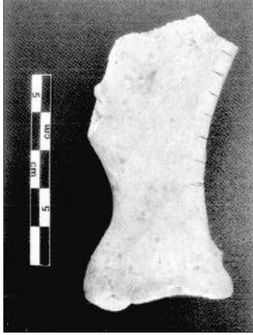
Resim 7. Tilbeşar Tunç Çağı Sığır Kalıntısında Saptanan Kesik İzlerinin Görünümü (Berthon ve Mashkour, 2008: 36)

Tablo 18'de Orman Fidanlığı, Küllüoba, Demircihöyük ETÇ'ye ait zooarkeolojik buluntular incelenmiştir.