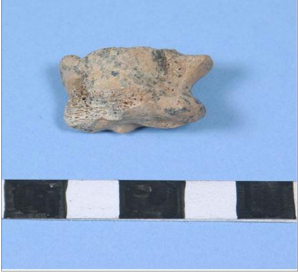
Resim 14. Burgaz'da Ele Geçirilen Keçi Astralagusu (Aydın, 2004)

Halikarnassos kazılarında bir törende sunulduğu düşünülen koyun/keçi, sığır, domuz, güvercin ve kaz kalıntıları ele geçirilmiştir ( http://www.tayproject.org/ ).