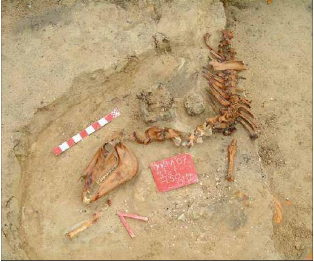
Resim 20. Yenikapı'da Açığa Çıkarılan At İskeleti (Onar, 2013a: 21)

Kazılarda çıkan sığır, keçi, koyun kafataslarında yapılan incelemelerde beyin çıkarma faaliyetleri gözlemlenmiş olup, halkın sakatat da tükettiği anlaşılmıştır. Limanda yapılan çalışmalarda balık türlerine de bolca rastlanmıştır, üzerlerindeki kesik izleri incelenmiş ve sonuç olarak Byzantion'nun "ton balığı metropolisi" olarak isimlendirilmesi zooarkeolojik kanıtlarla da desteklenmiştir. Yenikapı çalışmaları sonlandırılmış olsa da, faunal kalıntılar üzerinde yapılacak pek çok çalışmanın Bizans İmparatorluğu'na ışık tutacağı çok açıktır (Onar, 2013a).