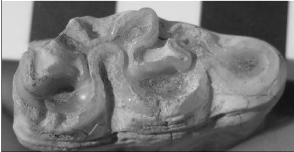
Resim 8. Acemhöyük'te Açığa Çıkarılan Equidae III. Molar Dişi (Arbuckle, 2013)

Anadolu'da evcil eşeğin bilinen ilk görünümü Geç Kalkolitik Çağ'a tarihlendirilmektedir. Bu duruma Kuzey Levant ve Uruk dönemi arasındaki ekonomik etkilenmenin yol açtığı düşünülmüştür. Acemhöyük ETÇ'de görülmeye başlanan atgillere ait kalıntıların OTÇ'de artması da Asur ile olan ticari bağlardan kaynaklanmaktadır. Equidae ailesinin üyeleri olan at ve eşekler yük hayvanı olarak kullanılmıştır (Resim 8) (Arbuckle, 2013).