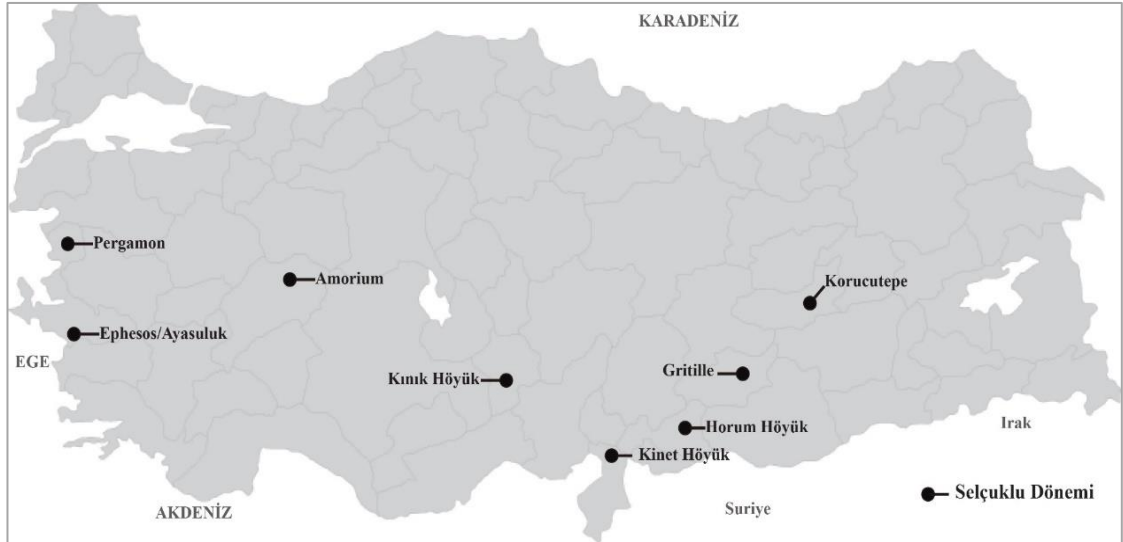
Şekil 11. Anadolu Selçuklu Dönemi Yerleşmeleri

Selçuklular başlangıçta basit akınlarla, daha sonra giderek artan şekilde Anadolu içlerine nüfuz etmeye başlamışlardır. Yerleşmelerin büyük çoğunluğu da bozkır bitki örtüsüne sahip, dolayısıyla koyun ve sığır yetiştiriciliğine olanak sağlayan Orta Anadolu platolarında yoğunlaşmıştır. Bizans İmparatorluğu'nun zayıflamasıyla Anadolu toprakları Selçuklular'a hem kültürel hem politik anlamda kapılarını aralamıştır (Yakar, 2007: 79). 1071 yılında Malazgirt Savaşı ile toprakların hakimiyeti büyük ölçüde Selçukluların eline geçmiş, bundan 3 yıl sonra da Anadolu Selçuklu Devleti kurulmuştur.