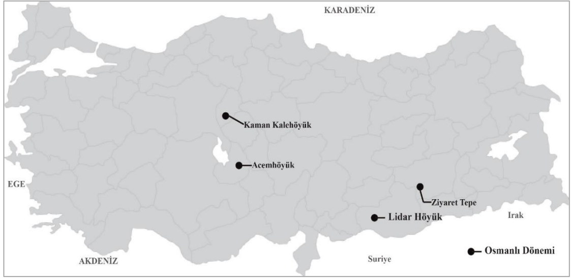
Şekil 12. Anadolu Osmanlı Dönemi Yerleşimleri

Güneydoğu'daki koyun, keçi ya da deve besiciliği yapan Arap Bedevi göçerleri ve Anadolu'nun orta, doğu ve güney dağlık bölgelerinde Türkmen ve Kürt kökenli Osmanlı'nın çatıştığı kırsal yaylacılar da dahil olmak üzere, Osmanlı içerisindeki aşiretler farklı yaylacılık uygulamaları ile ilgilenmişlerdir. Bu aşiretler çoğunlukla koyun ve keçi yetiştiriciliği yapmışlar, bazı zamanlarda bunlara at ve sığır da eklenmiştir. Yaz mevsiminde yüksek yaylalara çıkarak hayvanları otlatmışlar ve neredeyse 300 km'lik uzun göç hareketleri gerçekleştirilmişlerdir. Osmanlı kaynaklarında bu çeşitli insan grupları, Türkmen, Yörük veya Kızılbaz olarak tanımlanmıştır (Hammer ve Arbuckle, 2016).