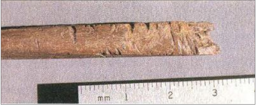
Resim 2. Dursunlu Fossil Kuş Femuru Üzerindeki Kesik İzlerinin Görünümü (Saraç, 2001: 17)