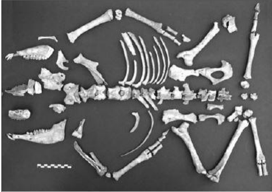
Resim 11. Kilise Tepe'de Ele Geçirilen Koyun İskeleti (Bouthillier vd., 2014: 111)

Kilise Tepe OTÇ katmanlarında bulunan hayvanların büyük çoğunluğunu Ovis aries ve Capra hircus oluşturmaktadır (Resim 11) (Baker, 2008). Ayrıca yerleşmede 27 adet balık kalıntısı ele geçirilmiştir. Ele geçirilen tuzlu su balıklarının yerleşime başka bir bölgeden getirildiği anlaşılmıştır (Bursa, 2007: 71).