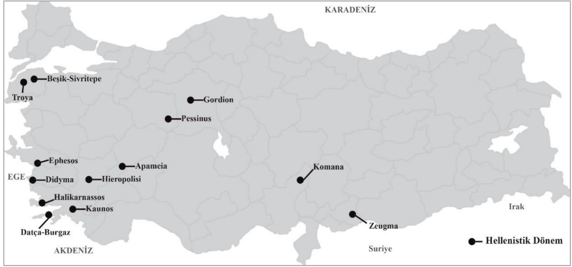
Şekil 8. Anadolu Hellenistik Dönem Yerleşimleri

Bu dönemde baş gösteren kentlerdeki büyüme ekonomik yapıya da yansımıştır. Anadolu kırsal yerleşmelerden çok, kentsel bir doku görünümündedir. Gelişen kentsel yapılar ve buna bağlı nüfus artışı beslenecek daha çok insan demektir. Bu nedenle tarım ve ticarete de artış meydana gelmiş, ticari yolları koruma amaçlı savunma sistemleri de gelişmiştir. Yakar (2007), Anadolu Hellenistik Çağ kentlerinden ekonomik yapısı ile ilgili olarak, bazılarının tarım kasabaları olarak nitelendirilebileceğini söylemiştir (Yakar, 2007: 69).