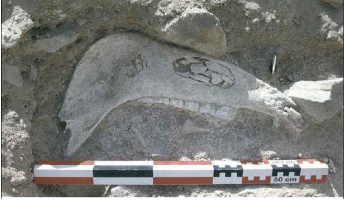
Resim 4. Kaletepe Deresi 3 II. Tabakada Bulunan Equidae Mandibulası (Slimak ve Dinçer, 2007)