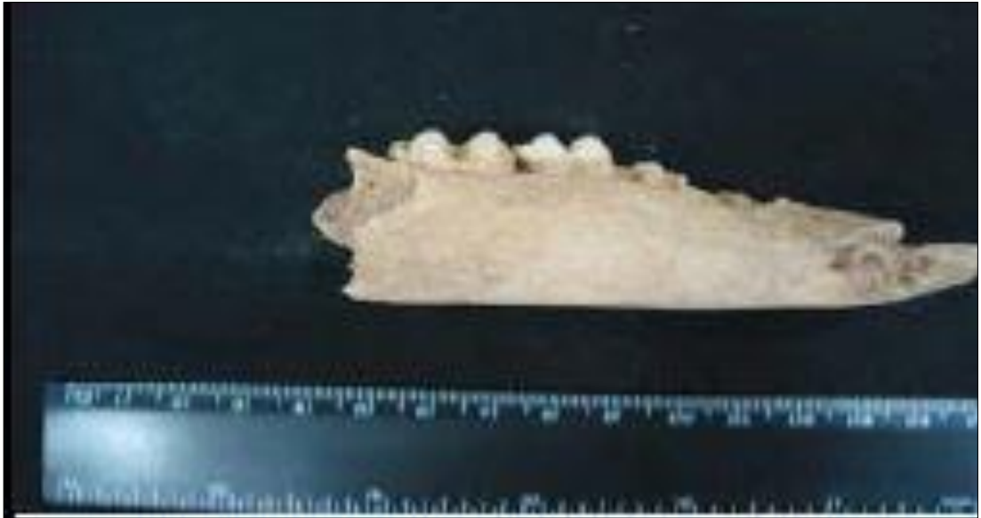
Resim 18. Metropolis'te Ele Geçirilen Domuz Mandibulası (Yıldırım, 2010)

Metropolis hayvan kalıntıları İstanbul Üniversitesi profesörü Vedat Onar tarafından incelenmiştir. Yerleşimciler genellikle koyun ve domuz gibi küçükbaş hayvanları ve kanatlı hayvanları tüketmişlerdir (Resim 18). Ele geçirilen kemiklerden anlaşıldığı kadarıyla, insanlar çoğunlukla hayvanların Omega-3 ve 6 açısından zengin gövdeden uzak distal parçalarını haşlayıp yemişlerdir (Yıldırım, 2010: 166-183).