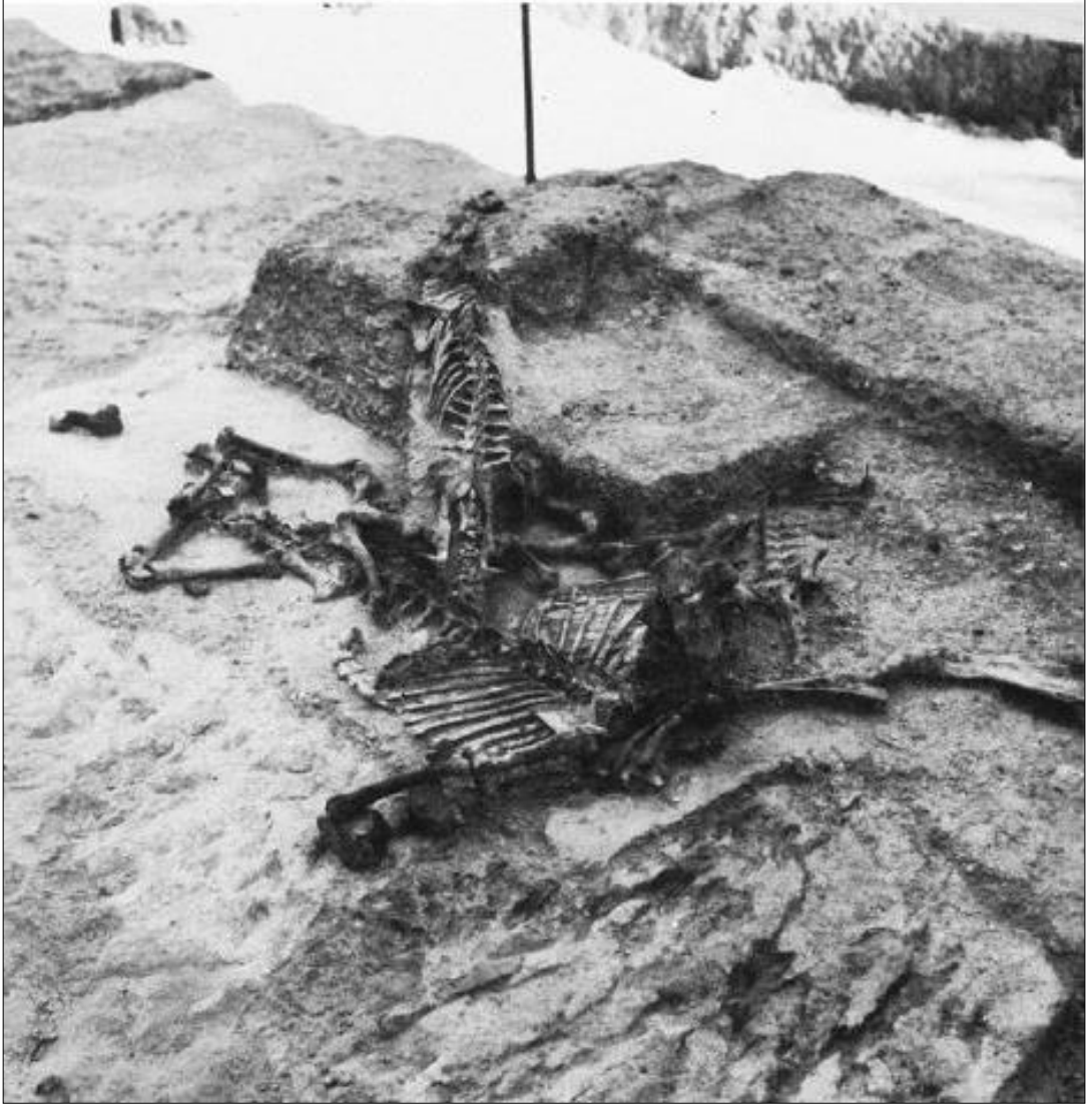
Resim 15. Halikarnassos Mauselion'da Açığa Çıkarılan Üst Üste Binmiş Ovicaprid Buluntuları (Hojlund, 1983)

Pessinus'un Helenistik Döneme tarihlendirilen tabakalarında ele geçirilen kemiklerin 283'ü tanımlanabilmişken, 228 tanesinin ise tür veya cins tayini yapılamamıştır. Tanımlanan kemiklerin büyük çoğunluğu Ovicaprid'tir (Resim 15). Bunun dışında sığır, tavuk, at, alageyik, tavşan, ördek, güvercin ve az miktarda da deniz kabuklusu ele geçirilmiştir (Devreker ve Vermeulen, 1996: 94-95).