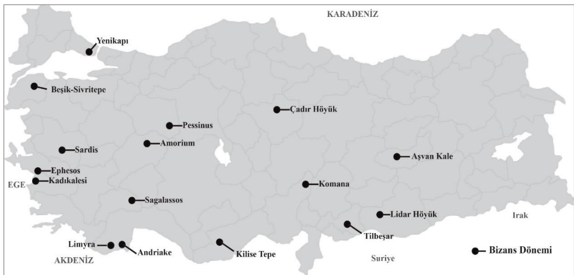
Şekil 10. Anadolu Bizans Dönemi Yerleşmeleri

Kuzeydoğu Anadolu'daki Yunan Bizans varis devletleri ve 13-15. yy'larda hüküm sürmüş Trabzon İmparatorluğu, onları çevreleyen Türkmenlerle çatıştıkları için bazı açılardan Bizans Dönemi Güneydoğu Anadolu'su ile benzerdirler (Hammer ve Arbuckle, 2016: 19).