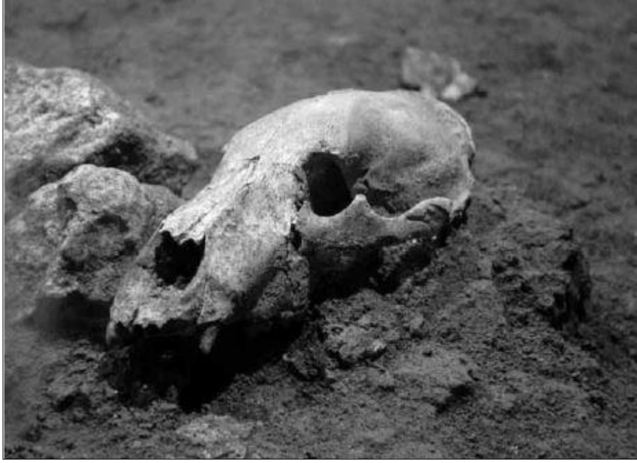
Resim 1. Yarımburgaz Mağarasında Bulunan Ayı Kafatası (Stiner, 2010)

Alt Paleolitik Çağ'dan Üst Paleolitik'e kadar uzanan tabakaları saptanan Antalya'nın prehistoryasına ait en önemli mağaralarından olan Karain Mağarası, zengin makro ve mikro faunal buluntulara sahiptir. Yabani sığır, yaban keçisi, antilop, yaban koyunu, yaban domuzu, yaban keçisi, karaca gibi otçulların yanında yaban kedisi, mağara ayısı, mağara sırtlanı gibi etçillere ait buluntular ele geçirilmiştir (Güleç ve Açıkkol, 2006) Karain'de ele geçirilen mikro faunal buluntular yer yer steplerin bulunduğu otluk, ağaçlık bir ortama işaret eder (Demirel, 2007).