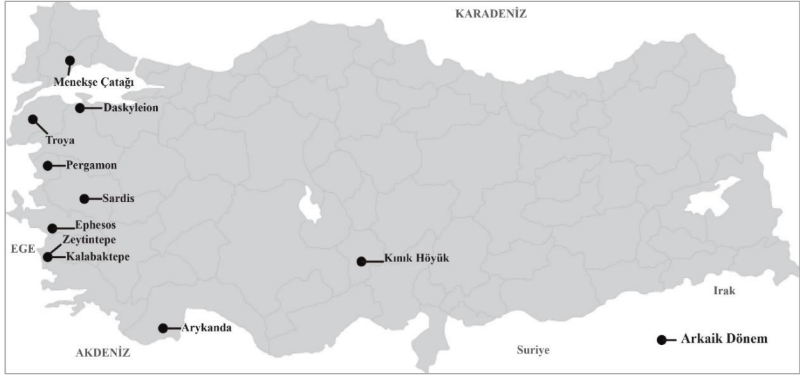
Şekil 6. Anadolu Arkaik Dönem Yerleşmeleri

Bu dönemde Batılılar'ın çok çeşitli olmayan sade bir mutfakları varken, Doğulu saraylıların zengin içerikte sofraları bulunmaktaydı. Persler'in sahip oldukları görkemli sofralar herkes tarafından bilinmekteydi. Anadolu bu duruma kayıtsız kalmamış, başta İonia bölgesi olmak üzere doğunun etkisi görülmüştür ( http://veteriner.istanbul.edu.tr/ ).