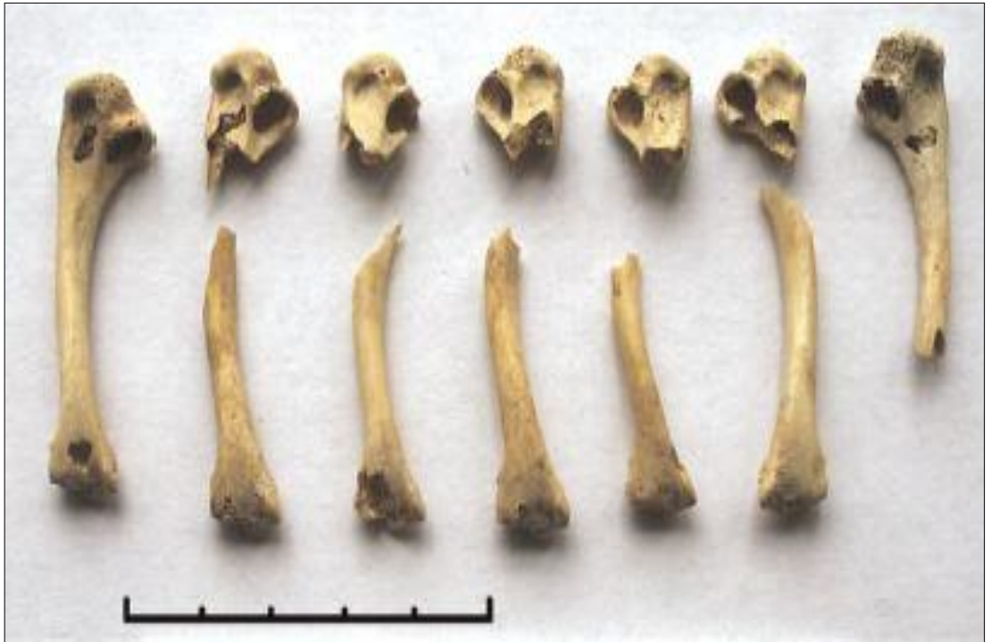
Resim 17. Sagalassos'ta Ele Geçirilen Alectoris chukar 'a ait Humerus Kemikleri (De Cupere vd., 2009: 11)