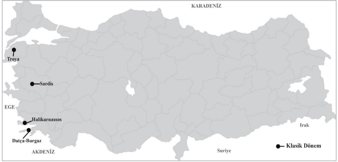
Şekil 7. Anadolu Klasik Dönem Yerleşmeleri

Tablo 35'de Klasik Dönem'de iskan görmüş Datça-Burgaz, Halikarnassos, Sardis ve Troya antik yerleşmelerinin zoarkeolojik kalıntıları incelenmiştir.