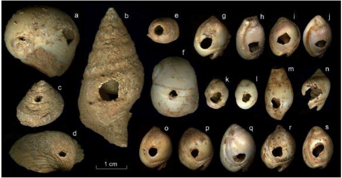
Resim 3. Üçağzlı Mağarasında Çeşitli Katmanlarda Bulunan Delikli Deniz Kabuğu Süslemeleri: a) Naticarius stercusmuscarum ; b) Euthria cornea ; c) Gibbula sp.; d) Aconthocardia tubercalatum ; e) Conus mediterraneus ; f) Naticarius sp.; g-j) Nassarius gibbosulus ; k-l) Theodoxus sp.; m) Melanopsis praemorsa ; n) Nassarius mutabilis ; o-s) Nassarius gibbosulus (Stiner vd., 2013)