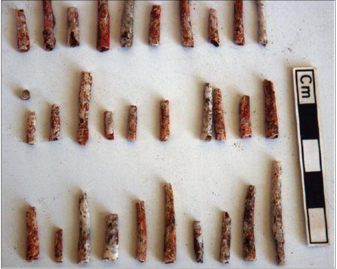
Resim 5. Pınarbaşı Epipaleolitik Alanda Ele Geçirilen Dentalium Kalıntıları (Baird vd., 2013)