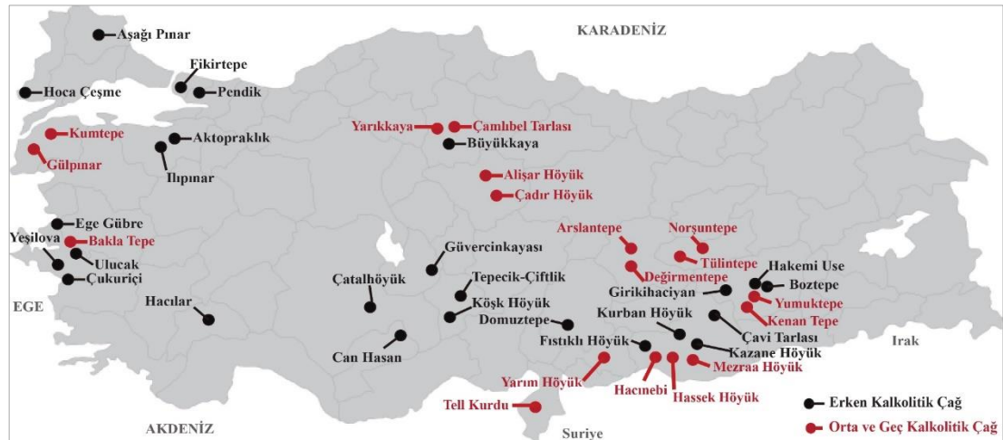
Şekil 3. Anadolu Kalkolitik Çağ Yerleşimleri

Kalkolitik Çağ'da insanlar bakırı ve tekerleği biliyorlardı. Özellikle tekerlek uzamsal anlamda insan hayatında büyük değişikliklere neden olmuştu. Artık mekanda daha bağımsız hareket eden insan için antik ticaret ve ulaştırma çok boyutlu bir hal almıştı. Sonuçta ürünlerin yayılımı kolaylaşmış ve buna bağlı olarak yeni iş alanları ortaya çıkmıştır.