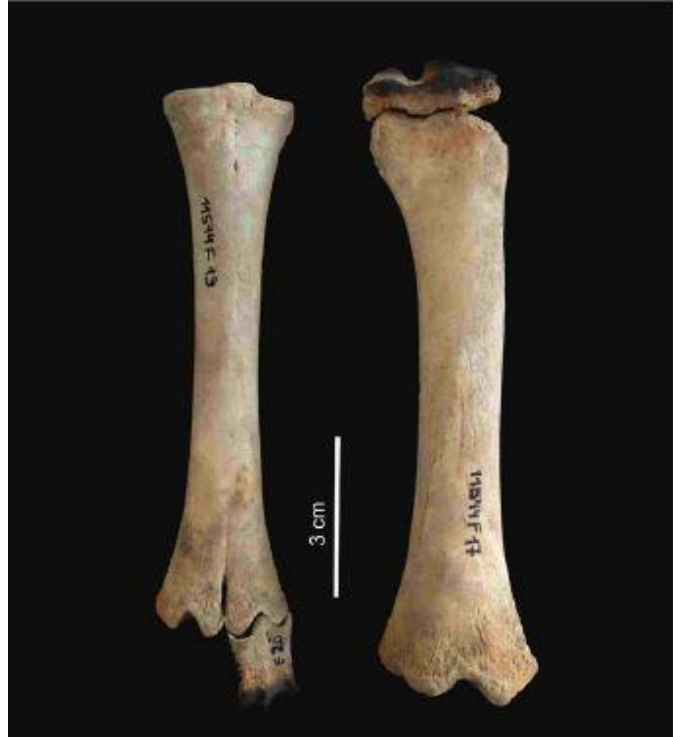
Resim 6. atalhyk'te Ele Geirilen Ovicaprid Kalıntısı (Pawłowska, 2014: 5)

Doęu atalhyk'te besin retimi ile ilgili faaliyetler bařlamıřsa da avcılık-toplayıcık etkinlikleri ile ilgili pratikler srdrlmektedir. Evcil koyun ve kei alanda ele geirilen kemiklerin byk oęunluęunu oluřturmaktadır. Sıęır muhtemelen Gneydoęu Anadolu ya da Suriye'de evcilleřtirilip atalhyk'e getirilmiřtir. Evcil ya da deęil atalhyk halkı sıęırını aynı oranda tketerken, koyun yetiřtiricilięinde artıř olmuřtur (Resim 6). Bazı arařtırmacılar sıęırın Yakın Doęu'da pek ok yerde simgesel bir anlatımı olduęunu bu nedenle ruhsal ya da manevi bir anlamı olabileceęini dřnmektedir (Russell, 2016).