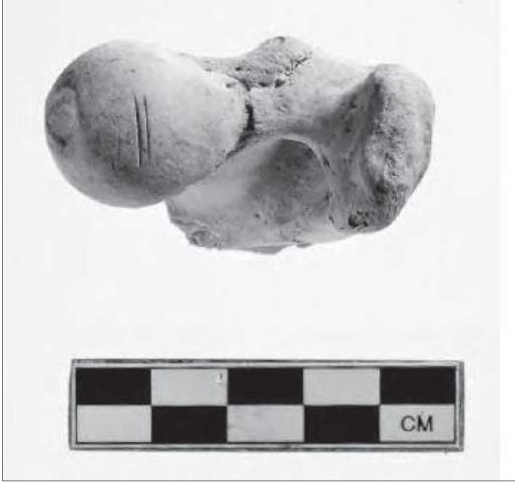
Resim 12. Kilise Tepe'de Koyuna Ait Sağ Femur Başında Kesik İzleri (Popkin, 2013: 106).

(Resim 12). Bunlara ek olarak kazı alanlarında çeşitli deniz canlılarına ait kalıntıların ortaya çıkarılması insanlık balıkçılık da yaptıklarını göstermiştir.