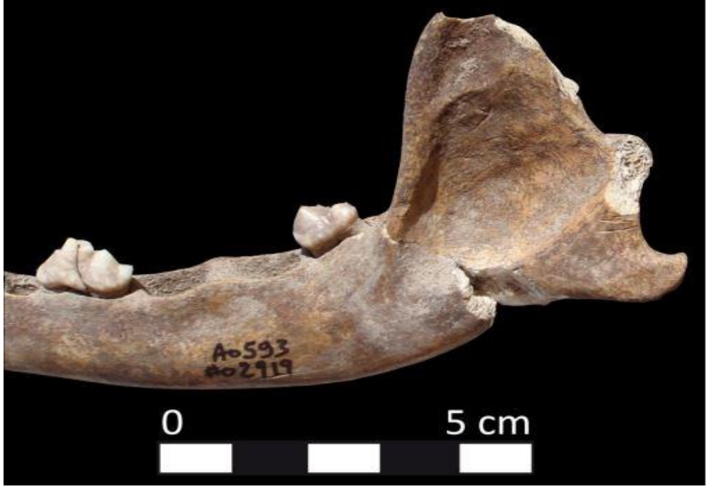
Resim 10. Hirbemerdon Tepe'de Bulunan Köpek Mandibulası'nda Saptanan Kesik İzi (Berthon, 2011)

Tunç ve Demir Çağ'ında domuzun ana tüketim kaynaklarından olduğu şüphe götürmez bir gerçektir. Domuz verimli bir besin kaynağıdır ve Yukarı Dicle Nehri Vadisi'nde ele geçirilen domuz kalıntıları üzerinde gerçekleştirilen çalışmalar bu hayvanların özellikle etleri için beslendiğini göstermektedir. OTÇ toplulukları, bu hayvanların etlerinin yanında sert kıllarından da faydalanmış olabilirler. Evcil domuzun dışında yaban domuzuna ait kalıntılar da OTÇ 'de ele geçirilmiştir. Erişkin domuzlar bol miktarda et vermelerinin dışında, ekili arazilere zarar verdikleri için de avlanmış olabilirler (Berthon, 2011: 94-95).