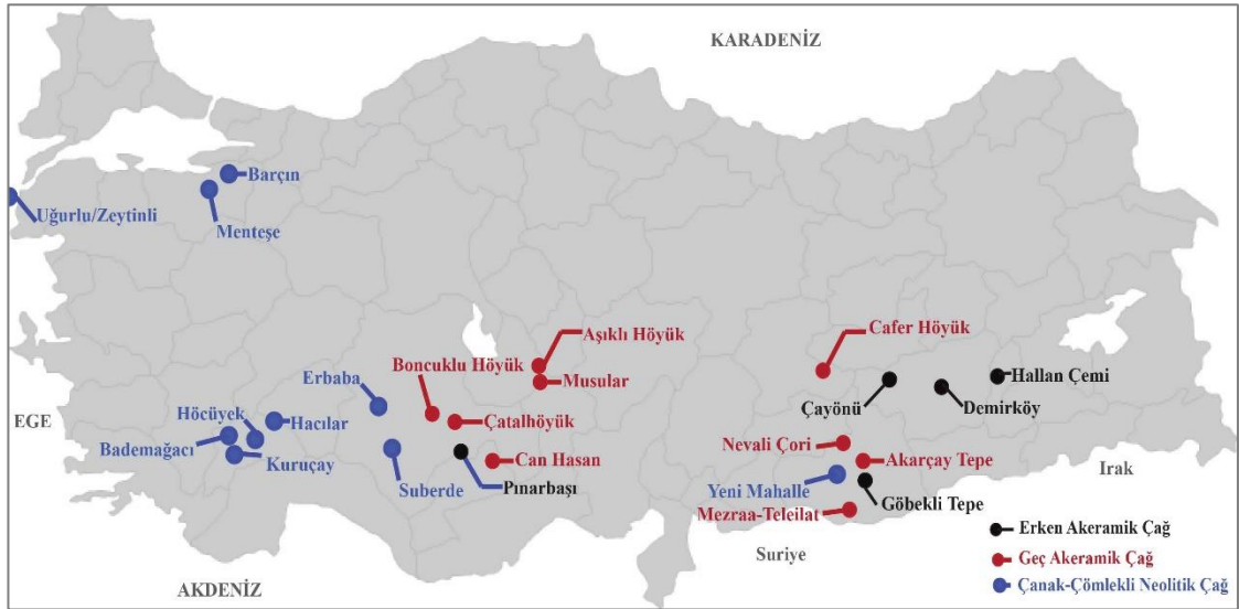
Şekil 2. Anadolu Neolitik Çağ Yerleşimleri

Anadolu'da bu farklılaşmaların yansımalarının kanıtları pek çok farklı alanda, kendini göstermektedir. Buna göre temelde Anadolu Neolitik'i seramik kullanımının var olup olmamasına göre Çanak Çömleksiz ve Çanak Çömlekli Neolitik Çağ olarak ikiye ayrılır 1 (Sagona ve Zimansky, 2009: 38). Anadolu, Neolitik Çağ'da pek çok yerleşime ev sahipliği yapmıştır. Şekil 2'de görülebileceği üzere bu çağda Güneydoğu Anadolu Bölgesi yoğun bir şekilde iskân edilmiştir.