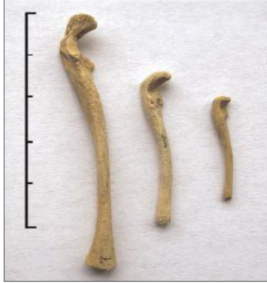
Resim 16. Sagalassos'ta Ele Geçirilen Lepus europaeus 'a Ait Ulna Kemikleri (De Cupere vd., 2009: 6)

Allactaga euphratica ve Alectoris chukar 'dır (Resim 16, Resim 17) (De Cupere vd., 2009).