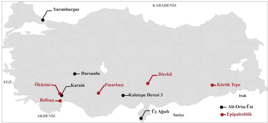
Şekil 1. Anadolu Paleolitik Çağ Yerleşimleri

Anadolu Paleolitik Çağ'da saptanan mağara, açık alan ve yerleşimler Şekil 1'de verilmiştir. Buna göre Paleolitik Çağ'a tarihlendirilen çalışması yapılan yerleşimlerin çoğunlukla Akdeniz ve Marmara Bölgesi'nde yoğunlaştığı açıkça görülmektedir.