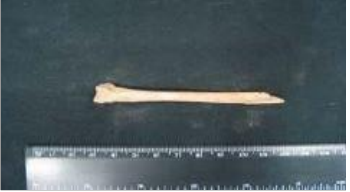
Resim 19. Metropolis'te Açıđa Çıkarılan Kanatlı Hayvanın Bacak Kemiđi (Yıldırım, 2010)

kemiklerini kırılğından kaynaklanmış olduđu düşünölmüştür (Yıldırım, 2010: 183).