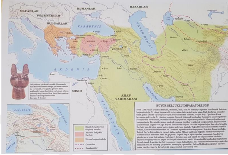
Harita 2. Mâtürîdî'nin Yaşadığı Dönemde siyasi Coğrafya

Mâtürîdî'nin ilmi coğrafyadaki konumunu tespit açısından Serinsu'nun hazırlamış olduğu haritaya 67 burada yer vermek konunun anlaşılmasına olumlu katkı sağlayacaktır.