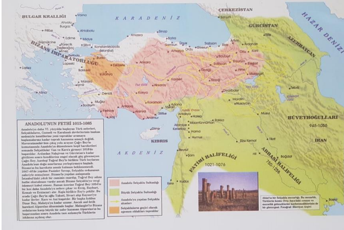
Harita 1. Mâverdi'nin Yaşadığı Dönemde siyasi Coğrafya 23

İslam Tarihinde takribî 508 yıl devam eden bir imparatorluk dönemidir. 37 halife görev yapmıştır. Moğolların, son Abbasî Halifesi Mu'tasım Billah'ı öldürmesiyle Abbasîler dönemi sona ermiştir. Bu uzun süre içinde Şîî Büveyhîler'in (Hicrî 334-447) Abbasî hilafetinin sıkışmış olduğu Irak ve İran coğrafyasında hâkimiyet tesis ettikleri görülmektedir. 22