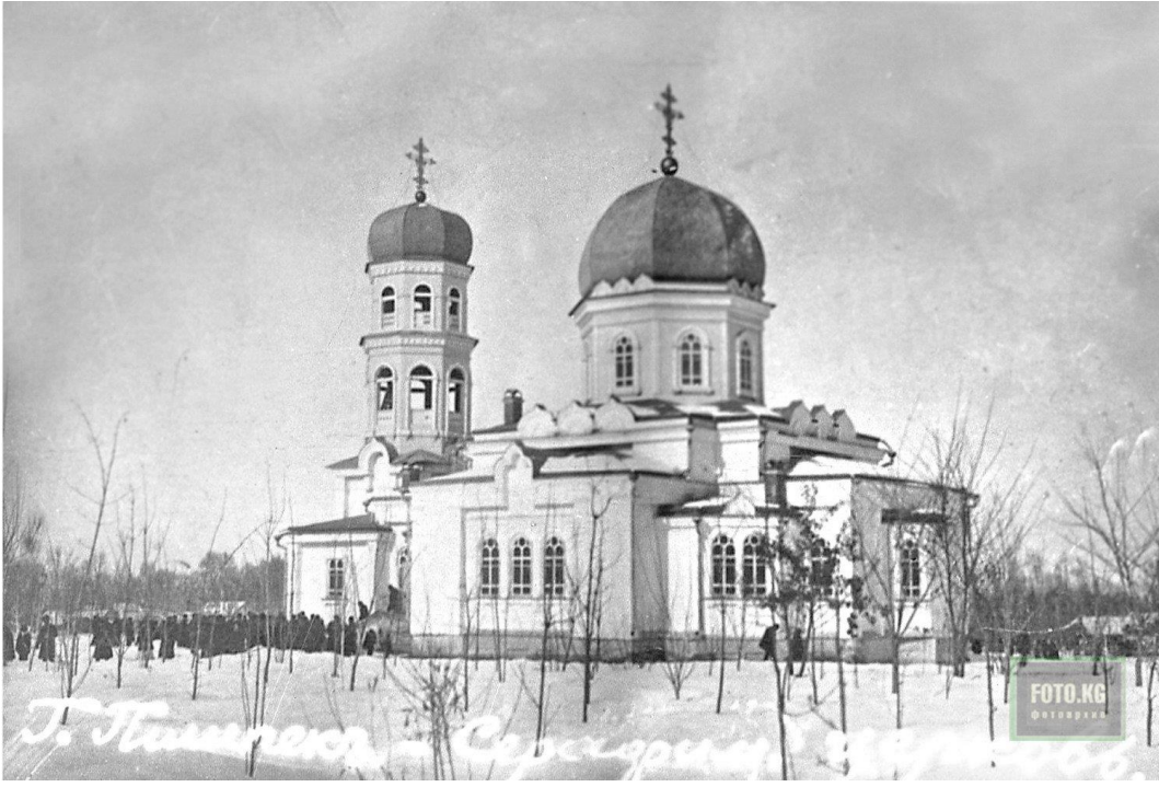
Ek. 5: Kutsal Serafim Kilisesi. Pişpek (Bişkek)