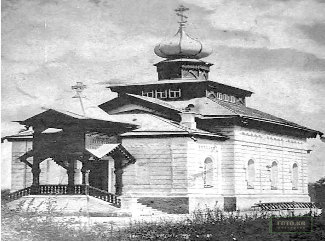
Ek. 1: Resim. Aziz Nikola Kilisesi. Pişpek (Bişkek)