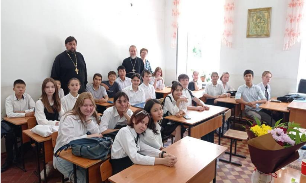
Ek. 7: Oş Şehrindeki “Svetoç” Kilise Okulunda Ders Sırasından Resim