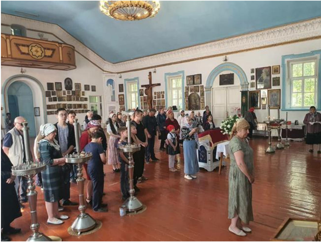
Ek. 6: Oş şhrindeki Başmelek Mikail Kilisesinde ayin sırasında