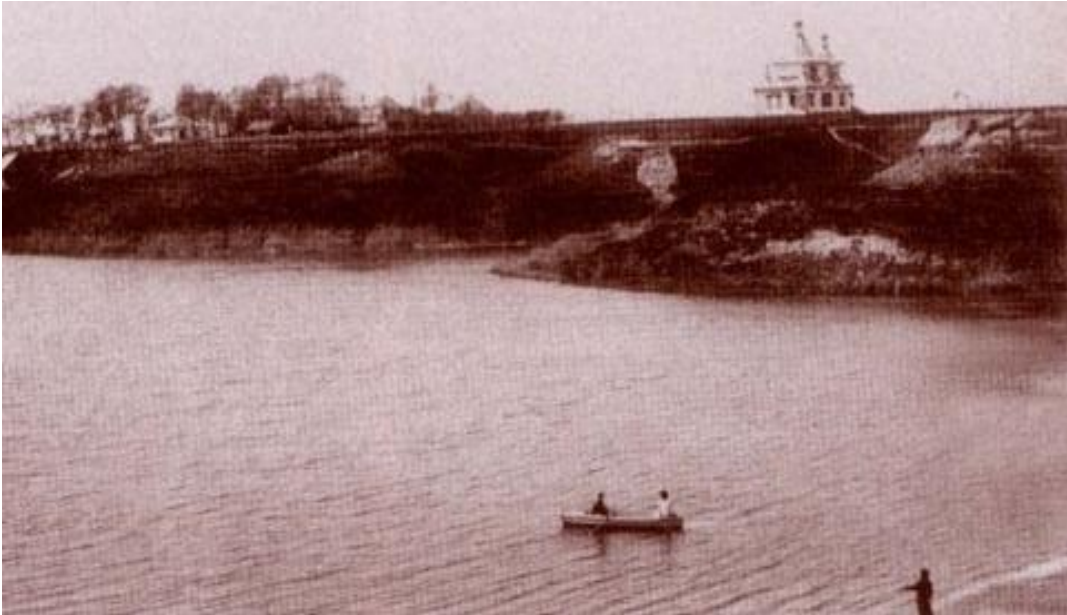
Ek. 2: Issık Göl Kutsal Üçlü Manastırı