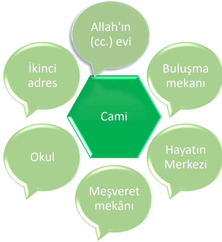
Şekil 2: Sosyal Hayatta Cami

Camiler ibadethane olmasının yanında birçok kültürel, sosyal ve idari işlevleri olan önemli bir sosyalleşme mekânıdır. Özellikle yetişkinliğin son dönemi yaşlılık döneminde bireylerin dost ve arkadaşlarını burada bir araya getirmekte, dert ve sıkıntılarını paylaşarak çareler arayabilmekte ve dolayısıyla camilerin sosyal işlevinin de ön plana çıkardığını ortaya koymaktadır.