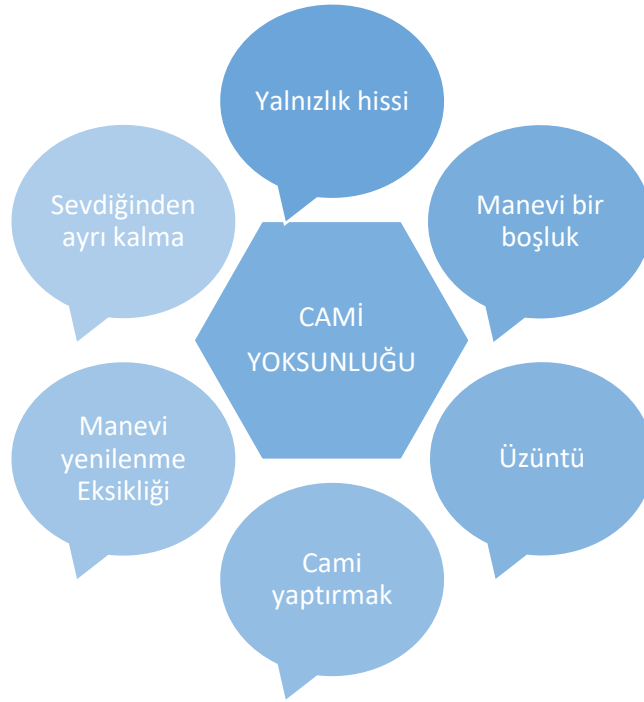
Şekil 4: Cami Yoksunluğunun Etkileri

“Cami yoksa en yakın yerde cami yaptırmak için elimizden gelen her şeyi yaparız.” (K.6, y. 53, Emekli Asker)