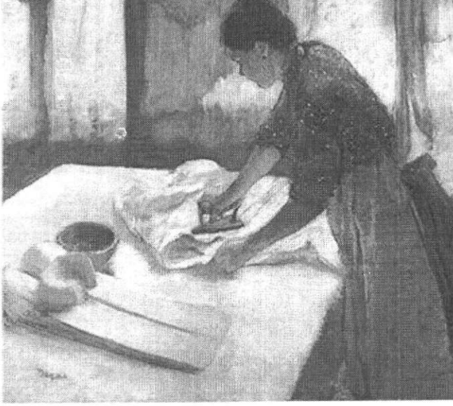
Edgar Degas, Ütü yapan kadın (1882). Ulusal Sanat Galerisi – Washington

3. Eğer çağdaş yaşamdan bir sahne resmedecek olsaydınız ne tür bir sahne resmederdiniz? (özgün düşünme).