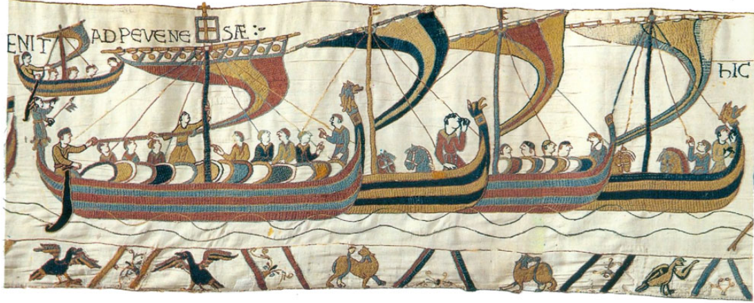
Şekil 4: Normanların İngiltere'yi fethettikleri 1066 Hastings Savaşı'nı anlatan Bayeux Tapestry'den dokuma örnekleri.