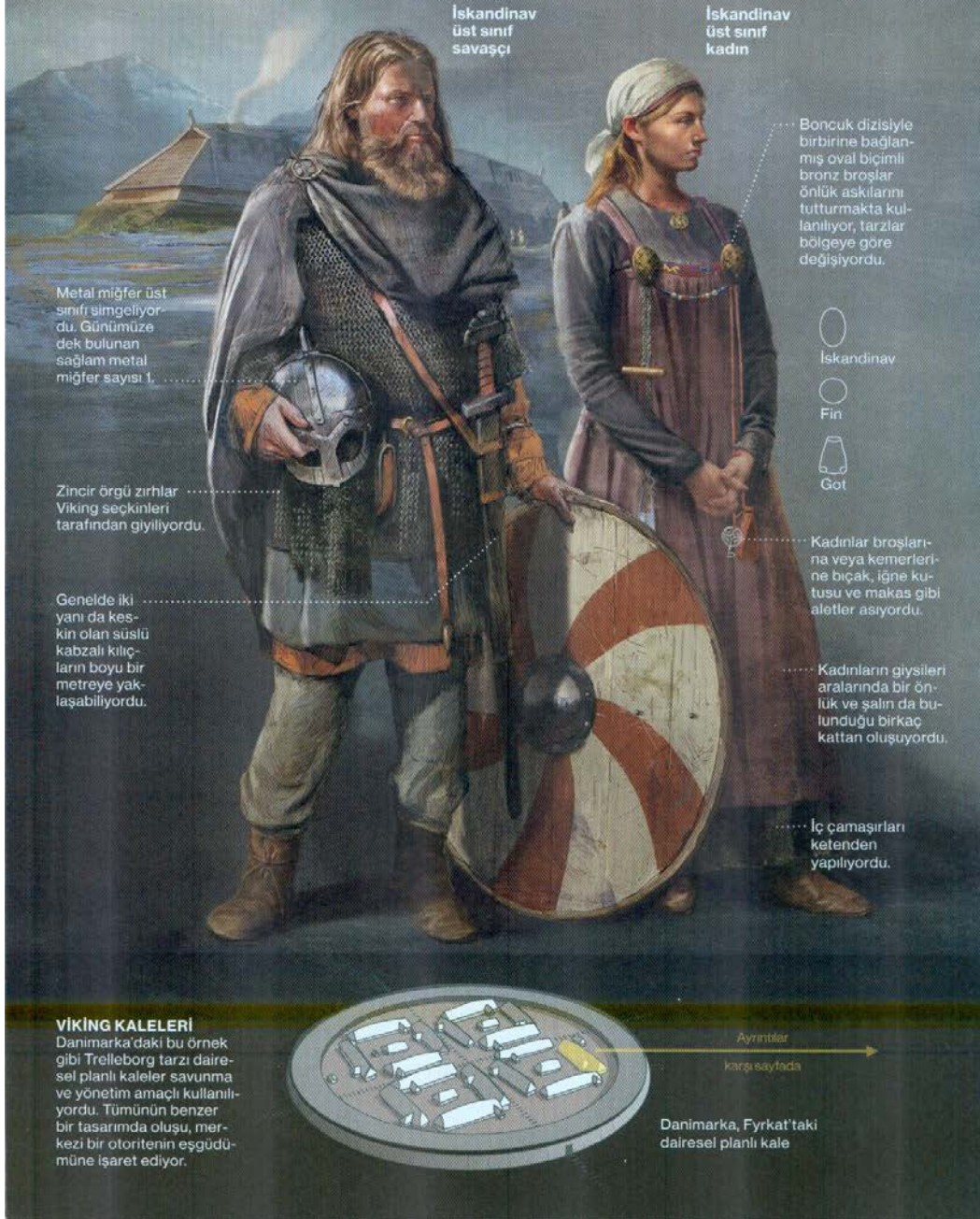
Şekil 8: İskandinavya Vikinglerinin tasviri.

Viking anavatanı sayılan Norveç, Danimarka ve İsveç halkları ortak bir denizcilik geleneği paylaşıyor ve birbiriyle rekabet halindeki bölgesel krallar ve başkanlar tarafından yönetiliyordu; köleler, özgür kişiler ve soylulardan oluşan sınıf ayrımına dayalı bir toplumsal hiyerarşi hâkimdi.