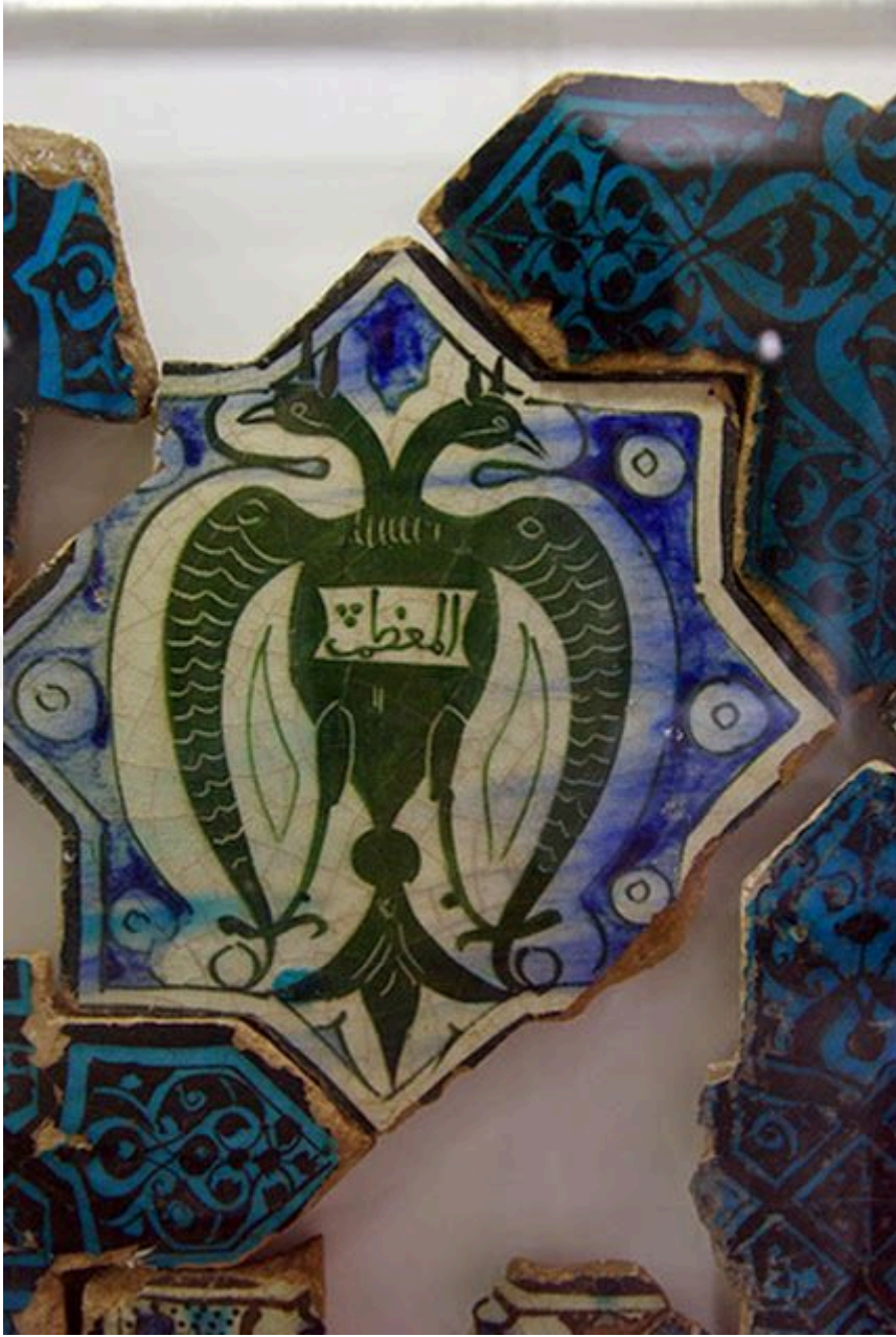
Şekil 3: Selçuklu çift başlı kartalı çinisi.