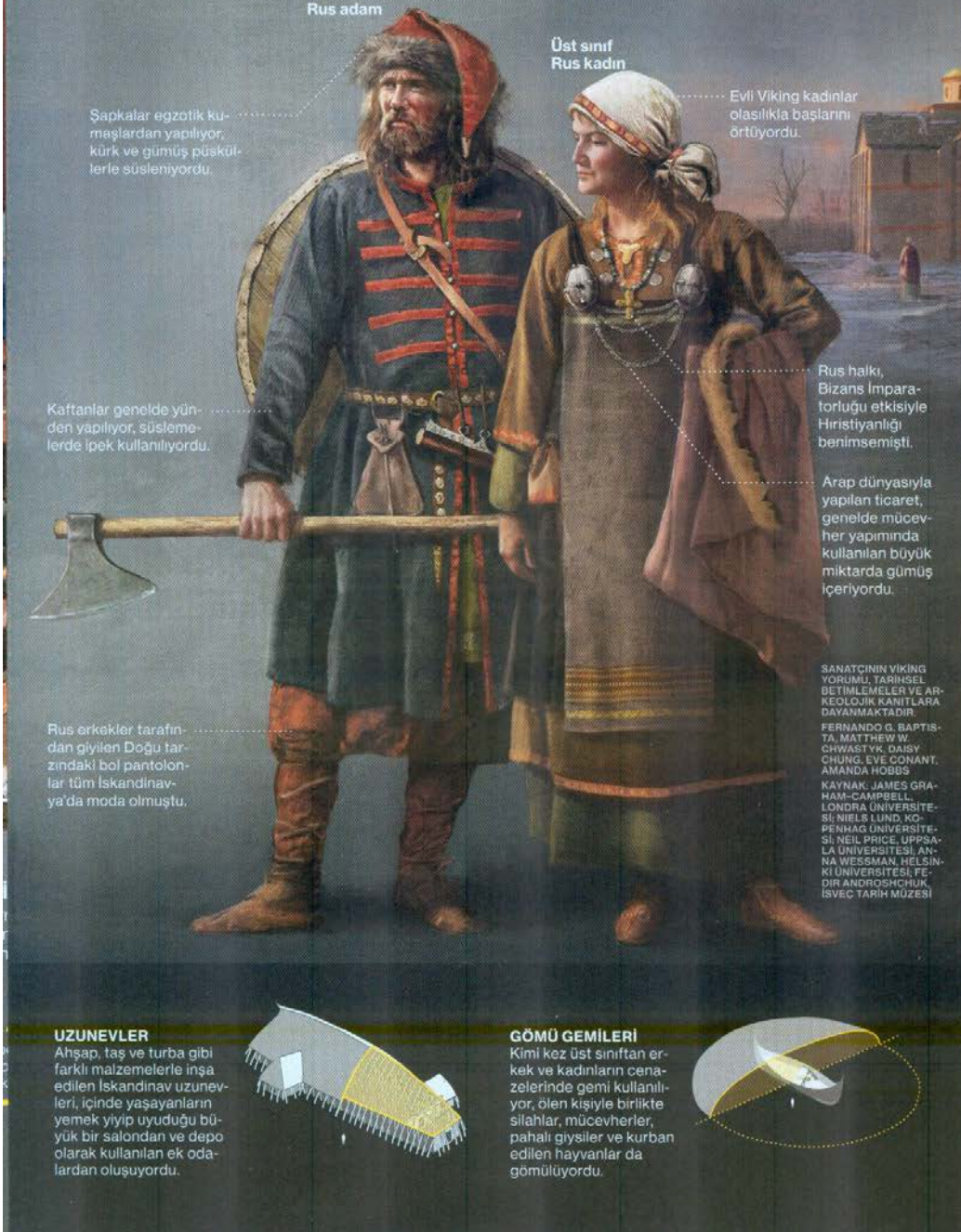
Şekil 7: Doğudaki Vikinglerin, Rusların, tasviri.

İsveçli tacirler, İskandinavların sekizinci yüzyılda doğuya doğru gerçekleşen yayılımında etkin rol almış ve Rus halkının lideri haline gelmişti. Birden çok etnik yapı barındıran Rus halkı, Arap ve Bizans dünyasıyla ticaret yapıyordu ve Novgorod gibi ticaret kentleri kurmuştu.