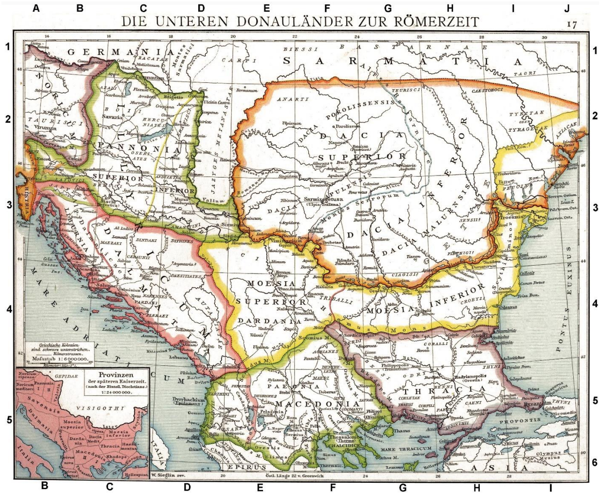
Geç Antik Çağ'da Daçya (Gothia) ve Mezya bölgesini gösteren bir harita

( https://upload.wikimedia.org/wikipedia/commons/b/b1/Roman_provinces_of_Illyricum%2C_Macedonia%2C_Dacia%2C_Moesia%2C_Pannonia_and_Thracia.jpg )