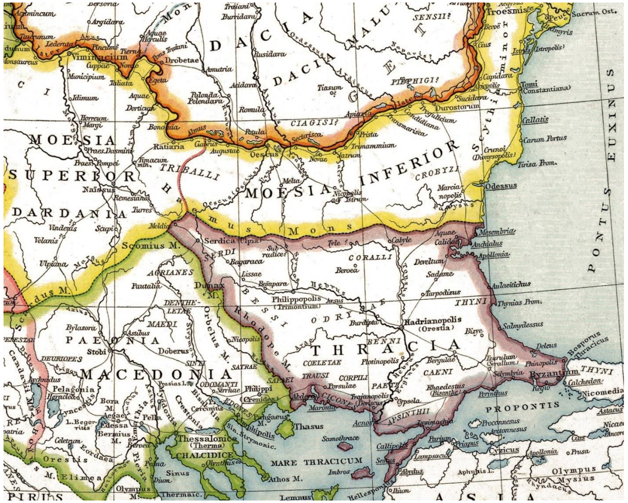
Daçya, Mezya ve Trakya haritası

https://upload.wikimedia.org/wikipedia/commons/f/ff/Thracia Cutcut from Roman provinces of Illyricum%2C Macedonia%2C Dacia%2C Moesia%2C Pannonia and Thracia.jpg