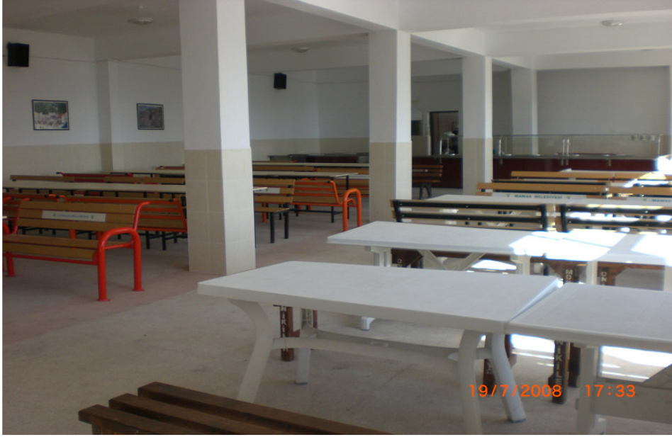
7. Kesimhanenin yanında bulunan aşevi.