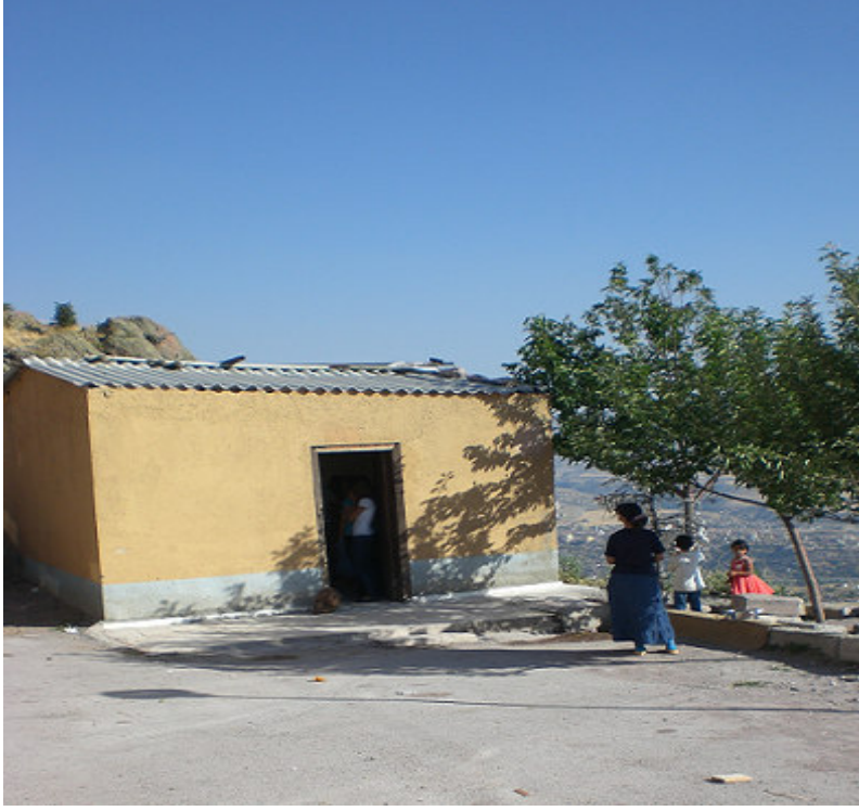
6. Seyyid Hüseyin Gazi türbesinin bulunduğu alanda yer alan kesimhane.