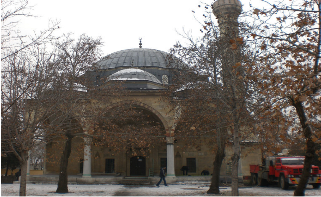
4. Cenabi Ahmet Paşa Camii.