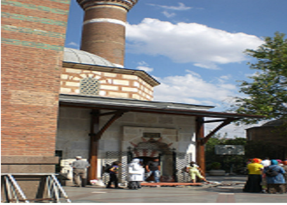
1. Hacı Bayram-ı Veli Türbesi.