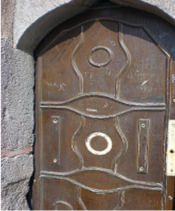
2. Üzerine dileklerin yazıldığı minare kapısı.