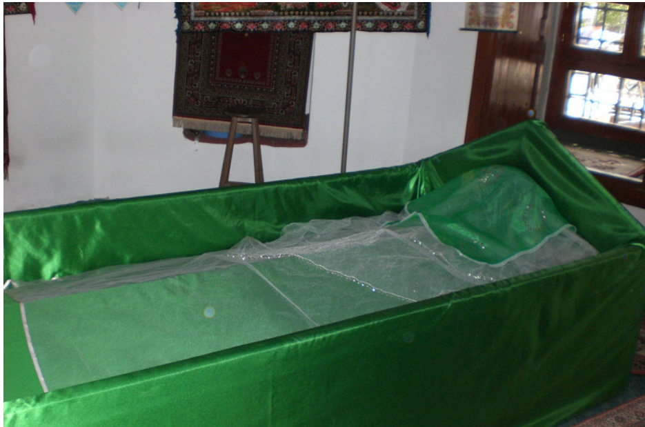
13. Türbenin içinde yer alan sanduka.