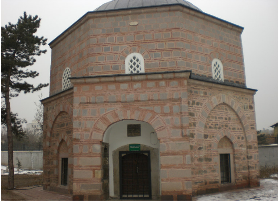
10. Karaca Bey Türbesi.