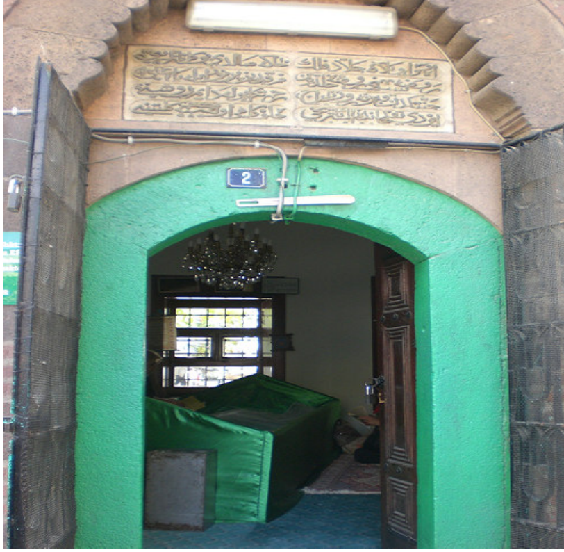
12. Türbenin giriş kapısı ve üzerinde yer alan kitabe.