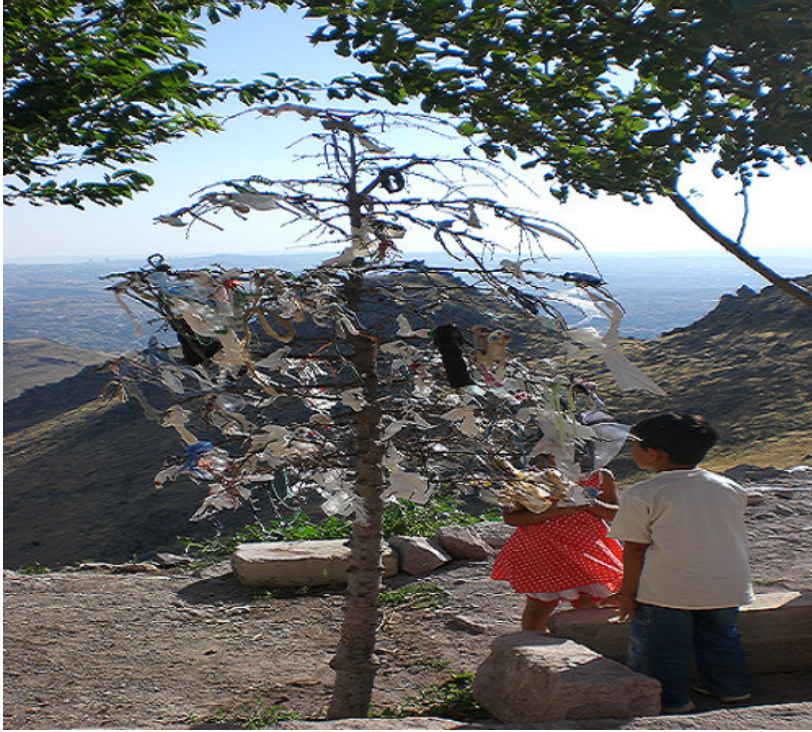
9. Türbenin etrafında dallarına çaput bağlanmış bir ağaç.