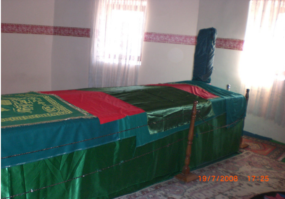
5. Türbenin İçindeki Sanduka.