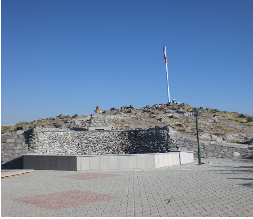
8. Türbenin bulunduğu alandan bir görünüm.