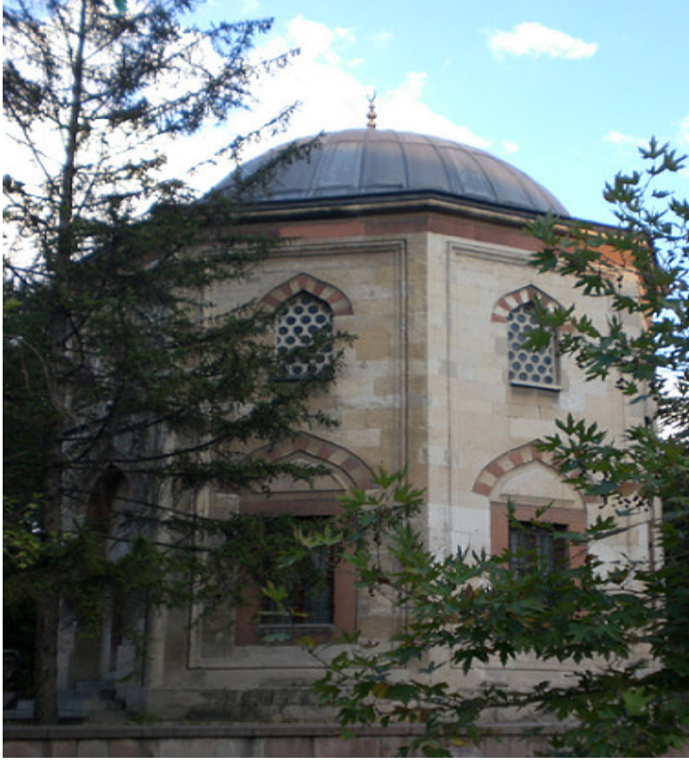
3. Cenabi Ahmet Paşa Türbesi.