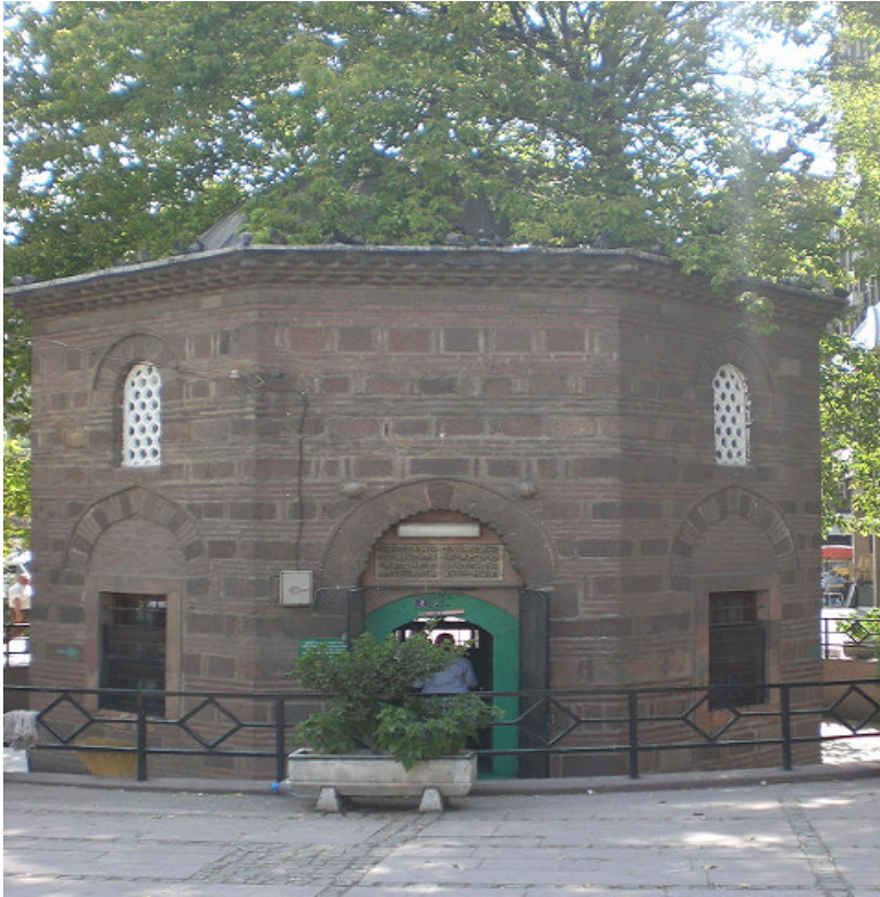
11. Karyađdı Hatun Türbesi.