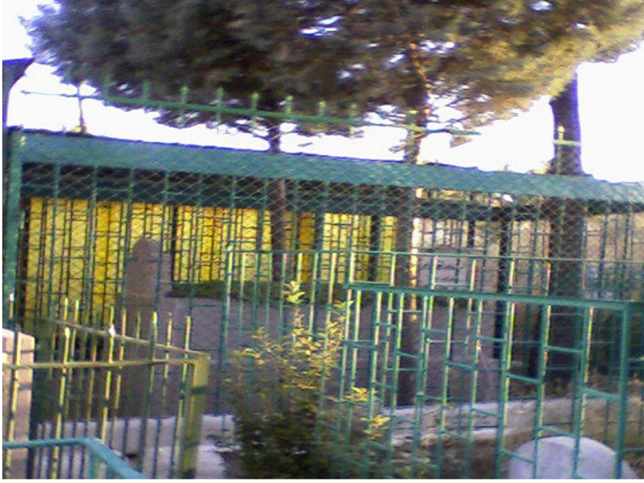
14. Abdulhakim Arvasi Türbesi.