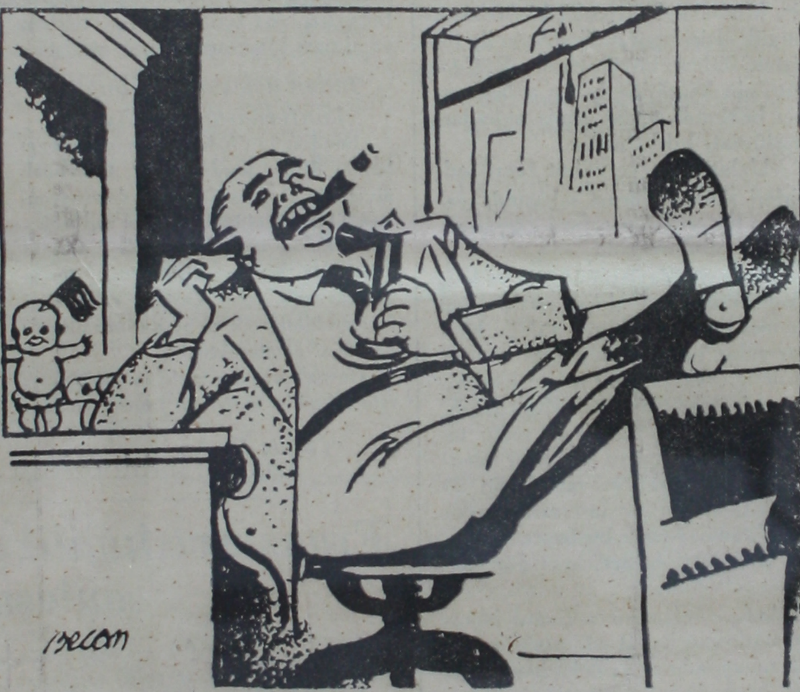
Amerikalı endüstriyel — Hello, üç bin kilo dinamit sevkedeceksiniz, tabii bitaraf devlete! La Repüblük'ten