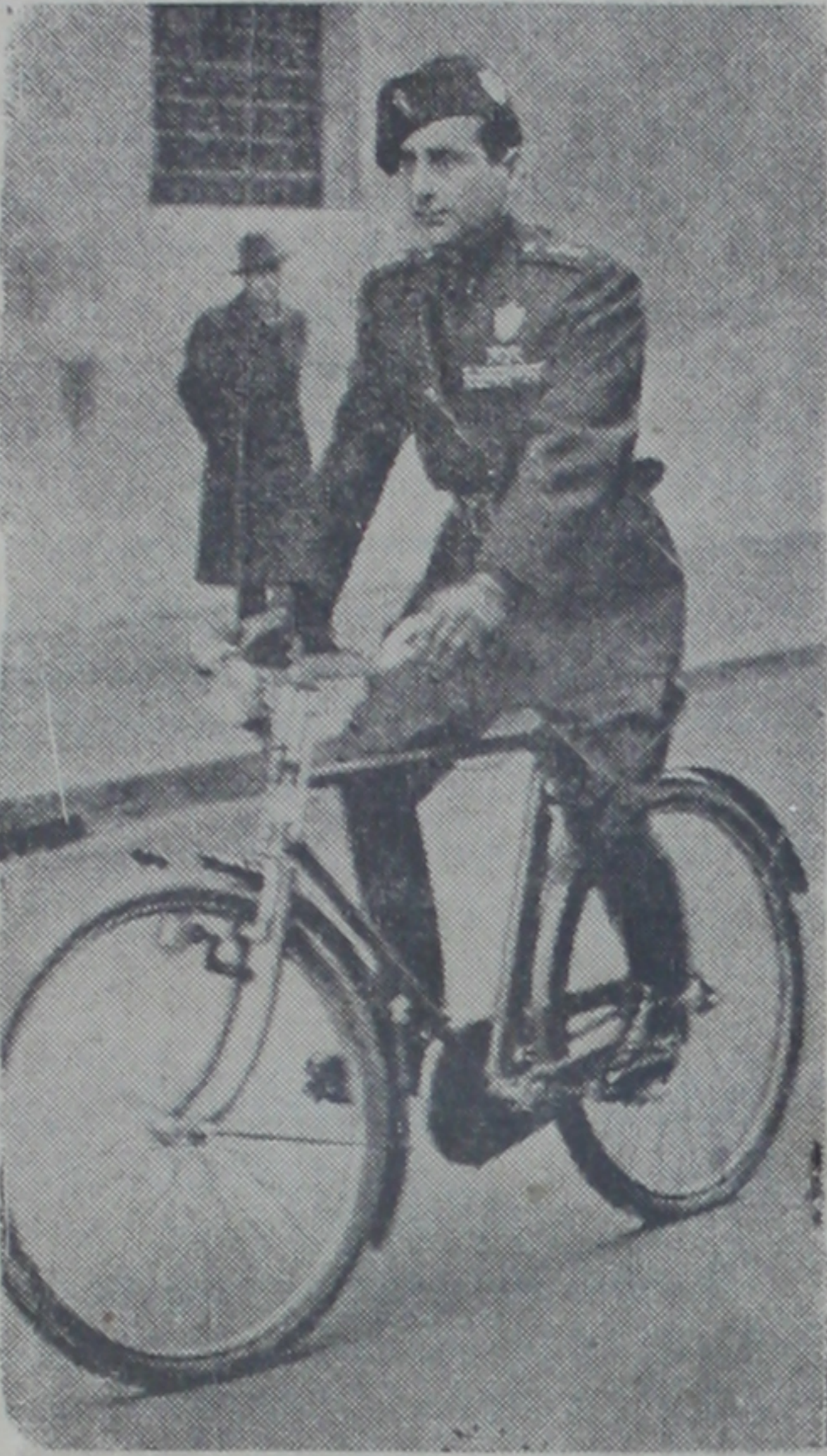
Zecri tedbirlerin beklenmeyen netice. Petrol ambargosu tehlikesi dolayısıyla Faşist Genel Partisi sekreteri Venedik sarayına bisikletle gidiyor.

Londra, 14 (A.A.) — Deyli Ekspres gazetesinin bildirdiğine göre kabinenin yarınki toplantısında B. Eden, Milletler Cemiyetinin bir ideal olarak müdafaa ettiğini