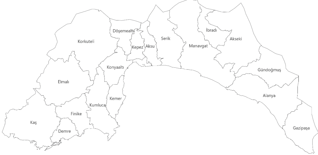
Şekil 1.3 Antalya il haritası (Microsoft Excel yardımıyla hazırlanmıştır)

(Şekil 3.3). Nüfusu 2023 yılı verilerine göre yaklaşık 2.7 milyondur (Anonim 2024c). Net göç hızı %11,04, ortalama hane halkı büyüklüğü 2,94'tür. Kişi başına düşen GSYH 11495$ ile ülke ortalamasının altındadır (Anonim 2024b).