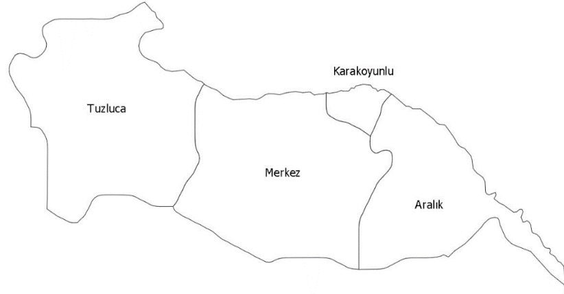
Şekil 1.2 Iğdır il haritası (Microsoft Excel programı kullanılarak hazırlanmıştır)

Türkiye'nin en yüksek dağı olan Ağrı Dağı'nın yüzölçümünün üçte ikisi Iğdır il sınırları içerisinde yer almaktadır. Çevresini kaplayan Ağrı Dağı, Zor Dağı, Pamuk Dağı gibi dağlık alanlara göre kuytu konumda olması nedeniyle mikroklima oluşturan Iğdır'da bölgenin diğer kesimlerinde görülen şiddetli karasal iklim etkileri görülmez. Tamamen Aras Nehri havzası içerisinde bulunan Iğdır 3664 km 2 yüzölçümüne sahiptir. Nüfusu 209.738 olup bu nüfusun %41,2'si köylerde yaşamaktadır. Net göç hızı %9,35 olup, kişi başına düşen GSYH'si 5539$ ile 13.110$ olan ülke ortalamasının çok altındadır (Anonim 2024b).