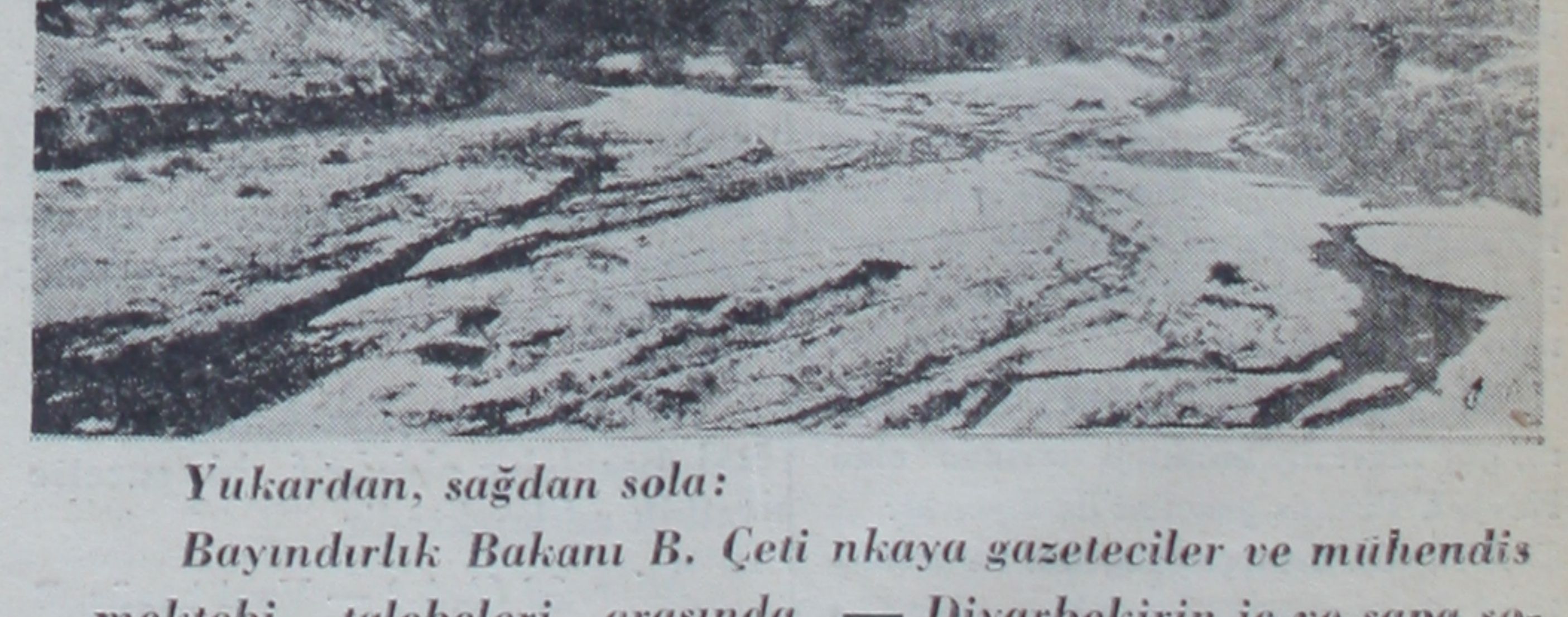
Yukardan, sağdan sola:

Bayındırlık Bakanı B. Çeti nkaya gazeteciler ve mühendis mektebi talebeleri arasında. — Diyarbekirin iç ve sapa sokakları bile böyle süslenmişti. — Diyarbekirin tarihî kalelerine uzaktan bir bakış. — Diyar bekire yaklaşırken Dicle. — Maden boğazının bakmakla do yulmayan güzel görünüşü. — Tünellerden birinden çıktuktan sonra. — Tren Gölcük'ten geçerken. — Gölcük kıyıları bak ır yolunun en güzel manzaralı bir kısmıdır. — Diyarbekir ka lesinin kaplılarından biri. — Dicle köprüsü. — Toroslardan geçiş. — Diyarbekire girerken.