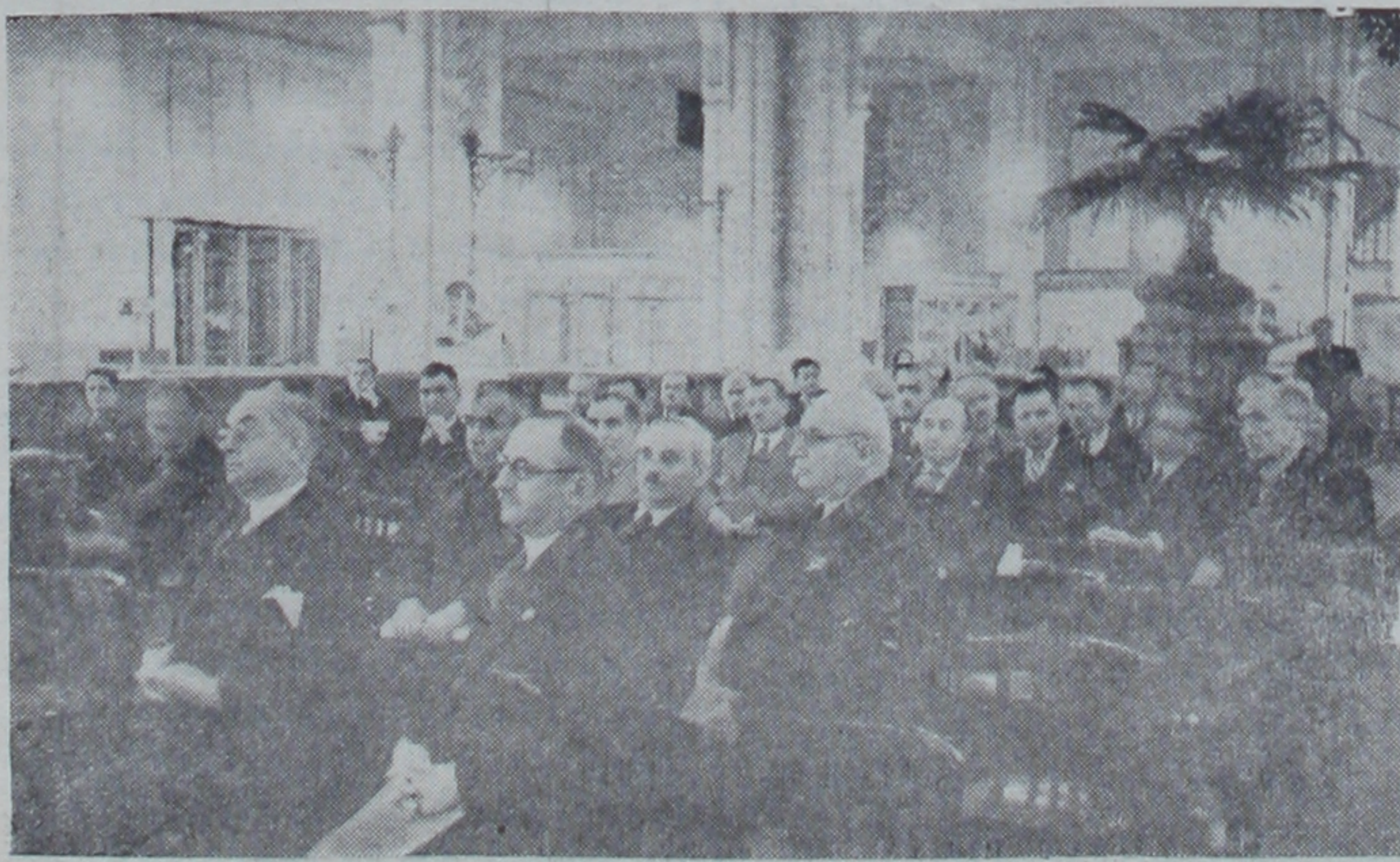
Ziraat Bankasının umumî heyeti toplantı halinde