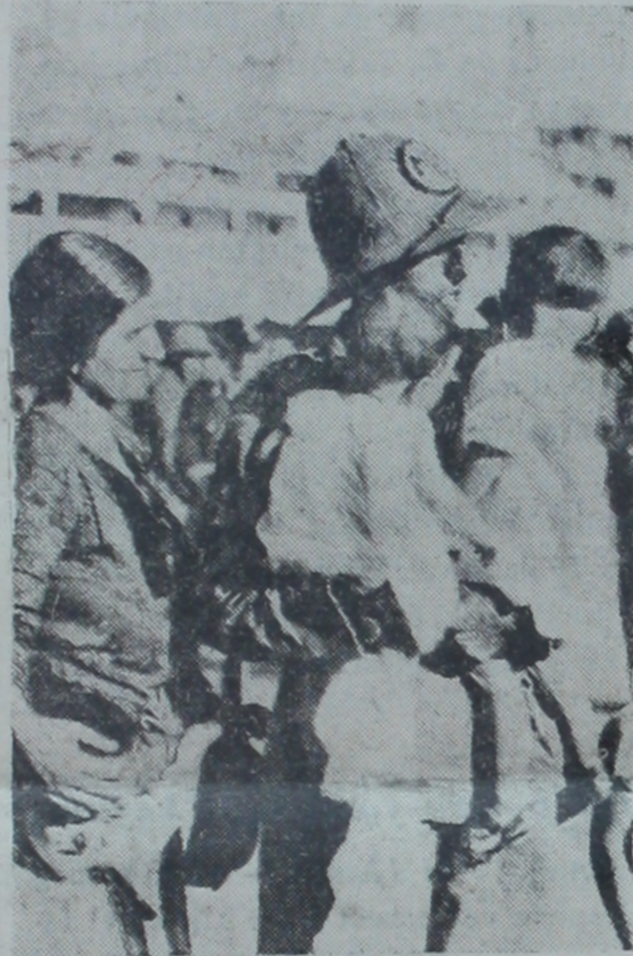
İtalyan askerleri doğu Afrikasına giderlerken

Britanya menfaatlerine zarar verebilecek hiç bir niyet beslemediğini, bir bildiriyle neşredecektir..,"