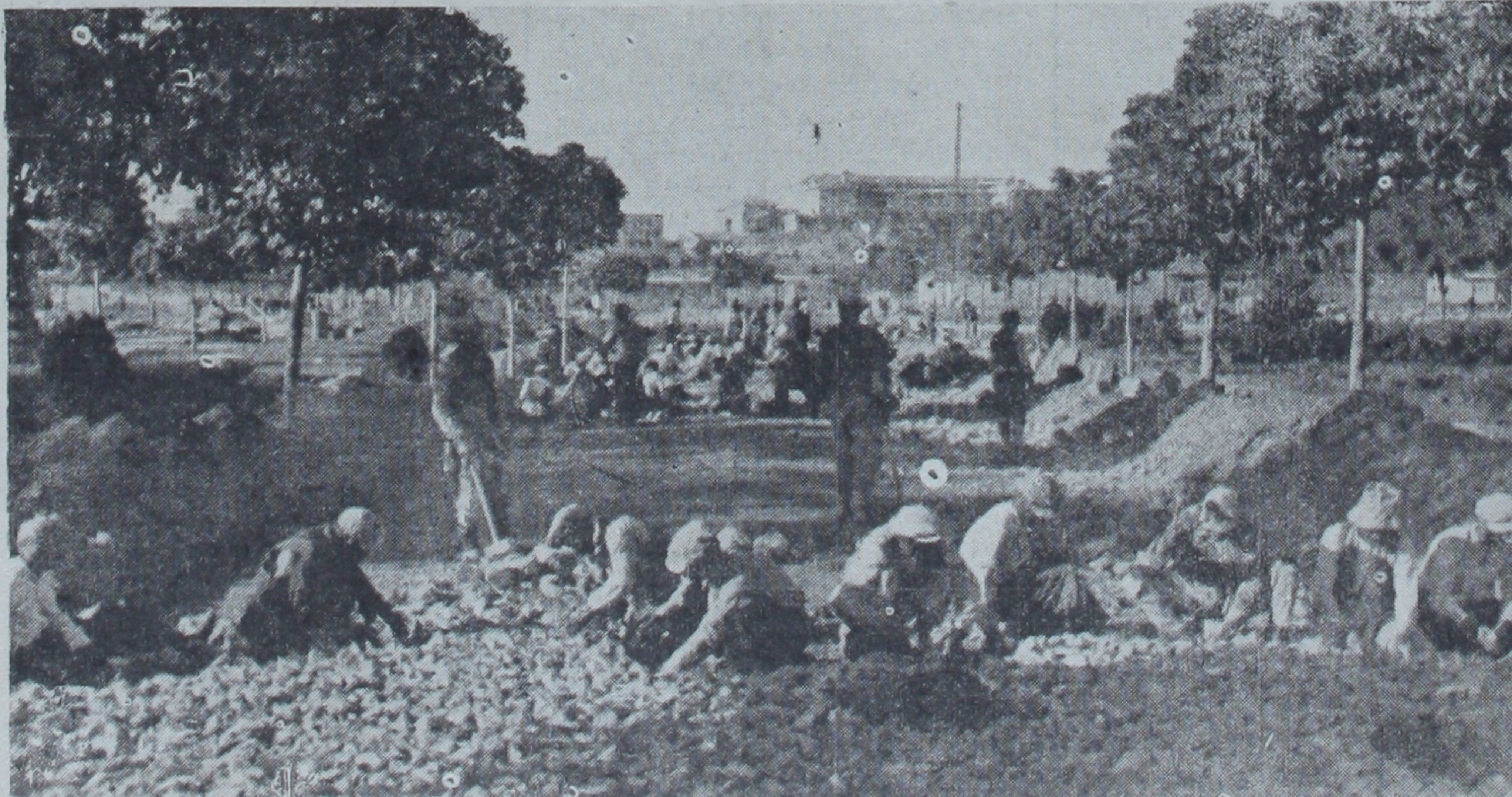
Ankara sokaklarından birçoğunun asfaltla kaplanması için parke taşları sökülüştü. Asfaltın altına gelecek olan balastın döşenmesi hemen hemen her tarafta bitmek üzere. Resmimiz, Dış Bakanlığı önünden Yenişehire giden caddedeki çalışmaları göstermektedir.