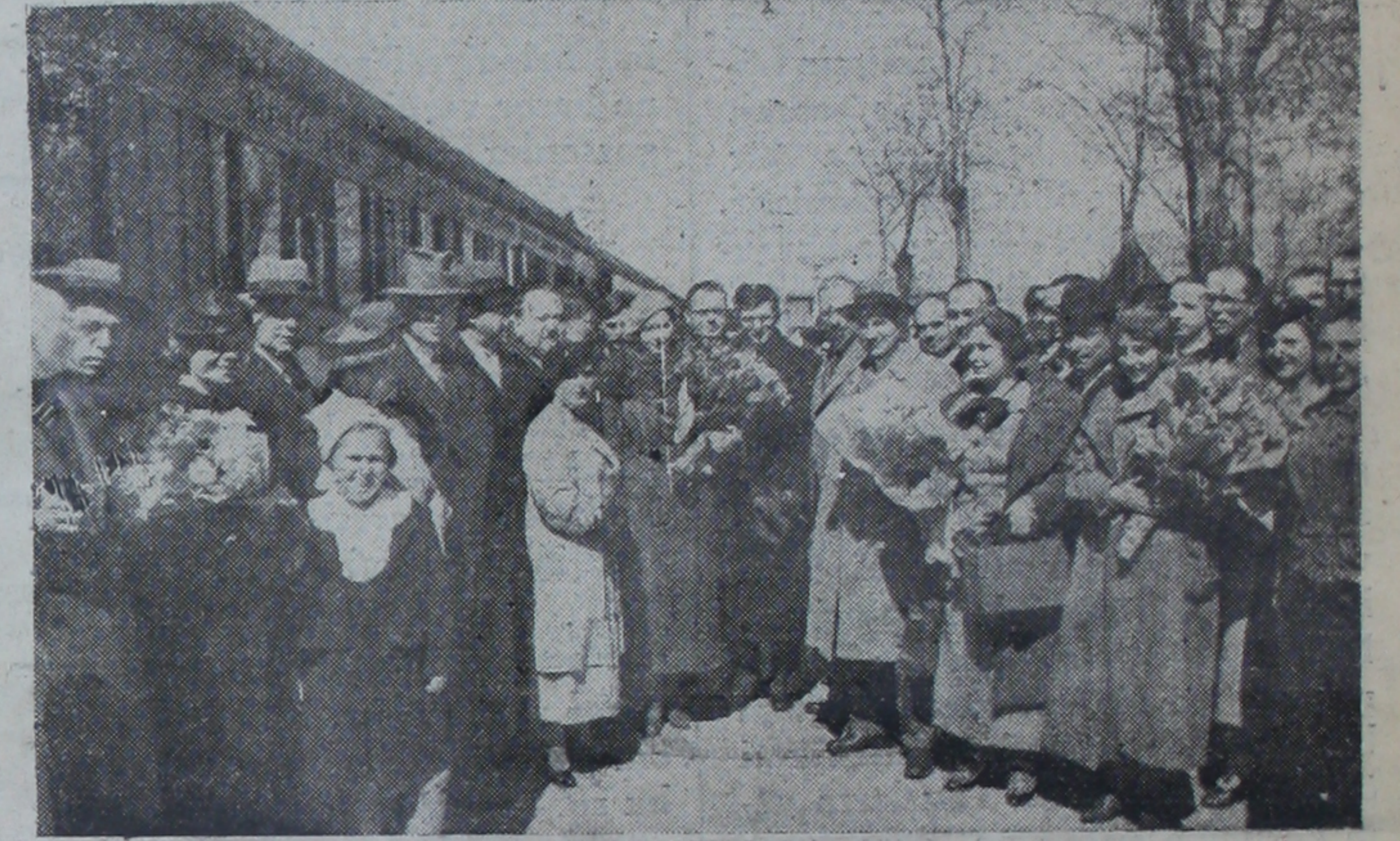
Misafirlerimiz Ankara durağında

Öğrendiğimize göre Sovyet rusyalı sayın misafirlerimiz türk müzikçileri için birçok opera notaları ile geçenlerde Moskova'da açılan tiyatro sergisinin 300 kadar resmini getirmişlerdir. Bu resimler münasib bir yerde ve bir (Sonu 3 üncü sayıfada)