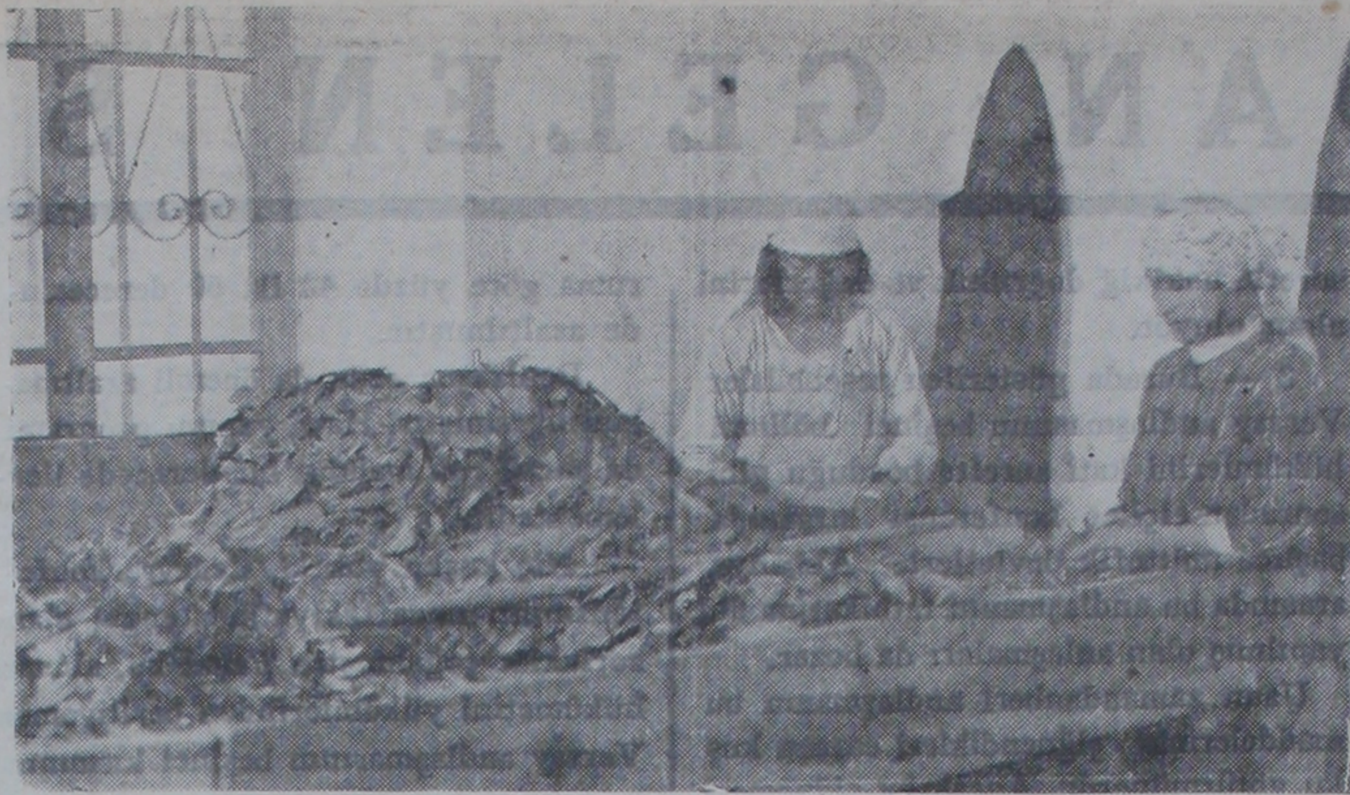
Tütün fabrikasında çalışan kadınlar

de teğmen (birinci mülazım) Bay Muammer tarafından zehirli gazlar hakkında olmak üzere ikisi verilmiştir. B. İhsan Rızanın, konferans mevzuu: Sıtmanın tarihi, en çok hangi memleketlerde vardır, nasıl meydana geldiği, şimdiye kadar nerelerde fazla tahribat yaptığı, ve krounma çareleridir. Teğmen, Bay Muammerin konferansının mevzuu ise: Gaz ne demektir Kaç çeşid zehirli gaz vardır, gazların tahribat neveleri, zehirli gazların harbi umumiye oynadığı rol, hangi devletler tarafından kullanılmıştır, ve ne miktar sarfedilmiştir. Gaz nasırlı havalarda kullanılır, maske koruma çareleridir.