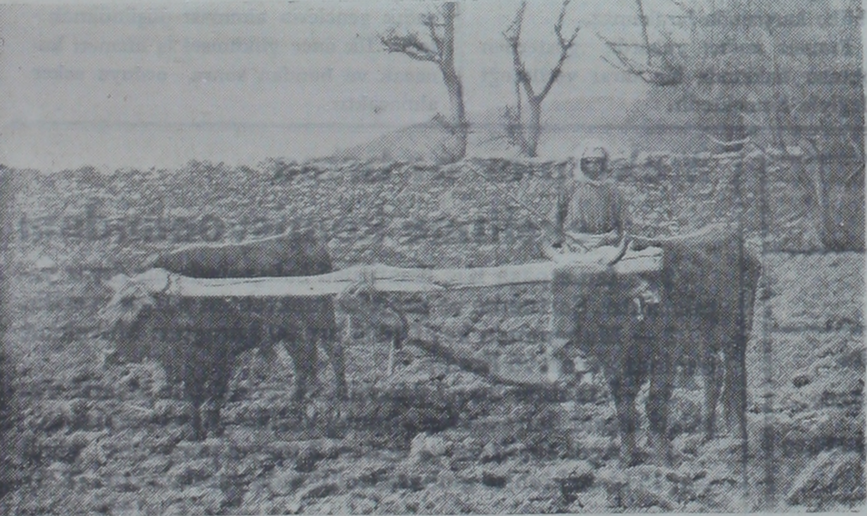
Muğla'da tütün işinde çalışan on bir bin kadından biri

Özel bildirimimizden: Gürbüzler yurdunun altı hafta için tertib ettiği konferansların birincisi geçen hafta Dr. Bay İhsan Rıza tarafından sıtma hakkında: bu cuma günü