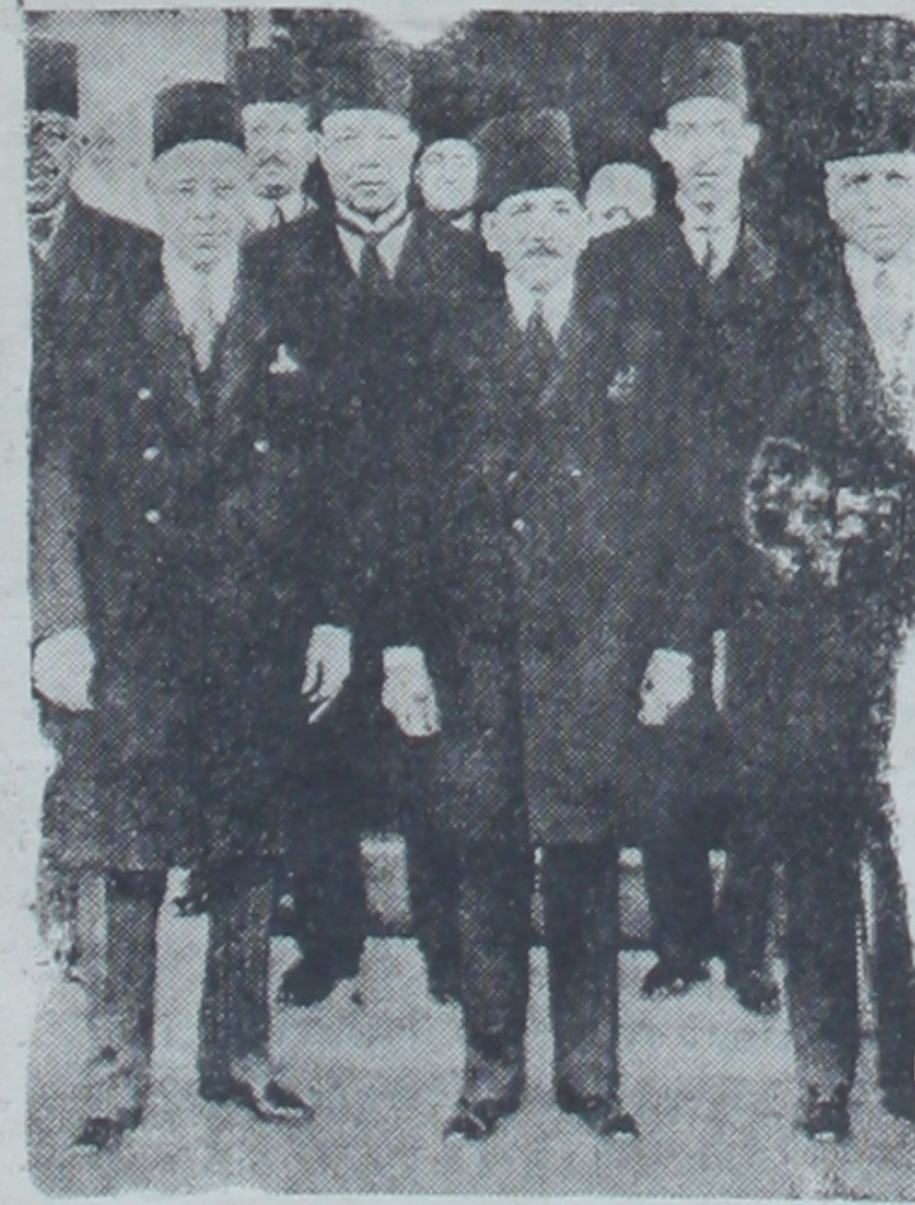
Wts. kabinesi azatları bir arada

Kahire, 2 (A.A.) — Britanya yüksek komiseri Sir Miles Lampson'la Mısır delegasyonu arasında görüşmeler bugün başlayacaktır. Mısırın 1922'deki istiklâl ilânında askıda kalan dört nokta hakkında son bir hal tarzı aranacaktır.