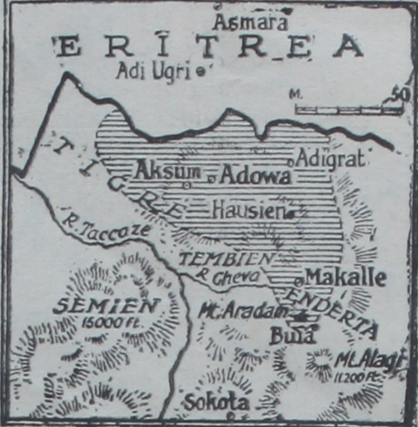
Şimal cephesindeki son harbların yapıldığı yerleri gösteren harita

Ben, buradaki merkezlerde askerlerle subayları bu kabil hareketlere