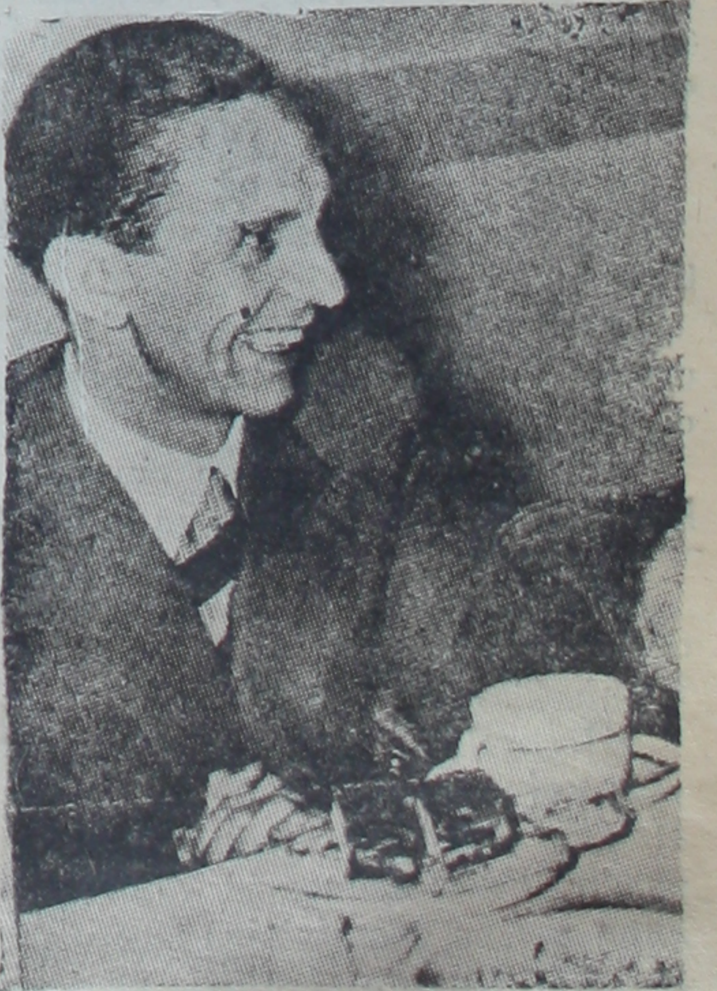
Alman propaganda bakanı B. Göbbels

Berlin, 2 (A.A.) — B. Göbbels, Laypzig panayırının açılışı dolayısıyla söylediği nutukta Versay andlaşmasını müzakere edenleri “Almanya'nın vaziyeti kötüleştiği nisbette öteki milletlerin inkişaf (Sönu 5. inci sayfa)