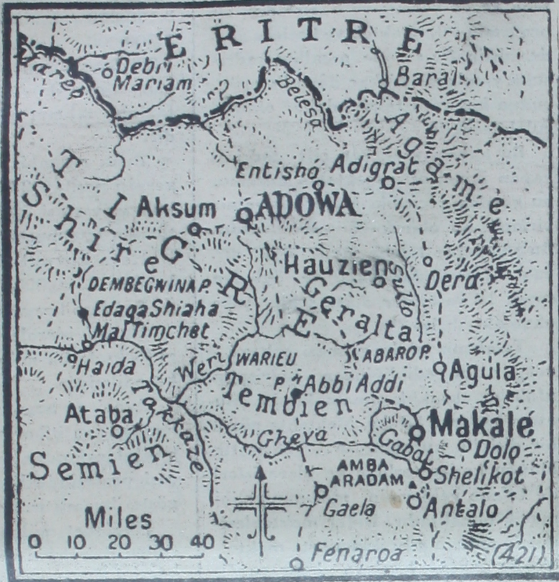
Son harbin cereyan ettiği yerleri gösterir harita.

Havas muhabiri Ras Kassa ile Mulugetta kuvvetlerinin yok edilmesinden sonra Tembien zaferine katı nazariyle bakılabileceği kanaatinde. İtalyanların ilerlemeleri şunu isbat etmiştir ki, Tembien