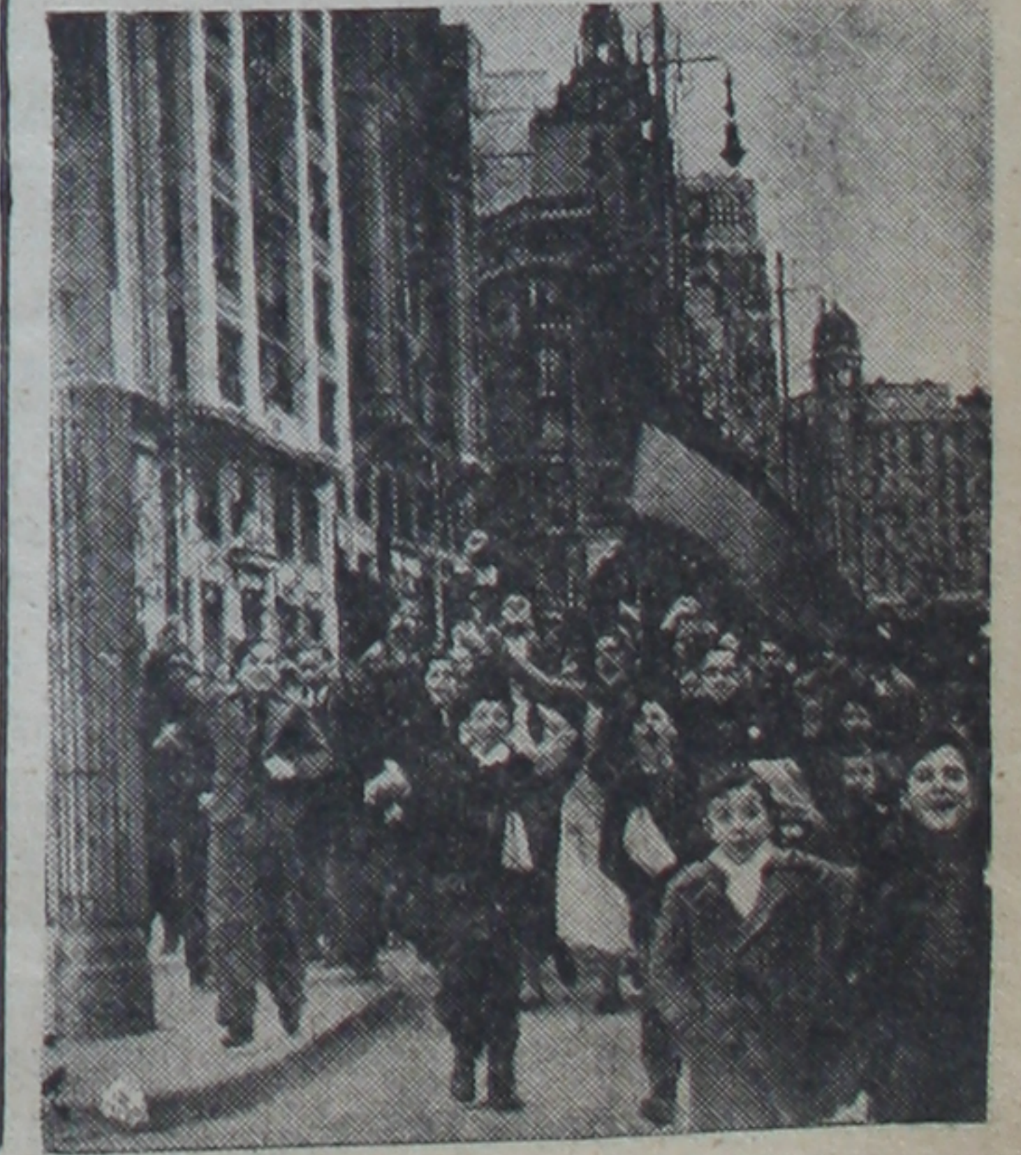
Halk cephesinin zafere dolayısıyla Madrid'de yapılan bir nümayiş