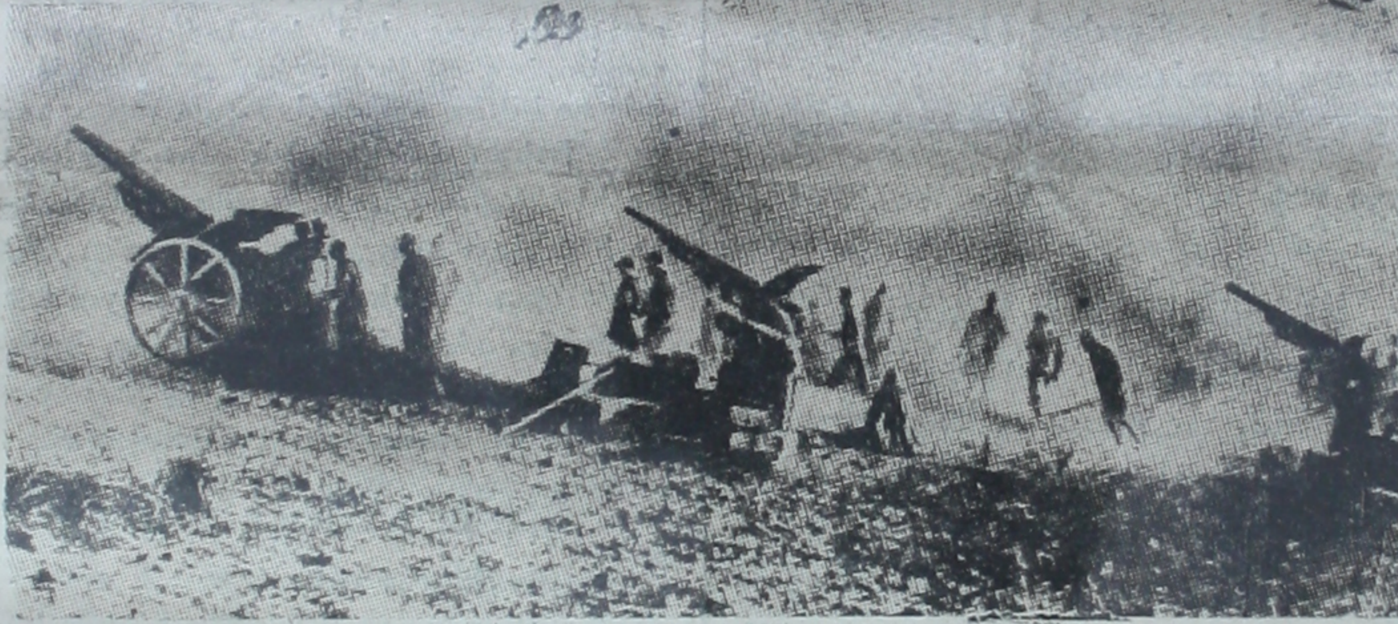
İtalyanların Amba Alagi'ye ilerleyişleri esnasında, topçular habeş kuvvetlerini bombardıman ediyorlar.

gibi munhasıran tabii istihkâmlardan müteşekkil bir toprak üzerinde dahî, geniş ölçüde herhangi