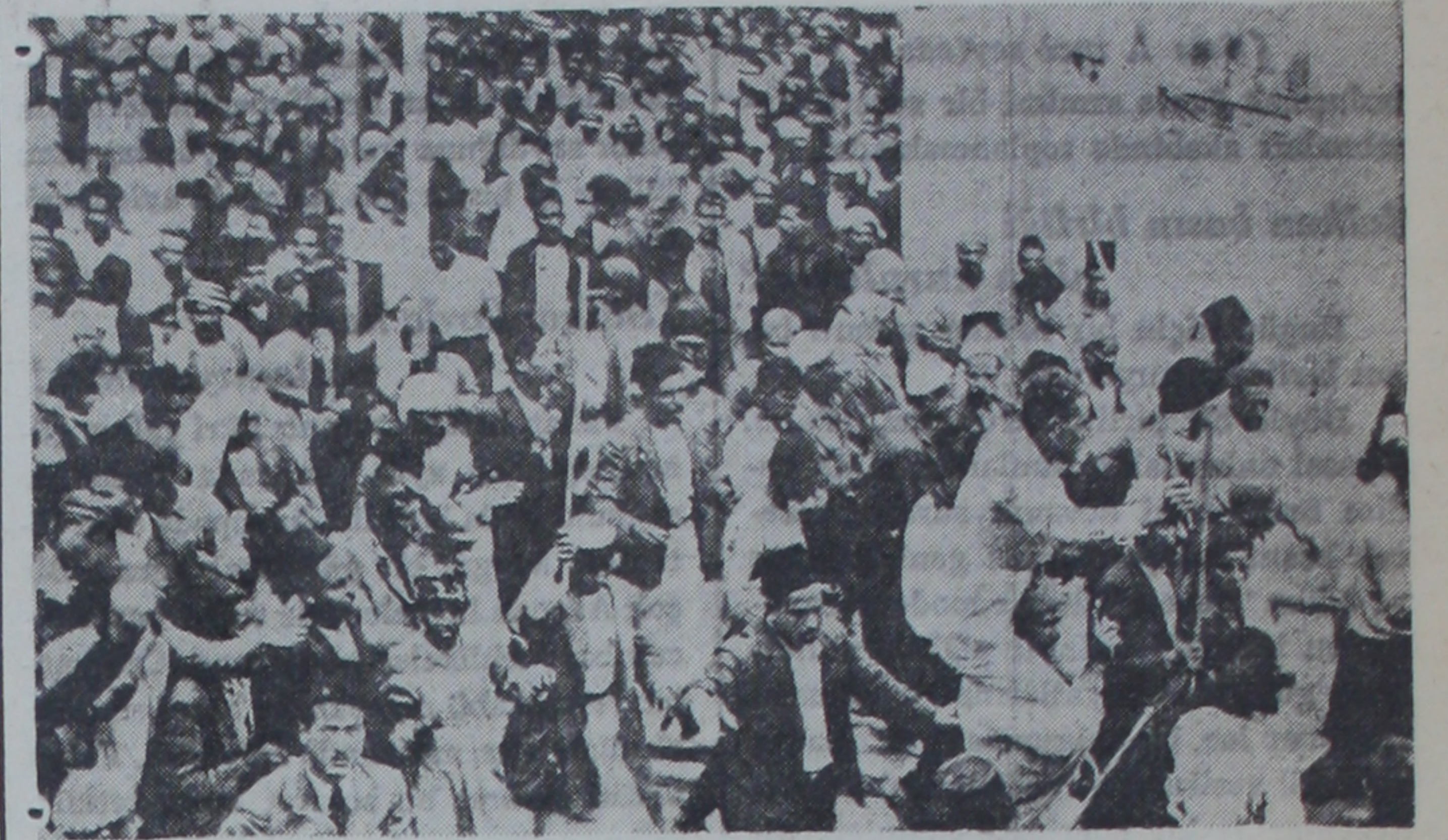
Filistinde artık hergün görülmeğe başlanan nümayişlerden biri

Kudüs, 12 (A.A.) — Vaziyette salâh hasıl olmuş değildir. Arab gefleri, anlaşmaya yanaşmamakta ısrar etmektedirler. Münferid süikaslardan sonra arablar, çete halinde taarruzlara kalkmışlardır. Ancak bu taarruzlarda muvaffakiyet elde edilememiştir. Bu taarruzlar, yahudilerin oturdukları yerleri koruyan karakollara karşı yapılmıştır. Arab çetelerinin silahları, fişekleri mükemmeldir ve askeri kuvvetlere karşı ciddi bir mukavemet göstermektedirler. Telgraf hatları, gene kesilmiştir. Şeria vadisinde binlerce ağaç tahrib edilmiştir.