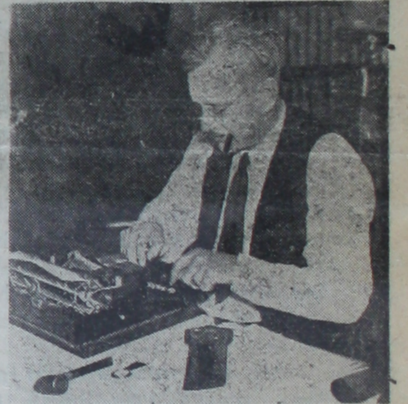
Cumhuriyetçiler partisinin Amerika cumur reisliğine namzed gösterdiği B. Landon

Kievland, 12 (A.A.) — B. Landon, cumhuriyetçiler partisi namına reiscumur namzedi tayin edilmiştir.