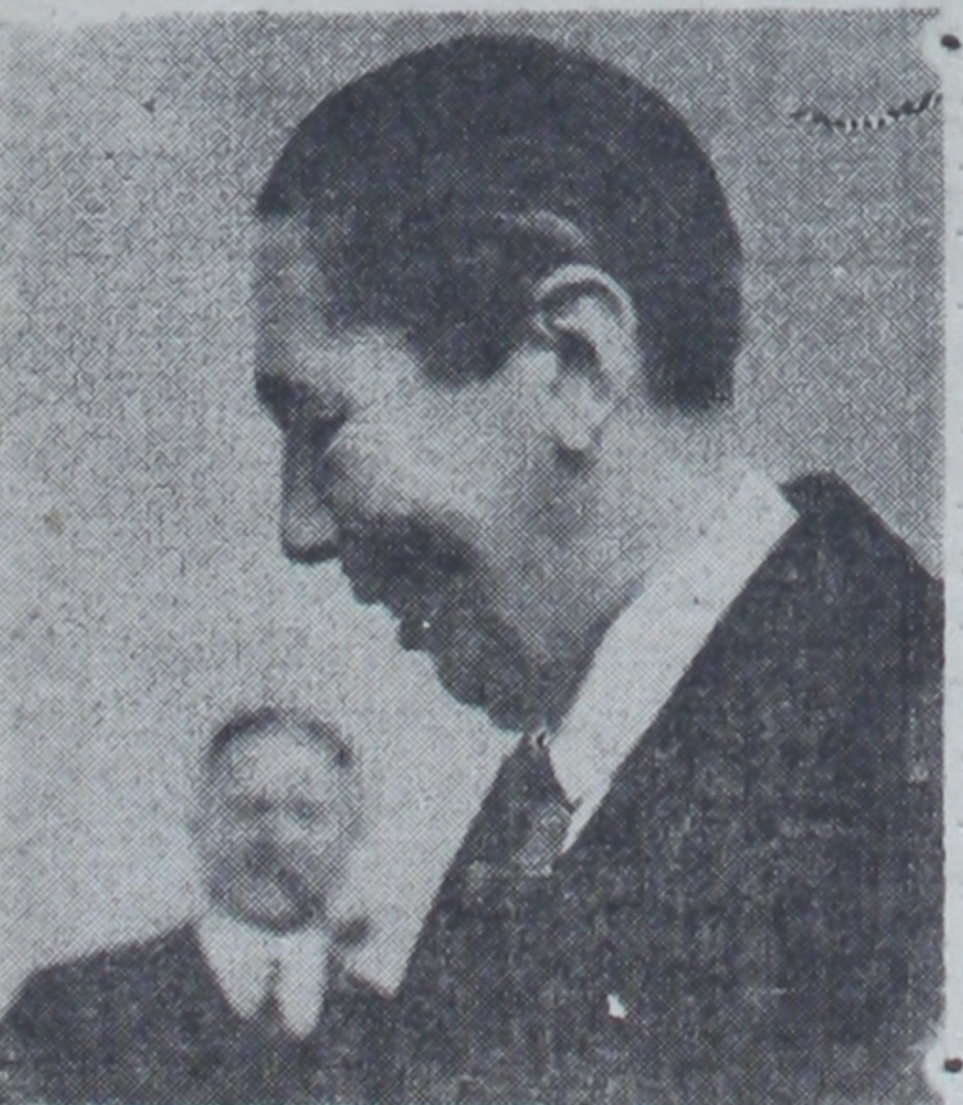
Romanya dış işleri bakanı B. Titülesko

Romanya dış işleri bakanı B. Titülesko, dış işleri bakanlığı müsteşarı B.