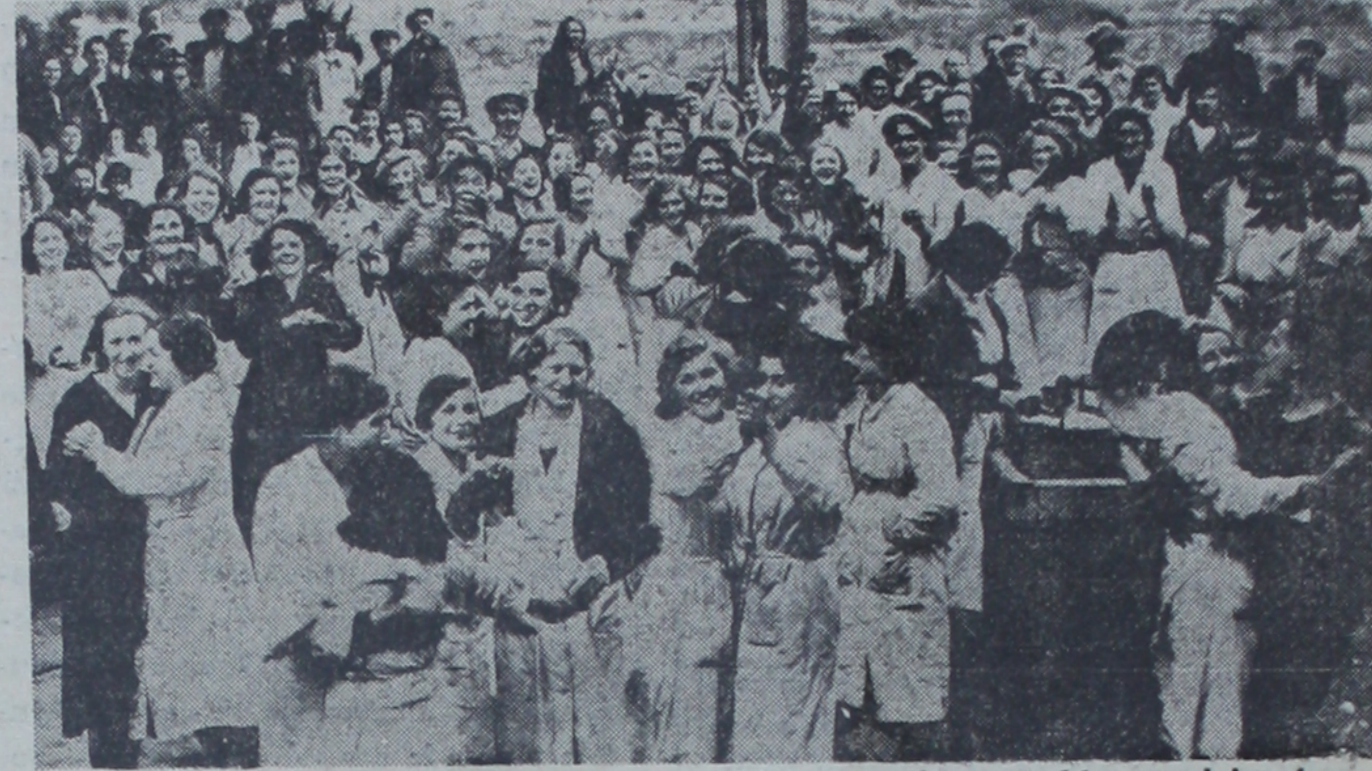
Pariste bir fabrikanın kadın işçileri, boş vakitlerini dansetmekle geçiriyorlar.

Paris, 12 (A.A.) — B. Blum, ilk defa olarak senatoya gitmiştir. Kendisinin senatonun celsesinde ve koridorlarında görünmesi büyük merak uyandırmıştır.