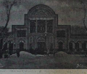
طهرانده الماس سرانی