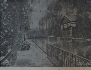
طهرانده باغچه شاهینک برکوشی