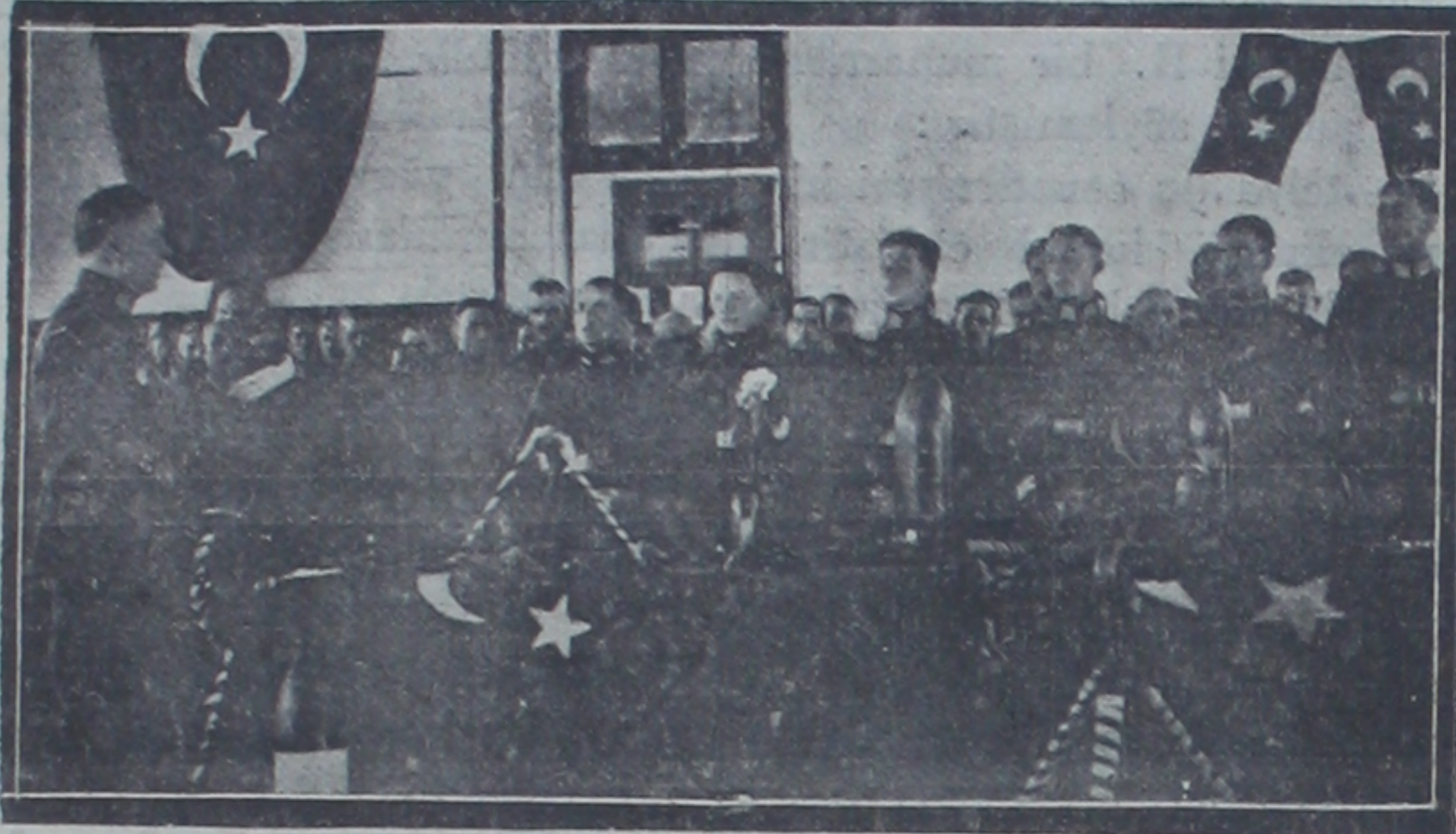
Yeni zabitlerimiz dünkü merasim esnasında

317 genç ve güzide zabitimizin dipolamaları dün tevzi edildi Harbiye mektebinde dünkü merasim