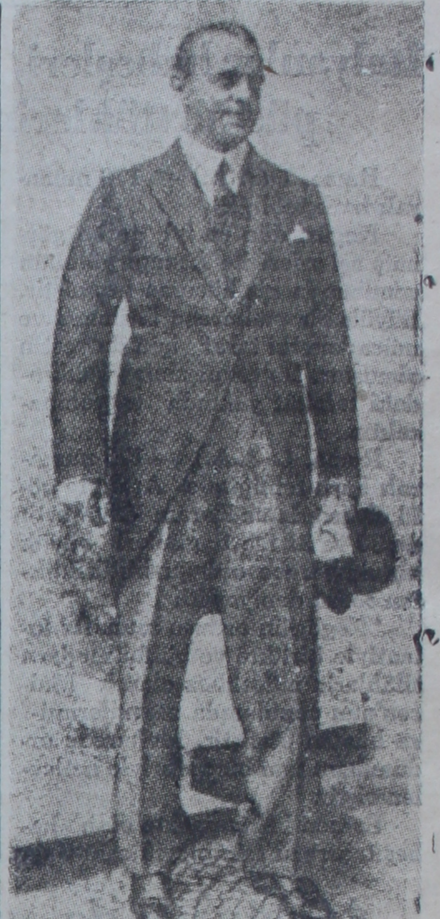
Tanrımsız İngiliz gazetecisi Ward Price

Bu nokta Sir Austen Chamberleyn tarafından avam kamarasında geçen pazaritesi günü ortaya atılmıştır.