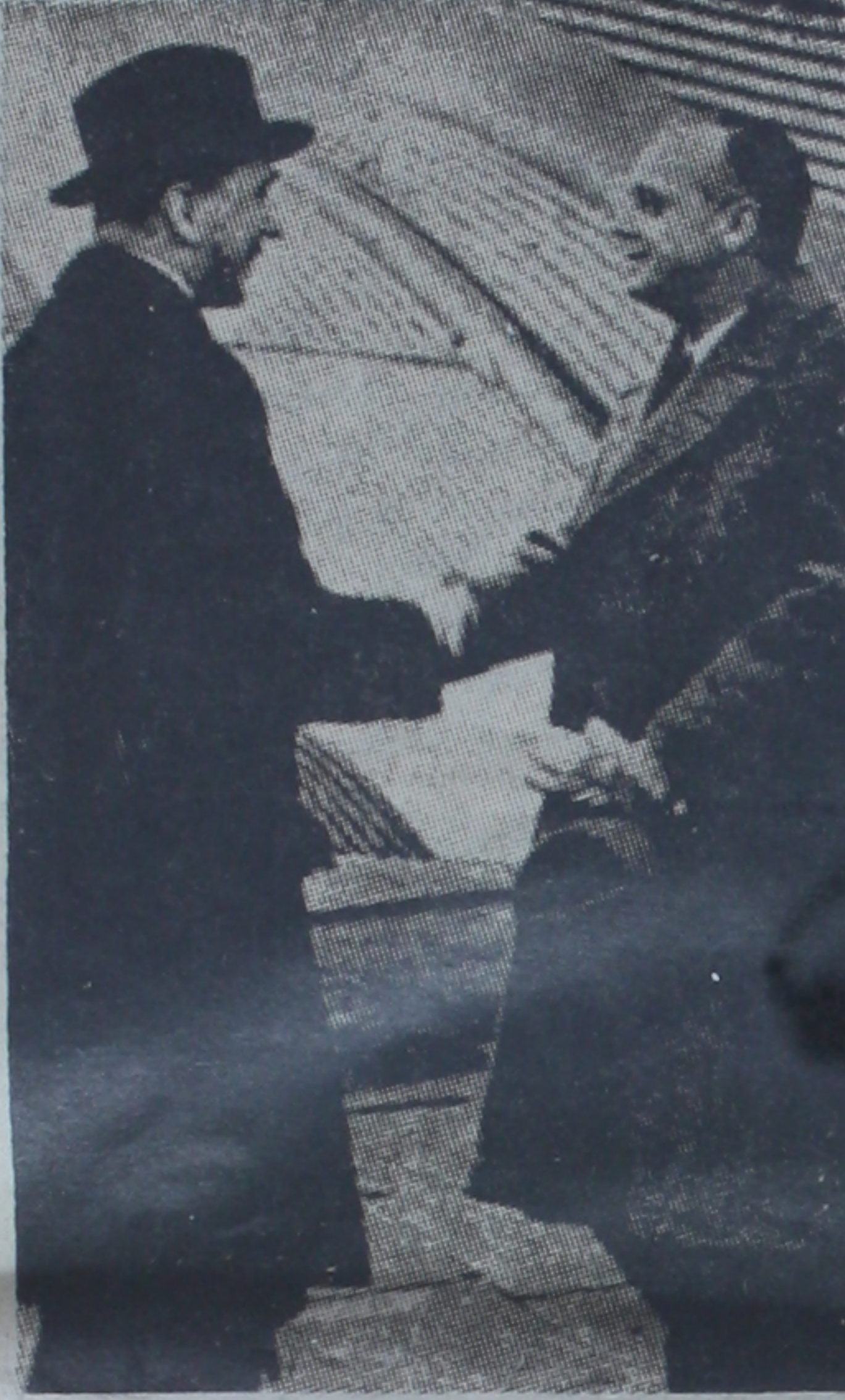
B. Fon Ribbentrop tayyare istasyonunda B. Fon Edene konuşuyor.

6. - Üçüncü maddenin tatbikine nezaret edecek komisyon İngiliz ve İtalyan ataşemillerleri vasıtasıyla askerî vaziyetteki değişiklikleri gözden geçirebilecektir.