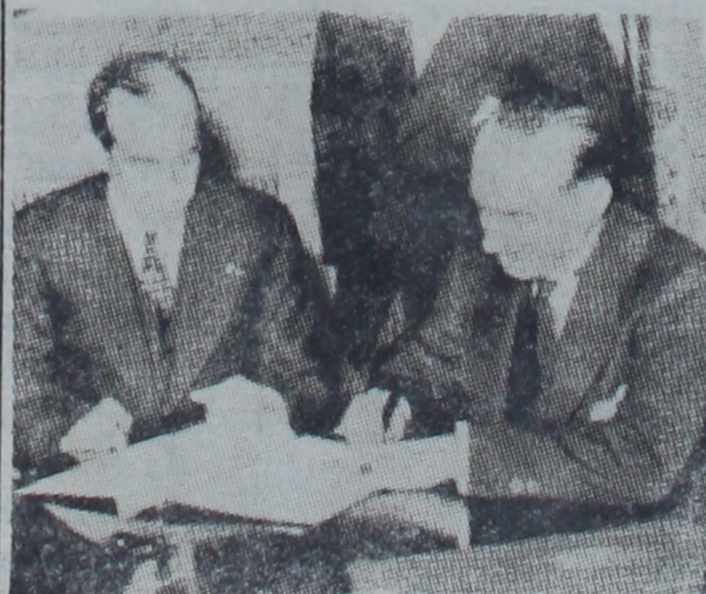
B. Van Zeeland (sağda), B. Bekle beraber

Varşova, 1 (A.A.) — Londra konferansı dolayısıyla Varşova'ya ziyareti geciktirmiş olan Belçika başbakanı Van Zeeland'ın bu ziyareti Paskalya'dan önce yapacağı haber verilmektedir.