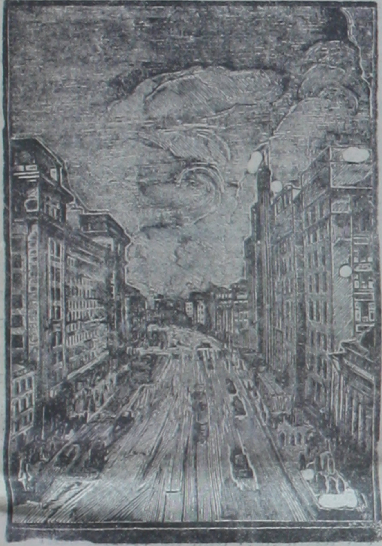
Bugünkü Moskovadan bir cadd

Verilen sözler Türk-Sovyet dostluğunun yeni gösterilerine yol açıyor