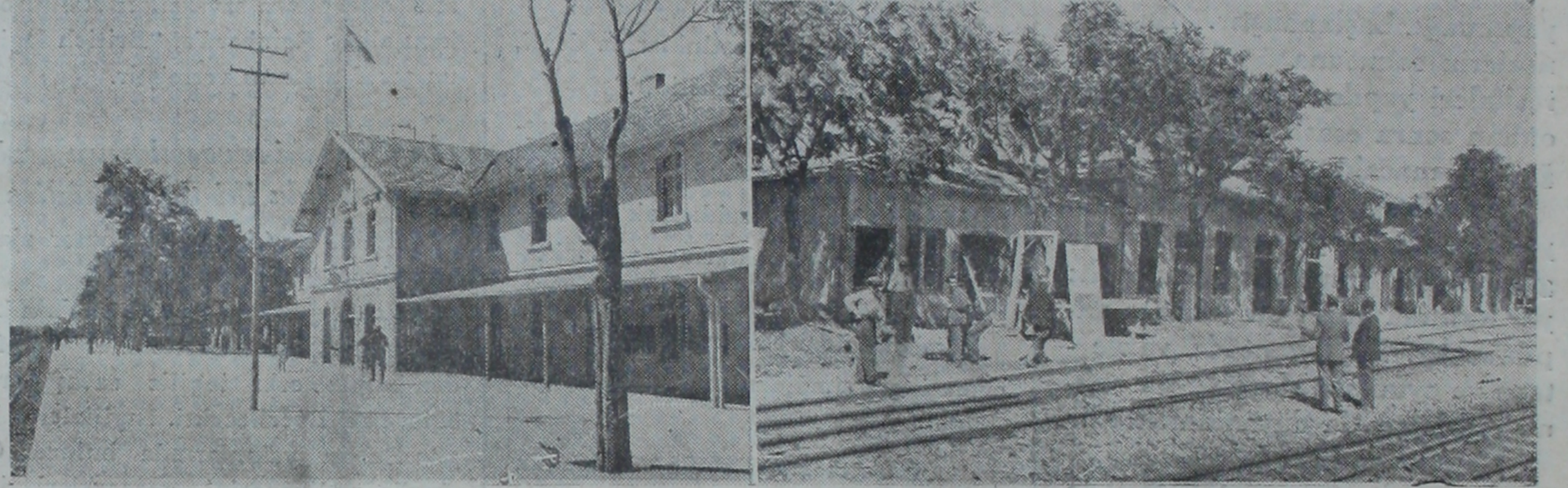
Eski gar ve iğretti olarak kullanılacak durak

Yeni durağın öntasarı, Bayındırlık Bakanlığı mimar ve mühendislerinden Bay Şekib Akalın tarafından yapılmıştır. Bu plâ-