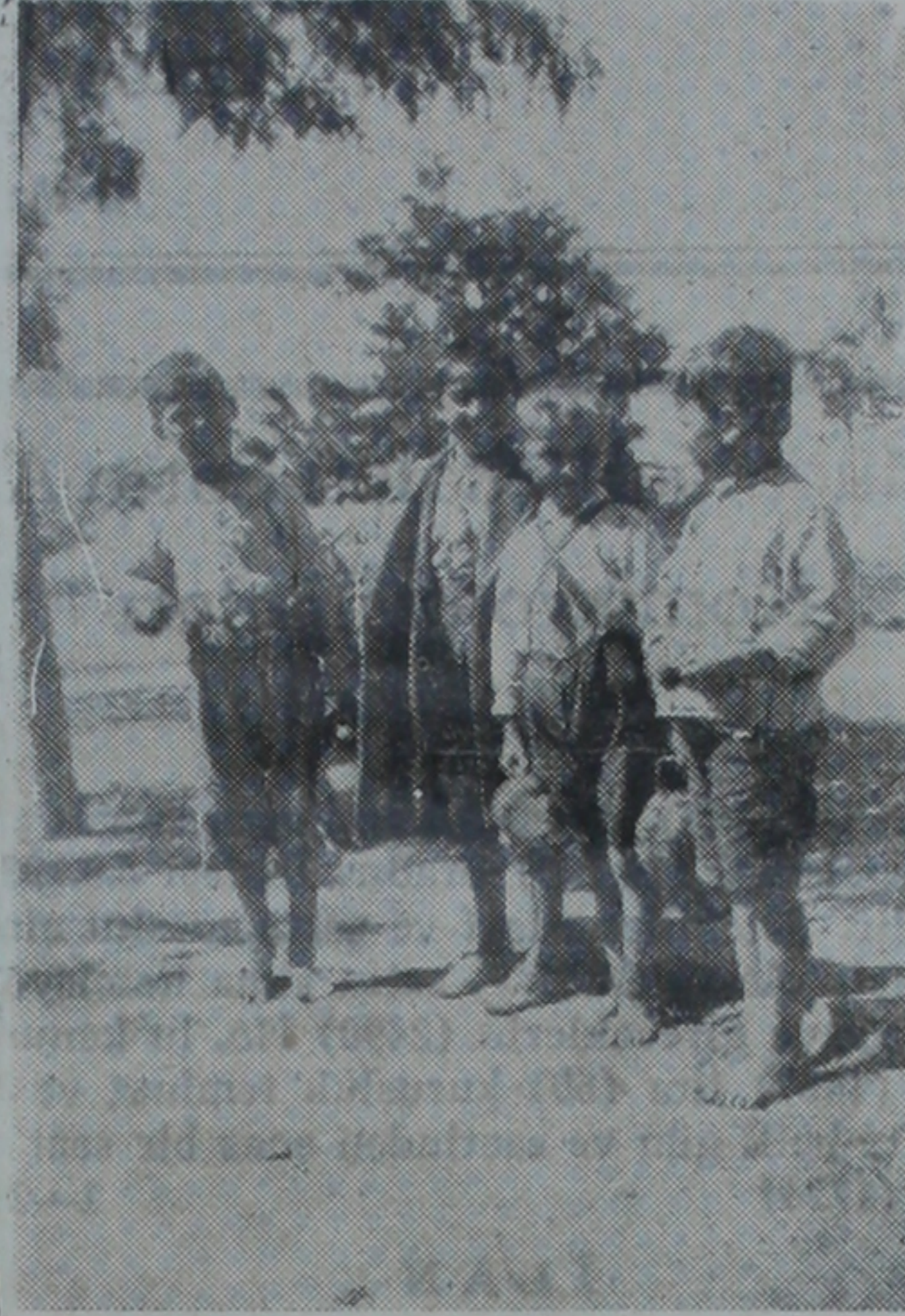
rup halinde satıcılık yapan çocuklar.

Sarı, dağınık ve kirli saçları, mavi gözleri ve açık göğsü onun bir yoksun çocuğu olduğunu gösteriyordu. Yalın ayak ve ayak başparmakları yaralıydı. Adını sorar sormaz büyük bir alışkan-