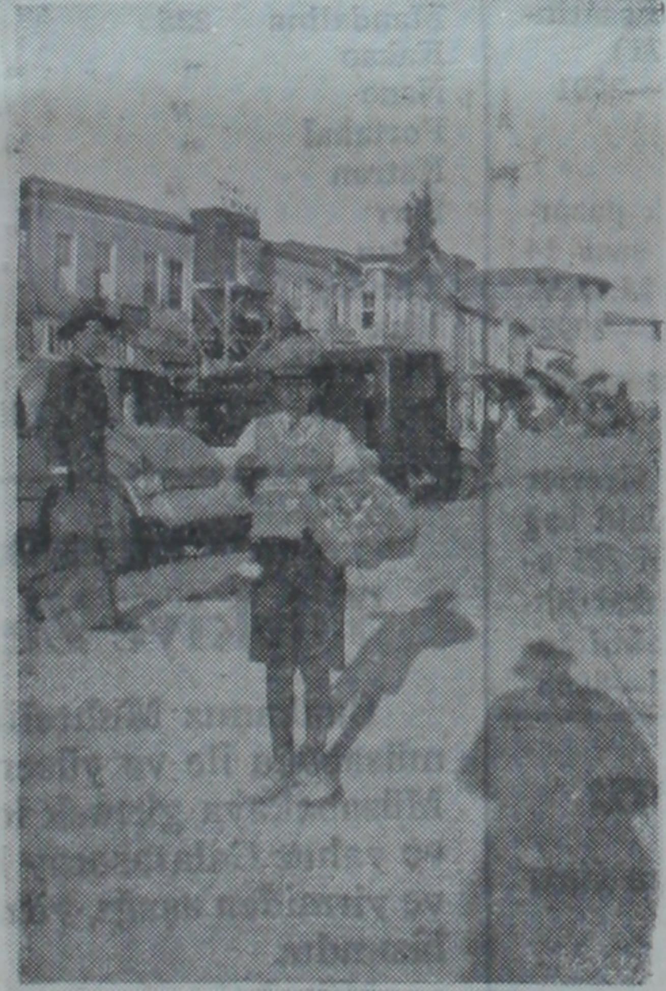
Günde 25 — 40 kuruş Kazanan 13 yaşında İzzet

Bunlar Ankaranın en bakımsız yerlerinde, Bendderesi ve dağ uramı gibi yerlerde birer küçük odaya sığınmış olarak yaşamaktadırlar. Bu 26 çocuktan üçü kendi evlerinde, 17 si kira ile bir