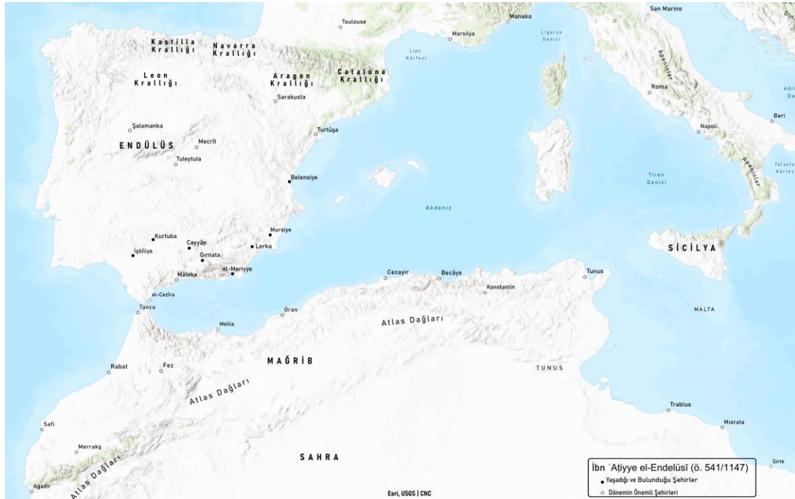
Harita 2: Endülüs ve Çevresini Gösterir Harita 216

Günümüzde İspanya ve Portekiz'in bulunduğu İber yarımadası tarihte müslümanlarca Endülüs olarak isimlendirilmekte idi. İber yarımadası Avrupa kıtasının güney batısında yer almaktadır. Kuzeyde bulunan Pirene Dağları Endülüs'ü, Fransa'nın güneyinden ayırır. Genişliği doğudan batıya uzanan Cebelitarık Boğazı Endülüs'ün güneyde Avrupa kıtasıyla olan sınırını Afrika'dan ayırmaktadır. İber yarımadasında çok verimli topraklar ve nehirler vardır. Bunun yanında çok sayıda dağlık bölge ve yüksek kayalıklarla dolu alanları da mevcuttur.