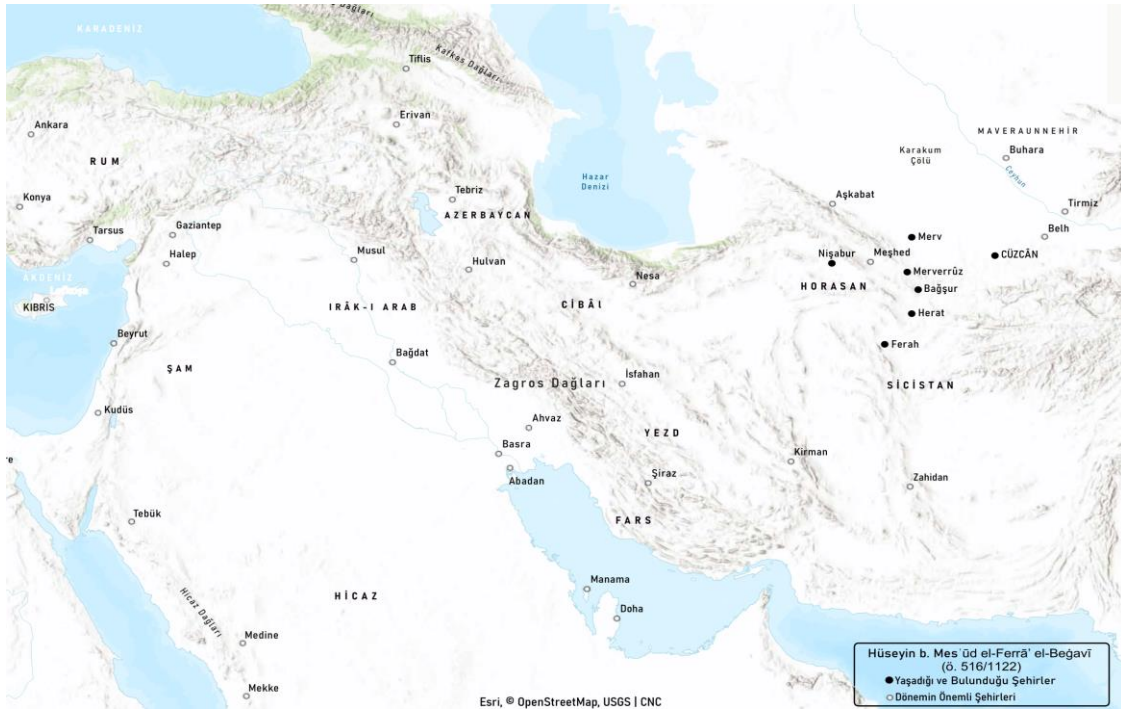
Harita 1: Horasan Bölgesi ve Çevresini Gösterir Harita 45

Beğavî'nin doğduğu ve yaşadığı bölge olan Horasan, 42 bugünkü İran'ın kuzey doğusunda yer alan coğrafi bir bölgeyi ifade etmektedir. Bu bölgenin doğusunda Hindistan ve Sicistan (Sîstan); batısında Gaziyye Çölü ve Cürcân bölgesi, kuzeyinde Mâverâünnehir; güneyinde ise Fars ve Kûmis çölü ile Deylem dağlarına kadar Cürcân, Taberistân ve Rey bulunmaktadır. 43 Günümüzde Merv, Nesa ve Serahs yöresi Türkmenistan, Belh ve Herat yöresi Afganistan, diğer bölümü ise İran sınırları içerisinde yer almaktadır. Genel olarak Horasan kavramı ile İslâm coğrafyasının doğusu kastedilmektedir. 44